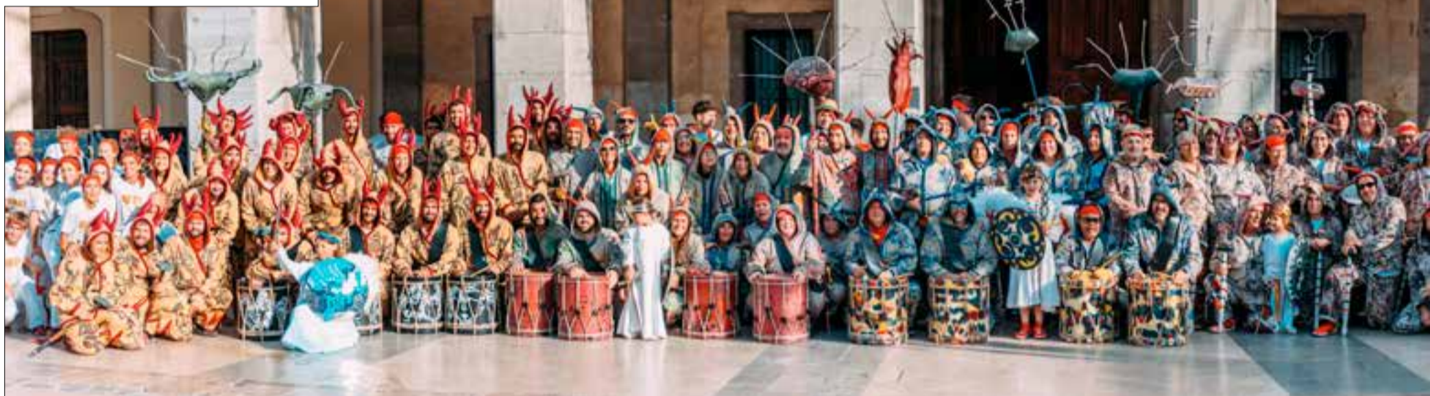
Foto de grup amb diferents membres del Ball de Diablers de Vilanova i la Geltrú dels últims 50 anys

E nguany per la festa major de Vilanova se celebraran nombroses efemèrides: Bordegassos, Falcons, Ball d'en Serrallonga, Cercolets, Diablers, Mulassa, Drac Barrina, Diablers Petits, Gegants... En aquest Tema de la Setmana ens hem fixat en un d'ells: el Ball de Diablers, que el dia 5 d'agost farà 75 anys que es va recuperar.