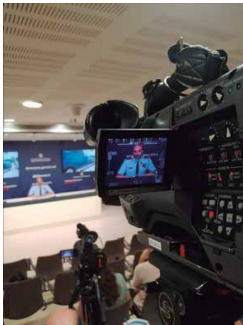
Els Mossos disposen d'un grup específic per fer l'acompanyament de les víctimes durant tot el procés. ✳ MOSSOS D'ESQUADRA

Seguint el procediment, es van fer deu entrevistes de recerca d'indicadors de tràfic d'éssers humans, tot i que només es va identificar formalment una víctima. Des de Mossos asseguren que això es deu al fet que quan parlen amb les possibles víctimes aquestes "tenen dificultats per obrir-se i explicar el seu relat vital, que és essencial per iniciar l'estatus de víctima". Els agents afegeixen que "són persones amb una alta vulnerabilitat i un elevat estat de necessitat, al