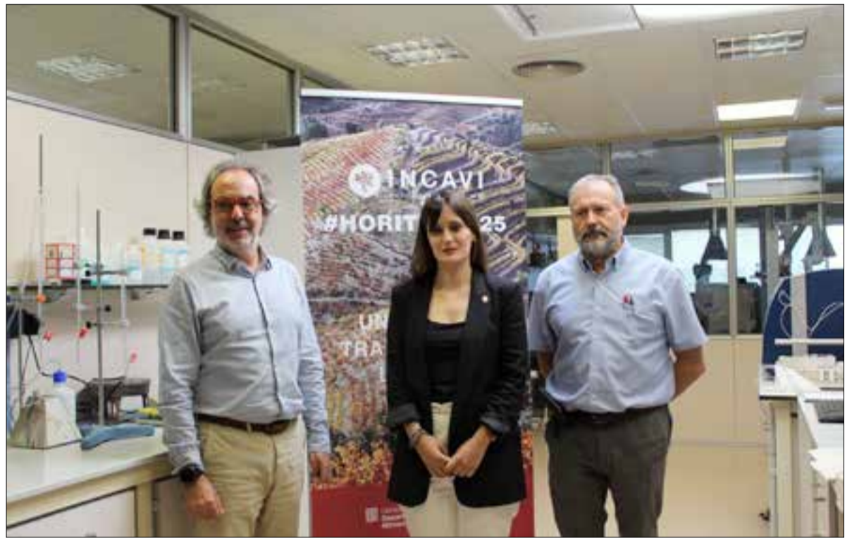
El Pla Estratègic de l'INCAVI ha marcat 23 projectes clau per al 2025. ✱ LA FURA