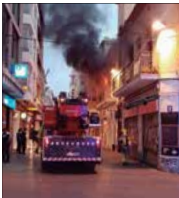
L'incendi es va originar amb una guspira del correfoc.