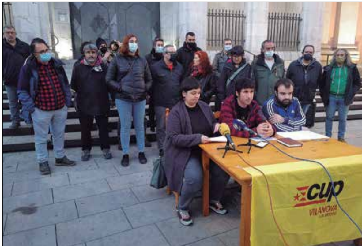
La militància de la formació anticapitalista va prendre la decisió en una assemblea celebrada diumenge. ✱ CUP

La formació anticapitalista ha recuperat aquesta setmana la representació al ple municipal