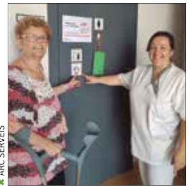
✱ ARC SERVEIS