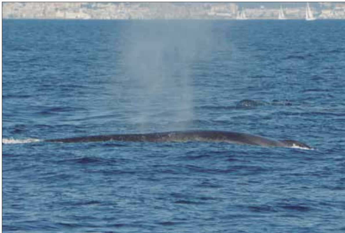
Les pluges de març van afavorir la producció de plàncton, l'aliment del rorqual.