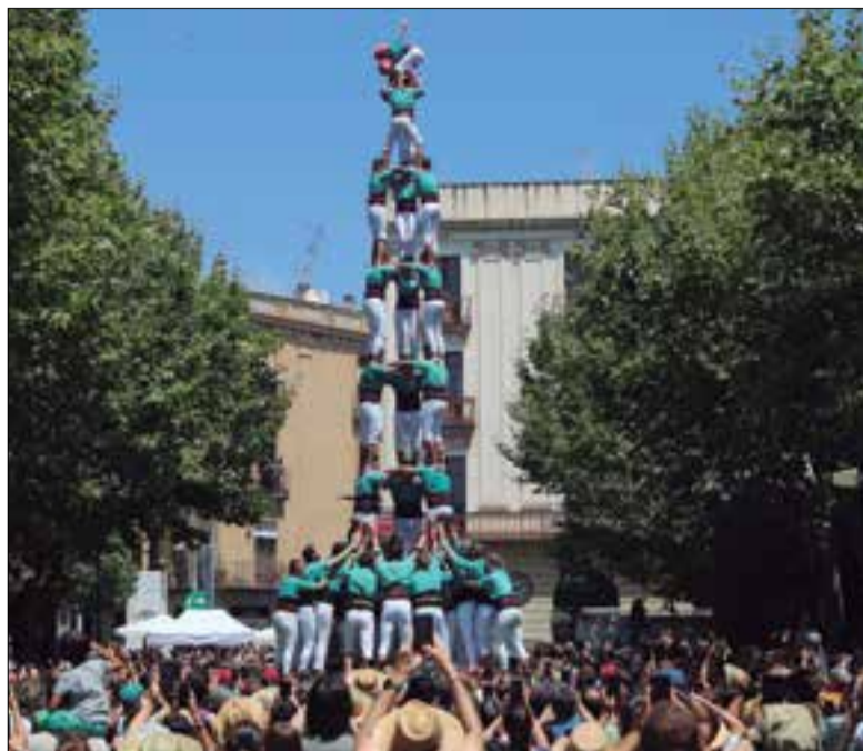
3 de 9 amb folre dels Castellers de Vilafranca diumenge a Mataró.