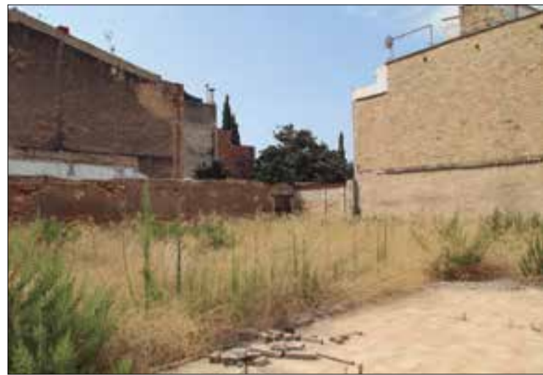
Estat actual del solar. ✖ AJUNTAMENT