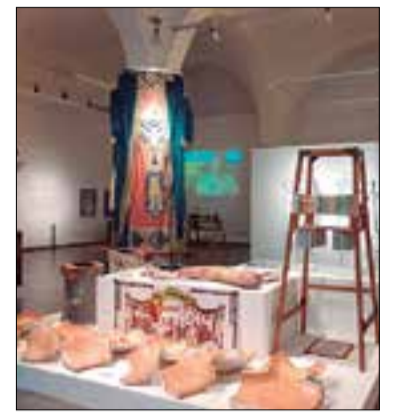
La sala de les voltes acull l'exposició dedicada a La Festa Major.