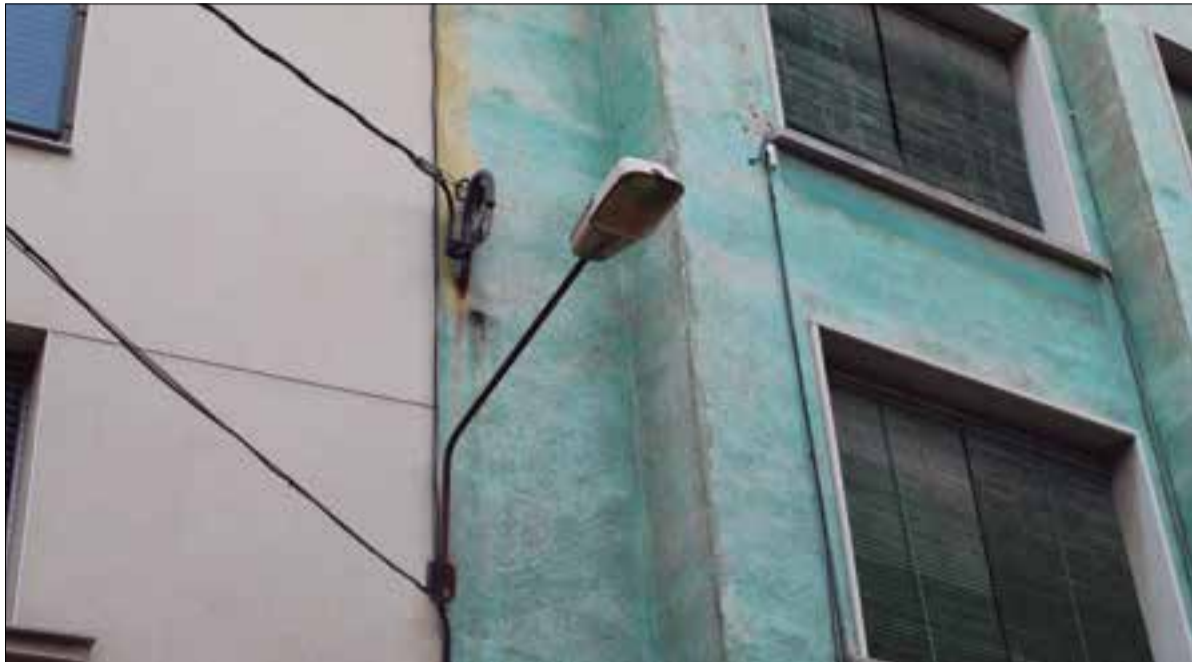
Els llums antics, com els del carrer Parlament, es substituiran pel LED ben aviat. ✖ LA FURA