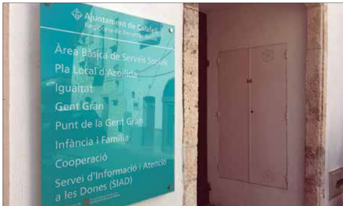
L'informe constata els efectes de la pandèmia, que han evidenciat algunes debilitats ja existents. ✱ AJUNTAMENT

El SIAD de Calafell ha recollit un notable increment de la violència masclista en tots els àmbits, i més actuacions