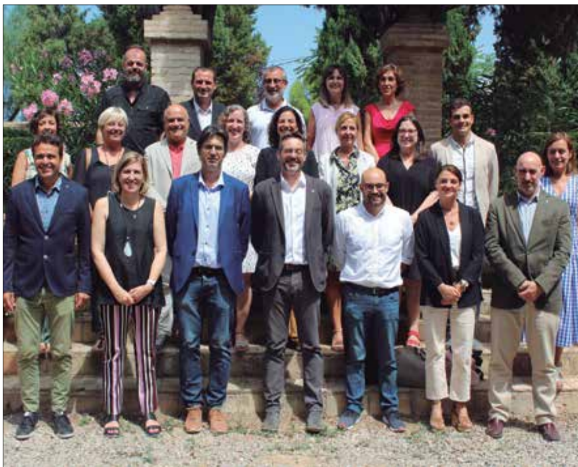
La Delegació del Govern al Penedès assegura que els objectius que es van proposar ara fa un any "s'han aconseguit", com el compliment del calendari previst per al desplegament dels serveis territorials. ✱ LA FURA