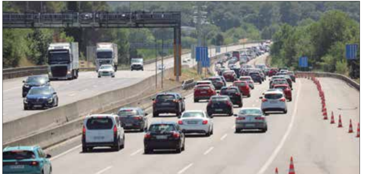
Cues importants a l'AP7.

Aquest nou vial d'entrada a la capital permetrà als residents del Penedès reduir el trajecte més de 15 minuts