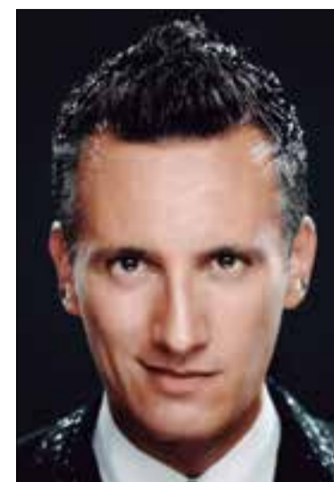
El Mag Lari actuarà el diumenge que ve.

Amb aquest espectacle, el Mag Lari recull alguns dels millors trucs i representacions dels seus 30 anys de carrera i 25 anys de funcions arreu del món: "la meua vida és una gira constant i, en el fons, el que més m'agrada és estar sobre els escenaris, com més diversos millor, coneixent gent i llocs diferents, fent el que em va millor: il·lusionar i fer riure el públic", explica el Mag Lari.