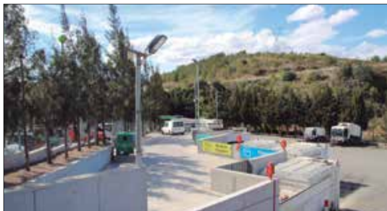
Deixalleria de la Bisbal del Penedès. ✦ CCBP

El Ple del Consell Comarcal del Baix Penedès va aprovar la setmana passada, per majoria absoluta i en un Ple extraordinari i urgent, l'estructura inicial de costos del contracte del servei de recollida selectiva de diverses fraccions, el transport de residus sòlids municipals i la gestió de deixalleries d'alguns ajuntaments de la comarca. Aquest és el primer pas per poder licitar el projecte a partir del mes de setembre. Així, el pro-