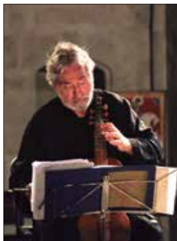
MAR ROVIRA - ACN

En total, el festival compta amb un cicle de catorze concerts de diferents conjunts musicals sota la direcció de Jordi Savall. Aquests conjunts són Hespèrion XXI, La Capella Reial de Catalunya, Le Concert des Nations i Orpheus 21.