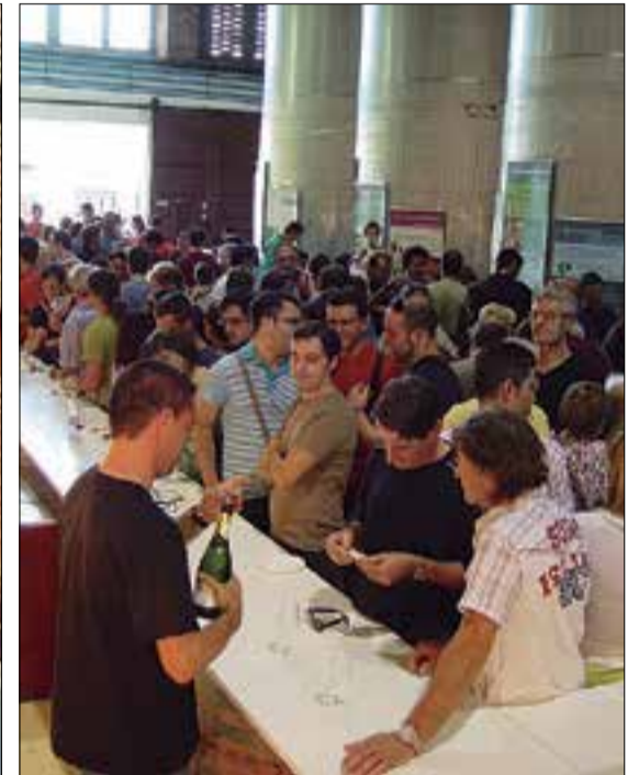
Mostra de Vins i Caves de la festa major d'edicions anteriors. ✦ DYONISOS