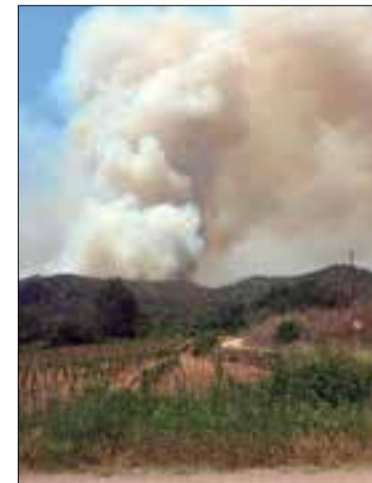
Incendi a Olivella. ✦ AGENTS RURALS

L'Ajuntament d'Olivella té previst personar-se com a acusació particular a la causa penal oberta contra dos presumptes piròmans investigats per la seva relació amb dos incendis al Massís del Garraf, un dels quals amb afectació directa al municipi. El consistori vol reclamar els danys i perjudicis pertinents, com la suspensió del festival Fell Chill Experience, que s'havia de celebrar el 18 i 19 de juny, o dels recursos materials emprats en l'extinció del foc.