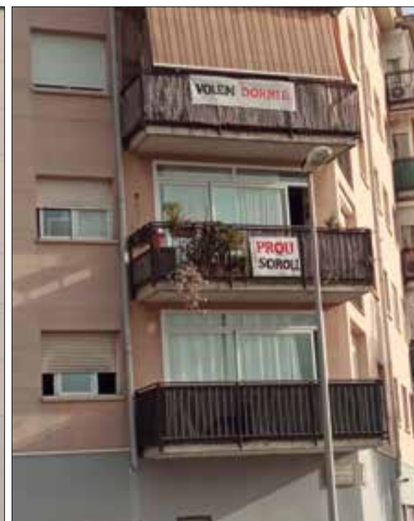
Els veïns d'un dels edificis del capdamunt de la Girada han penjat pancartes als balcons per denunciar els sorolls.

i @LaGiradaBronx. L'Associació de Veïns dona suport en tot moment les iniciatives del veïnat.