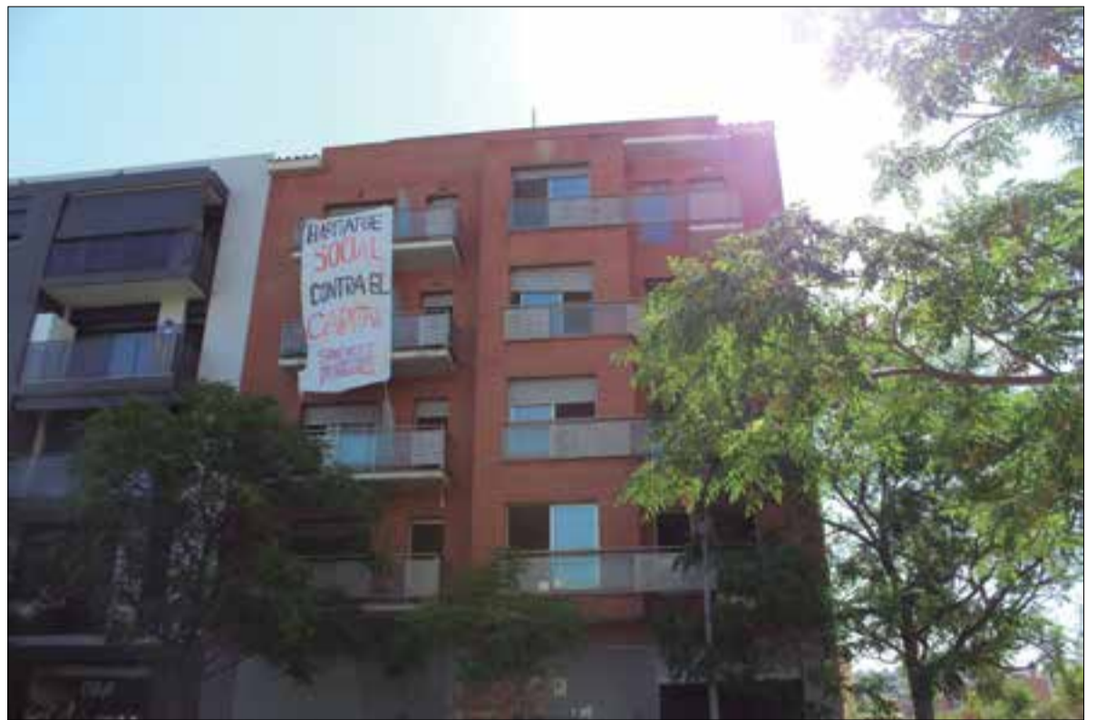
L'immoble es trobava tapiat i abandonat i no disposa ni de llum ni d'aigua, de moment s'està habilitant. ✦ LA FURA