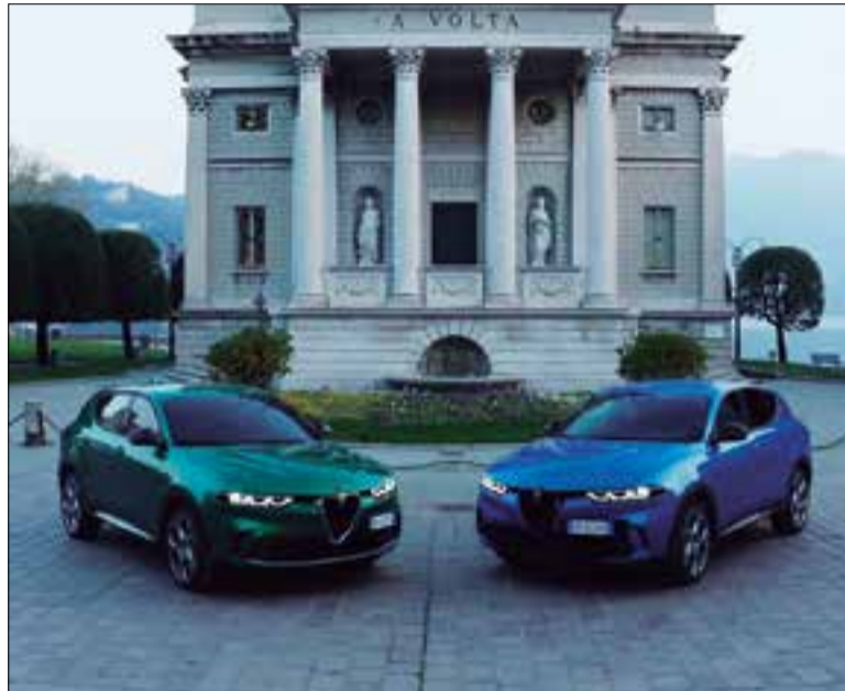
Els Tonale es podran provar del 14 al 16 de juliol a Vilafranca. * AUTOCAM

Quant als motors, l'oferta arrenca amb dos microhíbrids que prenen