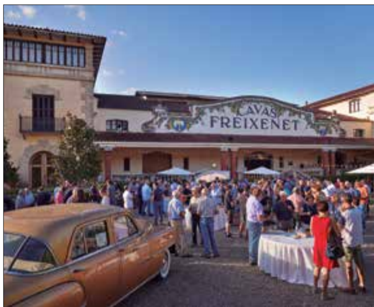
Més de 300 viticultors van assistir a la reunió anual. ✱ FREIXENET

Durant la trobada, els directius de la multinacional van exposar el seu punt de vista sobre l'actual situació del mercat del cava i la seva recuperació, així com la necessitat de cooperar entre tots els agents per garantir un major crei-