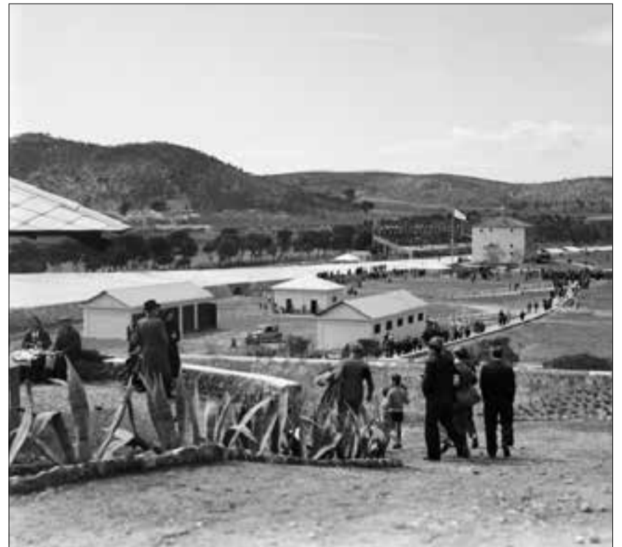
A l'esquerra, l'estat actual de l'interior de l'anell de l'autòdrom de Terramar. A la dreta, l'autòdrom el dia de la seva inauguració, amb la recta de sortida i la graderia principal al fons.

Aquests esdeveniments es realitzaran en format de competicions entre els mesos d'octubre i abril. És a dir, quan les instal·lacions del nord d'Europa tanquen per raons climatològiques, l'Autòdrom de Terramar acollirà competicions de genets que arribaran de diferents punts del continent. Uns programes internacionals que, segons l'empresa promotora, s'iniciaran entre finals del 2023 i principis del 2024. Els participants, a més, es podran allotjar en una zona hotelera que comptarà amb 150 places i que ocuparà unes 2,2 hectàrees –l'equivalent a cinc camps de futbol.