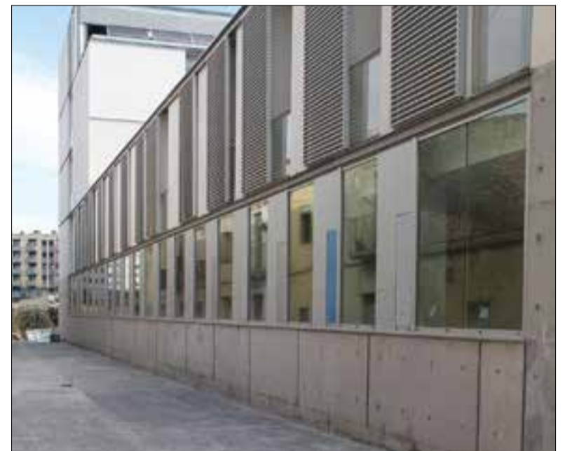
L'edifici descongestionarà les instal·lacions de l'hospital.

L'Ajuntament cedirà al Parc Sanitari de Sant Joan de Déu una parcel·la al costat de l'hospital de Sant Antoni