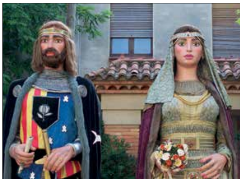
Gegants de la Granada.