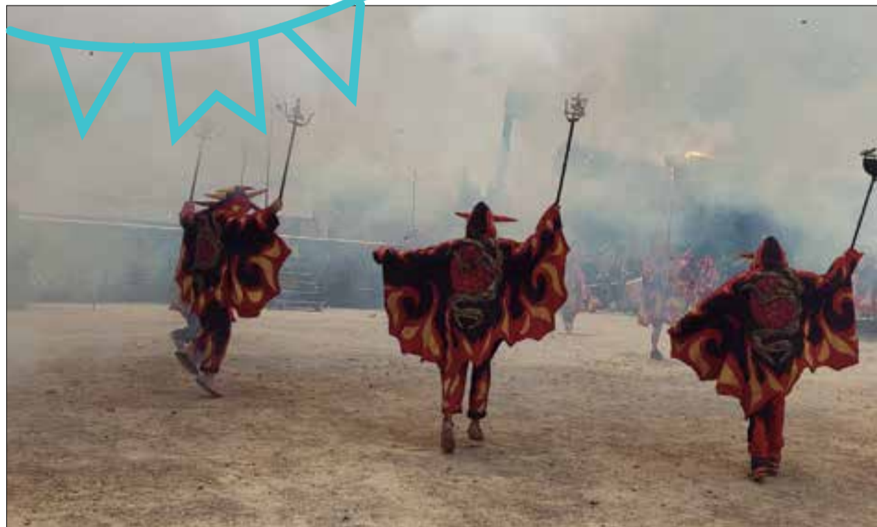
Els Diablers de la Granada, a l'exhibició de balls populars.

Si la festa major de la Granada és coneguda fora del poble per algun motiu especial és per la pujada del ruc al campanar de l'església. Serà divendres al vespre, en un espectacle de llums, foc i color. Dilluns, dia especial de la mainada, es farà la baixada del ruc petit.