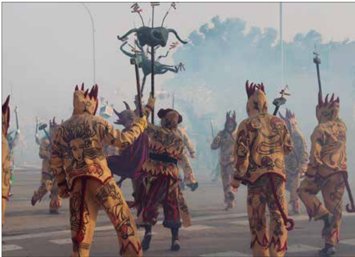
Els Diables commemoren el 75è aniversari de la seva recuperació.