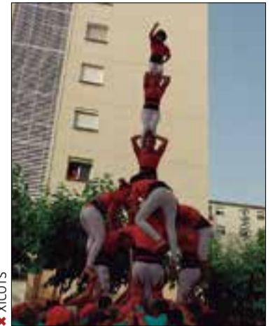
Xicots de Vilafranca: i4/7a, 3/7, 4/7, 2P/4 Cast. Sant Pere i Sant Pau: 5/7, 4/7a, 3/7a, P/5 Castellers de Badalona: 4/6, 4/6a, 3/6, P/4

Els Xicots de Vilafranca es van quedar a una dècima de segon de carregar el 4 de 7 amb agulla dissabte a la tarda a la diada de Sant Pere, que va tenir lloc a Tarragona. Tan sols faltava que els segons es deixessin anar de braços quan el pilar de 5 central va fer llenya; sí que van fer els dos castells de set bàsics, que repetirien l'endemà a la diada d'estiu de la Jove de Barcelona, a la plaça del Rei.