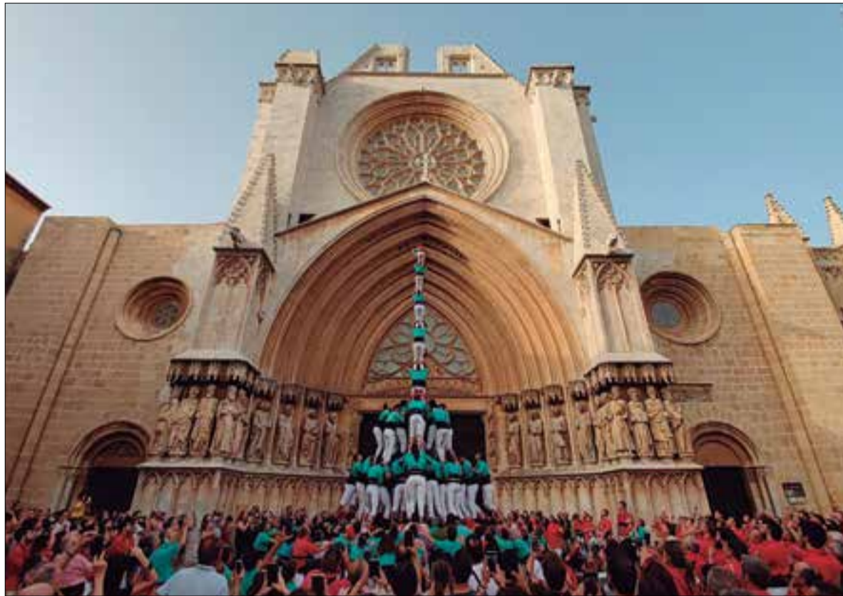
Primer gamma extra des de finals de 2019, dissabte al Pla de la Seu de Tarragona.