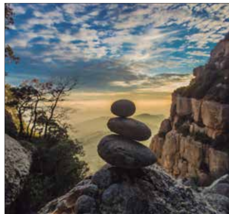
L'equilibri Serra del Montsant - 2021