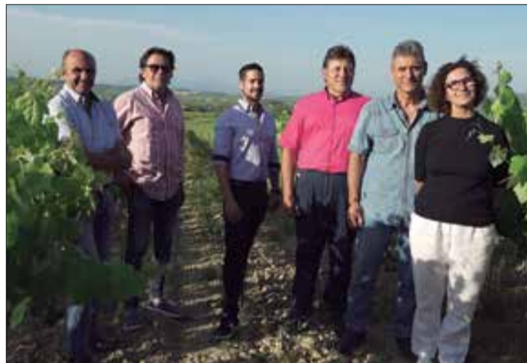
Tres candidats titulars i tres suplents de la candidatura Viticultors del Cava.

Les eleccions van ser dimecres. Viticultors del Cava va aconseguir 712 vots, que li donen dues vocalies, mentre que la candidatura conjunta d'Almendralejo i Requena en va obtenir 383, amb els quals per primer cop en quatre dècades d'història de la DO, trenquen el monopoli català. El cava, doncs, serà més espanyol, i les reunions del Consell Regulador seran en endavant en castellà. Caldrà veure quina influència té la nova vocalia, que es repartiran a parts iguals