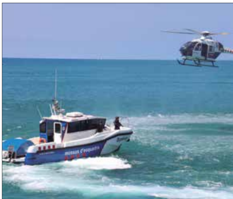
Exercici de demostració al port de Vilanova i la Geltrú.