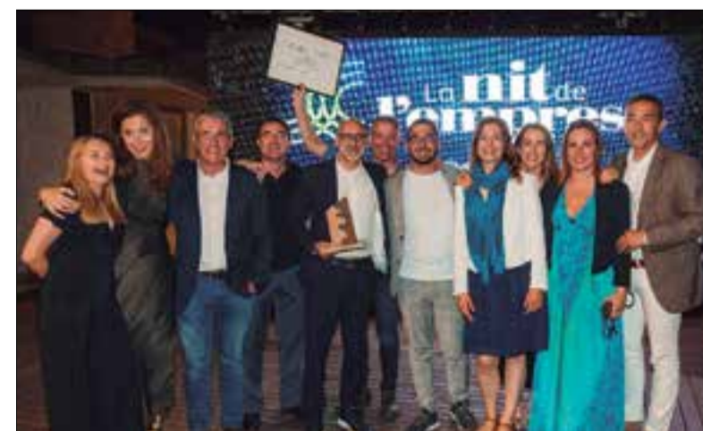
El personal d'Ondunova, recollint el premi.