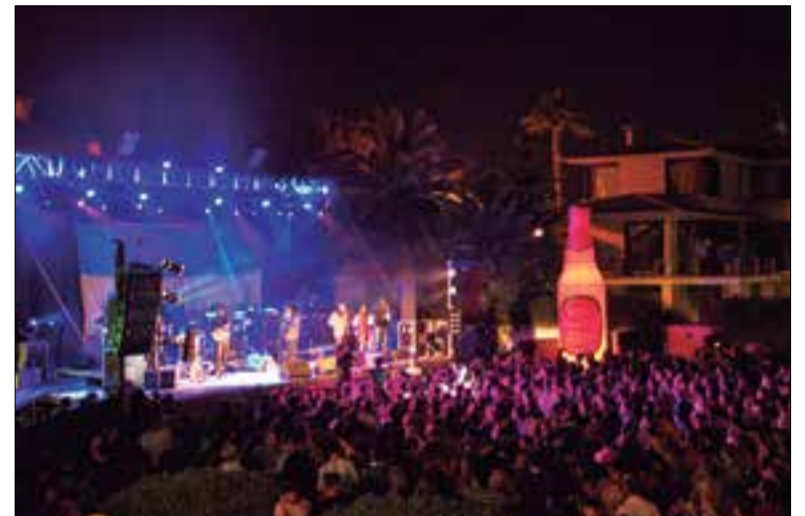
Nowa Reggae 2017. ✦ ARXIU NOWA REGGAE

El 15 i 16 de juliol tindrà lloc una nova edició del festival Nowa Reggae al Parc de Ribes Roges de Vilanova i la Geltrú. Seran dos dies de concerts en directe i actuacions amb sound system amb un cartell que compta amb més de vint actuacions.