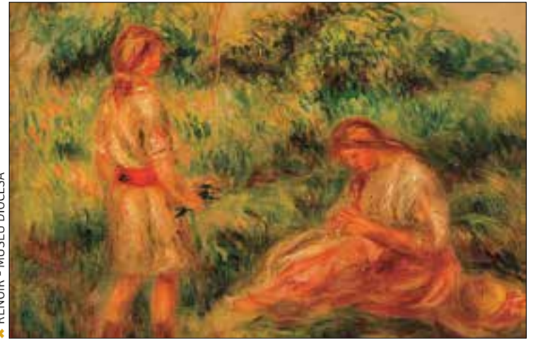
✦ RENOIR - MUSEU DIOCESÀ

El Museu Diocesà de Barcelona acull, fins al 25 de setembre, una exposició dedicada a les dones de finals del segle XIX que consisteix en una selecció de 44 pintures i escultures d'artistes de renom. Així, les persones interessades trobaran a la mostra "Dones. Entre Renoir i Sorolla" un recull de peces d'artistes com