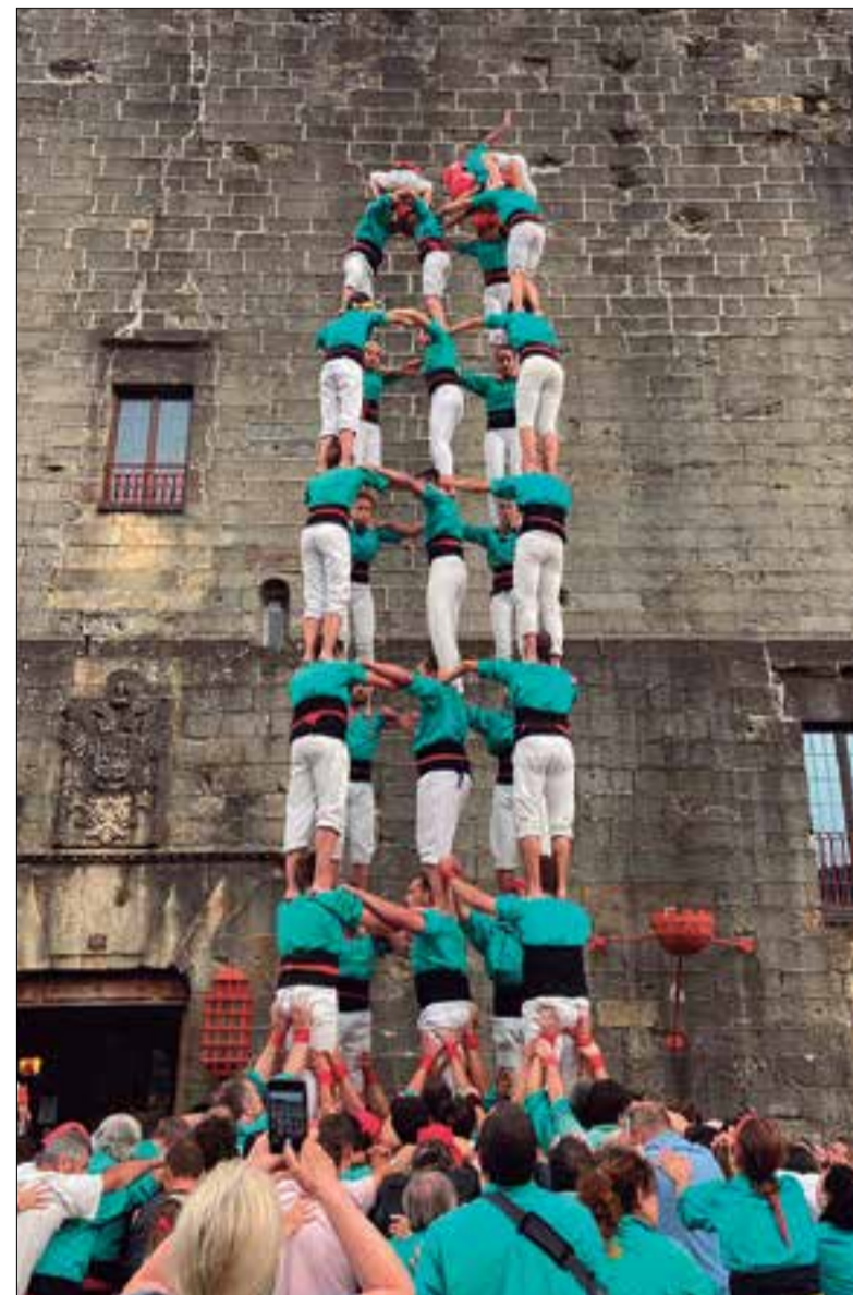
5 de 8 dels verds a Hondarribia. ✖ CASTELLERS DE VILAFRANCA

El bagatge total al País Basc ha deixat, doncs, onze castells de vuit, entre els quals un 5 de 8 i tres torres de 8 amb folre.