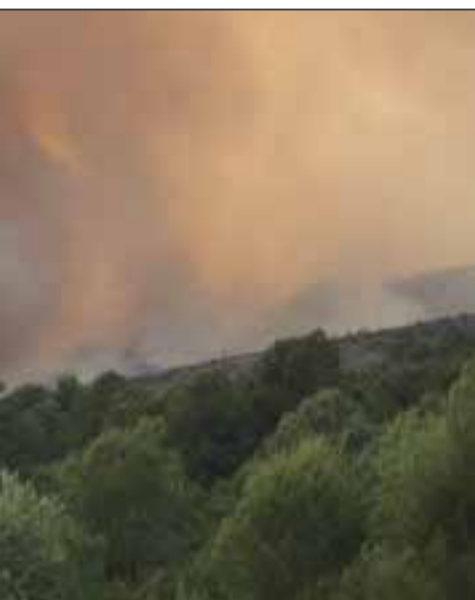
✦ FEDERACIÓ D'ADF PENEDÈS GARRAF

A la vegueria del Penedès, els vigilants segueixen una sèrie de rutes amb què pentinen cada dia tota la superfície de bosc de l'Alt Penedès i Garraf, amb especial atenció als parcs naturals del Foix, d'Olèrdola i del Garraf, però no només. També hi ha punts de vigilància elevats fixos al puig de la Mola (Olesa de Bonesvalls), el puig d'en Carbonell (Sant Pere de Ribes), la Talaia (Vilanova) i el puig de l'Àliga (Canyelles-Olèrdola). I la Federació d'ADF Penedès Garraf disposa de trenta càmeres repartides per tots els massissos de les tres comarques del Penedès històric, des d'on poden monitoritzar en tot moment el territori i detectar qualsevol columna de fum. A aquestes càmeres hi tenen accés els Bombers, les ADF i els vigilants de la Diputació.