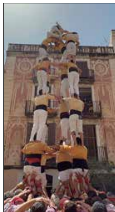
Primer 5 de 7 de l'any.

Va ser una diada d'estrenes ja que a banda del 5 de 7 dels locals, els Moixiganguers d'Igualada hi van descarregar el primer 7 de 8 del seu historial, que van acompanyar de la torre de 8 amb folre i del pilar de 6 carregats; i la Jove de Tarragona hi va completar els primers 9 de 7 i 7 de 7 de l'any.