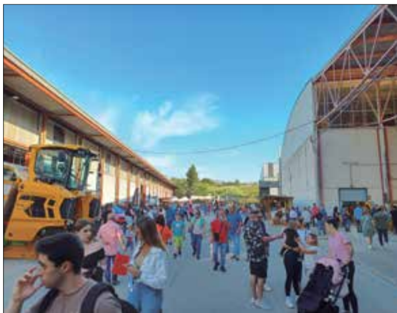
Gent passejant per les Fires de 2022.

L'edició d'enguany va comptar amb unes 33.000 persones visitants