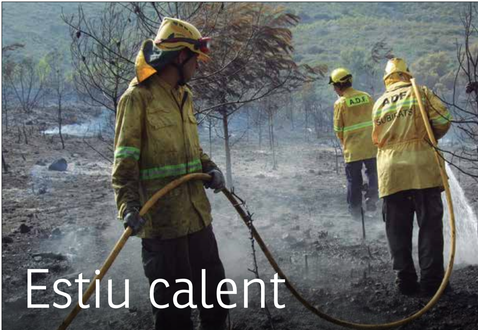
* FEDERACIÓ D'ADF PENEDES GARRAF