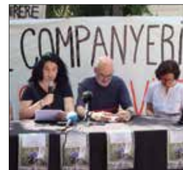
✖ BLANCA BLAY / ACN