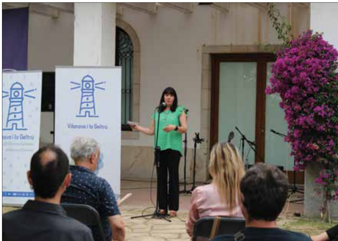
Dimarts a l'Espai Far es va donar el tret de sortida a la temporada turística d'estiu. ✖ LA FURA

Enguany es preveu superar la xifra de visitants registrada el 2019 i s'espera recuperar també el turista internacional