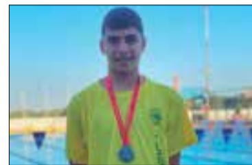
✦ CLUB NATACIÓ VILAFRANCA

Reus ha acollit aquests dies el Campionat de Catalunya Aleví de Nata-