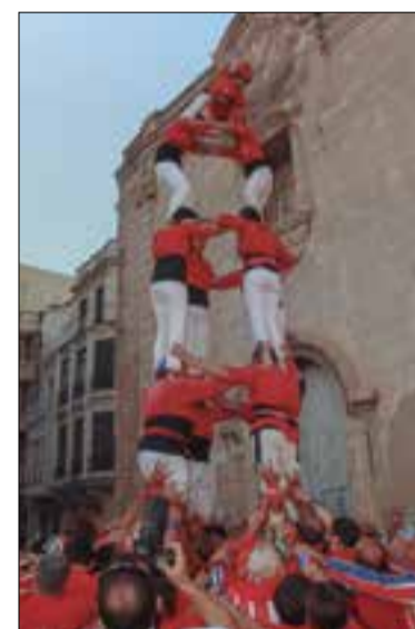
4 de 6 a Algemesí.

La Nova Muixeranga d'Algemesí hi va fer el guió d'entrada, la xoquera, la tomasina, dos pilars de 4 i tres pilars de 3; la Muixeranga de Xàtiva, el guió caminat, la torreta