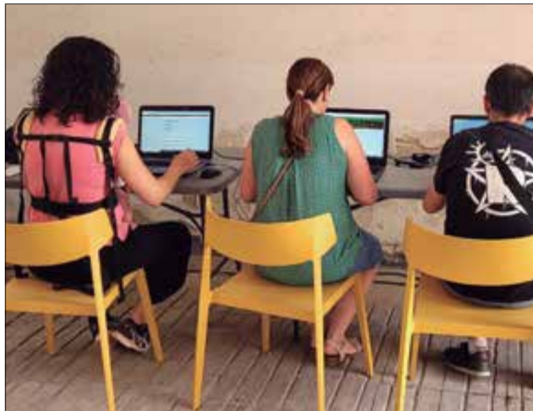
Un total de 1.417 persones han participat al procés. ✦ AJUNTAMENT

Els punts de votació s'han ubicat en diversos espais del municipi, i també s'hi podia accedir a través de la pàgina web participa.santsadurni.cat . Des de l'Ajuntament valoren molt positivament l'elevada participació i agraeixen "la implicació dels veïns i les veïnes en aquest exercici de governança