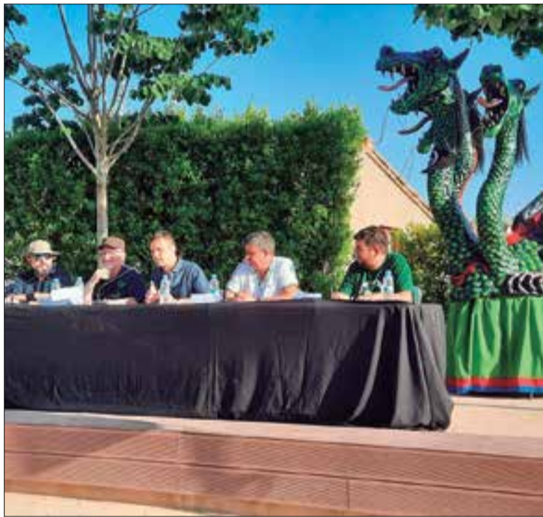
Presentació de la festa major de Sant Pere. ✦ AJUNTAMENT

La festa major commemora el 50è aniversari del Drac de Tres Caps