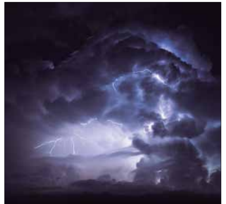
Tempesta de llamps Vilafranca del Penedès - 2021