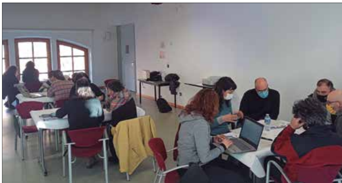
Enguany l'Ateneu Cooperatiu Coopsetània ha passat de sis a deu entitats impulsores. ✳ LA FURA