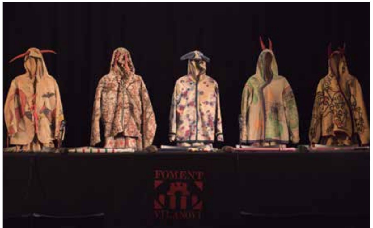
Cinc generacions de vestits dels Diables vilanovins lluiran juntes el 23 de juliol en cercavila. ✦ HELENA CARBONELL

Es farà una cercavila amb els cinc vestits que ha portat el Ball, un documental, un llibre i una exposició, entre altres