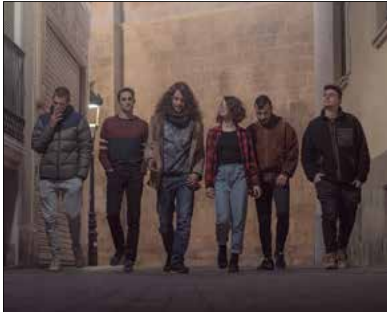
Bandau va néixer el febrer del 2020.

El grup de música Bandau, integrat per sis joves penedesencs que fan cançó de protesta en català, començarà a gravar durant el mes de març el seu primer disc, que volen finançar mitjançant una campanya de micromecenatge amb la plataforma Verkami. L'aportació mínima a favor del disc és de deu euros i en necessiten sumar 4.500 abans de finals de febrer. Com a compensacions hi haurà des d'una samarreta, una dessuadora o un concert privat, entre altres. Per fer les aportacions cal entrar al web que apareix al perfil d'instagram del grup i escollir la quantitat a donar i la compensació.