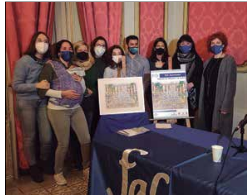
Acte de presentació del programa del 50è aniversari. ✦ FALCONS DE VILANOVA

La colla ha preparat una dotzena d'actes, un per cada mes de l'any, que clourà amb una gran diada falconera