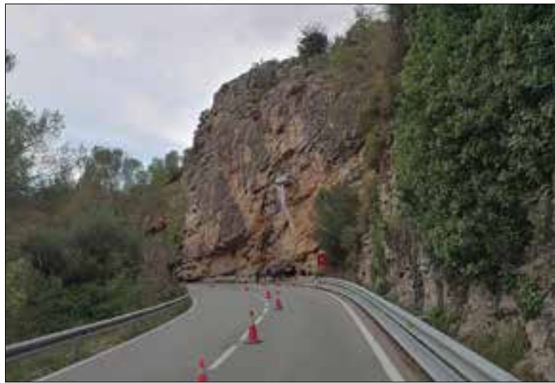
Paret de la Talaia, a la carretera del pantà. ✦ GEAM-TALAIÀ