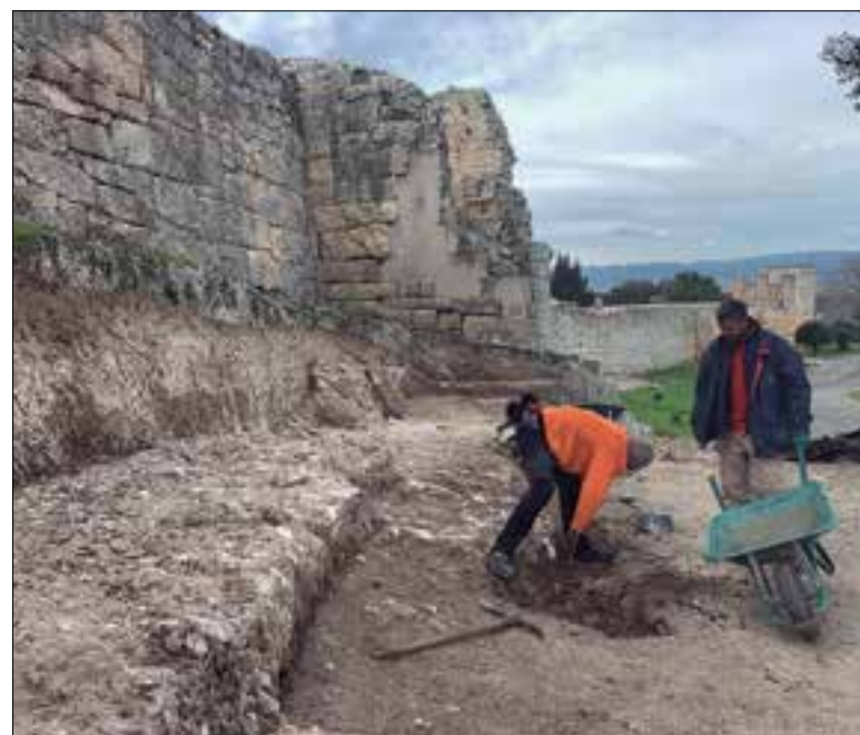
Treballs al voltant de la muralla, al desembre.

En la mateixa excavació, feta entre el 29 de novembre i el 23 de desembre, es va realitzar una intervenció a l'extrem est de la muralla romana tardorepublicana i es van recuperar 43 metres lineals de muralla, fins aleshores coberts de vegetació. El Museu assenyala que la muralla "de tipus barrera mesura de la cinglera est a l'oest 148 metres, i estava fins ara conformada per quatre torres". El parament exterior és de tipus itàlic, tal com correspon a les construccions defensives aixecades entre mitjans