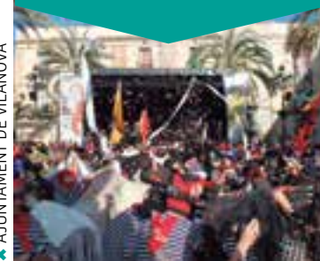
* AJUNTAMENT DE VILANOVA