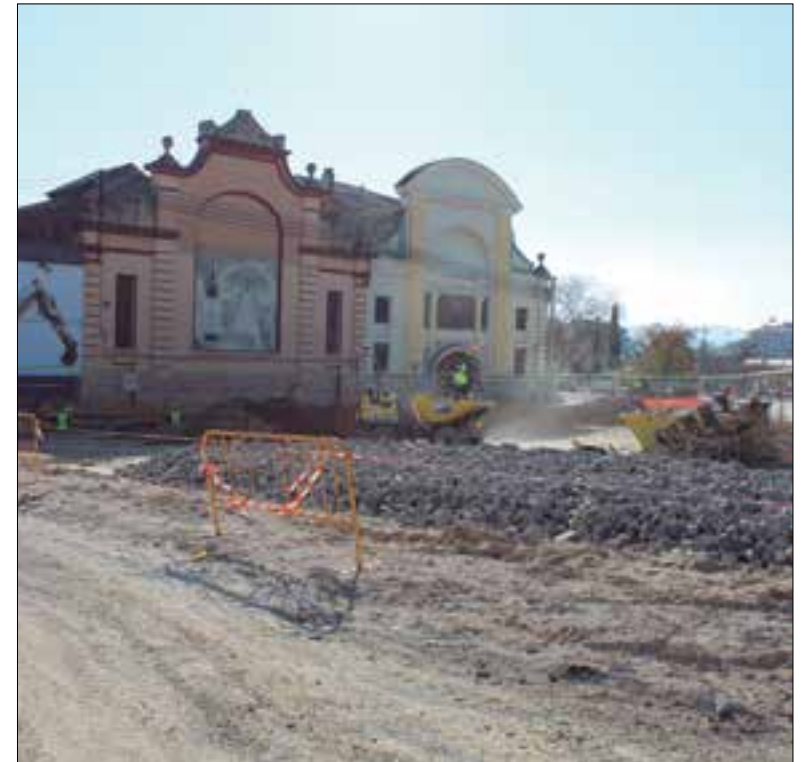
Aquesta setmana s'ha fet una visita d'obres al carrer Comerç. ✪ LA FURA

A més de la reforma del vial, el nou carrer també contempla fer valdre les naus industrials que hi ha en aquesta zona. En concret, deu naus esdevindran Bé Cultural d'Interès Local, un cop s'aprovi el catàleg de patrimoni, que ara s'està actualitzant. Per donar rellevància a