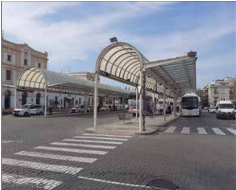
La plaça Eduard Maristany és de propietat de l'Estat. ✦ AJUNTAMENT