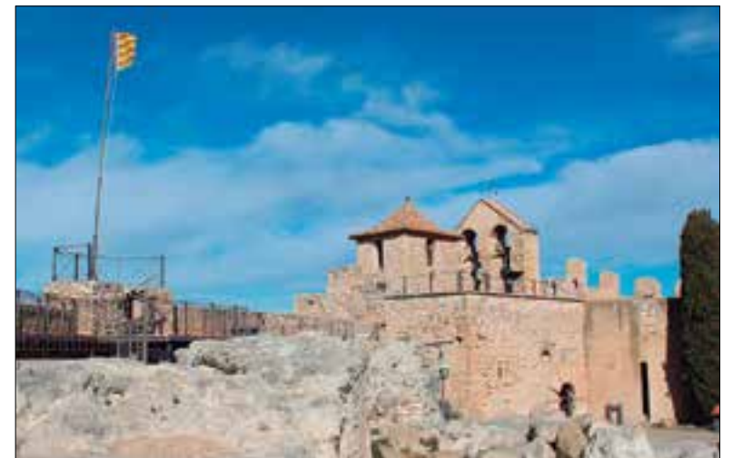
Castell de la Santa Creu.