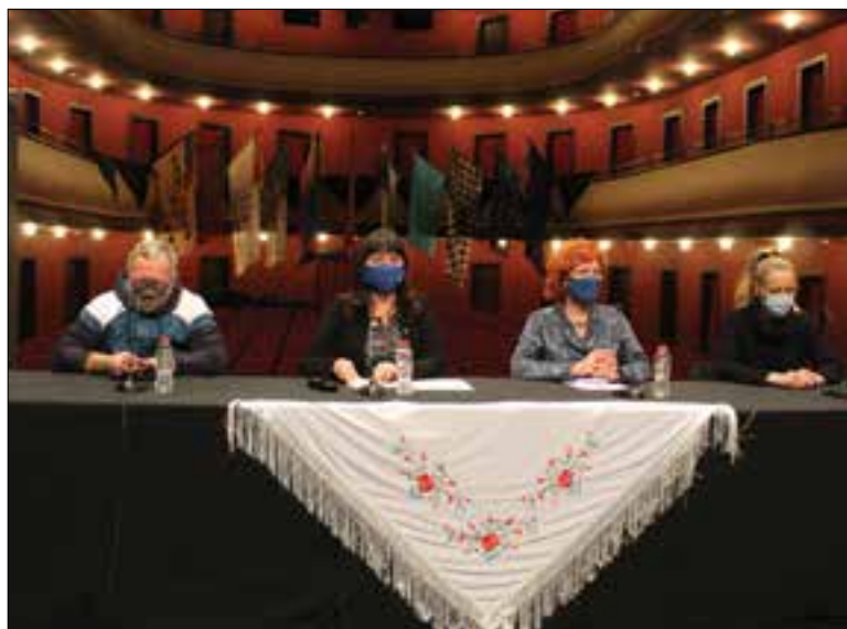
Dijous es van avançar, al Teatre Principal, els principals canvis del carnaval.