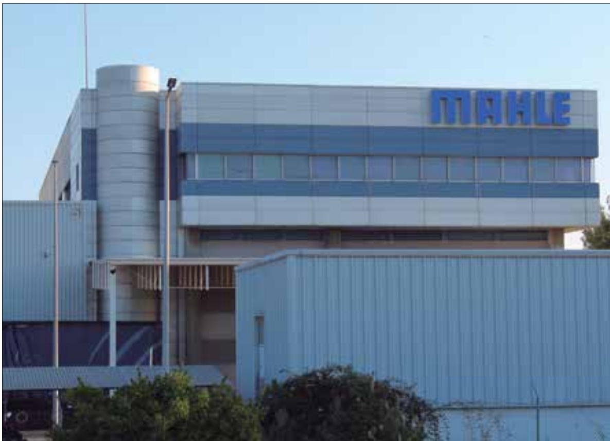
El fabricant de pistons Mahle tanca portes avui a Vilanova i la Geltrú. ✦ LA FURA