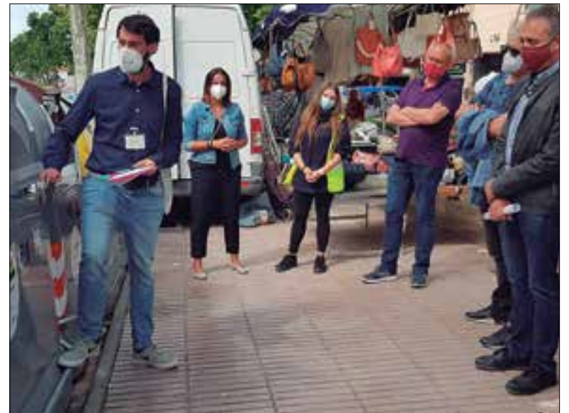
A l'estiu a Sant Pere de Ribes la Mancomunitat Penedès-Garraf va fer una prova pilot amb contenidors intel·ligents. * MANCOMUNITAT

L'assemblea de municipis de la Mancomunitat Penedès-Garraf va adjudicar dilluns el nou servei de gestió i recollida de residus porta a porta a cinc municipis de l'Alt Penedès durant un període de vuit anys. Aquests municipis són: Sant Sadurní, Sant Quintí de Mediona, Sant Pere de Riudebitlles, Torrelavit i Olèrdola.