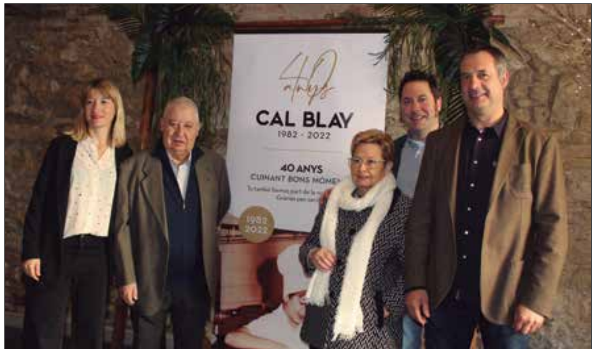
Acte de presentació dels 40 anys del grup Cal Blay