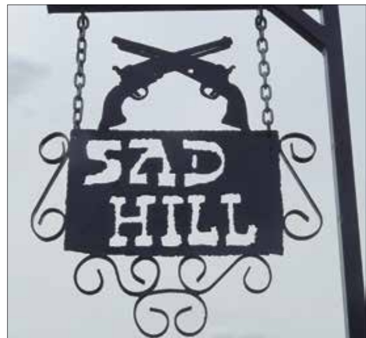
"El bueno, el feo y el malo" Nou Mèxic - 1999