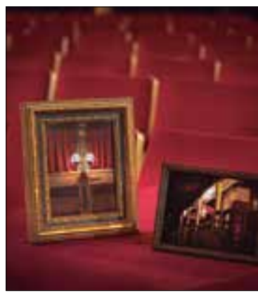
* TONI GALITÓ