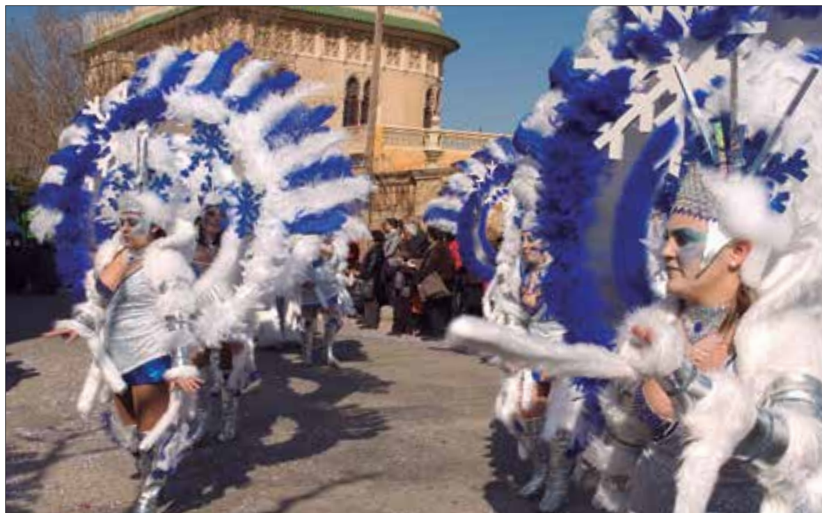
Carnaval de l'Arboç. ✱ ÒSCAR MÉNDEZ

Els dos municipis mantenen les rues i avisen que els grups que no compleixin amb les bases seran expulsats