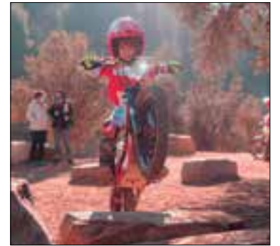
(18 anys), actual entrenador de l'escola.

L'escola de trial Maria Giró, sorgida el passat mes de setembre, ha creat un equip infantil propi de competició. El Júnior Trail Team està format per 14 pilots d'entre 5 i 14 anys, seleccionats per rebre suport tècnic, nutricional, d'entrenament i competició, per participar en el Campionat de Catalunya de Trial per a Nens i el Campionat de Catalunya de Trial Open. A més, quatre ho faran al campionat estatal. Dins l'equip també hi serà Oriol Giró