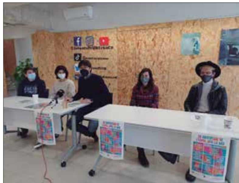
Presentació dels actes que es faran el dissabte 12 de febrer.