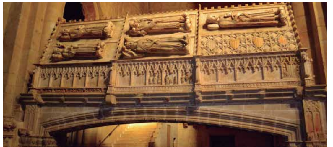
Tombs dels reis del Casal de Barcelona al monestir de Poblet.