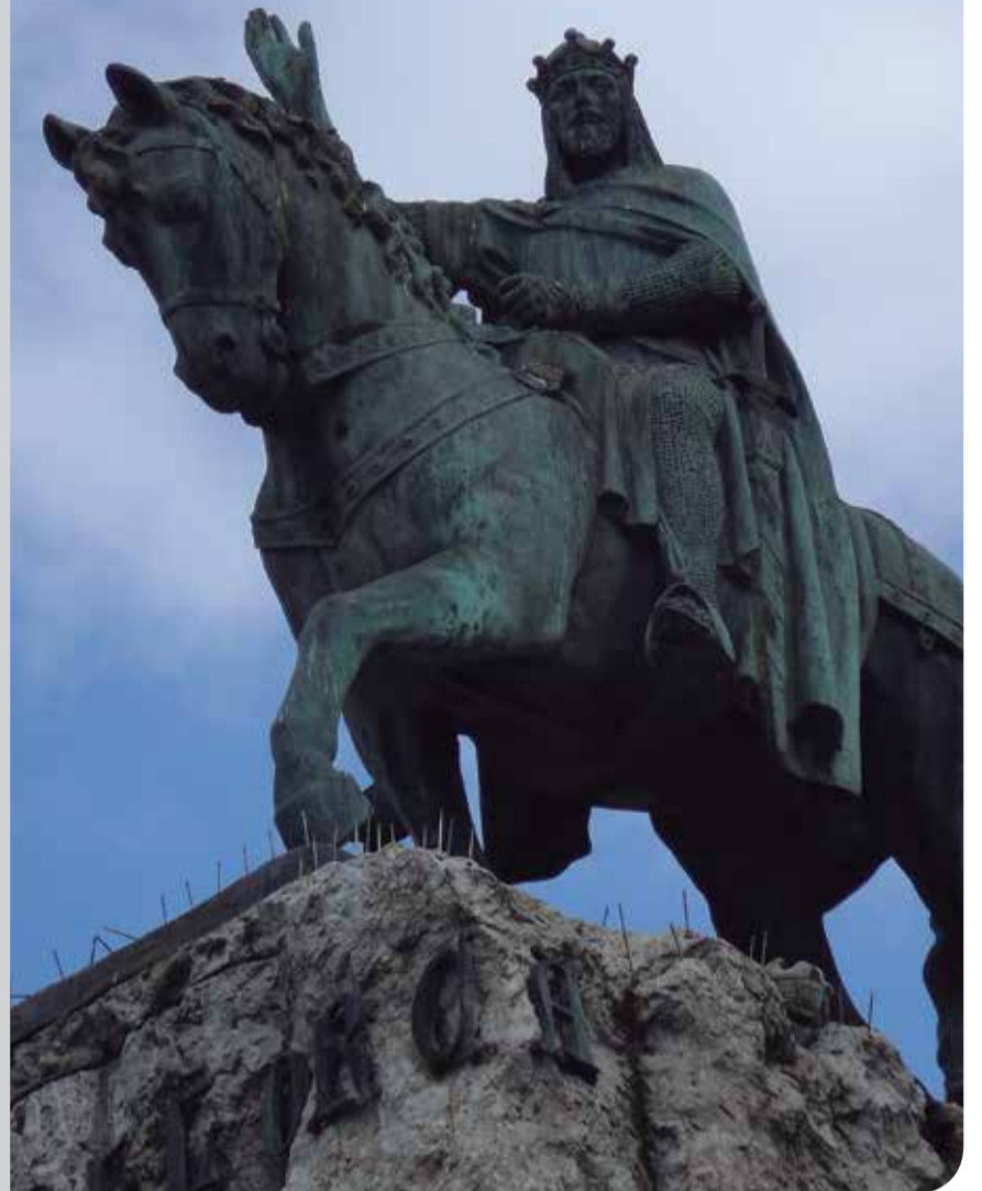
Estàtua de Jaume I a Palma de Mallorca.

a qui havia de desposseir de les terres per lliurar-les als creients. Jaume I va ser un heroi, va conquerir per a la Corona Catalano-Aragonesa els regnes de Mallorca, València, Múrcia (que després cedí a Castella) i tan sols va patir una severa derrota al tram final de la seva vida, la croada a Terra Santa. Jaume I va tenir una vida longeva, per l'època que era i per la seva exposició constant al camp de batalla. A més, va tenir un regnat llarguíssim, ja que als sis anys i mig es va quedar orfe i va haver d'assumir abans d'hora les més altes responsabilitats. Tot el que va fer en vida va ser un acte de fe, i si tenia èxit en les seves gestes era per voluntat de déu, a qui ell servia incondicionalment. Déu estava de la seva part.