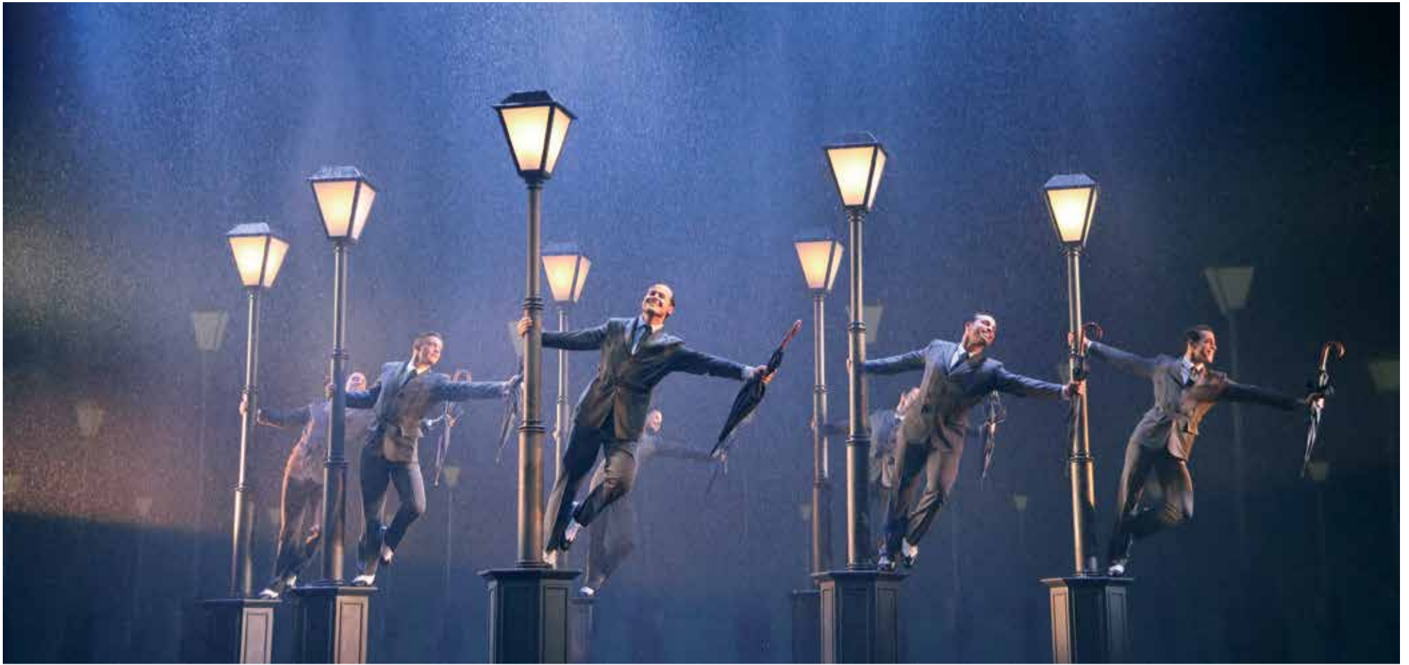
Imatge d'un dels moments de Cantando bajo la lluvia