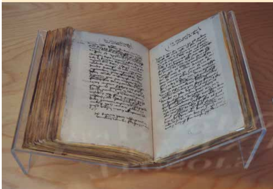
Facsimil del testament d'Ausiàs March.

Tirant lo Blanc consta de cinc llibres, en els quals el protagonista viatja a Anglaterra, França, Sicília, Rodes, Jerusalem, Alexandria, Trípoli, Tunis. Arreu viu mil aventures i desventures, en tornejos de lluita però també com a militar, que salva Constantinoble dels turcs. I també s'enamora de la filla de l'emperador, Carmesina, hi ha un triangle amorós, enganyos, deu anys de separació entre enamorats i retrobada final, que hauria estat feliç si no fos que el Tirant mor de seguida. I ella també, de pena. Final tràgic, doncs. Val a dir que Joanot Martorell (1410-1465) va deixar el llibre inacabat, i algú altre el va acabar, no se sap ben bé qui. Una hipòtesi és que ho feu Joan Roís de Corella, però n'hi ha altres de possibles.