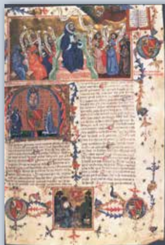
Crestià de Francesc Eiximenis, segons un manuscrit de 1792.

Coetanis de Bernat Metge són tres autors que també van fer una contribució important a la literatura catalana medieval, en aquest cas orientada al vessant religiós: els franciscans Sant Vicent Ferrer i Anselm Turmeda i el dominic Francesc Eiximenis.