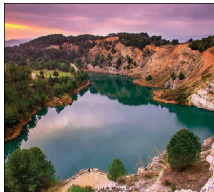
Pèlags Vilobí del Penedès - 2020