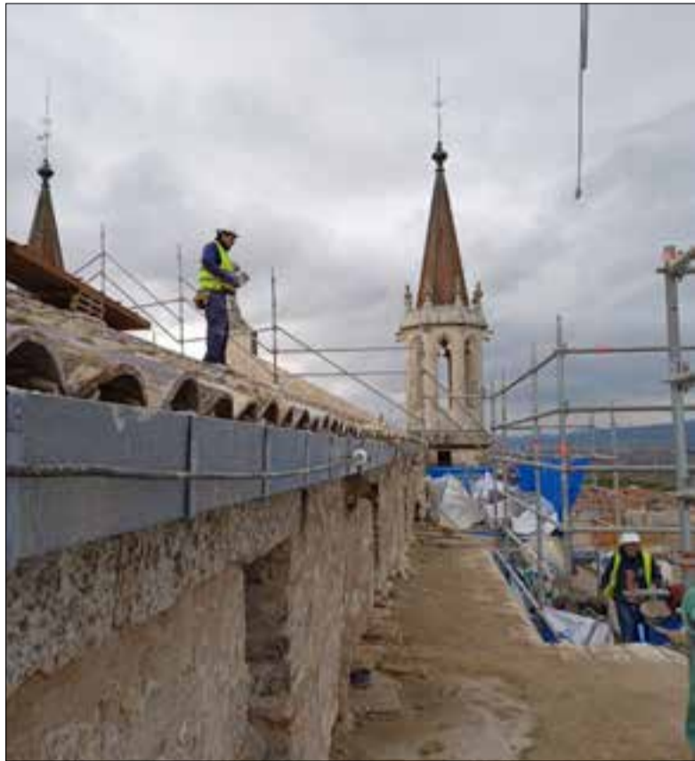
La segona fase de les obres ja està pràcticament enllestida. ✱ LA FURA