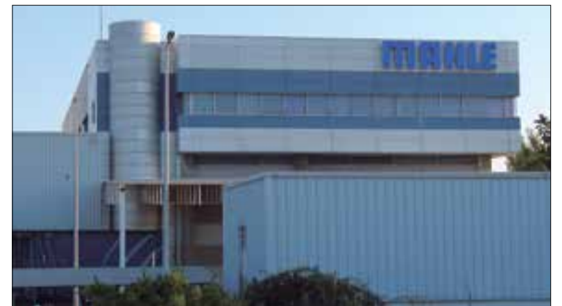
En marxa les negociacions entre Ajuntament i Mahle. ✦ LA FURA