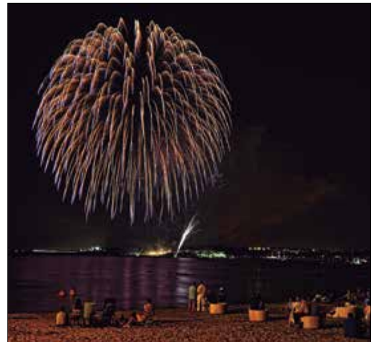
Castell de foc de festa major, vist des de la platja Vilanova i la Geltrú, 4-8-2015