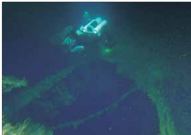
Imatges capturades d'un submarinista i el vaixell enfonsat.

Quatre bussejadors haurien obtingut les primeres imatges del vapor britànic "Birdoswald"