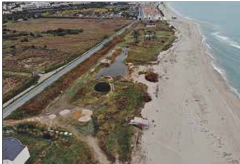
Vista aèria de l'espai protegit de les Madrigueres. ✦ GEVEN

La (Re)volta de les Madrigueres s'iniciarà amb un itinerari que recorrerà les Madrigueres i on s'explicarà el projecte inicial, la situació actual i les perspectives de futur. S'acabarà amb un fòrum obert a l'Auditori Pau Casals, tot amb inscripció prèvia. A més, hi haurà una exposició amb retalls de premsa, fotografies i vídeos facilitats per la gent i els mitjans de comunicació. L'entrada és lliure i gratuïta.