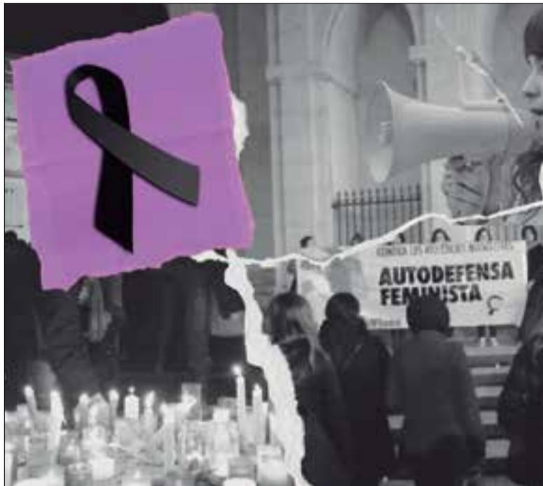
Collage d'imatges d'actes contra la violència de gènere a la ciutat. ✦ AGORA

En total s'han obert 158 expedients nous entre l'1 de gener i el 31 d'octubre. L'abordatge es realitza des de diversos àmbits: psicològic, jurídic i social. Del total de 3.282 atencions, 1.740 són atencions psicològiques, 238 són assessoraments jurídics, 294 són atencions socials i 1.050 són actuacions en informació i orientació comunitària, que són imprescindibles per a l'acompanyament i el suport que precisen les dones per identificar les situacions de violència masclista i sortir-ne. La majoria de dones ateses pel SIAD tenen entre 35 i 49 anys. Pel que fa a la perspectiva de diversitat cultural i d'origen, hi ha poca incidència de dones mi-