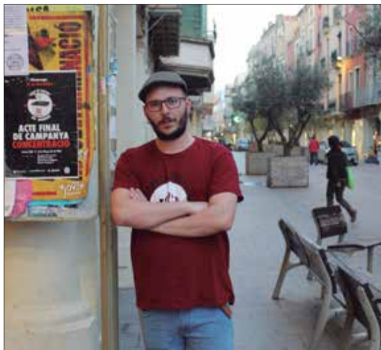
Dissabte a la tarda s'ha convocat una manifestació en suport a Sas. ✱ LA FURA

Tot i que en el recurs la defensa del vilafranquí va adjuntar desenes de sentències en les quals un pal de