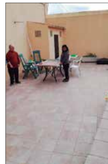
El pati del Mas de les Cabanyes.