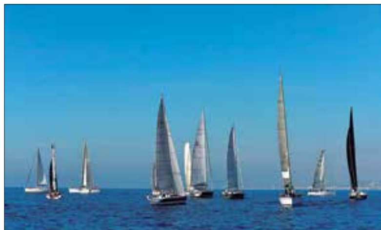
Creuers durant la Regata Columbretes 2019, a Vilanova.