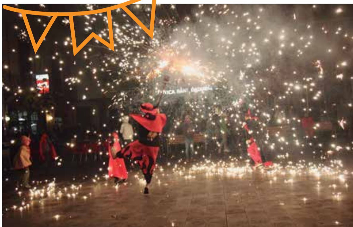
Els Diables estrenaran La Bèstia, faran els versots i el correfoc, entre altres.

Dissabte serà el primer dia que es podrà visitar –gratuïtament– i fins al 3 de desembre el Cava Centre, en un transformat Centre d'Interpretació del Cava. També s'obre el dia 27 l'exposició temporal "Can Guineu, la casa dels Mir", a la Fassina, visitable al llarg de tot el 2022.