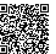
Guia de bones pràctiques