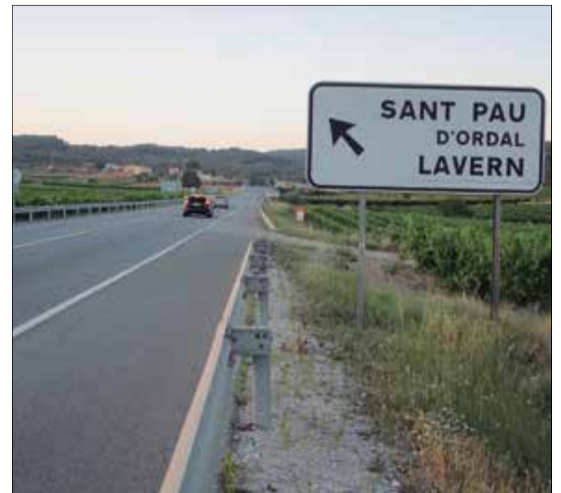
Des del març del 2006 que s'està esperant la nova rotonda. ✖ LA FURA

La Direcció General de Carreteres fixa calendari a una reclamació que ve de fa vint anys