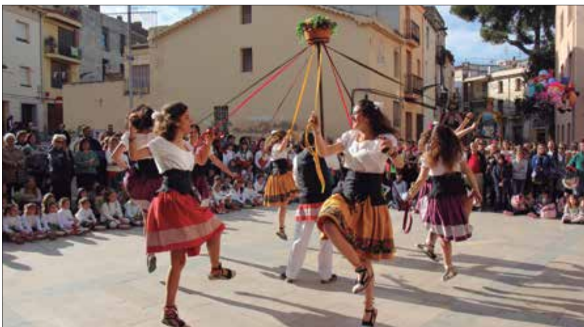
El Ball de Gitanes forma part del seguici folklòric sadurninenc. ✨ AJUNTAMENT DE SANT SADURNÍ

gegantera, que diumenge organitzarà també una trobada de gegants, amb sortida a l'Era d'en Guineu i final a la plaça de l'Ajuntament, per commemorar el seu vuitantè aniversari, i que comptarà amb la participació de les parelles de gegants de Martorell, Masquefa, Sant Llorenç d'Hortons, Sant Quintí de Mediona, Torrelavit i Vilanova d'Espoia.