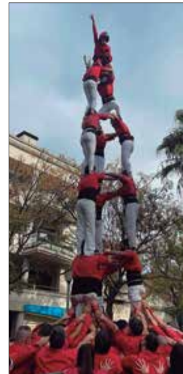
El 3 de 7, primer castell dels Xicots el 2021. ✱ XICOTS

Es dona la circumstància que els Xicots són una de les poques colles castelleres que han actuat aquest any i també l'any passat, ja que el