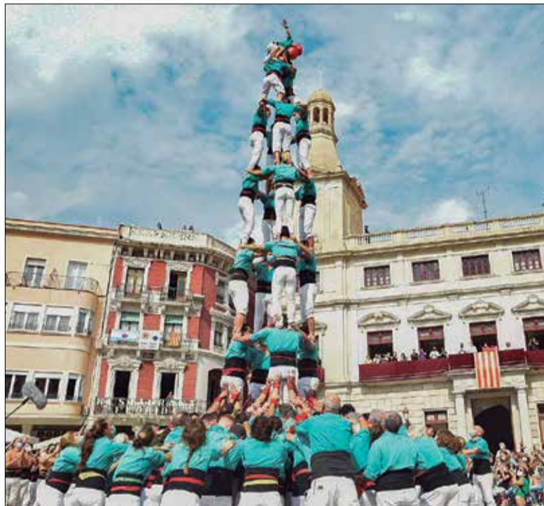
Carro gros dels verds al Mercadal reusenc.

Era també la primera actuació en format clàssic de diada amb almenys tres colles que es feia. De fet, n'eren cinc. Les altres quatre van fer totes castells de set. Per tal que no s'allargués, les colles van consensuar d'antuvi fer dues rondes simultànies i una en solitari (la segona). Els penedesencs hi van aixecar el 5 de 7, el 4 de 8, el 4 de 7 amb agulla i van acabar amb dos pilars de 5 i posterior-