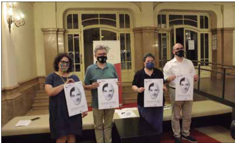
Com cada any, el cartell ha estat elaborat pel fotògraf Toni Galitó. ✪ LA FURA