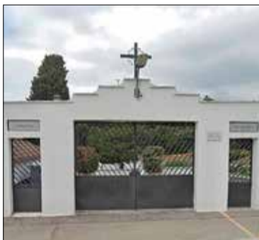
Cementiri de Cunit.