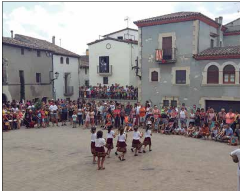
* AJUNTAMENT DE LA GRANADA

aquest cap de setmana torna i recupera les activitats més significatives. Aquest 2021 la Granada durà a terme una nova edició de la mostra Tasta-la Granada, omplirà els carrers amb actes folklòrics com el correfoc, la cercavila o la pujada del Ruc petit al campanar, i acollirà la quarta edició de la Cronoescalada, cursa que uneix la Granada amb el municipi veí de Santa Fe.