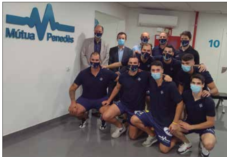
Plantilla del primer equip, a la seu de Mútua Penedès.

D'altra banda, Mútua Penedès ha posat a disposició de la plantilla del primer equip i dels seus equips inferiors i base els serveis mèdics del seu centre mèdic, en especial el servei de medicina de l'esport, que ofereix una atenció persona-