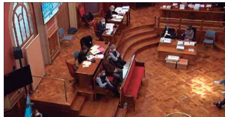
Un moment del judici.