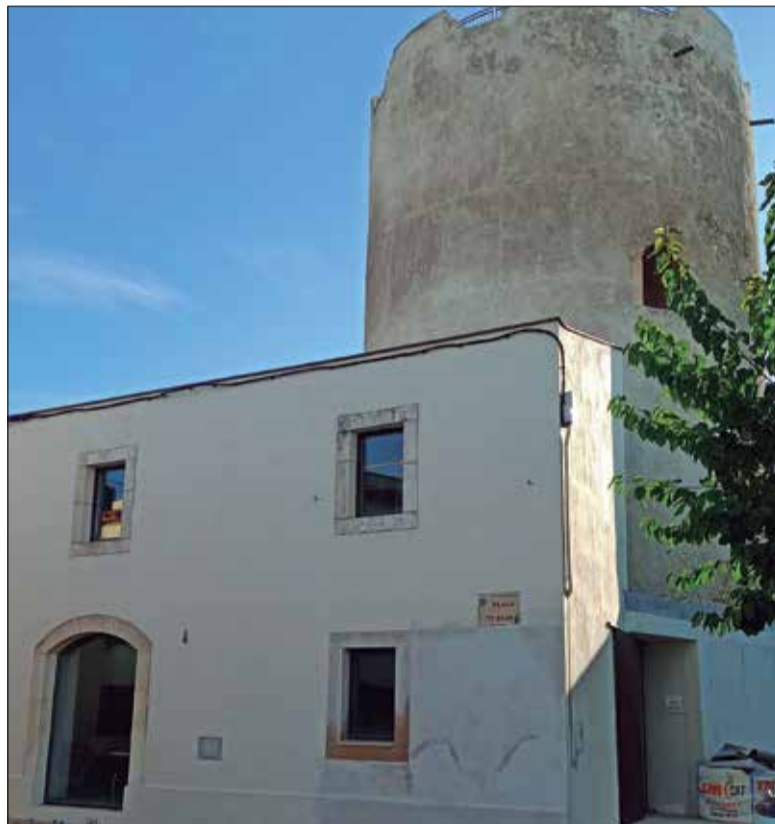
La torre de Moja ara serà visitable.

Amb el propòsit genèric de fer que l'edifici "recuperi la seva dignitat històrica", les obres d'aquesta darrera fase han suposat la restauració i la consolidació dels paraments i els revestiments; la substitució dels sostres i les escales; i el condicionament de la coberta i de la sortida per facilitar la visita. També s'han millorat el badalot, les escales d'accés a la coberta, elements de protecció i paviment, i s'ha col·locat l'escala que permet l'accés a la Torre des de la terrassa de l'edifici annex.