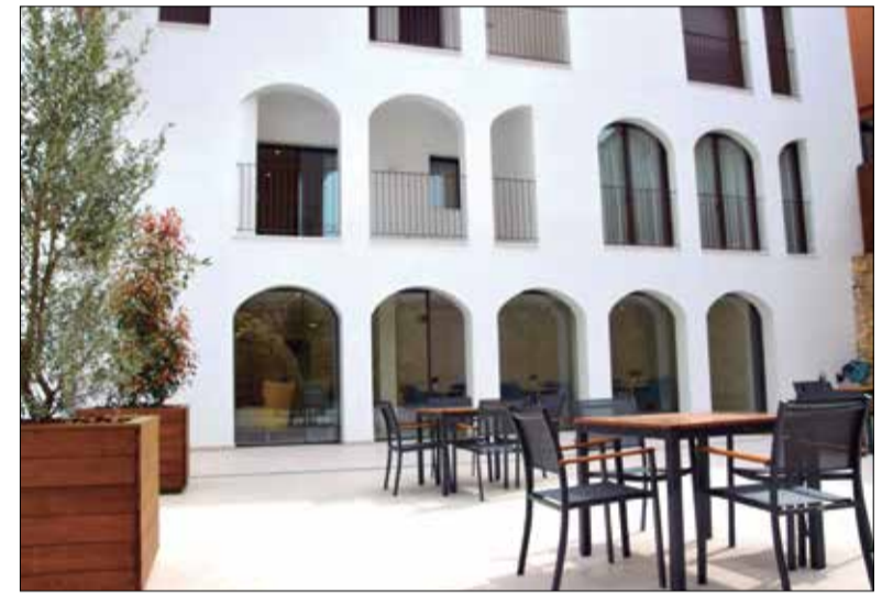
Espais comuns dels Allotjaments ubicats al carrer de Sant Bernat.

L'edifici té 16 allotjaments per a gent gran, amb amplis espais comuns