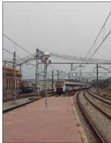
Un dels debats versarà sobre el transport ferroviari. ✪ LA FURA