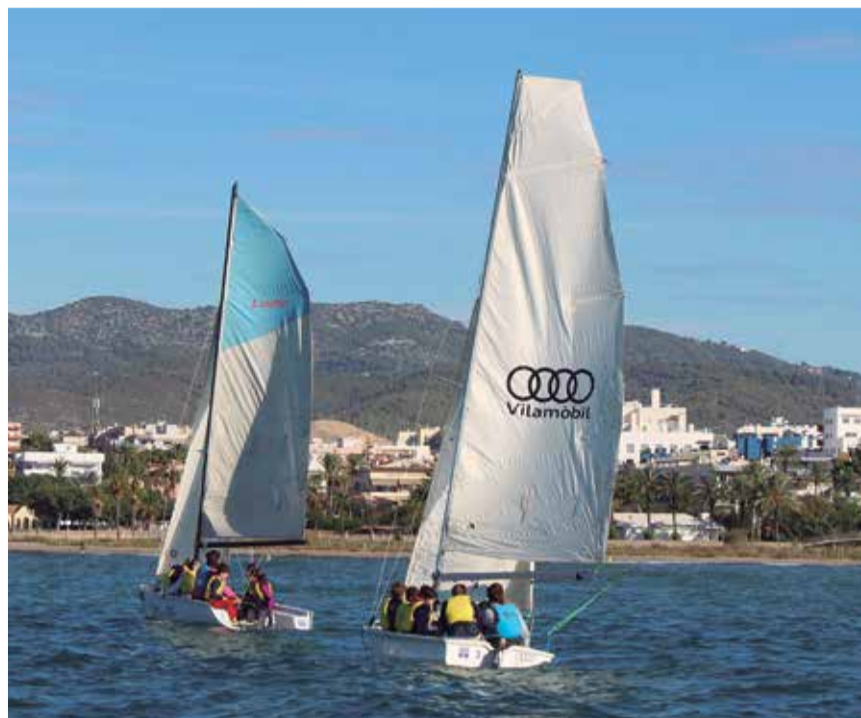
Els alumnes de 5è de l'Escola Canigó, navegant ✦ LA FURA