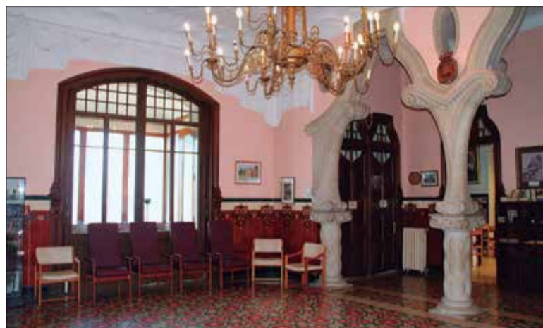
Can Pahissa serà un dels espais que es podrà visitar.

A Vilanova i la Geltrú els equipaments que se sumen a les JEP són els ja habituals Museu Víctor Bala-