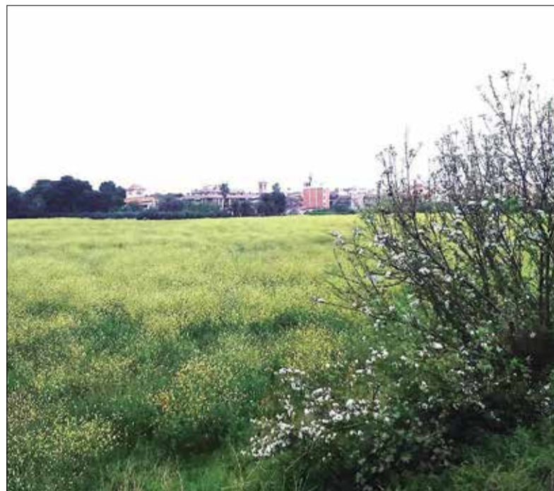
Plana del Castell, a Cunit. ✳ CUP