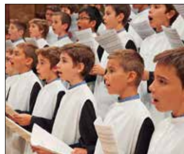
✦ ESCOLANIA DE MONTSERRAT

La Fundació Pinnae i la parròquia de Santa Maria de la Geltrú han organitzat un concert benèfic amb l'Escolania de Montserrat. El cor musical, un dels més coneguts a nivell mundial, actuarà en doble sessió el divendres 5 de novembre, amb l'objectiu de possibilitar l'accés de tot el públic a la parròquia i mantenir, al mateix temps, un aforament controlat. La primera actuació serà a 2/4 de 8 del vespre i la segona a 1/4 de 10. Els beneficis aniran destinats a rehabilitar el retaule i millores de la parròquia, actualment en procés de reforma. El preu de les entrades serà un donatiu de 15 euros.