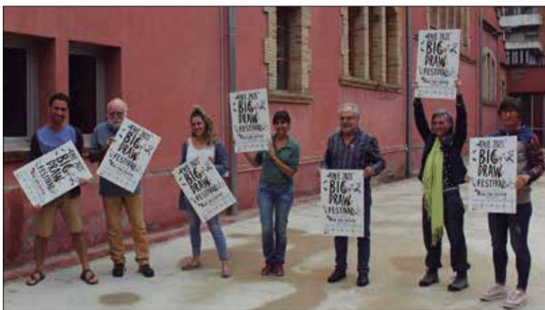
L'organització del Big Draw, al pati interior de l'Escorxador. ✱ LA FURA