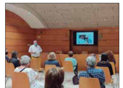
Presentació del servei. ✪ AJUNTAMENT