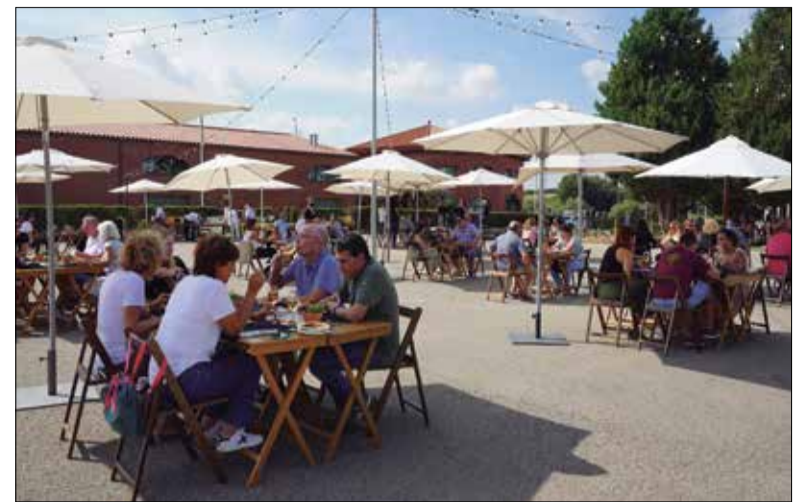
Els tastos a les caves es van fer a l'exterior aprofitant el bon temps.