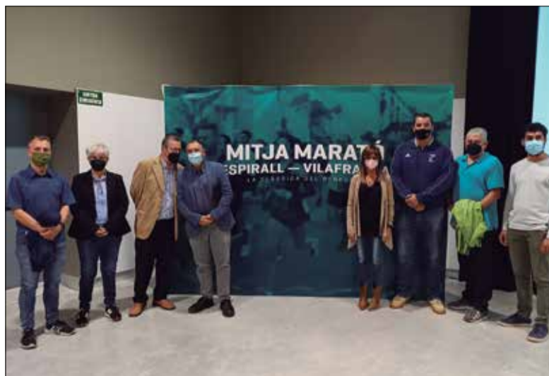
La presentació de la Semi es va fer a l'Espai Jove La Nau. ✦ AJUNTAMENT