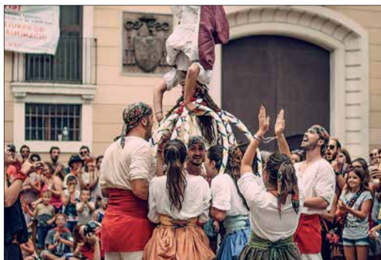
Imatge d'arxiu del Ball dels Cercolets de Vilafranca. ✳ ELA.GEMINADA

És per això que el ball no va assistir a l'Ofrena a Sant Fèlix d'aquell dia i que durant la resta d'actuacions i la processó de 2021 van ballar amb un membre menys, perquè des que van saber aquests fets van decidir apartar el ballador dels actes folklòrics i expulsar-lo del ball.