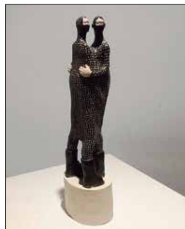
Yo->Yo (06) , d'Isabel Alfaro, primer premi de 2017; i A man's bloodstream , d'Olga Simonova, primer premi de 2019. ✪ LA FURA

La Biennial de Ceràmica és un projecte que va néixer amb l'objectiu de mostrar la producció contemporània de la ceràmica decorativa als Països Catalans. Tant que, en la tercera edició, el certament es va obrir al món per la bona acceptació que estava tenint, arribant a participar-hi centenars de cera-