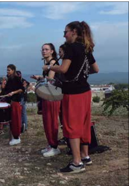
* AJUNTAMENT DE LA GRANADA