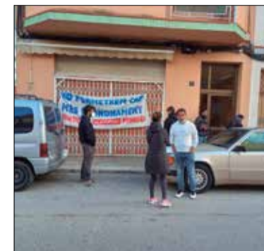
✱ SINDICAT DE LLOGATERES

Aquesta setmana el Sindicat de Llogateres del Penedès ha encarat dos desnonaments al barri de l'Espiral de Vilafranca. El primer es va aconseguir aturar dijous al matí gràcies a la pressió de la gent al carrer: "feia només una setmana que sabíem que hi havia aquest desnonament, que ens ha arribat des de Serveis Socials. En aquest cas volien fer fora de casa una mare amb el seu fill menor d'edat, família que comptava amb el certificat de vulnerabilitat i que havia deixat de pagar lloguer temps enrere perquè no s'ho podien permetre", expliquen des del Sindicat. Aquest certificat, que atorga Serveis Socials, ha de servir per impedir els desnonaments o endarrerir-los des de l'estat d'alarma, però el termini finalitza aquest octubre. "Veiem a venir que en quinze dies hi haurà una allau de desnonaments de les famílies més vulnerables, que se sumaran als que ja estem vivint ara", afegeixen. Divendres 8 hi ha un altre desnonament, aquesta vegada a una família amb fills menors i majors d'edat, de la qual el Sindicat ha tingut coneixement aquest mateix dimecres: "molta gent no ens coneix i demanen ajuda amb poc temps de marge, i a més des del Jutjat sovint no donen resposta i ens tenen esperant hores al carrer sense saber què passarà, sembla que no els importi jugar amb la vida de la gent", apunten.