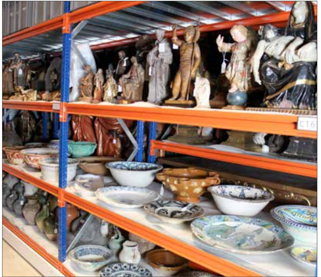
Prestatgeria amb imatgeria religiosa i peces de ceràmica. ✦ LA FURA

La preparació de qualsevol exposició es cou a foc lent. Hi pot haver emergències, esclar, però fer tots els preparatius pot trigar, com a poc, tres o quatre mesos, i de vegades el procés pot durar anys. Sobretot si cal restaurar les peces. Com que de recursos per restaurar n'hi ha pocs, se solen demanar subvencions, i amb les que arriben, cada any cal prioritzar a què es destinen. Per exemple, hi pot haver una peça que se sàpiga que anirà a l'exposició permanent, i encara que no tingui data, se'n planifica la restauració –si li cal– amb prou antelació. Una restauració que es pot fer al taller de Cal Berger o bé externalitzar, i que en qualsevol cas comporta molta feina de gestió prèvia i d'ordenació posterior: recerca de pressupost, la fitxa de l'objecte, fotos de detall, localitzar la persona adequada per fer els treballs, enviar la documentació, posar-se d'acord amb els criteris de restauració, en el calendari, fer la memòria, bolcar-la a l'inventari del museu, reubicar les peces, tornar-les a retratar, numerar-les... Això a banda, totes les feines de conservació cal fer-les amb molta cura, ja que sovint els objectes que s'hi custodien són peces úniques, que no s'han de malmetre. I totes les feines de contacte amb els materials requereixen temps i molta atenció.