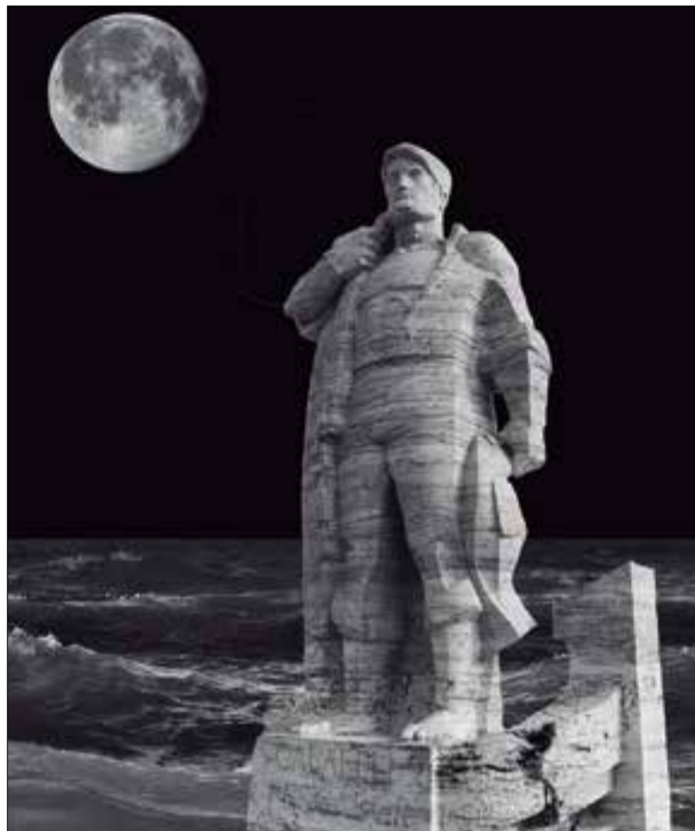
Imatge del cartell del primer festival La Mar Fosca.

A banda de les xerrades i les taules rodones amb els autors, el festival