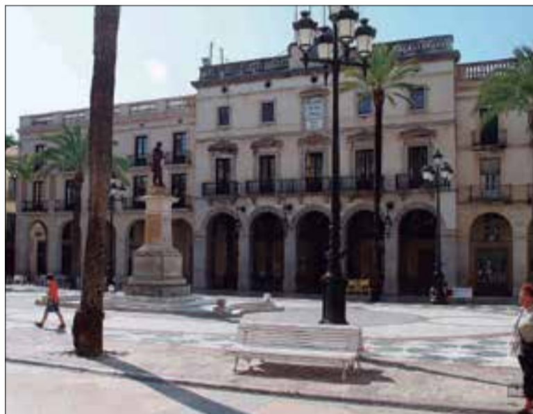
La Casa de la Vila consumirà energia verda.

Els edificis municipals que passaran a ser més sostenibles un cop hagi finalitzat la licitació són la mateixa Casa de la Vila, l'Institut Municipal d'Educació i Treball, la Companyia d'Aigües, el Museu Víctor Balaguer, l'empresa VNG Aparcaments i l'Oficina d'Assistència Social. En conjunt, la fac-