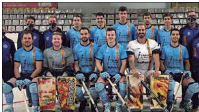
Plantilla del CP Vilafranca de la temporada 2020/21.