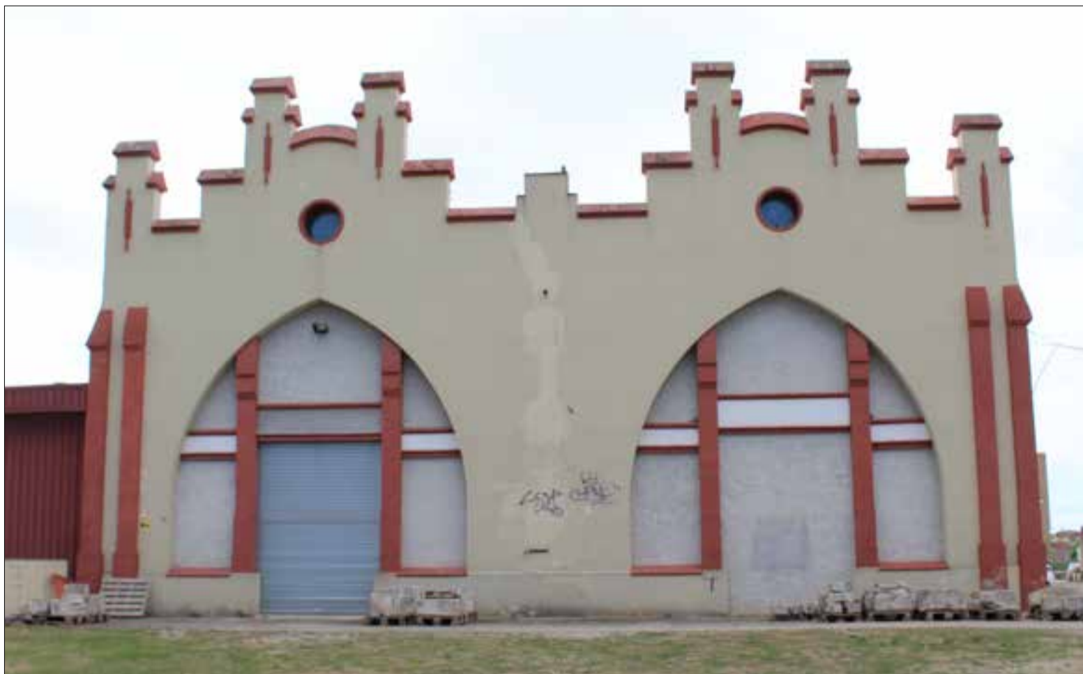
Façana del Magatzem Berger, on ara hi ha les reserves del Vinseum de Vilafranca. ✖ LA FURA