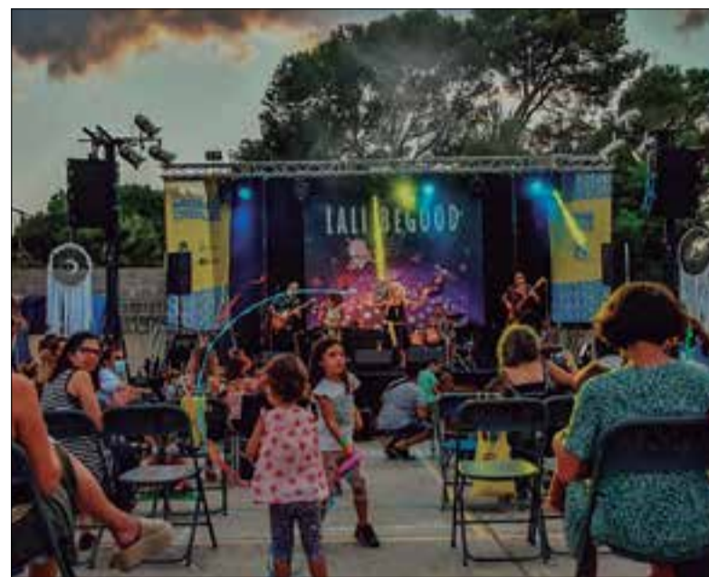
Un concert infantil al Monocicle de l'any passat.