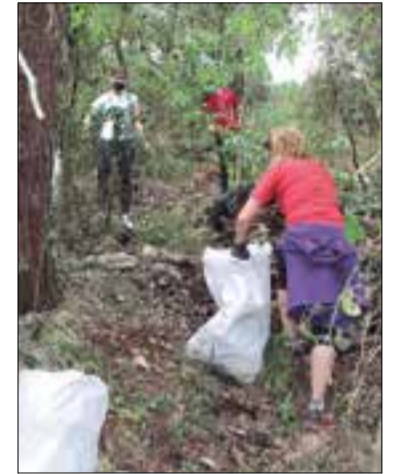
* PENEDÈS VERD

Un centenar de persones van participar diumenge en una jornada de neteja des del bosc de Cal Quim, al barri la Serra de Baix de Sant Martí Sarroca, fins al riu Foix, dins de l'acció comuna a tot Europa anomenada "Clean Up", de conscienciació sobre la quantitat de residus que es llencen de forma incontrolada a la natura. Durant la matinal, es van recollir trenta bosses gegants, cinc sacs i més de cent pneumàtics, amb un pes total de 2.280 quilos.