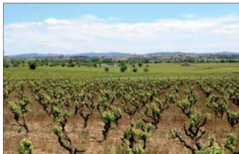
Les vinyes de moneu estan a la finca Castell de la Bleda.