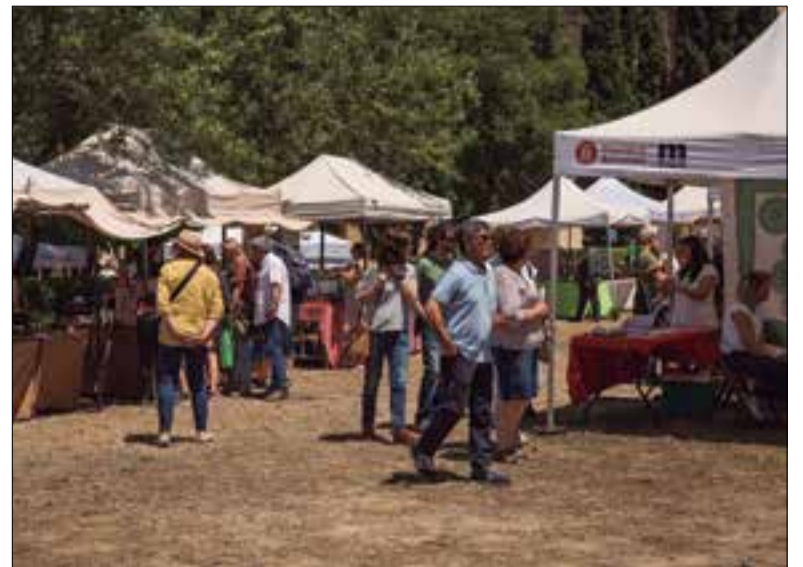
L'última edició del Remeiart, abans de la pandèmia.