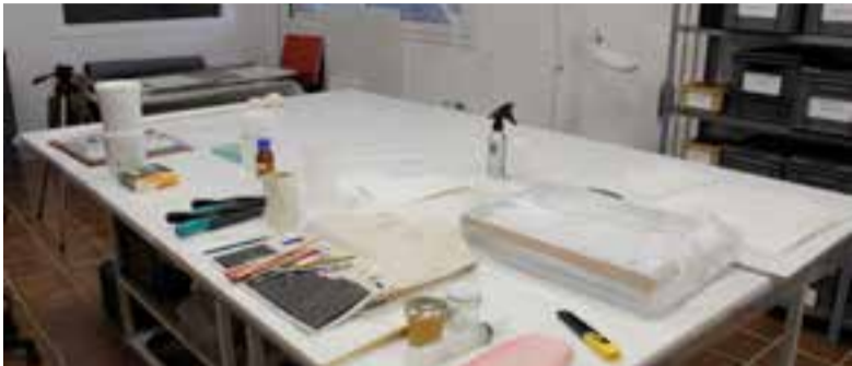
Espai de treball per a la restauració de materials.

La preparació de qualsevol exposició es cou a foc lent. Hi pot haver emergències, esclar, però fer tots els preparatius pot trigar, com a poc, tres o quatre mesos, i de vegades el procés pot durar anys. Sobretot si cal restaurar les peces. Com que de recursos per restaurar n'hi ha pocs, se solen demanar subvencions, i amb les que arriben, cada any cal prioritzar a què es destinen. Per exemple, hi pot haver una peça que se sàpiga que anirà a l'exposició permanent, i encara que no tingui data, se'n planifica la restauració –si li cal– amb prou antelació. Una restauració que es pot fer al taller de Cal Berger o bé externalitzar, i que en qualsevol cas comporta molta feina de gestió prèvia i d'ordenació posterior: recerca de pressupost, la fitxa de l'objecte, fotos de detall, localitzar la persona adequada per fer els treballs, enviar la documentació, posar-se d'acord amb els criteris de restauració, en el calendari, fer la memòria, bolcar-la a l'inventari del museu, reubicar les peces, tornar-les a retratar, numerar-les... Això a banda, totes les feines de conservació cal fer-les amb molta cura, ja que sovint els objectes que s'hi custodien són peces úniques, que no s'han de malmetre. I totes les feines de contacte amb els materials requereixen temps i molta atenció.