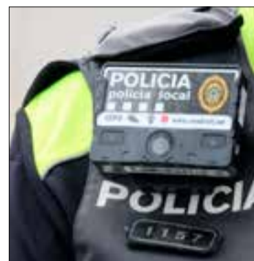
Dissabte i diumenge no hi va haver patrulles nocturnes. ✖ ACN