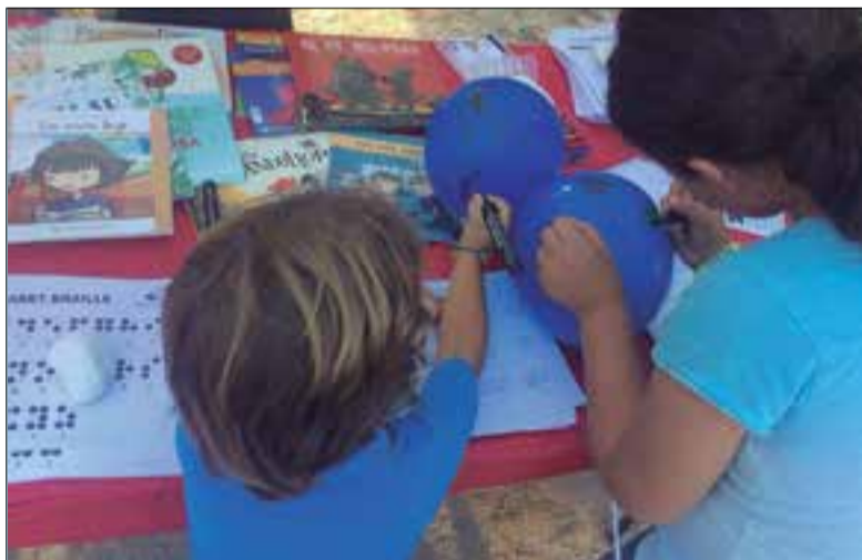
L'última edició presencial de la Festa, l'any 2019 ✦ FACEBOOK FESTA INCLUSIVA

Les activitats s'allargaran fins al dia 23 de maig i tenen tres formats. D'una banda, les activitats lúdiques per pensar i gaudir, que es poden fer a partir dels suggeriments que els organitzadors han penjat a la pàgina web de la Festa. Les famílies trobaran publicats a internet els materials, que van des d'un conte a una pel·lícula, juntament amb idees i indicacions per fer els treballs. D'altra banda, hi ha els espais de debat que aquest any giren al voltant de tres temàtiques: l'escola inclusiva al Garraf, la reforma de la legislació civil en ma-