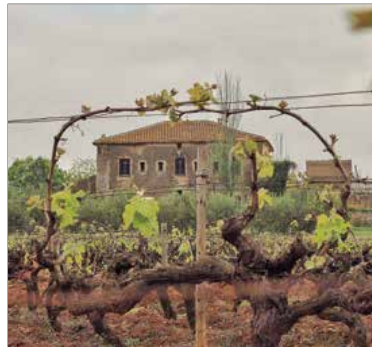
El castell de Gimanelles Sant Jaume dels Domenys - 2021