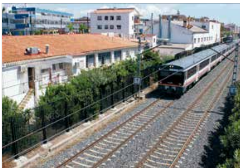
Per la línia de Tarragona a Cunit passen més de 30.000 trens a l'any.

Els mapes estratègics de soroll que realitza Adif li serveixen per identificar punts de la xarxa ferroviària