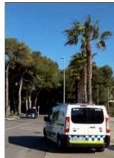
Hi ha 22 places d'interins. ✖ ACN