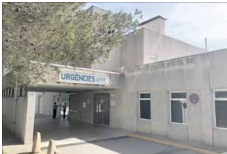
Les obres començaran el 6 d'abril. ✦ CSAPG