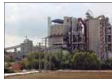
✱ JAVI POLINARIO - ACN