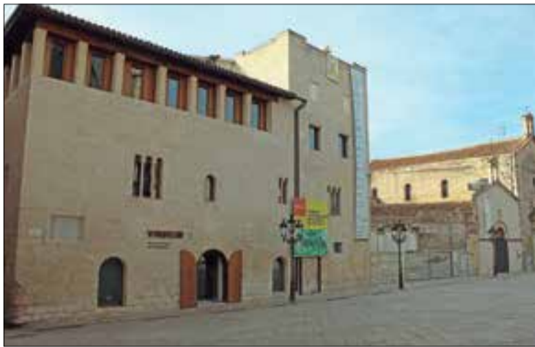
Imatge d'arxiu de les obres del Vinseum del 2020.

Per altra banda, se substituiran 400 llums de la vila per il·luminació led