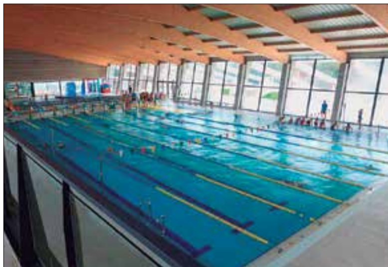
En l'últim any el Complex ha perdut 1.500 abonats.