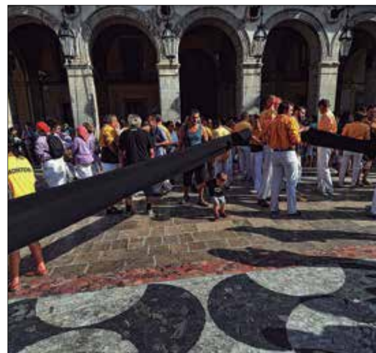
Els Bordegassos de Vilanova Vilanova i la Geltrú - 2016