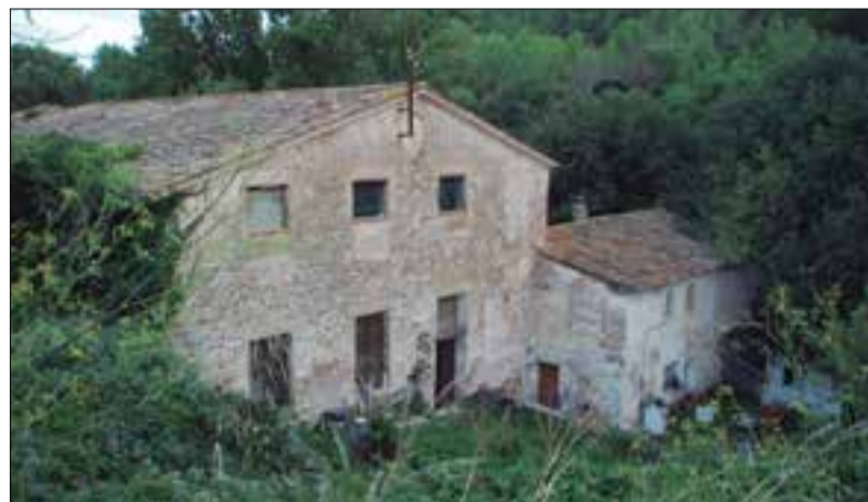
Cal Tori. ✳ AJUNTAMENT