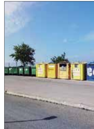
Es destinaran 80.000 euros a camuflar les àrees de contenidors.

Per tirar endavant el projecte més votat l'Ajuntament té una partida reservada de 80.000 euros. Aquest ha estat el primer procés de participació ciutadana que l'Ajuntament ha canalitzat a través de la plataforma Decidim, un web creat amb el suport de la Diputació de Barcelona i que ofereix garanties de seguretat tant per a l'administració com per la ciutadania. El