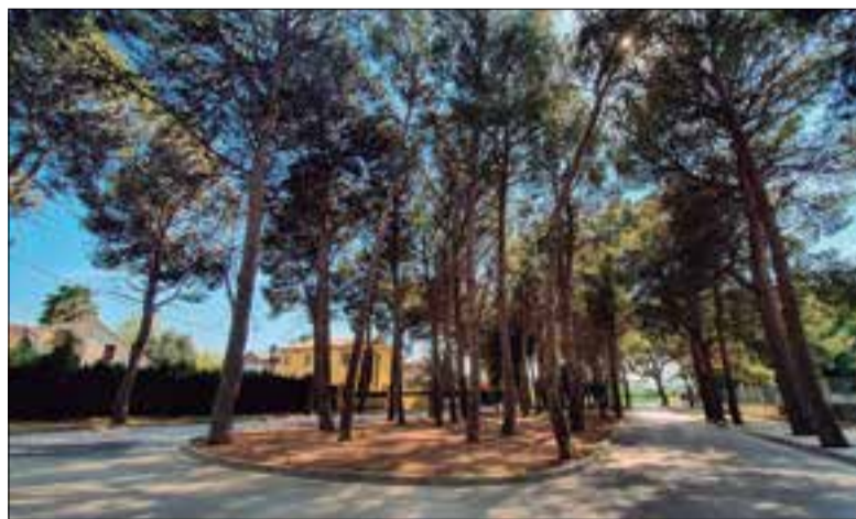
La pineda susceptible de ser talada. ✖ AJUNTAMENT