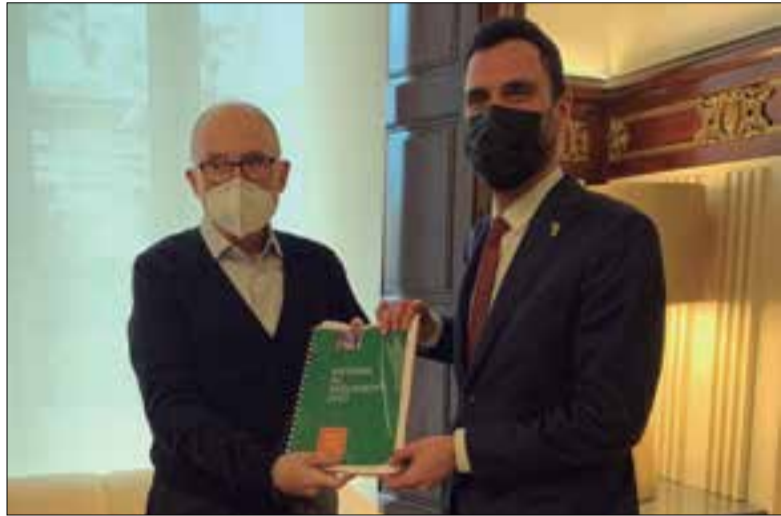
El Síndic de Greuges fent entrega de l'informe al president del Parlament.

El Síndic de Greuges, institució que recull les queixes de la ciutadania al voltant de l'administració pública, ha presentat el seu informe anual al Parlament de Catalunya, on es recopilen les actuacions més rellevants de l'entitat i tots els registres de queixes i consultes de la ciutadania, així com les xifres més destacades relacionades amb la tasca de la defensa dels drets que realitza el Síndic. La comarca