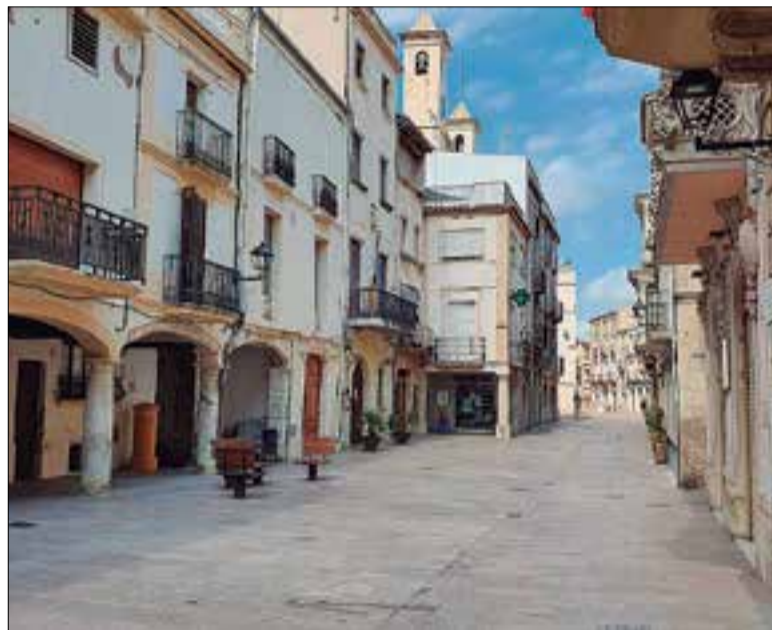
Carrer Major de l'Arboç, on s'allotja l'Ajuntament. ✱ LA FURA

El jutge de pau es va elegir en votació secreta. Sobre la taula hi havia quatre candidats. Les votacions es van fer en secret i no hi