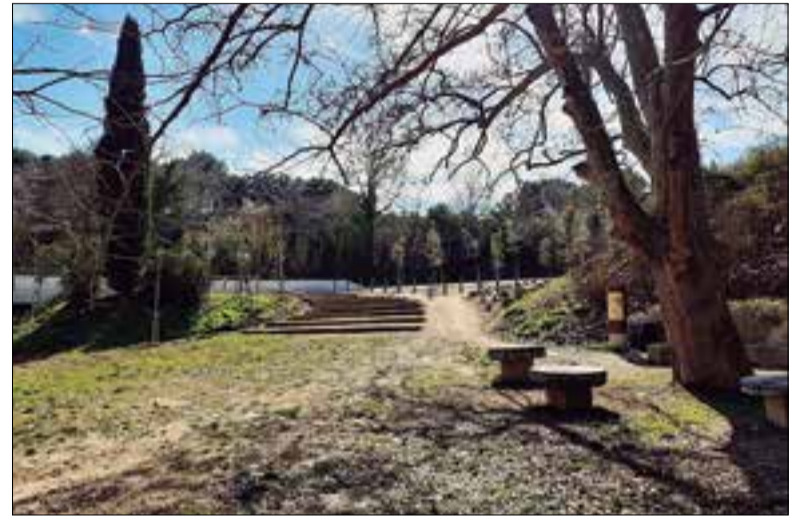
DIPUTACIÓ DE BARCELONA

La Diputació de Barcelona ha acabat els treballs d'integració paisatgística realitzats entorn del riu Anoia, amb motiu de les obres d'ampliació del pont de la carretera BV-2249 a Gelida. Les obres d'ampliació del pont havien comportat la construcció d'un desviament provisional del curs del riu, així com l'afectació d'una zona de lleure al voltant de la font del Claro. Les obres realitzades han tingut