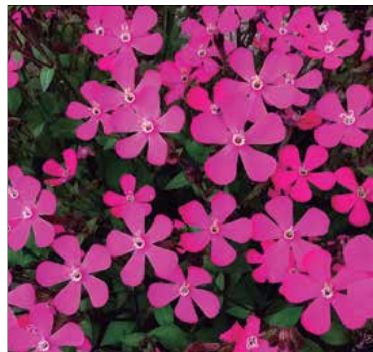
Colors primaverals Viladellops - 2021