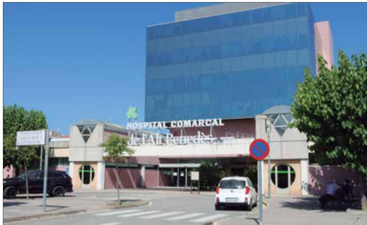
Els estudiants podran fer pràctiques als hospitals dels Camils, Sant Antoni Abad i Vilafranca.

Els estudiants de sisè de Medicina de la UB podran fer les pràctiques tutelades als tres hospitals del Consorci