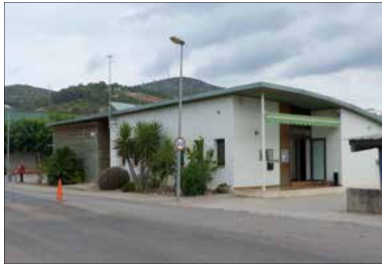
A la planta de compostatge arriba la fracció orgànica de més de trenta municipis de l'Alt Penedès i Garraf. ✦ MANCOMUNITAT