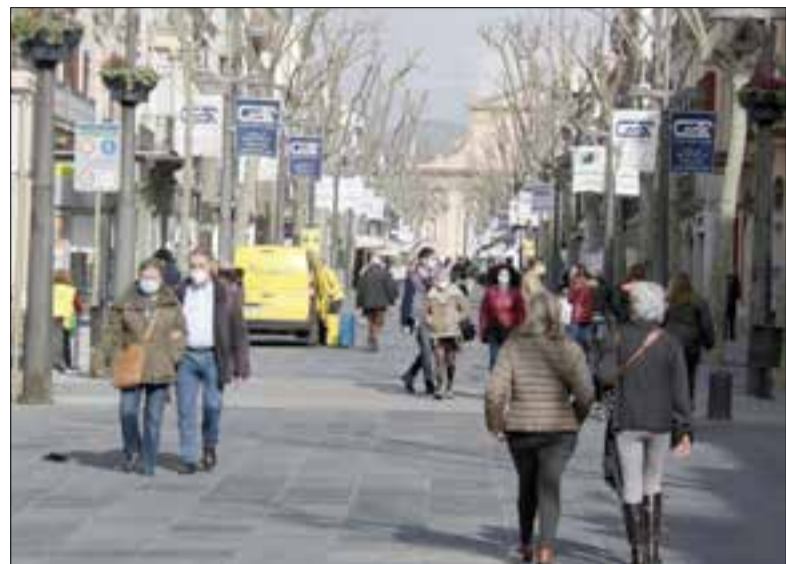
El nombre de pisos permesos variarà en funció de la zona de la ciutat.