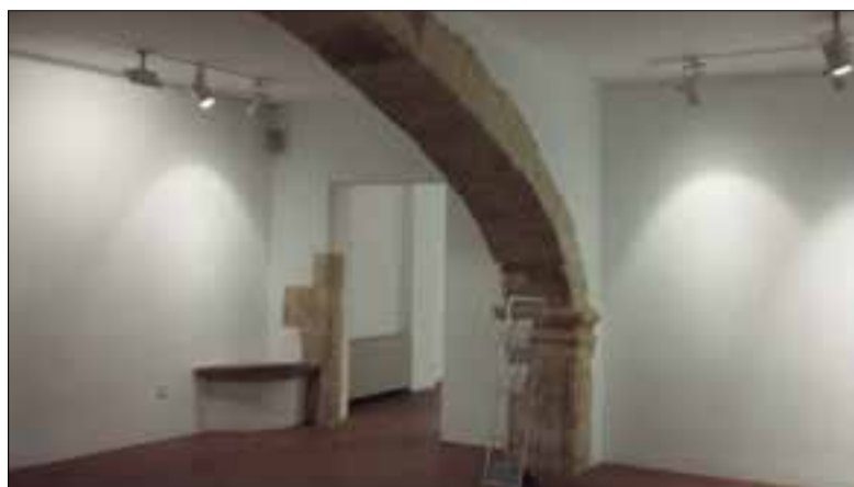
El Portal del Pardo es reomplirà d'art en clau local. ✱ LA FURA

En paral·lel, a partir del 8 de març el Portal del Pardo acollirà dues mostres més: la del projecte "Ànima Plural", de Roser Oter, en què els participants es converteixen