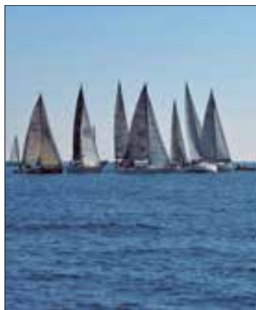
La regata tindrà lloc dissabte.

77 embarcacions provinents de 15 clubs de tot el litoral català salparan aquest dissabte, 6 de març, a una milla del Port de Vilanova. Totes participaran en la Regata Columbretes-Gran Premi Aedas Homes organitzada pel Club Nàutic de Vilanova. Aquesta és la primera prova del calendari oficial de regates d'altura després d'un any de restriccions.