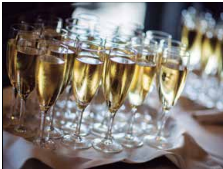
L'exportació de cava representa un 71% de les vendes.

Pel que fa al mercat nacional, a conseqüència dels tancaments i restriccions del sector de la restauració i de les limitacions de mobilitat geogràfica i social, la caiguda de les vendes va ser d'un 12,4%. Davant el descens en l'àmbit de la