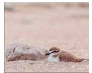
Femella de corriol covant un ou.