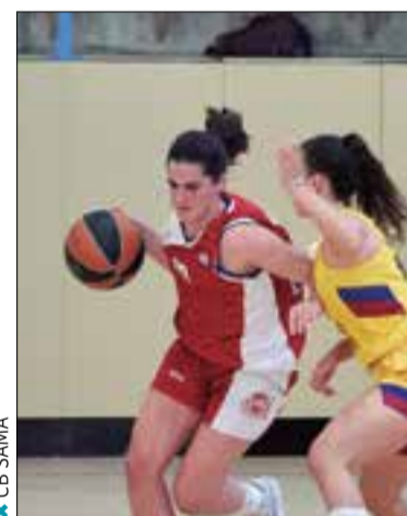
✦ CB SAMÀ