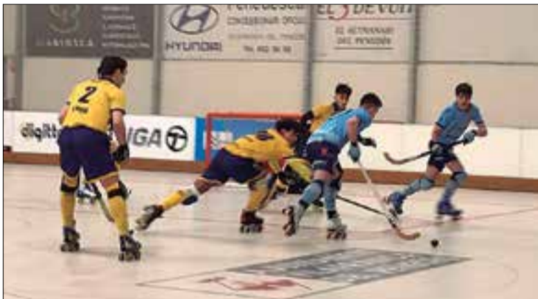
El Patí va guanyar el Jolaseta per 4 a 2. ✦ RAIMON MASCARÓ