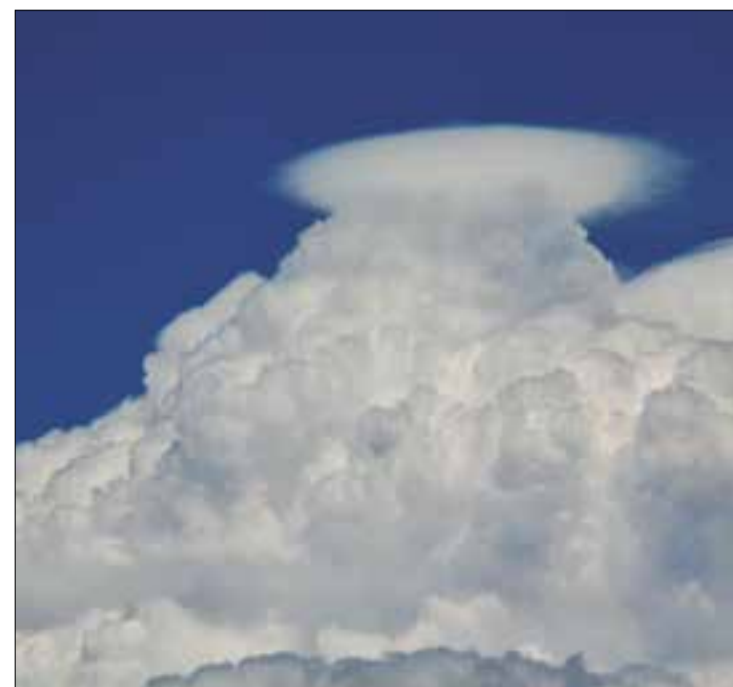
La culminació del cumulonimbus Viladellops - Juny de 2020