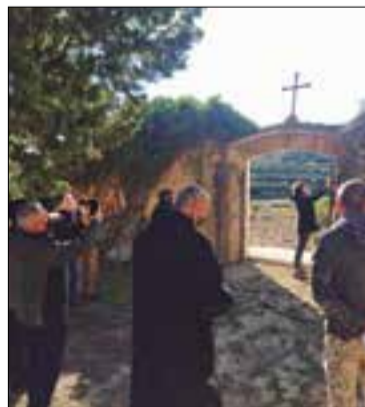
Acte al cementiri vell d'Albinyana.

Un grup de veïns i veïnes d'Albinyana van fer diumenge per tercer any un acte a la fossa comuna de la Guerra Civil, al cementiri vell del poble, en record a l'aniversari de l'entrada de l'exèrcit franquista a Albinyana, el 20 de gener de 1939. Segons la memòria oral, les tropes marroquines van atacar els soldats republicans que es batien en retirada procedents de la zona de l'Ebre, baixant des de l'ermita de Sant Antoni, escombrant la serra del Quadrell, i van matar una cinquantena de soldats republicans. També hi va morir el fill de l'ermità. Les veïnes i els veïns de la població es van encarregar de donar sepultura als cossos, en contra de les ordres inicials dels militars feixistes de calar-los foc. A la fossa resten encara les despulles dels combatents antifeixistes anònims, morts en defensa de la democràcia i la llibertat dels pobles.