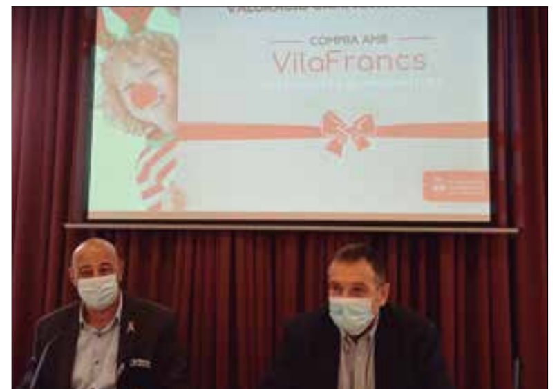
El regidor de Promoció Econòmica i l'alcalde de Vilafranca.