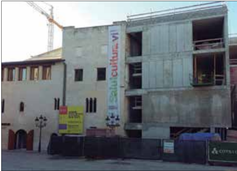
L'edifici nou hauria d'estar acabat a l'estiu. ✖ LA FURA