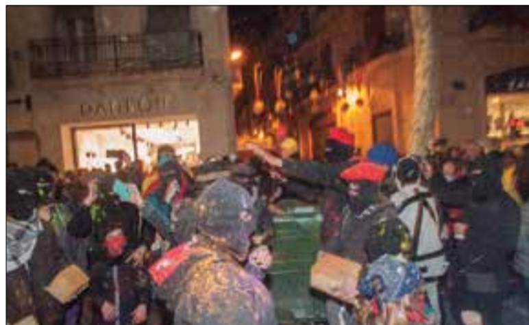
Aquest any no es farà cap acte al carrer. ✱ ARXIU AJUNTAMENT

Tot i que el detall de com i quan seran els actes no es donarà a conèixer fins dissabte durant la presentació del cartell, sí que s'ha avançat que les escoles i els veïns s'encar-