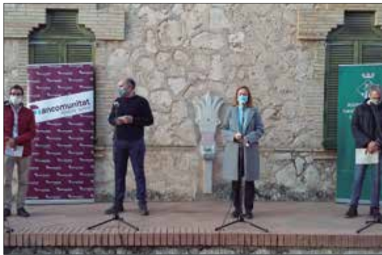
Al centre, el vicepresident de la Mancomunitat i l'alcalde dels Monjos.

La Mancomunitat Penedès Garraf vol implantar un nou sistema de recollida de residus a tots els municipis de l'Alt Penedès i Garraf, per complir amb les directives europees que eleven les exigències de reciclatge. Conscients que l'actual sistema de contenidors no dona per a més, a partir del 3 de març començarà una prova pilot de contenidors intel·ligents en tres barris dels Monjos. L'assaig durarà mig any, fins al 31 de juliol; se'n trauran conclusions, i es proposarà a la resta d'ajuntaments el nou sistema a partir de 2022.