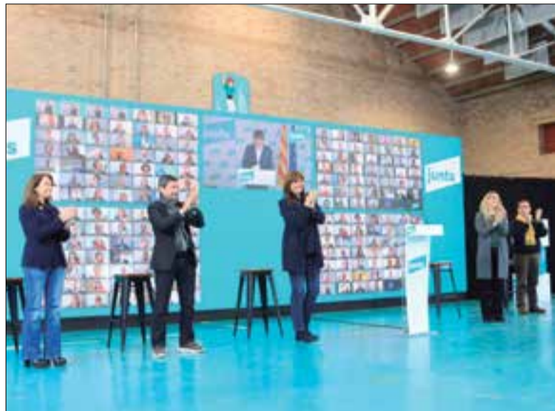
Borràs (al centre) i Puigdemont a la pantalla, amb altres candidats.

Durant la presentació, els socialistes van ser el blanc de la majoria de crítiques de Junts. Puigdemont va qualificar el candidat del PSC Salvador Illa com "un dels pitjors ministres de Sanitat de la Unió Europea". També va insistir en la tasca que es fa des de l'exili: un exili que "recorda al món l'exis-