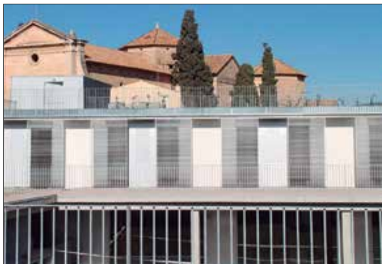
Residència Els Josepets.

El PSC recorda que entre els mesos de març i juny de l'any passat ja van morir una trentena de residents per covid-19 als Josepets, quan "no existien ni els mitjans materials ni el coneixement sufi-