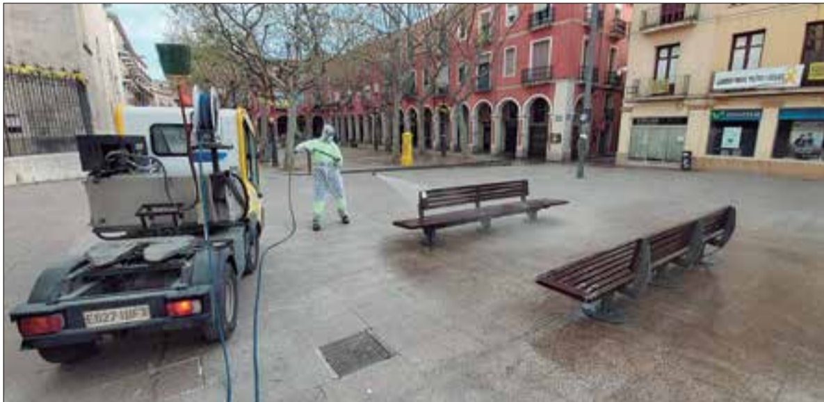
La neteja viària es fa amb vehicles elèctrics. ✱ AJUNTAMENT

La neteja viària de Vilafranca dona feina a 37 persones amb risc d'exclusió social