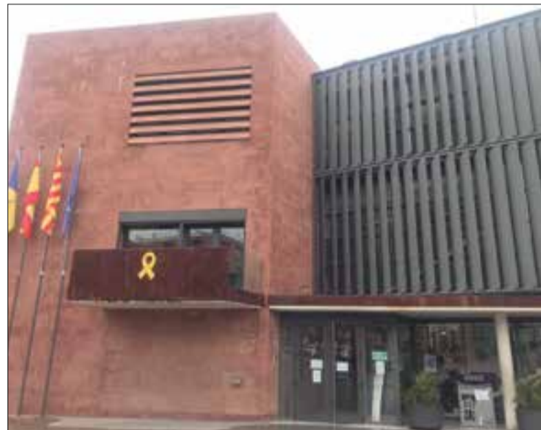
✱ AJUNTAMENT DE GELIDA

El ple de l'Ajuntament de Gelida celebrat dimecres va aprovar per unanimitat que els bars i les terrasses del municipi tinguin terrassa gratuïta, quan puguin obrir i posar-les. L'objectiu és ajudar a mitigar l'impacte econòmic i social que les restriccions de la pandèmia provoquen i per contribuir a la recuperació econòmica de l'activitat.