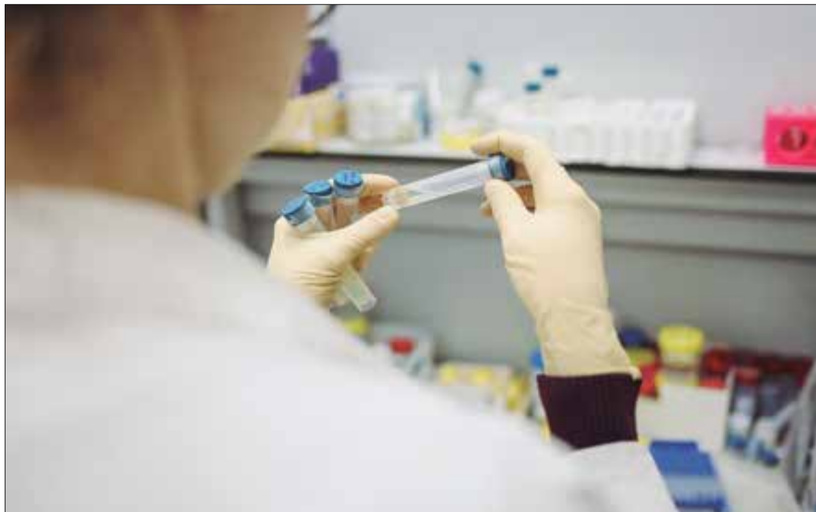
Aquesta setmana la vegueria ha registrat un augment notable dels casos.