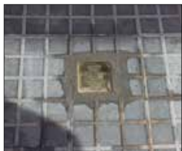
Una stolpersteine a Vilafranca.