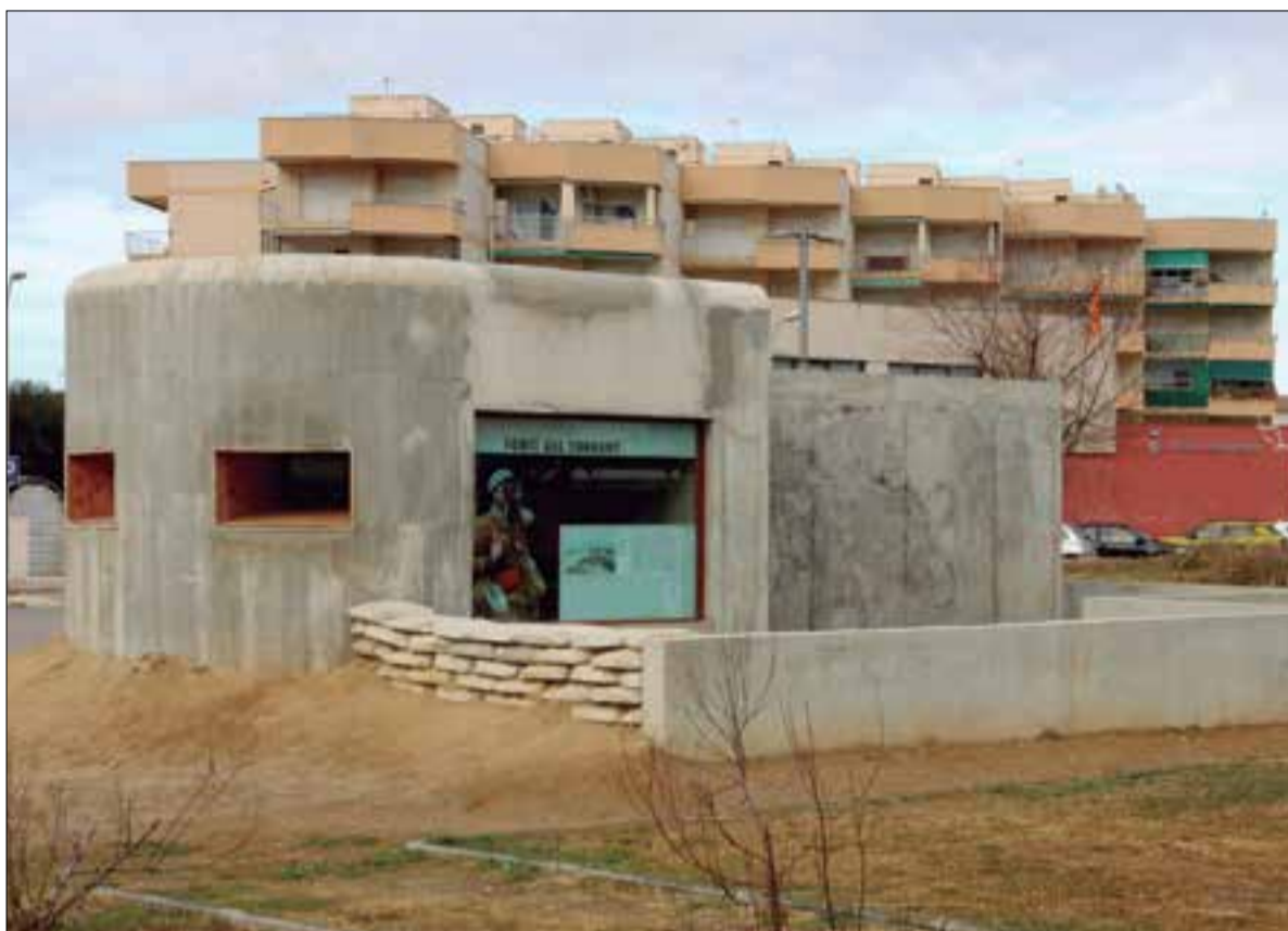
Fortí antifeixista reconstruït a Cunit.