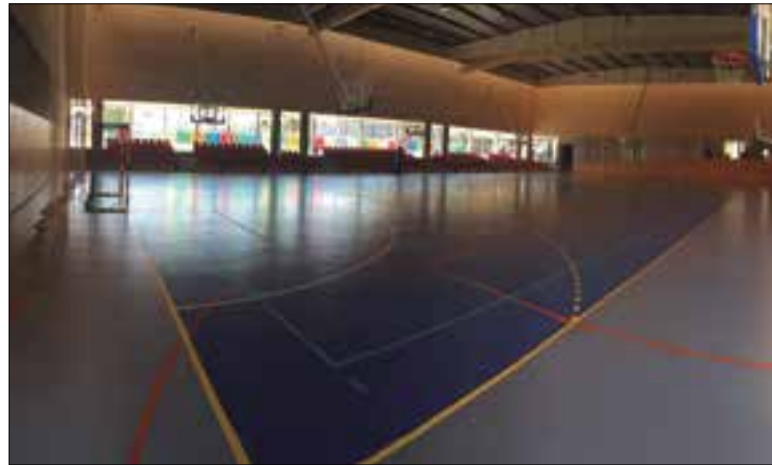
Imatge d'arxiu del pavelló de la zona esportiva.