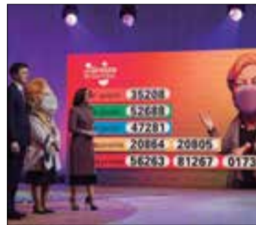
✱ LOTERIES DE CATALUNYA-ACN