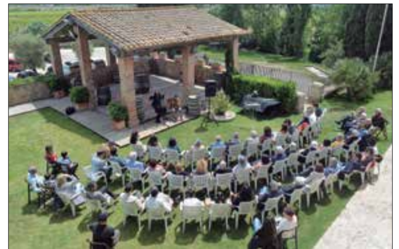
Cerimònia de lliurament de premis de l'edició de 2019. ✦ CONSELL COMARCAL