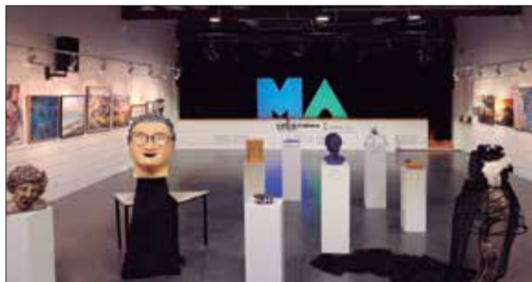
Sala principal de la Masia Mas Catarro. ✦ AJUNTAMENT

Un total de 316 artistes concorren enguany a la 37a Mostra Artística Sant Raimon de Penyaforat "Llum & Art: La llum ens allunya de la fosca ignorància", que organitza l'Ajuntament de Santa Margarida i els Monjos. L'exposició es pot veure fins al 5 de febrer en diferents espais de la Casa de Cultura Mas Catarro. S'hi han presentat 116 obres de 63 artistes en categoria d'adults: 39 obres de pintura, 29 de fotografia, 21 de dibuix, onze d'il·lustració digital, nou d'escultura i