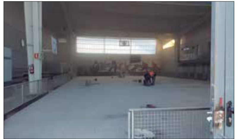
El terra de la pista, aixecat. ✱ JUNTS PER CATALUNYA