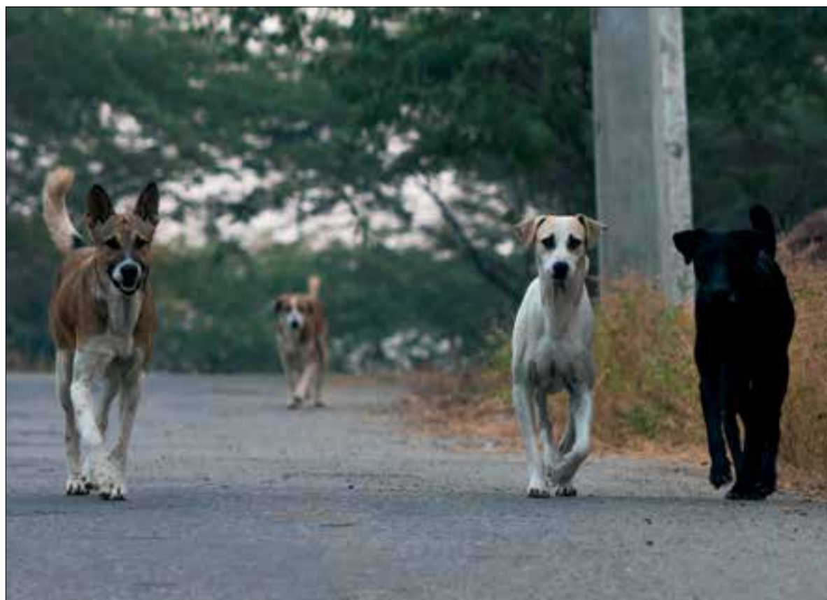
Foto d'arxiu d'un grup de gossos per una carretera.