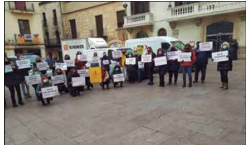
Una trentena de perruqueres es van concentrar a Vilafranca.