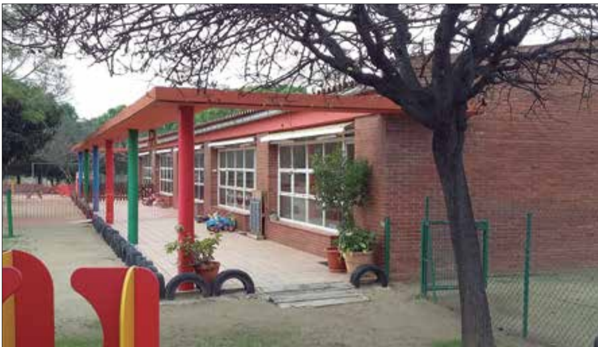
Escola bressol El Puig. ✱ LA FURA

L'Ajuntament del Vendrell vol que el cost (110 euros al mes de mitjana) no sigui una barrera