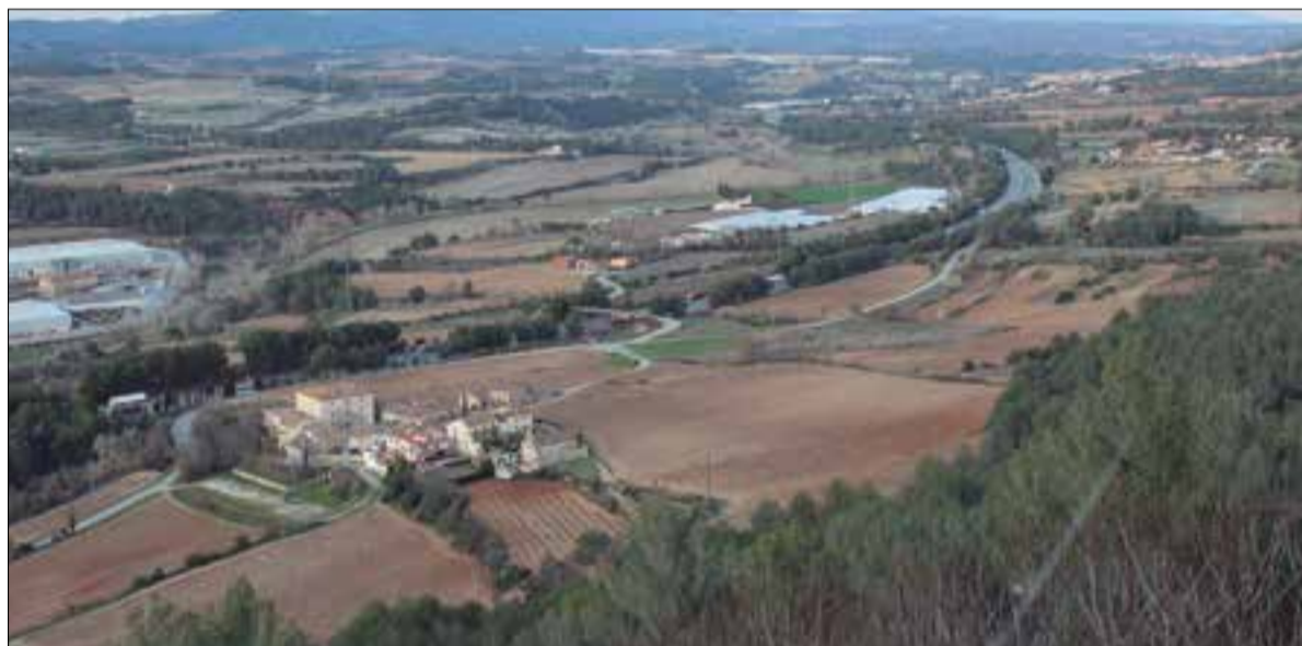
Sindicats i patronals aposten per la compatibilitat de cultius, espais naturals i àrees d'activitat econòmica ✖ LA FURA

FEGP, CCOO, UGT i UEA consideren que hi ha massa veus contràries al desenvolupament, dins el debat del Pla