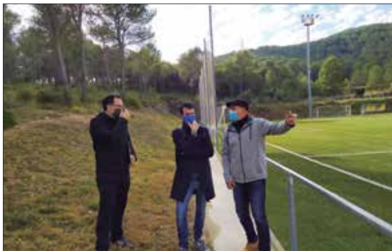
Tècnics de la Diputació i el regidor d'Esports, visitant el camp. ✖ AJUNTAMENT