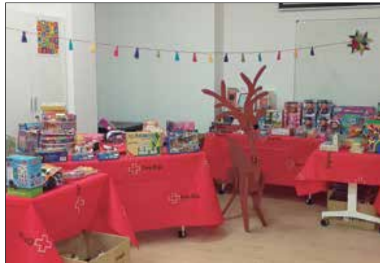
Parament de les joguines de la campanya. ✱ CREU ROJA

La 28a edició de la campanya "Cap infant sense joguina" ha fet arribar a 473 infants de l'Alt Penedès en situació de vulnerabilitat (entre 0 i 12 anys) jocs i joguines noves per l'època de Nadal. Com cada any, la campanya es va engegar coincidint amb el Dia Internacional de la Infància, un mes abans de Nadal. Es van repartir mil joguines entre 250 famílies de la comarca.