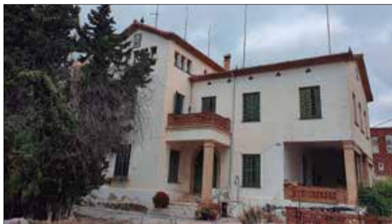
Edifici centenari de Can Pau Roig.