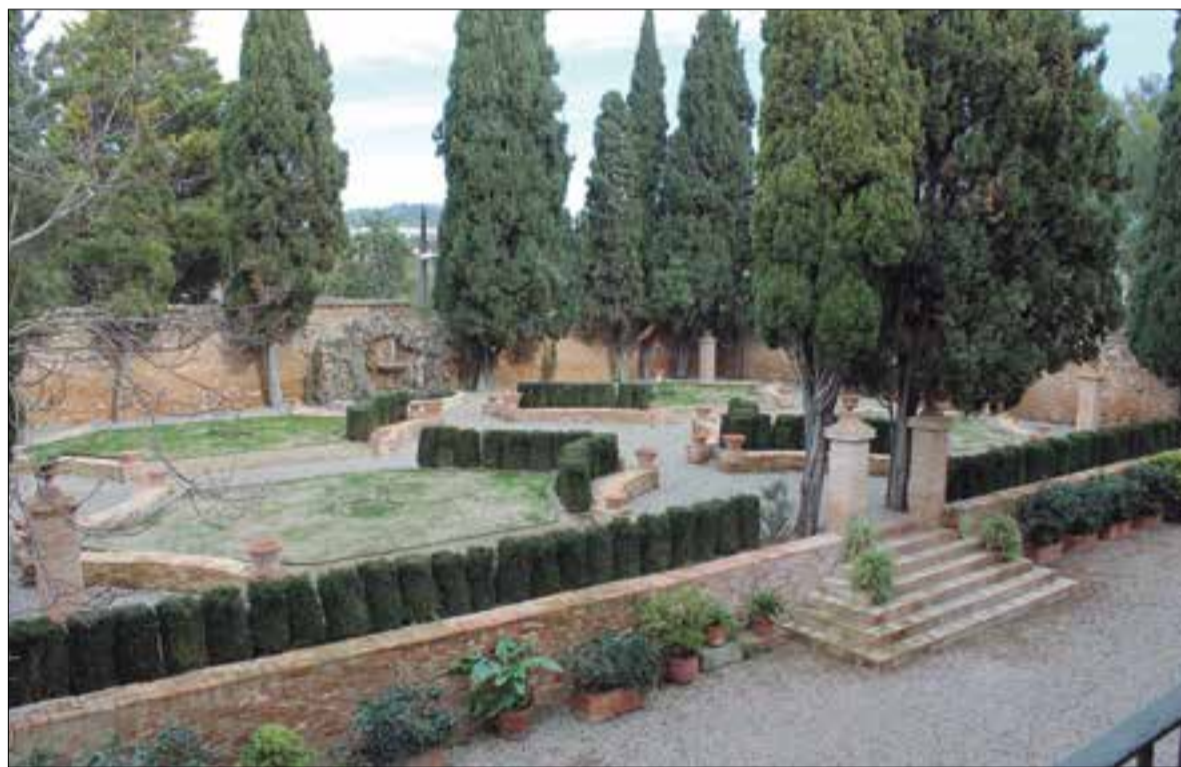
Jardí de la Masia d'en Cabanyes. ✦ MASIA D'EN CABANYES

També s'ha arranjat l'escala d'accés des de l'aparcament i s'han restaurat una cadira del segle XVIII i un crani