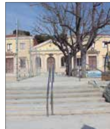
Escola del poble. ✱ AJUNTAMENT

L'Ajuntament posa en marxa aquest any els primers pressupostos participatius de la història de Torrelavit, amb una dotació de 19.730 euros dins el pressupost de 2021. La proposta es va aprovar dilluns amb els vots a favor del govern d'ERC i VIT i l'abstenció de Junts per Torrelavit. La idea és que al llarg de l'any es presentin propostes, que l'Ajuntament haurà de validar en funció de la seva viabilitat, i que durant l'últim trimestre es puguin votar els projectes escollits, que s'integraran al projecte pressupostari municipal del 2022, on hi haurà una nova partida d'aproximadament 19.000 euros més per a l'execució. Les bases reguladores estableixen que les propostes presentades hauran de ser inclusives, obertes i dirigides al conjunt de la població.