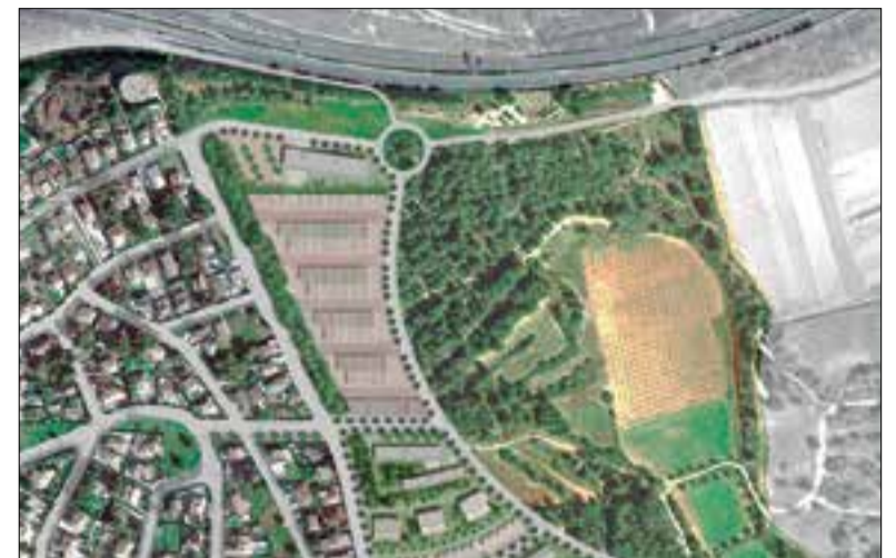
La pineda es troba a tocar de l'autopista. ✱ AJUNTAMENT