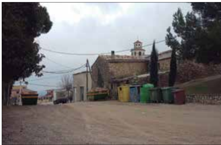
Carrer del Castell, amb l'església al fons. ✱ LA FURA

Les obres afectaran 210 metres lineals repartits en dos carrers, amb una ocupació total de 2.400 metres quadrats. Serà al carrer Narcís Monturiol, que és el tram urbà del camí de la Carrerada que comunica Avinyonet amb la Granada i continua cap a Santa Fe, i també al carrer del Castell, que encara està sense asfaltar. Tots dos carrers s'asfaltaran, es dotaran