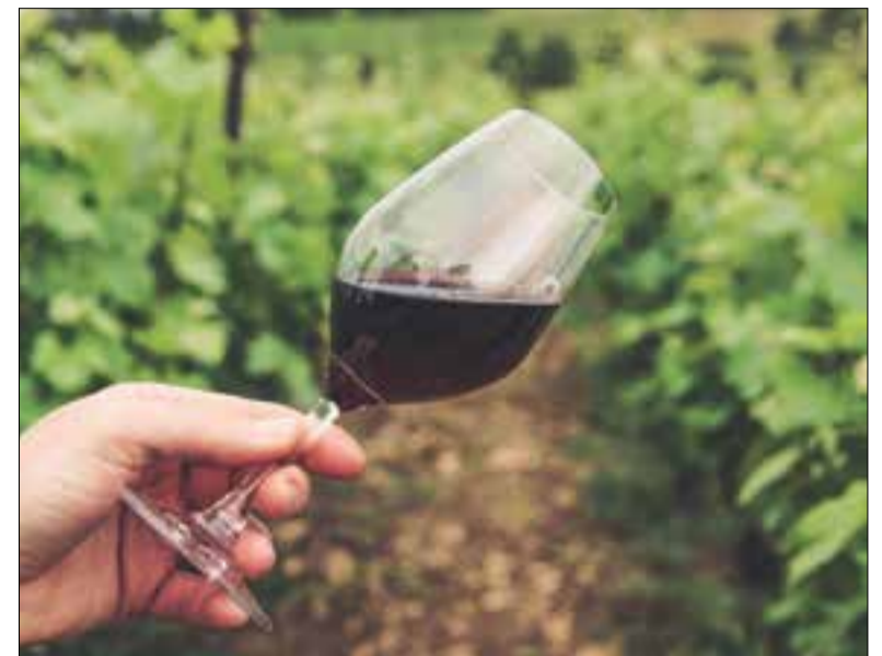
Al simposi hi han participat un centenar d'experts.