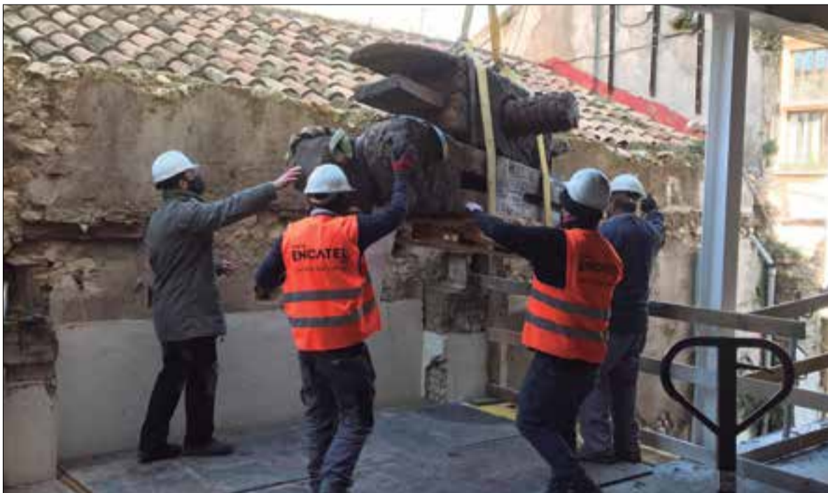
Un dels moments del complicat trasllat de les premses.

El Museu de les Cultures del Vi i la Vinya de Catalunya trasllada nou premses que daten d'entre els segles XVI i XX