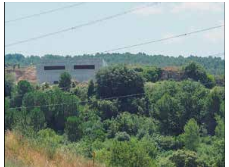
El projecte aprovat per l'Ajuntament i la Comissió Territorial contemplava un edifici soterrat. ✱ CUP SUBIRATS