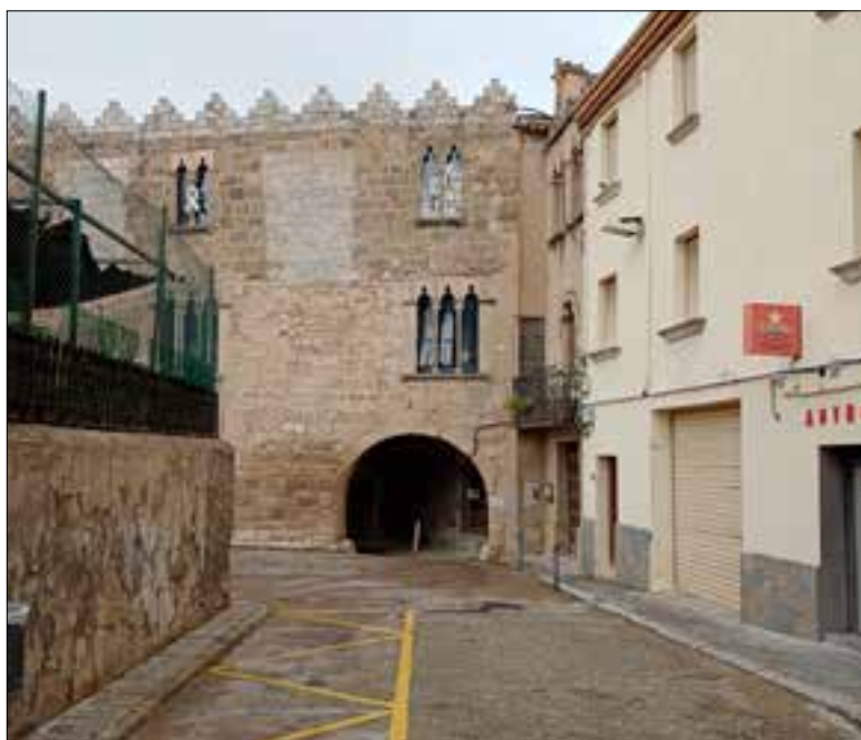
El barri Vell de Sant Pere és d'origen medieval. ✱ AJUNTAMENT

Les obres d'aquesta primera fase es preveu que estiguin acabades a finals de març. Llavors restaran les altres dues fases del projecte per desenvolupar i que inclourien actuacions en mitja dotzena més de carrers i places. En total, la inversió suma més d'1,5 milions d'euros, una xifra difícil d'assumir per un poble petit com Sant Pere. És per això que l'alcalde explica