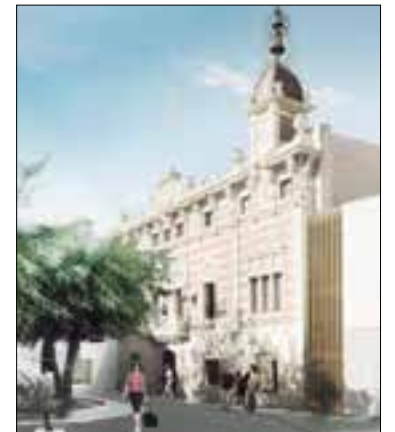
Croquis del futur de l'edifici.