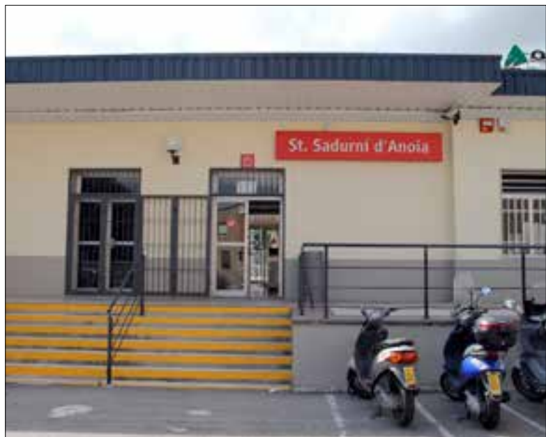
El tram entre Sant Sadurní i Martorell ha quedat restablert.