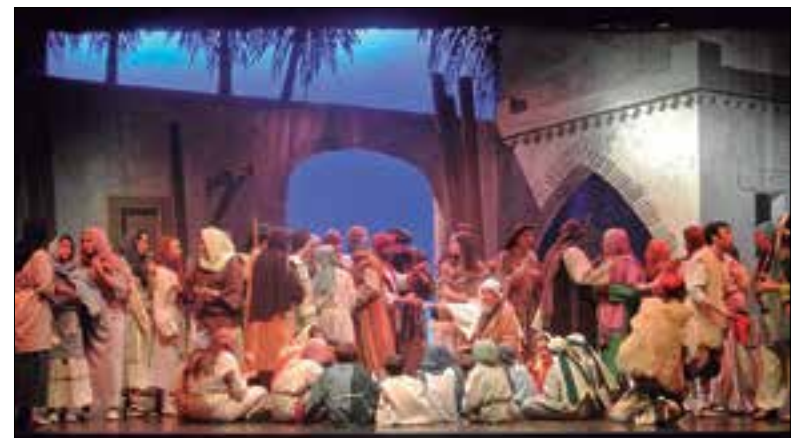
Una representació d'anys anteriors. ✦ CÍRCOL CATÒLIC