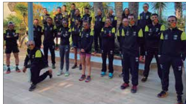
Selecció catalana, amb els integrants penedesencs. ✦ ESPORTIU PENEDÈS