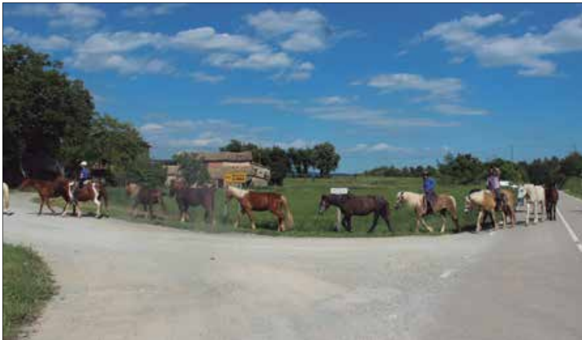
Ruta a peu fins al parc del Garraf. ✦ FUNDACIÓ MIRANDA

Hi arriben deu cavalls després de recórrer a peu 200 quilòmetres en nou jornades des del Coll de Nargó, on ja no podran tornar més