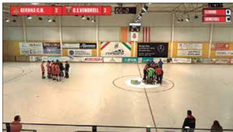
Vendrellencs i gironins, al centre de la pista. ✦ CE VENDRELL

El Noia disputarà la Supercopa el 2 i 3 de gener al pavelló del Lloret