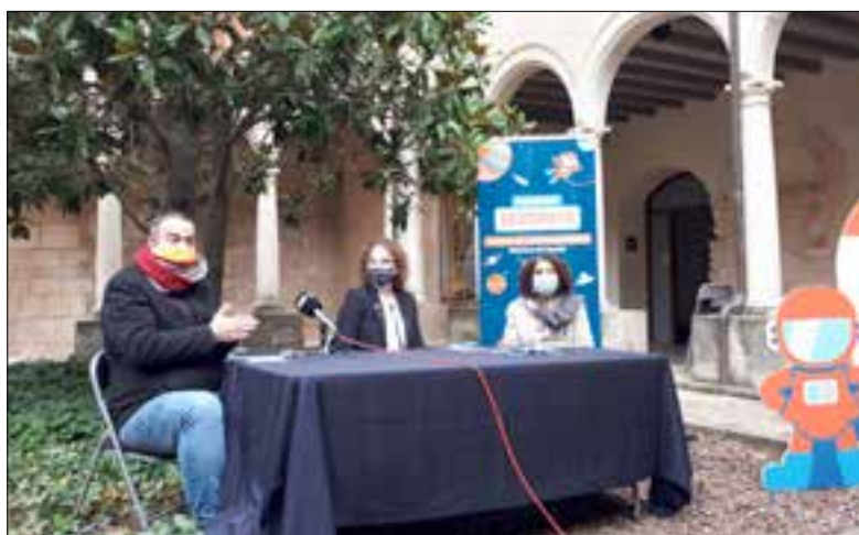
Els alumnes de 3r i 4t de primària rebran un passaport Edunauta.