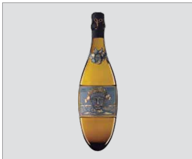
El cava Kripta, un dels escumosos més ben valorats d'Espanya.

La Guia Vins Gourmets 2021 escull els millors vins i escumosos de l'Estat