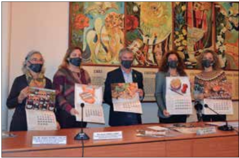
Ja està a la venda el calendari 2021 de Productes de la Terra.