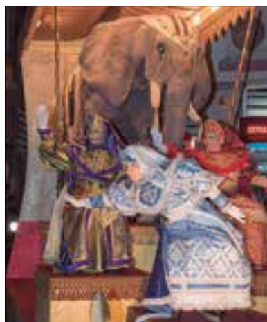
Conselleres reials i sàvies de les joguines a la cavalcada. ✦ AJUNTAMENT

passeig Marítim de Coma-ruga (a l'altura del carrer Pàndols) una recollida de cartes amb els missatgers reials, especialment pensada per als nens i nenes dels nuclis marítims i zones properes. L'acte comptarà amb l'actuació de l'Agrupació Musical Santa Anna del Vendrell i hi haurà sorpreses.