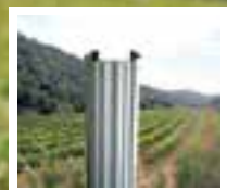
Pals per a emparat

TDF és un producte amb patent a la UE que serveix per tibar i destensar gradualment els filferros, com el doble filferro mòbil de l'emparat de les vinyes