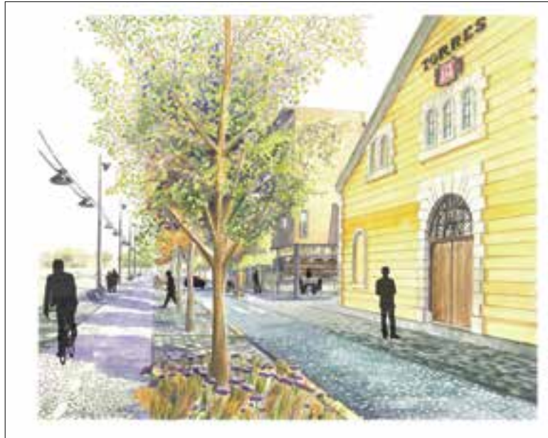
Esquema de previsió dels resultats de les obres. ✖ AJUNTAMENT

Al costat hi haurà un carril de circulació de vehicles d'un sol sentit