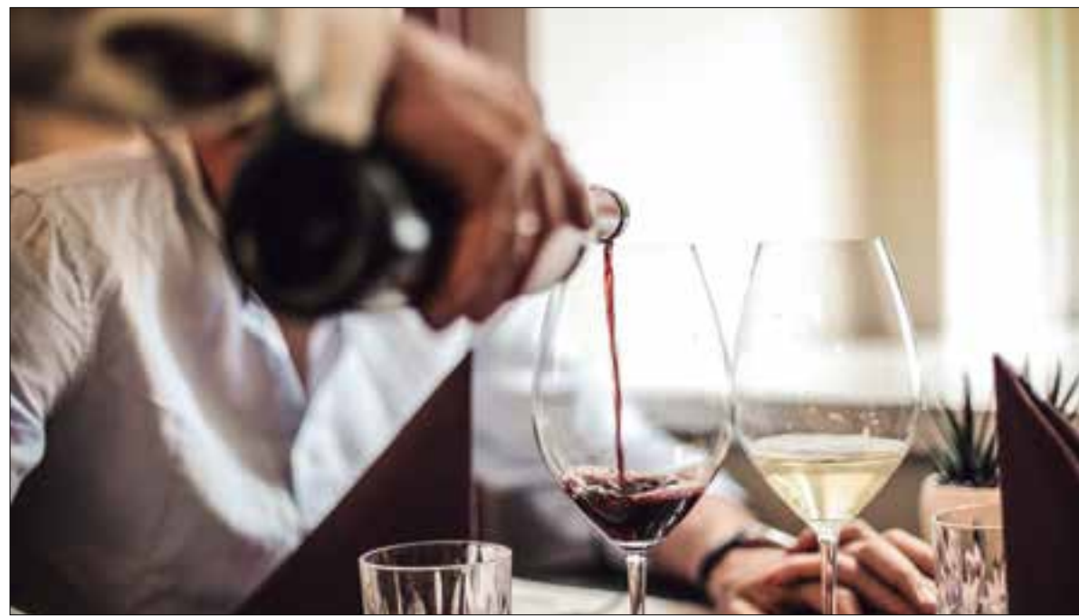
Els grups han estat treballant des del mes de novembre del 2019.

L'òrgan Vins Vinentes presenta el full de ruta per al 2030 en els àmbits d'organització del sector, economia i mercats, recerca, desenvolupament i tecnologia i comunicació del vi