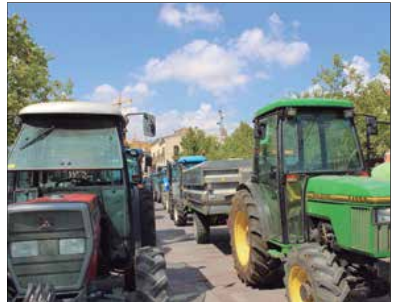
A Vilafranca la tractorada sortirà des de l'Àgora. ✖ LA FURA