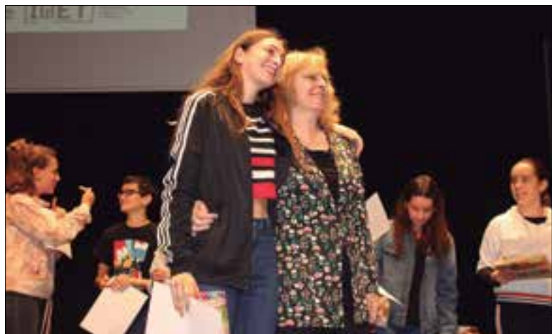
Cloenda del Menjallibres 2017/18, a l'Auditori. ✱ AJUNTAMENT