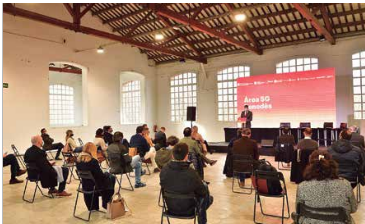
La presentació del projecte es va fer al Museu de la Pell d'Igualada. ✦ AJUNTAMENT D'IGUALADA