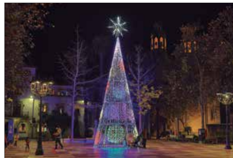
Arbre de Nadal al mig de la plaça Marcer.

Amb l'encesa de llums de Nadal a principi de mes, Sant Pere de Ribes va donar el tret de sortida als preparatius nadalencs, en un any que ja és segur que no hi haurà el tradicional Pessebre Vivent Parlat dels Xulius ni tampoc cavalcada de Reis. La desfilada reial es canviarà el 5 de gener per uns campaments màgics on els nens i les nenes s'hi podran adreçar per lliurar-los les seves cartes.