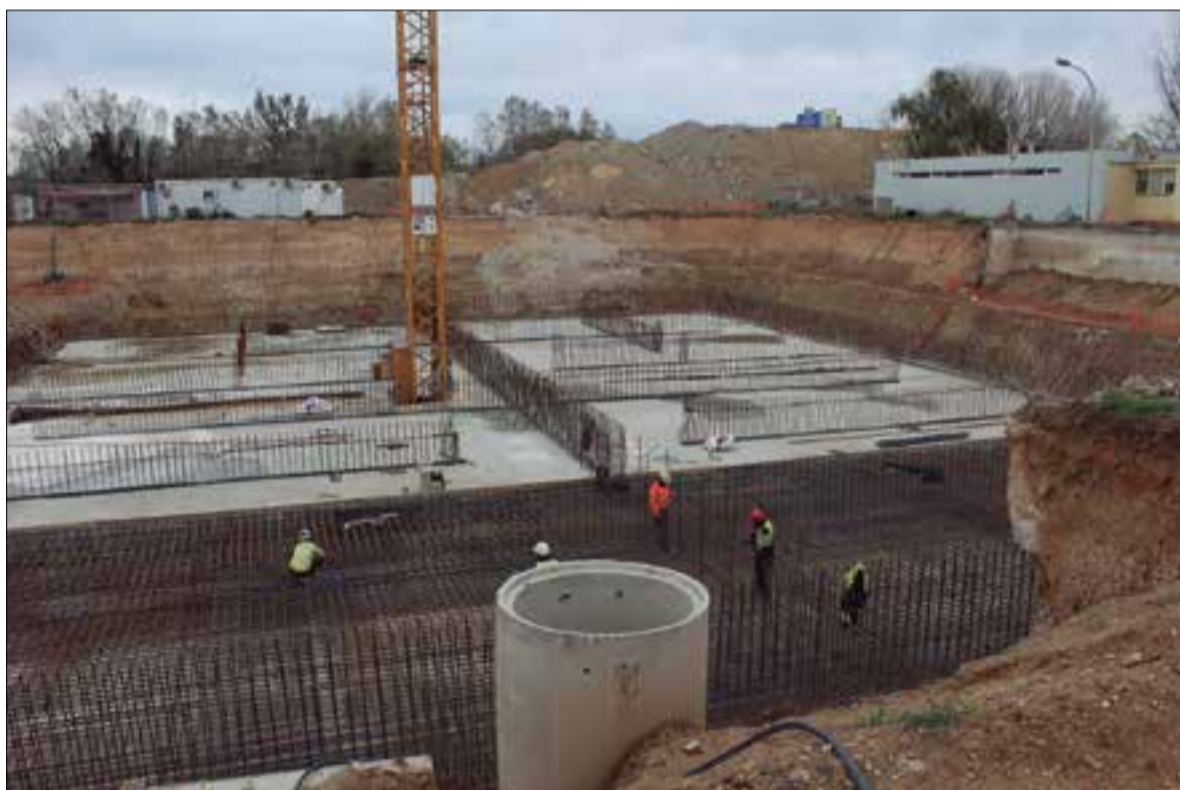
Les obres d'ampliació de la depuradora de Vilafranca tindran un cost aproximat d'11 milions d'euros.