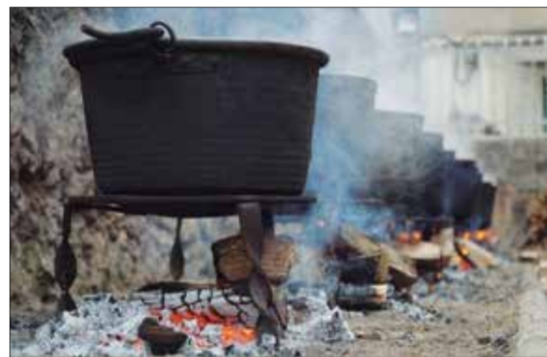
Les calderes seran el dia 13 al pati del CIC. ✳ AJUNTAMENT

Per evitar aglomeracions, només es posaran a la venda 200 racions, i per aconseguir-ne caldrà adquirir prèviament el tiquet (al preu de deu euros) a l'OAC de l'Ajuntament. En cada butlleta s'assignarà un dels tres punts de recollida de l'edifici del CIC i l'hora en què caldrà fer-la. La recaptació es lliurarà