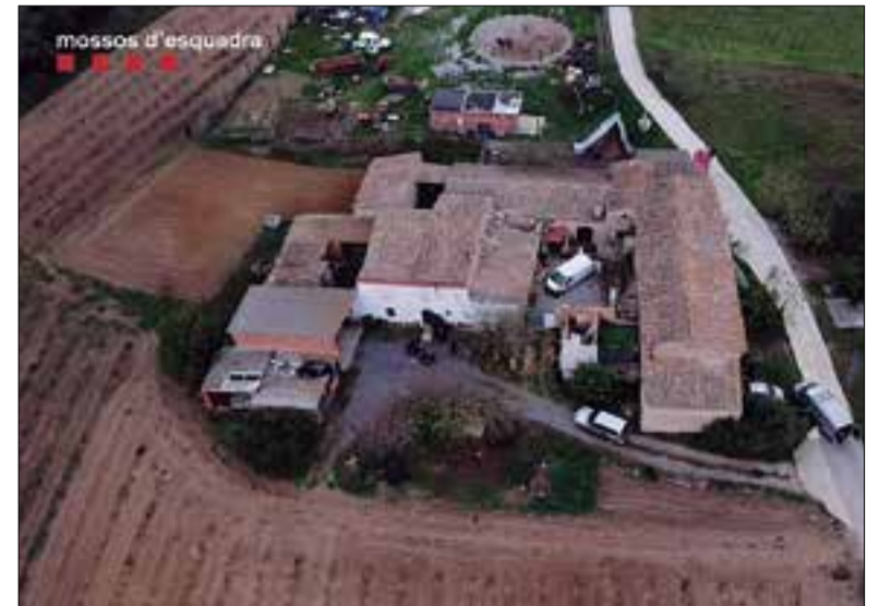
La masia on s'amagava.

Els preus de les entrades oscil·laran entre 10 i 15 euros, i es poden adquirir al web www.musicveu.cat , a la taquilla del Fòrum les tardes de dijous a diumenge i els festius també al migdia.