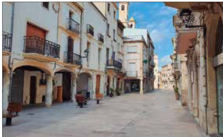
Imatge d'arxiu del carrer Major de l'Arboç.

Per aconseguir les Arbocetes, un membre de la unitat familiar haurà de recollir els vals a l'Ajuntament.