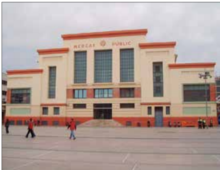
Places de Soler i Carbonell i de la Filatura.

El sostre del pàrquing soterrat no està dissenyat per suportar el pes de vehicles de mitjà i gran tonatge