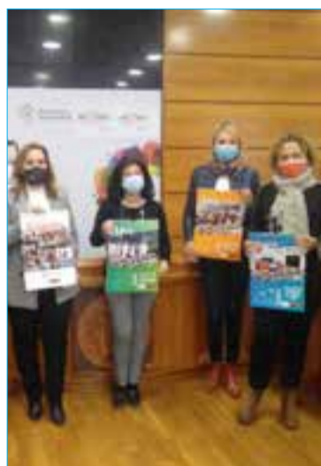
El calendari es va presentar a l'Ajuntament.

La idea de fer el calendari va sorgir després d'anul·lar fins a dues vegades una Caminada nocturna solidària del Vendrell contra el càncer, a causa de la pandèmia. L'almanac vol ser un reconeixement en homenatge a totes les persones i entitats de diversos sectors que durant la primera onada