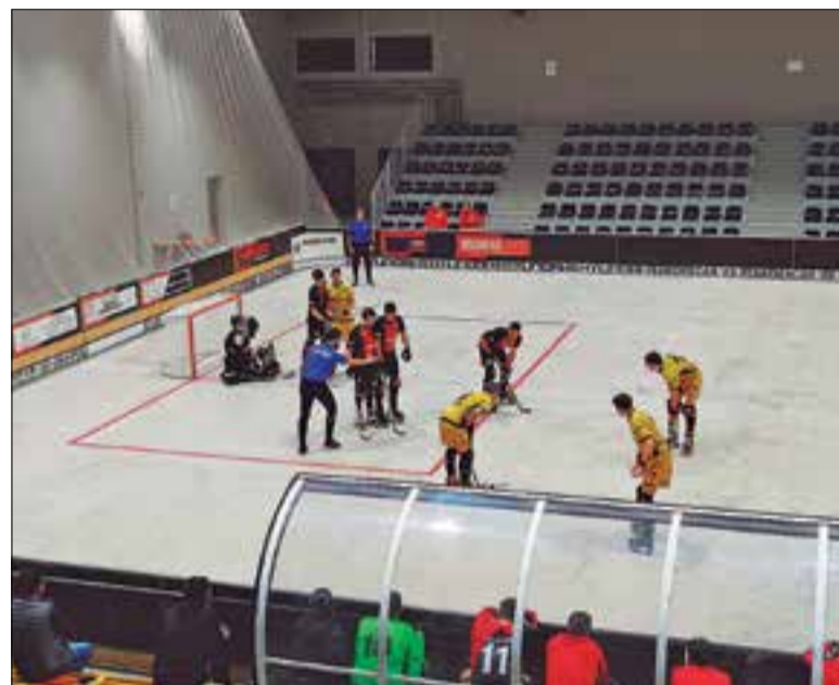
Vendrellencs i sadurninencs, a la pista del CP Vendrell. ✦ CE VENDRELL

També el CP Calafell Tot l'Any va treure un valuós punt de la pista del Lloret (4 a 4). Va remuntar el 2 a 0 inicial, situant-se al segon