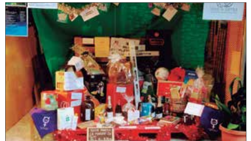
La panera està configurada per centenars de productes de tota mena.

El grup Veus de Dones de Santa Oliva ha tingut la iniciativa de fer enguany La Súper Panera, a benefici de la Marató de TV3. Després de fer una crida als petits comerços i entitats del municipi, l'associació ha obtingut una resposta molt superior a l'esperada. Per