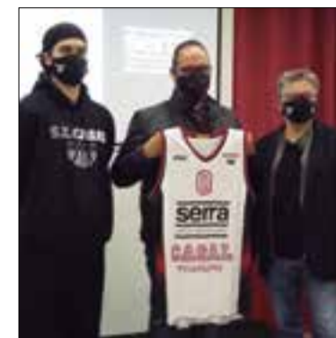
Capità del primer equip, representant del grup Serra i president de la SE Casal, a la presentació. ✦ LA FURA