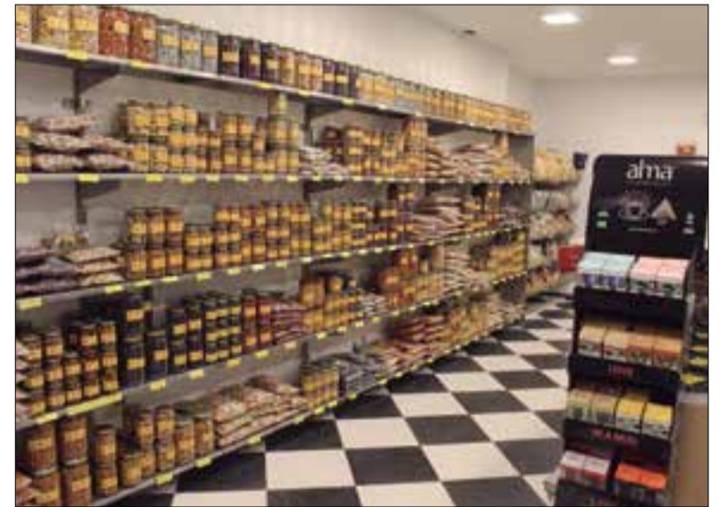
Botiga d'Aperitius Catalans, oberta al barri de Sant Julià, de Vilafranca.

El seu creixement exponencial l'ha portat a disposar de mil referències diferents, entre les quals l'ametlla (amb més de 180 referències), és la més abundant. Ametlles, avellanes, nous, festucs, cacauets, pi-