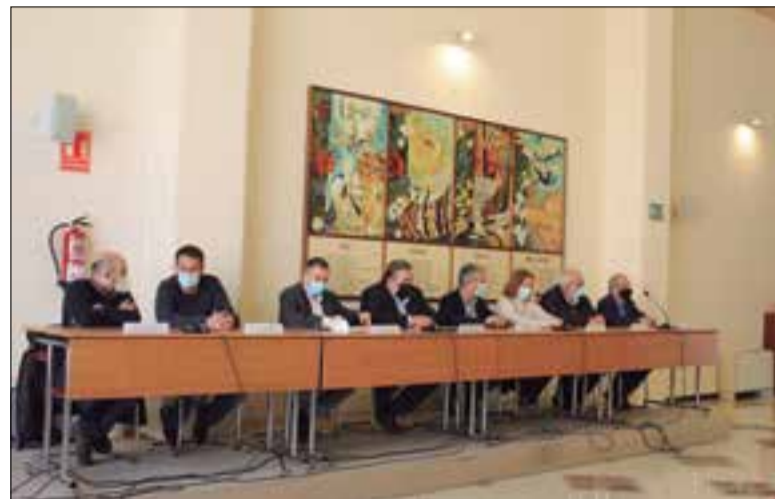
Tots els alcaldes de la comarca han fet arribar una carta a la Generalitat.

A banda de fer arribar la seva queixa i demandes per carta, els alcaldes i alcaldesses tenen previst reunir-se telemàticament amb el conseller d'Interior, Miquel Sàmpser, la setmana vinent.