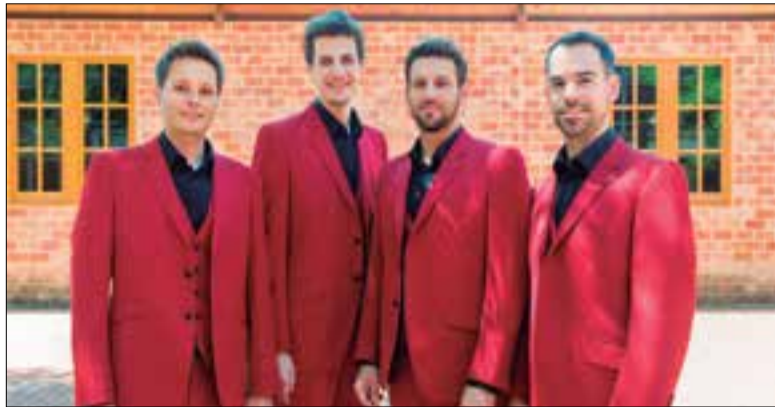
Quartet de veus masculines The Hanfris.

Entre els mesos de gener i agost de l'any que ve tindrà lloc la setena edició del festival solidari MusicVeü, que organitza la Fundació Pinnae, amb deu concerts de primer nivell que per primer cop es traslladaran en alguns casos fora de l'auditori del Fòrum Berger Balaguer, i fins i tot un fora de Vilafranca. A més, el MusicVeü destinarà part de la recaptació a l'associació Ressò, que gestiona el Rebot Solidari de Vilafranca.