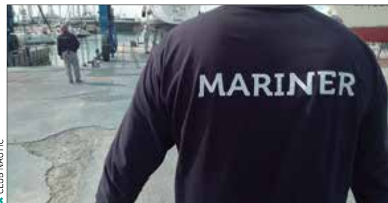
✦ CLUB NÀUTIC