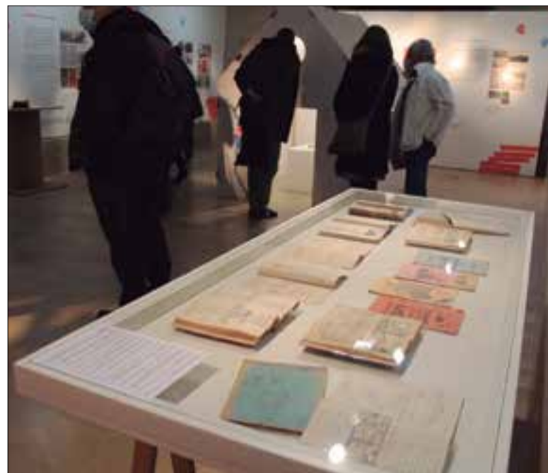
L'exposició a la capella del Vinseum obre aquest divendres. ✱ LA FURA

L'exposició del Vinseum reivindica la feina que van fer durant la 2a República una colla de mestres i alumnes mitjançant la tècnica Freinet. Aquell moviment educatiu era revolucionari, ja que donava tot el protagonisme a l'alumne, i ho feia a través d'una impremta escolar. Amb aquell aparell s'editaven butlletins que eren un recull de