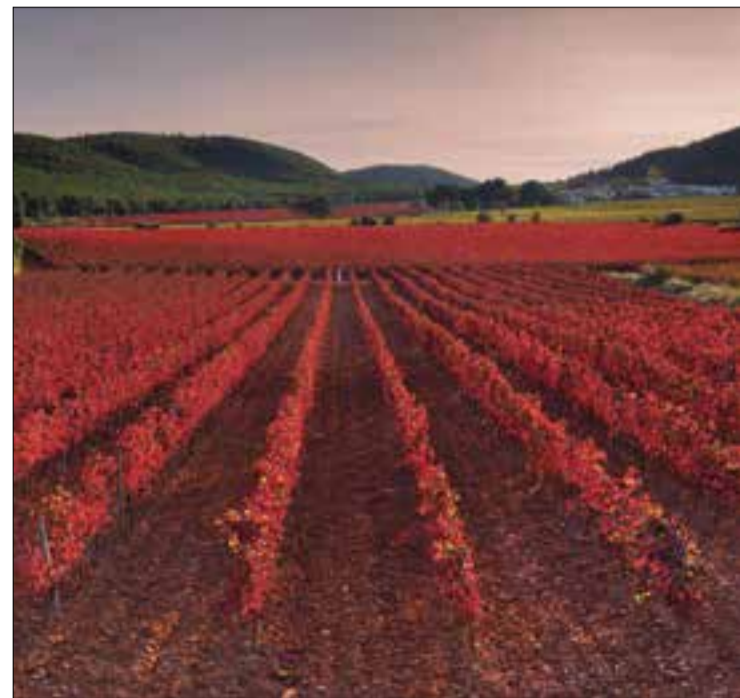
Vinyes d'Aiguaviva Tardor de 2020