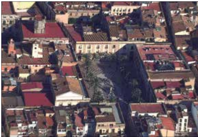
Vista aèria de la plaça de la Vila vilanovina. ✦ AJUNTAMENT

Quant a habitatge, el pressupost contempla quadruplicar els fons