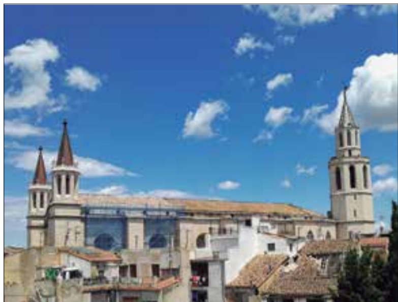
Teulada de la basílica de Santa Maria, en obres.