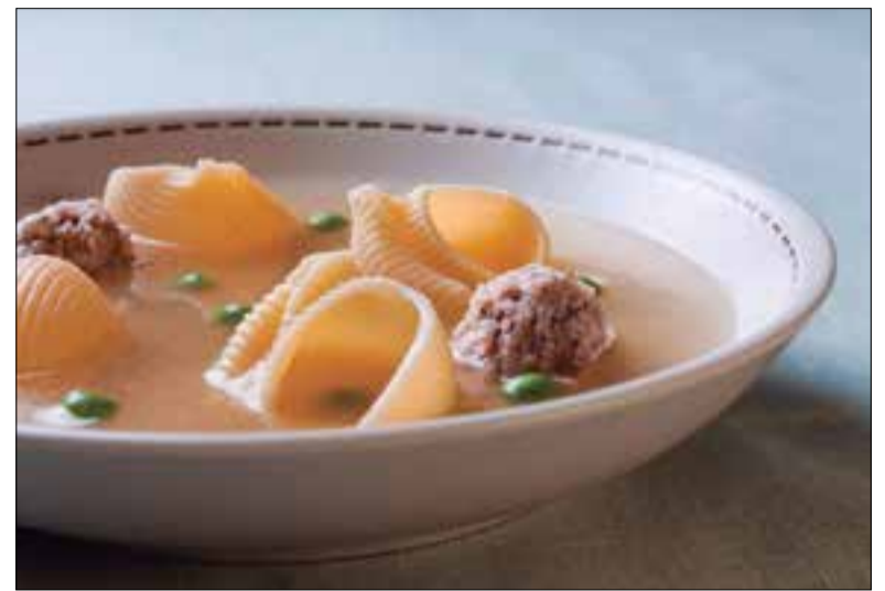
Escudella i carn d'olla nadalenca.