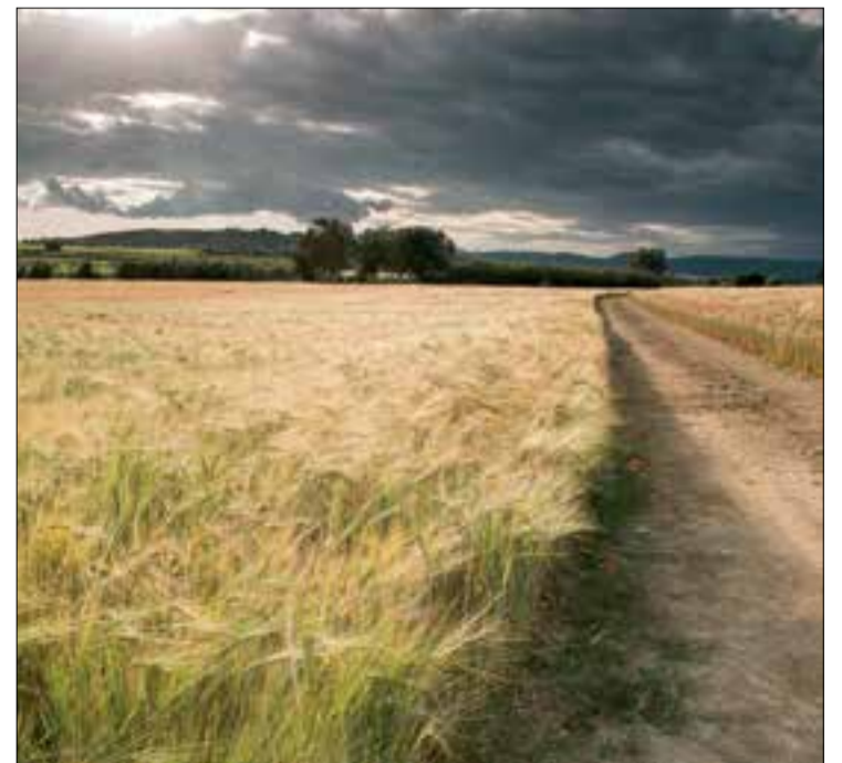
Espigues de llum Les Cabanyes