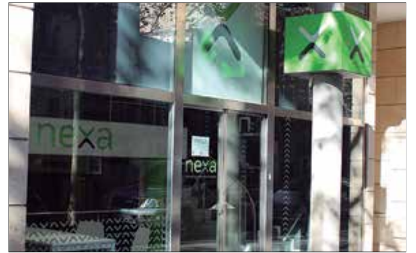
El nou establiment està situat a l'avinguda de Tarragona.