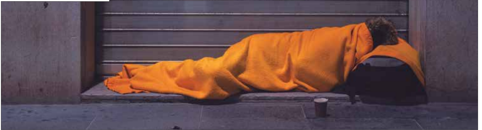
La Fundació Arrels impulsa la iniciativa dels Pisos Zero, espais de baixa exigència perquè les persones sense llar que tenen alguna addicció puguin passar-hi la nit.