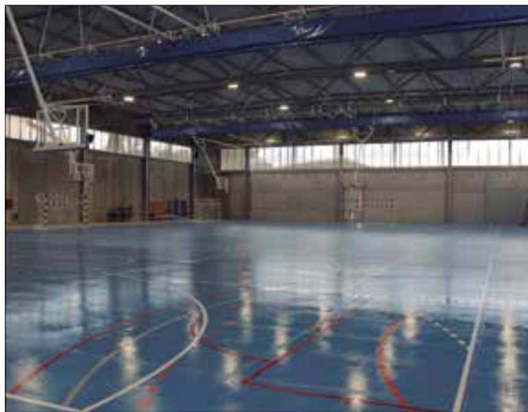
El pavelló es podrà estrenar aquest mes de desembre.