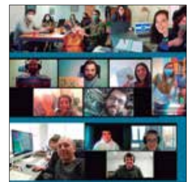
Imatge de la hackatò .

Al llarg de 36 hores, els onze equips participants en la trobada van desenvolupar la seva idea de joc vinculat a algun atractiu turístic de la ciutat, com ara el patrimoni o la gastronomia. Amb l'assessorament de persones expertes es