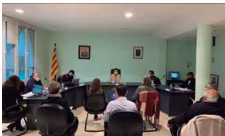
Ple celebrat a porta tancada, com a mesura anticovid. ✳ AJUNTAMENT

L'oposició també demanava revocar el nomenament de la secretària