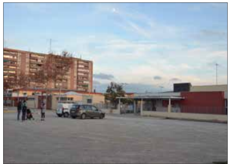
L'aparcament de la llar d'infants dels Monjos és un dels punts foscos.