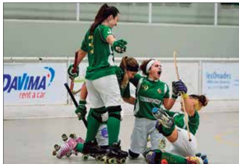
Celebració d'un dels cinc gols marcats pel CP Vilanova.