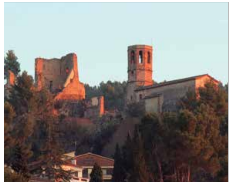
Es tracta d'uns terrenys de més de 1.000 m². ✱ FIRMA FOTO