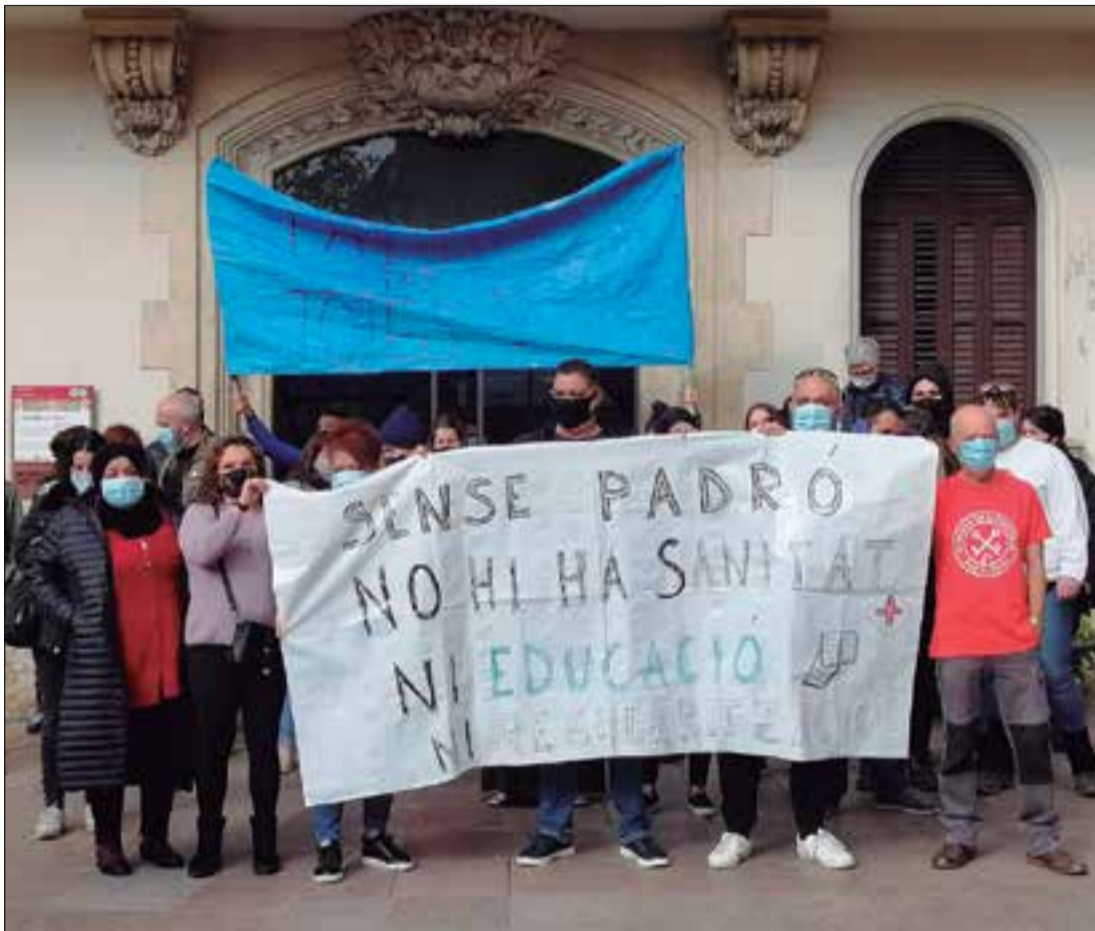
Des del sindicat exigeixen un empadronament per a tothom ✦ SINDICAT DE LLOGATERES PENEDÈS

les dones a un centre que gestiona la Fundació Assistència i Gestió Integral. Però no disposem de dades ni recursos al voltant del col·lectiu de transeüants i sense llar a la comarca”.