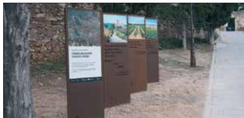
Al llarg de la ruta hi ha diferents estacions per explicar el paisatge.

Una nova caminada familiar s'ha incorporat aquestes darreres setmanes a les rutes de senderisme de Sant Pere de Ribes. Es tracta de la Ruta de les Vinyes, una passejada per conèixer les vinyes que hi ha al voltant del Castell de Ribes a través d'un camí de la xarxa de senders comarcals que s'ha esquit-