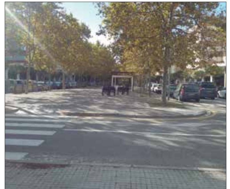
La rambla de la Girada, un dels principals focus de conflicte. ✱ LA FURA