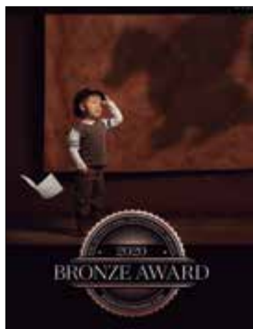
* MÒNICA UDINA