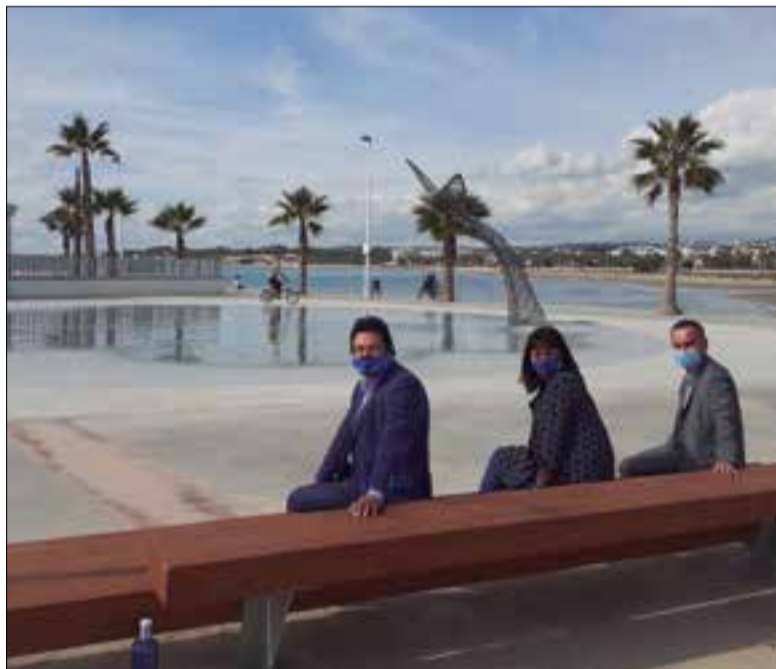
A la plaça del Trajó de Garbí s'han instal·lat unes fonts i una estructura en forma de cua de balena.

L'acord tindrà una vigència de quatre anys prorrogable fins a quatre anys més. El president de Ports de la Generalitat, Isidre Gavín va subratllar que el conveni "referma la situació estratègica del port de Vilanova i la Geltrú com a motor econòmic del Garraf i el seu hinterland i com a referent en tecnologia, investigació i innovació al territori". Gavín va afegir que el port és una plataforma "excel·lent" per a la formació nàutica, especialment en manteniment dels vaixells i un element bàsic per potenciar l'establiment d'empreses nàutiques que aportin un impacte econòmic i social i l'ocupació. A més, va apuntar que "en un moment de crisi econòmica com la que es viu en algunes zones de Catalunya és important generar noves expectatives de futur per al jovent de Vilanova que acabin impulsant l'economia local i generin llocs de treball".