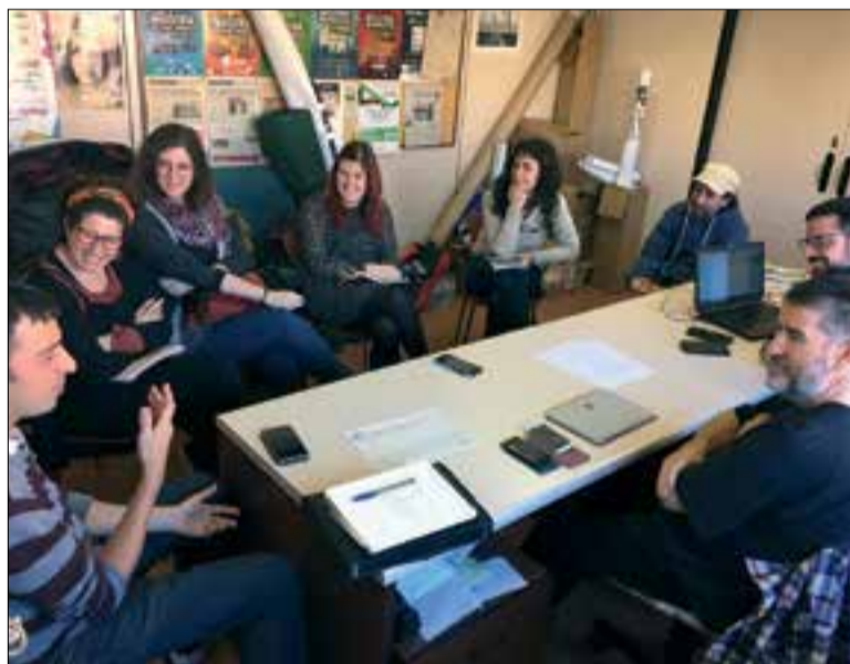
Dissabte a la tarda l'entitat es presentarà en públic al BPFest.