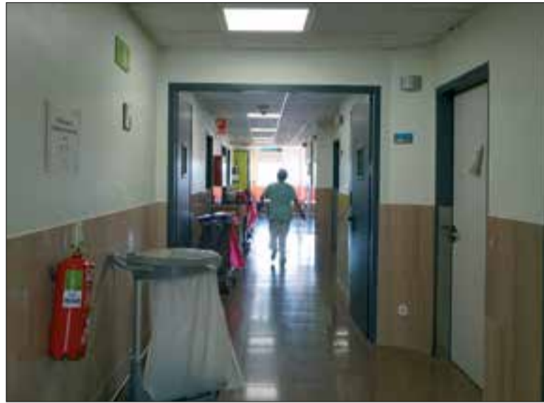
Tots els casos detectats han estat ja aïllats. ✱ CSAPG

A banda de fer els testos, el CSAPG ha pres quatre mesures per garantir la seguretat dels professionals, pacients i familiars. Per una banda s'han desprogramat algunes operacions no urgents del centre, tot i que la prioritat és seguir atenent pacients amb patologies no-covid sempre que se'ls garanteixi la seguretat. Una segona mesura és la restricció de visites i acompanyants a l'àrea d'hospitalització i urgències (només podran estar acompanyats els menors, les persones dependents, pacients que es troben al final de la vida, dones que han donat a llum i persones que la seva situació clínica ho requereixi). També s'han tancat les visites a la zona de Residència i s'ha