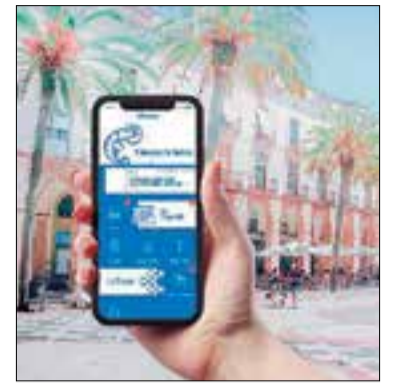
Webs i apps serveixen per difondre els directoris de restaurants.