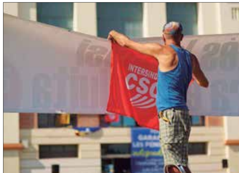
El judici s'ha reprogramat per al 9 de març del 2021. ✦ JOSANT