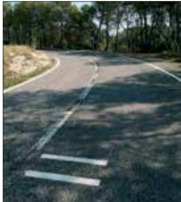
S'han senyalitzat 22 revolts.

El Servei Català de Trànsit i el Departament de Territori i Sostenibilitat han posat en marxa una prova pilot de senyalització de revolts amb alta sinistralitat per als motoristes a la carretera BV-2115, que envolta el pantà de Foix.