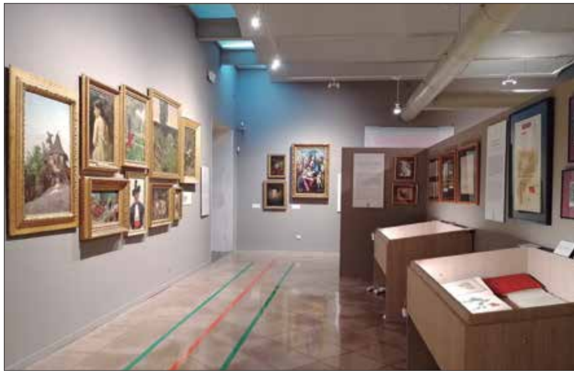
Una de les sales amb l'exposició temporal que s'obre aquest divendres. ✦ MUSEU VÍCTOR BALAGUER