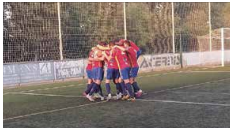
Els vilafranquins es van imposar al primer partit de lliga. ✘ FC VILAFRANCA

Aquest cap de setmana el Futbol Club Vilafranca estrenava la lliga d'enguany amb un partit a casa contra el Santfeliuenc.