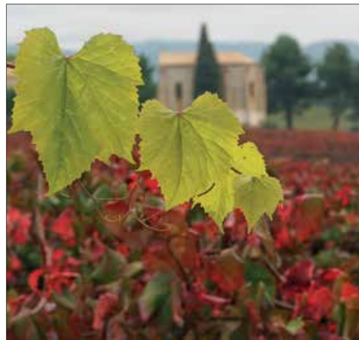
Penedès pintat Aiguaviva - 2020