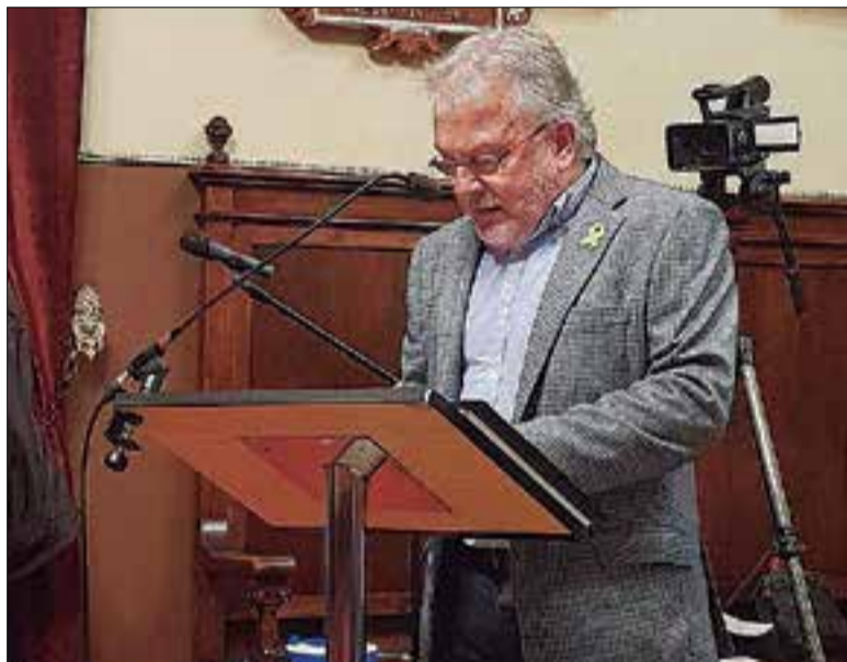
El Síndic de Greuges, l'any 2019 durant la presentació de l'informe 2018.

El Síndic de Greuges, Jaume Rafecas, va presentar dimarts l'informe sobre la sindicatura referent a l'exercici 2019. Ho va fer durant el ple municipal i no es va mossegar la llengua. Rafecas va començar la seva intervenció apuntant que la gestió de l'Ajuntament és "força correcta" però sense que això impliqui que no hi hagi força aspectes millorables. El primer que va apuntar va ser la falta de resposta de l'Ajuntament a les seves demandes: "el principal problema que pateix aquesta Sindicatura no és altre que la falta de resposta ràpida o dins uns terminis lògics de l'Equip de govern municipal i dels serveis que en depenen, va explicar".