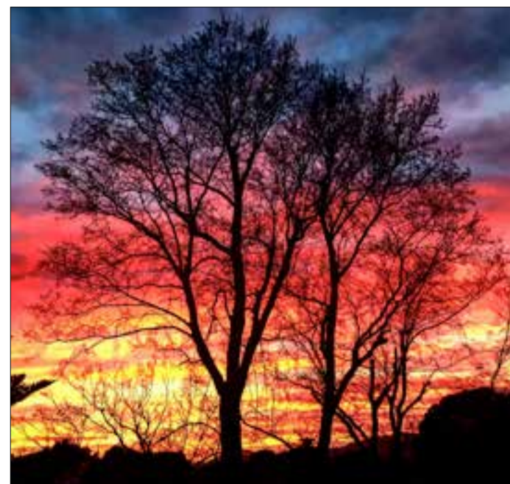
Capvespre de colors Castellví de la Marca - 2020