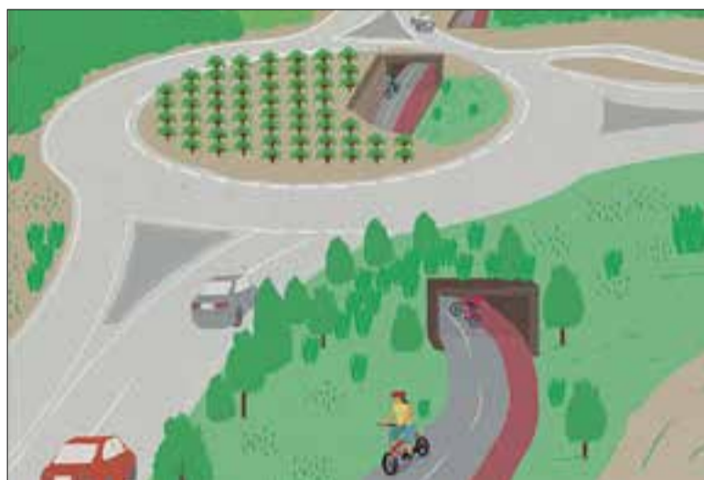
El carril tindrà dos túnels soterrats per superar les dues rotondes.

El regidor d'Urbanisme, Francisco Romero, explicava que el projecte preveu un carril segregat de la resta del vial, amb paviment diferenciat, mantenint l'arbrat existent i amb enllumenat tipus led. El projecte contempla superar amb seguretat les dues vies d'altres capacitats existents, la variant de l'N-340 i l'Auto-