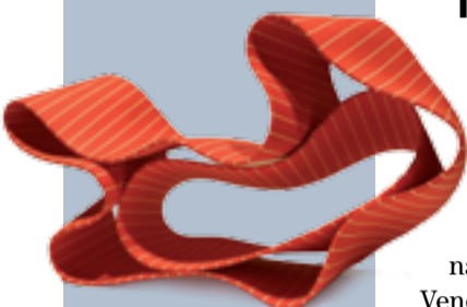
Segon premi Simcha Even-Chen Folding in Motion

La sala del Portal del Pardo acull per la Fira i fins al 25 d'octubre l'exposició de les obres guanyadores de la desena Biennial Internacional de Ceràmica del Vendrell. Una biennial que se celebra des de fa vint anys i que de manera alterna, un any organitza el concurs i l'any següent mostra les tres peces guanyadores, complementades amb altres escultures portades expressament per les artistes guanyadores.