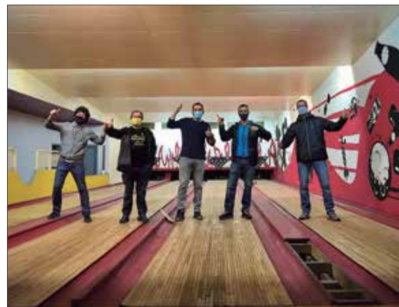
Directius del Centre, en el primer contacte amb les antigues bitlles. ✖ CEP

La finalitat de la nova seu social del Centre Excursionista és potenciar un punt de trobada per a