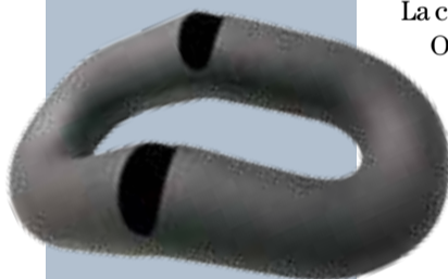
Tercer premi Mingshu Li Black Form

a causa de les dificultats de mobilitat d'obres d'art derivades de la covid-19, no ha pogut portar al Vendrell cap altra peça més, més enllà de les dues que va presentar a la Biennial. El catàleg que hi ha al Portal del Pardo, en canvi, sí que inclou més peces, totes amb un estil de formes molt personal: amorfes, juganeres, acolorides, divertides, que juguen amb el buit i amb la sensació de moviment. Sempre seguint el mateix patró.