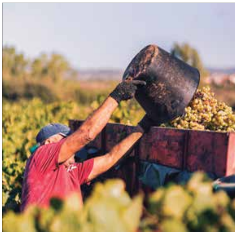
La verema 2020 ha estat de les més primerenques dels últims temps.

Respecte a la qualitat, des del Consell Regulador de la DO Cava s'in-