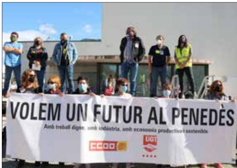
Dissabte mig miler de persones es van manifestar als Monjos.