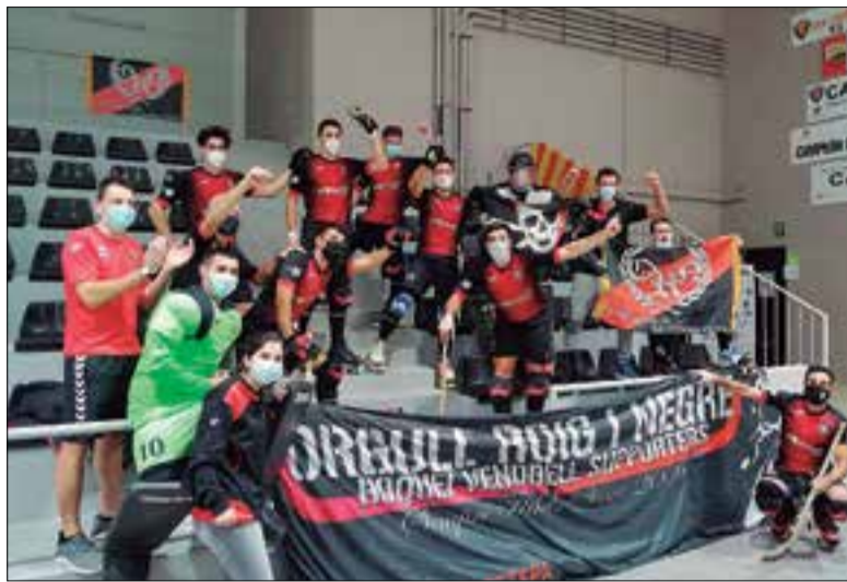
El Vendrell, celebrant la victòria al racó d'Orgull Roig i Negre. ✦ CE VENDRELL