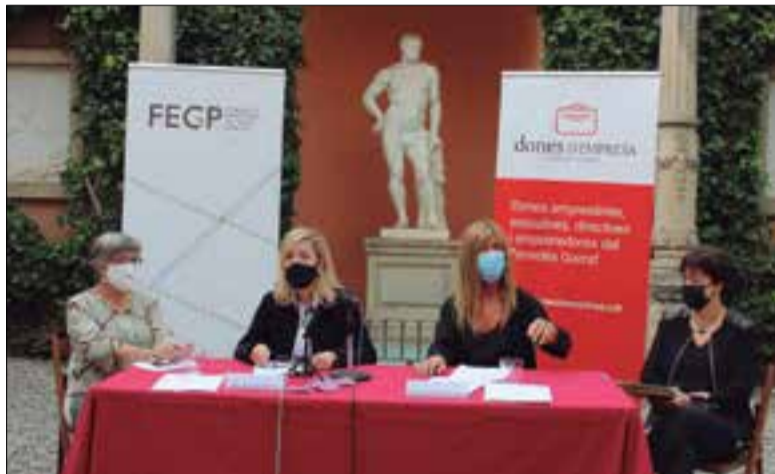
Acte de presentació de Dones d'Empresa, al pati del Museu Papiol. ✦ LA FURA

El divendres 16 d'octubre tindrà lloc a Neàpolis la 13a trobada i sisè Congrés de Dones d'Empresa, en doble versió presencial i virtual (segons conveniència), enguany amb el tema "Generant el canvi amb tecnologia. Inspira't". Un congrés que comptarà amb quatre ponències, la conferència central a càrrec de la presidenta de Fibra-cat TV Meritxell Bautista; un taller experiencial; dinar a la terrassa de l'edifici; i el lliurament dels guardons Dones d'Empresa 2020, enguany amb el reconeixement habitual a una dona empresària i també amb un segon guardó per a la trajectòria d'una dona en matèria d'innovació i tecnologia. El congrés començarà a 2/4 d'11 del matí i es clourà cap a les 8 del vespre, amb inscripcions obertes a www.donesdempresa.cat i a info@donesdempresa.cat . Totes les ponents (trenta líders d'organitzacions de diversa índole) seran