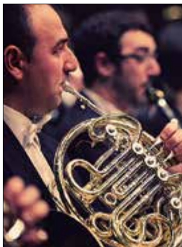
L'orquestra Camerata XXI actuarà en dues ocasions. ✦ CAMERATA XXI

Lírica Ribes és una secció del Centre Parroquial creada el 2019 que pretén ser un espai per aprofundir en la música clàssica. El seu principal objectiu és atraure al municipi òperes, concerts de clàssica, sarsueles i musicals. La temporada