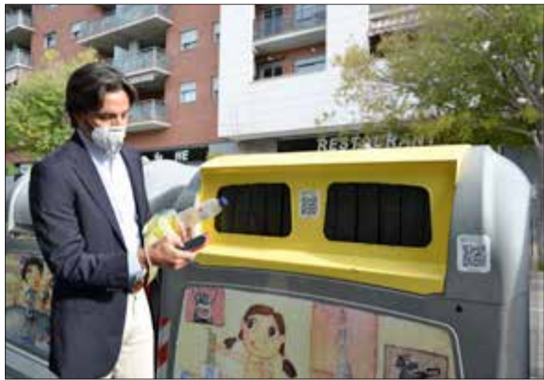
A través d'una aplicació mòbil es podran obtenir bonificacions.