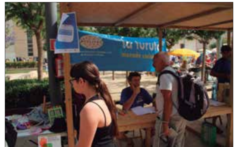
La turuta és la moneda social de Vilanova i la Geltrú. ✦ AJUNTAMENT