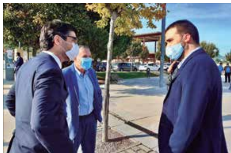
El conseller Puigneró acompanyat de l'alcalde de Torrelles i el delegat del govern al Penedès.