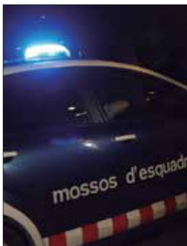
Imatge d'arxiu. ✱ ACN