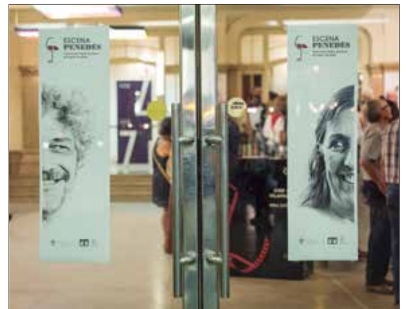
Quatre grups presentaran les seves obres entre divendres i dilluns al Casal.