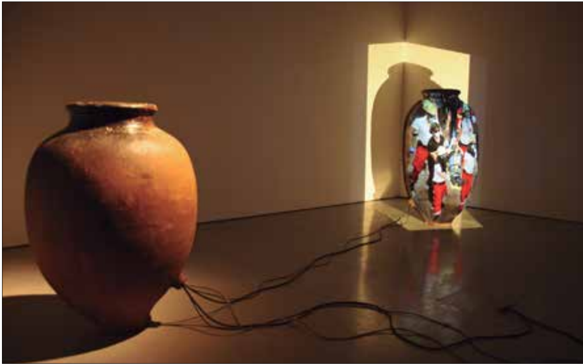
La instal·lació "Somunsolcos", d'Eulàlia Valldosera, es podrà veure del 22 d'agost al 18 d'octubre. ✦ VINSEUM

Al 2019 el Vinseum va sumar la xifra més alta de visitants dels darrers 20 anys. En total van visitar aquest equipament 36.507 persones, unes quatre-cents més que l'any anterior. Aquest increment s'explica, en bona part, a l'augment de públic de les exposicions temporals (especialment "Sireni & Co", una de les tres que es van programar al 2018 de producció pròpia) i per l'activitat cultural del museu. De fet, la pujada més significativa del 2019 la van registrar les activitats culturals, amb un increment de mil persones. En aquest punt hi van tenir molt a veure els bons resultats del festival de filosofia VilaPensa i del Most Festival.