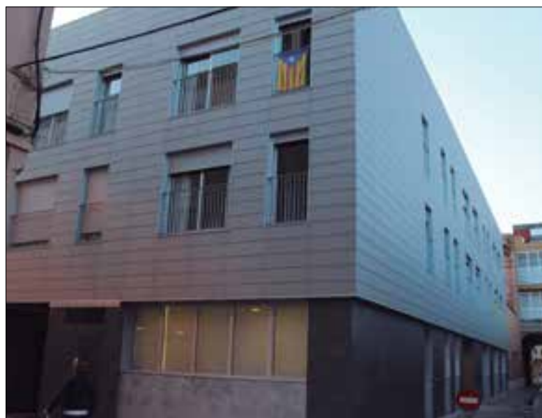
L'edifici compta amb 12 allotjaments protegits per a la gent gran. ✱ LA FURA