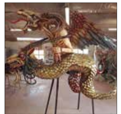
El drac és una barreja de boc i cabra.

Com que Sant Antoni de Vilamajor és a la falda del Montseny, els diables i l'escultora han volgut que la nova peça de bestiarí reti homenatge a les llegendes i tradicions