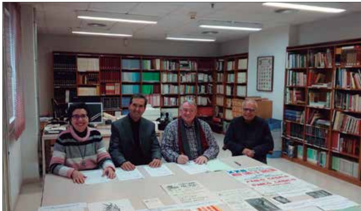
L'acte de signatura de la cessió en comodat va tenir lloc dimarts a l'Arxiu Comarcal.

Els documents conservats són fruit de les nombroses activitats que l'associació ha organitzat al llarg dels anys