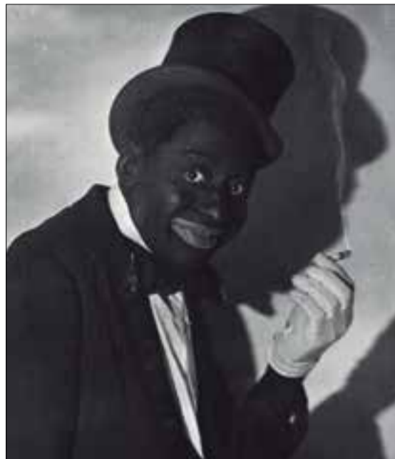
Un grup de dones es manifesta amb UCFR en el marc de la seva campanya #StopVox. // Un exemple de blackface fet pel còmic Bert Williams. ✦ UCFR