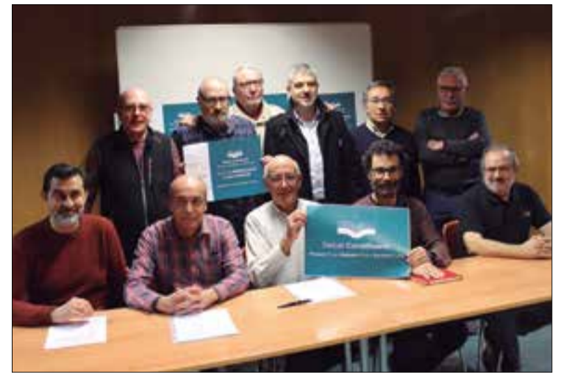
A hora d'ara hi ha 19 enteses locals constituïdes a la comarca. ✳ LA FURA