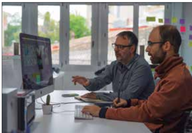
Preparació de l'audiovisual.

El certamen cinematogràfic italià Under The Stars Film Festival ha atorgat el guardó al millor curtmetratge documental a la peça "3d10fm dels Castellans de Vilafranca", de la productora vilafranquina Punt TV. El vídeo, seleccionat en diversos festivals audiovisuals de tot el món, remet a l'espectador a la diada de Sant Fèlix de 2018, quan la colla va descarregar el 3 de 10 amb folre i manilles. L'any passat, el curt ja va ser seleccionat com a finalista en el Dunedin International Film Festival (EUA), el Zero Plus International Film Festival (Rússia) o el Lift-Off Global Network (Regne Unit).