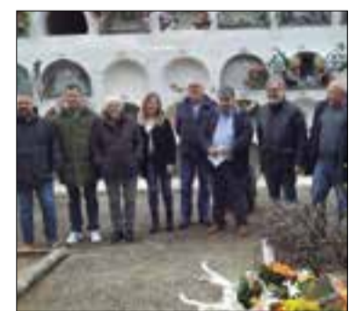
✳ AJUNTAMENT DE TORRELLES

Diuenge al migdia es va celebrar, al cementiri de Torrelles un acte d'homenatge a les víctimes i soldats caiguts durant la Guerra Civil al municipi.