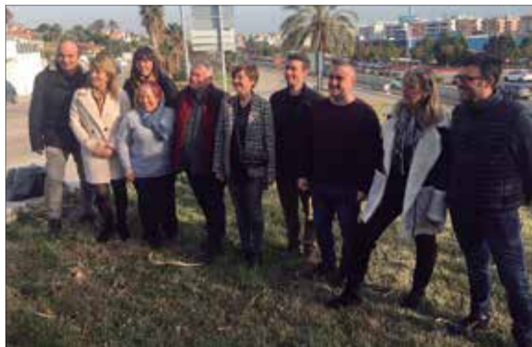
Els alcaldes i alcaldesses que formen part del Pacte del Penedès Marítim es van reunir a Calafell per reactivar la seva activitat.

Alcaldes i consells comarcals del Garraf i el Baix Penedès reclamen de nou la bonificació del peatge de la C-32