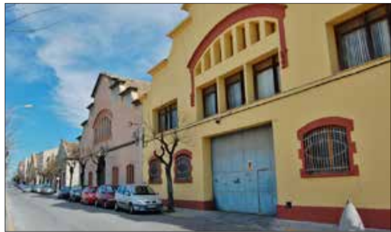
ERC demana que es preservin totalment les naus del carrer.

El grup municipal d'ERC ha anunciat aquesta setmana que presentarà la sol·licitud al Departament de Cultura de la Generalitat de Catalunya per declarar Bé Cultural d'Interès Nacional el conjunt de naus del carrer Comerç. Segons la seva