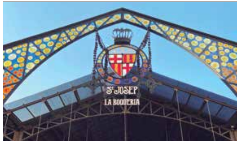
La Boqueria ha elaborat un programa al voltant de l'aniversari. ✱ DO PENEDÈS

El Mercat de La Boqueria de Barcelona celebra aquest 2020 el seu 180è aniversari i dedicarà tot un programa d'actes a la gastronomia, l'alimentació i els productes de qualitat. La DO Penedès hi participarà com a única denominació d'origen col·laboradora, i aportarà sessions de cuina i converses dirigides per especialistes dels sectors vitivinícola i gastronòmic. Aquesta col·laboració servirà per enfortir