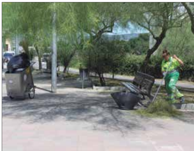
Els serveis de neteja i manteniment de parcs i jardins i el de neteja de la via pública i recollida de residus els fa la mateixa empresa.

Dilluns el ple de l'Ajuntament de Vilanova i la Geltrú va donar llum verda a l'equip de govern perquè encarregui un estudi per determinar si escau o no canviar la forma de gestió dels serveis de manteniment i neteja de parcs i jardins i del de neteja viària i recollida de residus. Fins ara aquests dos serveis estan adjudicats a l'empresa Valoriza i el que el govern es planteja és gestionar-los directament. Els dos punts van tirar endavant amb el vot favorable del govern (ERC, Capgirem Vilanova-CUP i Junts per Vilanova) i Som VNG, i l'abstenció del PSC i C's.