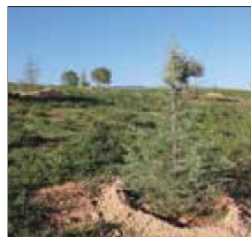
Els cedres, a la Serra de Dalt.