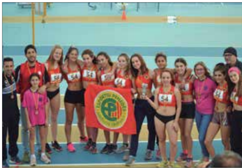
Equip cadet femení que ha quedat tercer de Catalunya. ✖ ESPORTIU PENEDEÈS