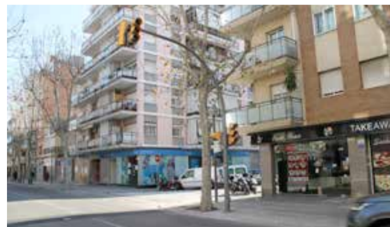
S'instal·larà un semàfor a la cruïlla dels carrers Pare Garí i Jaume Balmes.

Aquesta acció, juntament amb les que s'estan executant als carrers Correu i Llanza i a la plaça de Miró