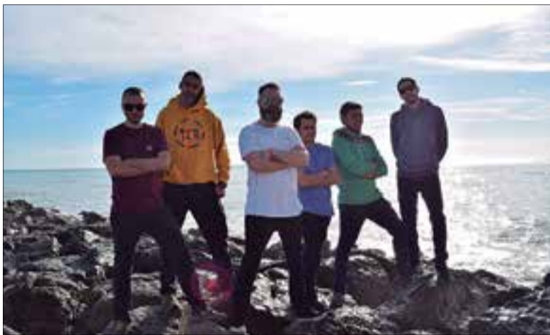
Peu de foto Ronnia Light 9 / 11 pt. ✳ FIRMA FOTO RONNIA LIGHT 7 / 11 pt