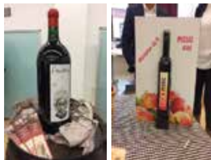
Vins Edició 2017

Dissabte 1 de febrer 2020 de 10:00 a 13:00