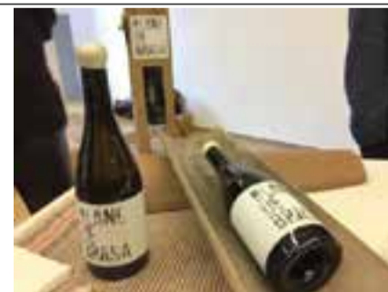
Vins Edició 2018