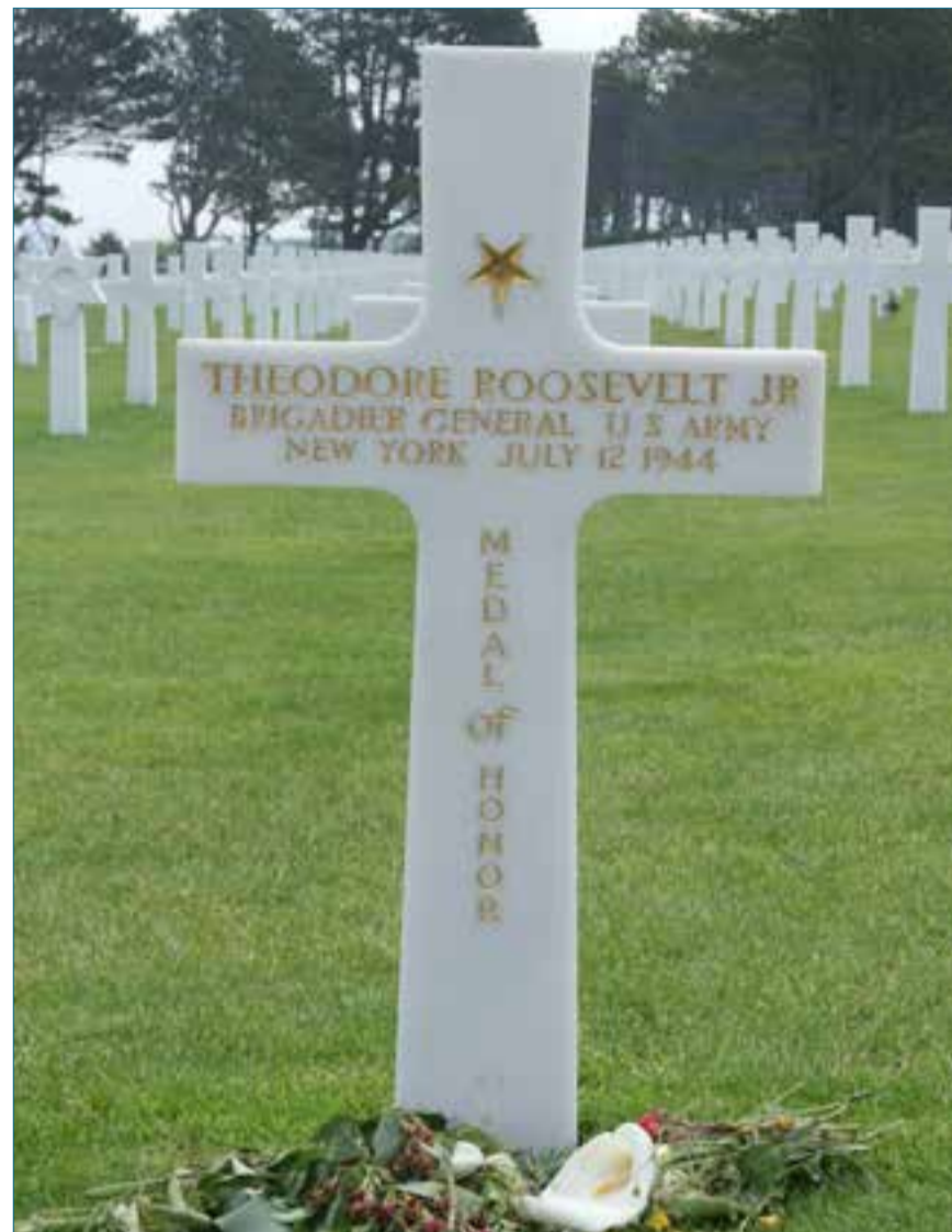
La tomba destacada del general Roosevelt a Colleville.

L'exèrcit britànic col·laborà en el desembarcament amb uns 75.000 homes. Seguint el costum britànic, els soldats morts en combat són enterrats el més a prop possible del lloc on combateren, per la qual cosa ens podem trobar per tot el món amb cementiris que van de les 40 tombes a les més de 4.000, com és el cas del de Bayeux. Considerada com la primera gran ciutat francesa alli-