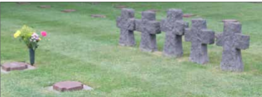
L'estela conjunta del soldat i el seu gos al cementiri de Ranville. Diferent tipologia de tombes a La Cambe.

ta Charlie Hebdo . El 2016 s'hi afegí un monument dedicat als periodistes desapareguts en acció, els cossos dels quals no s'han trobat mai.