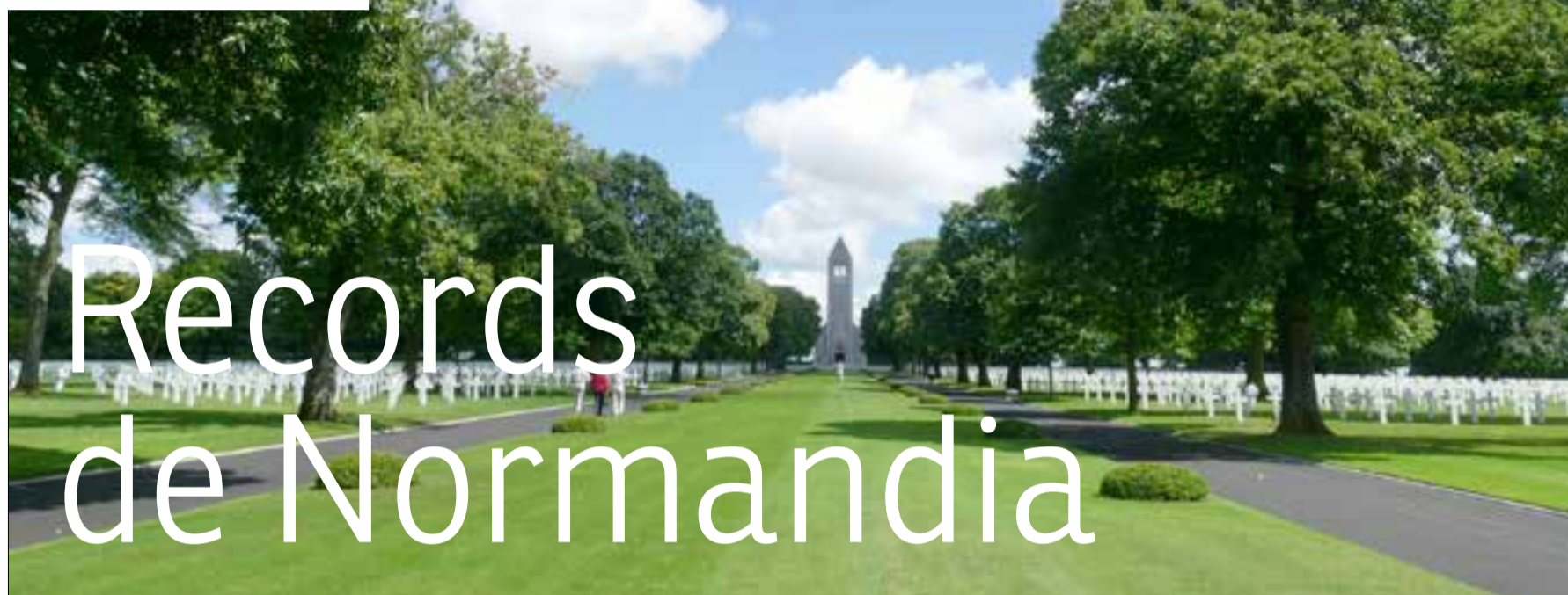
El cementiri americà de Saint-James.