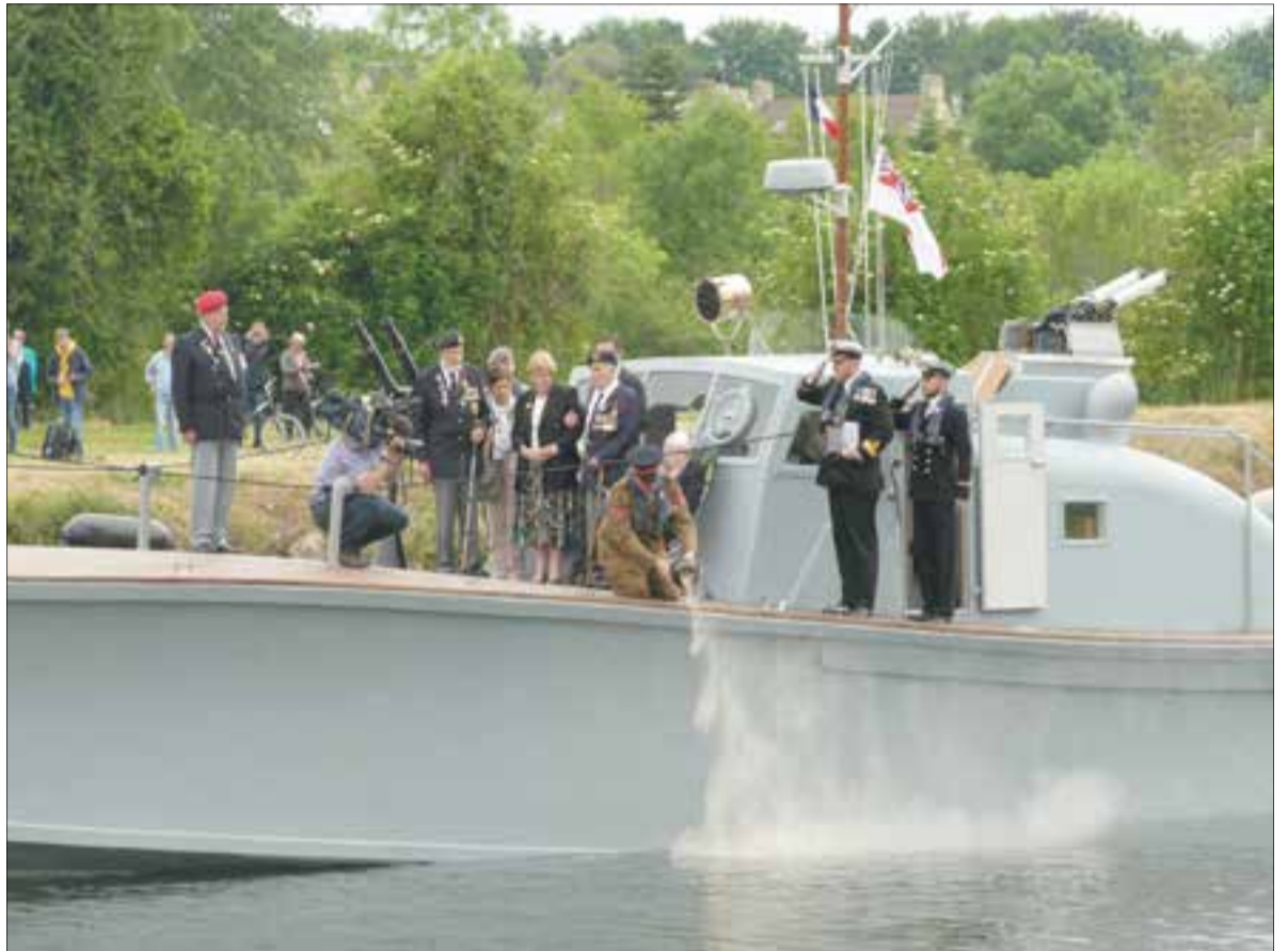
Homenatge pòstum a un heroi al Pegasus Bridge.

1958 per participants en un camp internacional de joves que tenia com a lema "Reconciliació per sobre les tombes", dirigits per l'associació Volksbund.