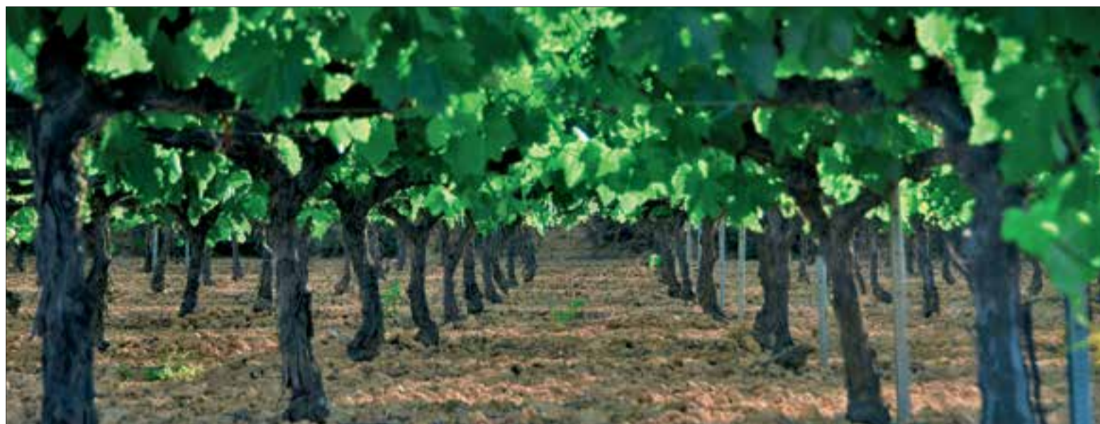
Vinya frondosa, fins al punt que els pàmpols deixen bona part del terra a l'ombra. ✦ MARIA ROSA FERRÉ

és difícil de detectar, ja que a la vista el gra es veu bé, però el mal el té dins. I va fent feina. El tractament que s'hi fa és, majoritàriament, "una lluita de confusió sexual: és una papallona que fa ous, i el que es fa és confondre el mascle perquè no fecundi la femella; si no hi ha posta, no hi ha danys". Hi ha tres tractaments possibles, però Font es decanta per aquest, consistent a penjar uns petits plàstics al filferat, que deixen anar unes fragàncies que desorienten el mascle i, de pas, s'evita tirar insecticida. A més, assegura que la seva eficàcia és molt superior. Això sí, convé que a la vinya del costat s'hi faci el mateix tractament; altrament, perd eficàcia.