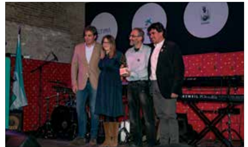
Lliurament del premi a representants de La Fura. ✦ JOSÉ PAREDES