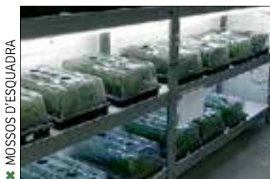
✖ MOSSOS D'ESQUADRA

dones com a presumptes autors d'un delictes contra la salut pública, concretament tràfic de drogues, frau de fluid elèctric i pertinença a grup criminal. El grup tenia una nau industrial a Castellví i una altra a la Granada, on cultivaven marihuana. Els agents van acreditar que també tenien una altra nau industrial i tres domicilis més des-