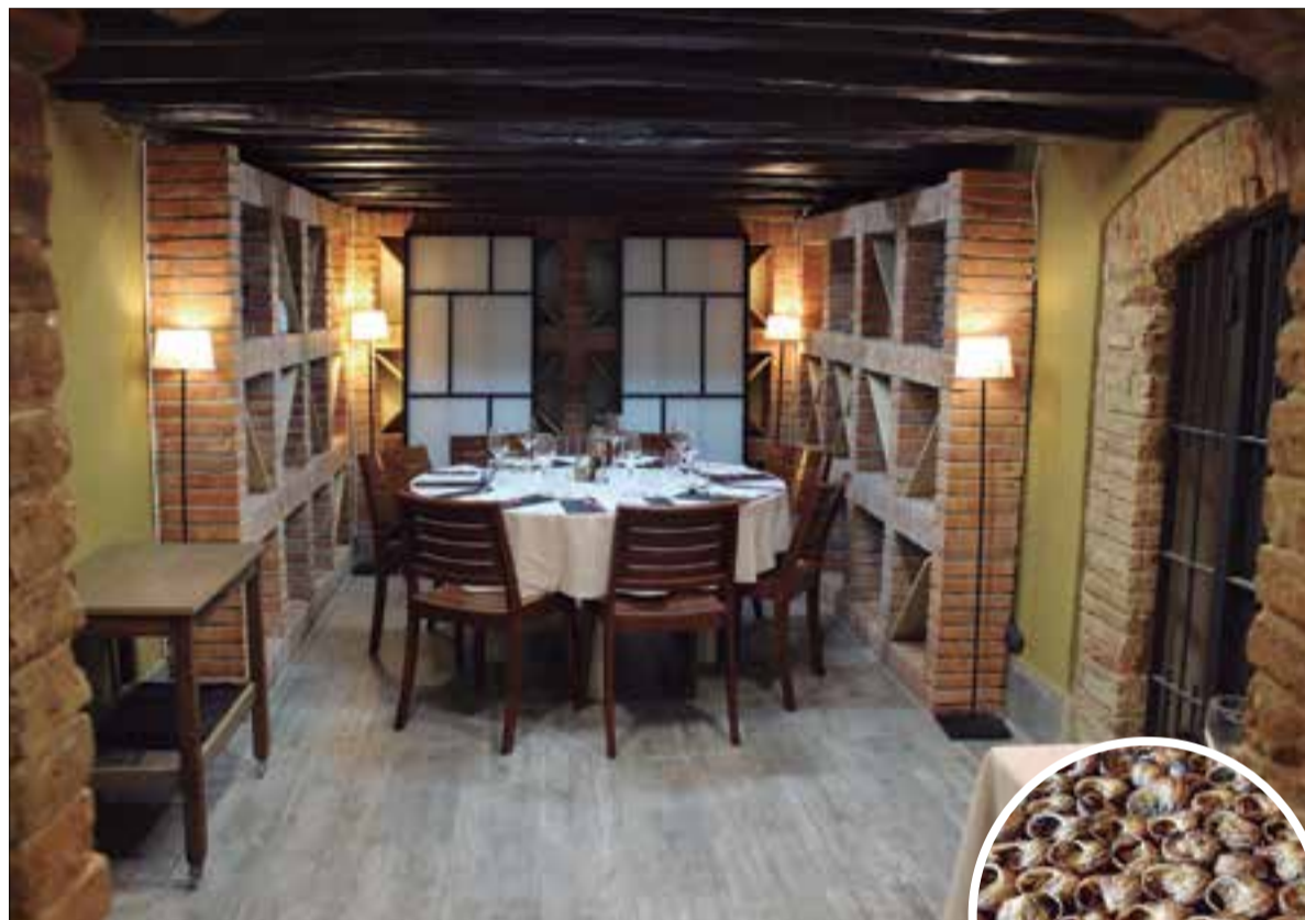
Reservat del restaurant, ambientat com un celler. ✳ LA FURA

Més enllà dels cargols, l'especialitat del restaurant vilafranquí són les carns a la brasa, sempre fetes amb llenya. Els comensals poden