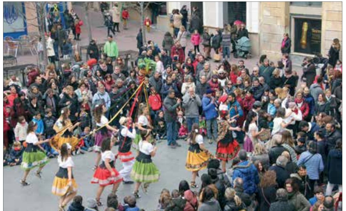
El 29 de novembre és el dia del patró i al matí té lloc la tradicional cercavila. ✖ AJUNTAMENT DE SANT SADURNÍ

Ptge. Terol, 34-36 Local 2 · Sant Sadurní d'Anoia 93 892 02 61 · mesalcosl@hotmail.com · www.mesalcosl.com