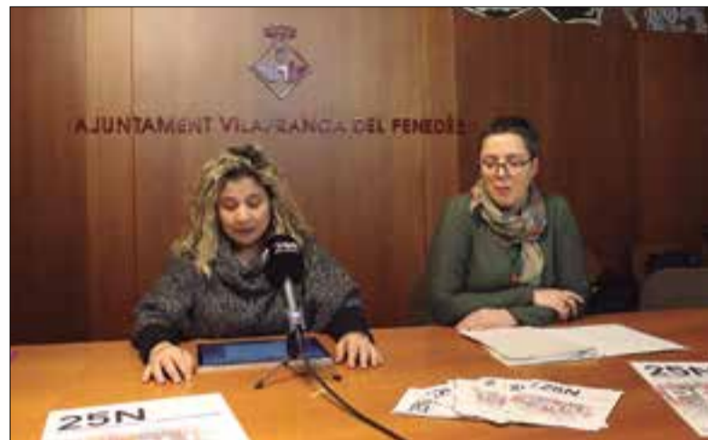
La programació s'allargarà fins al 2 de desembre. ✱ LA FURA

La programació d'actes que organitza l'Ajuntament al voltant del 25 de novembre, el Dia Internacional contra la Violència Masclista, abraça tot el mes de novembre i finalitza amb la projecció del film Casa de ningú , a la Sala Zazie del Casal el dilluns 2 de desembre.