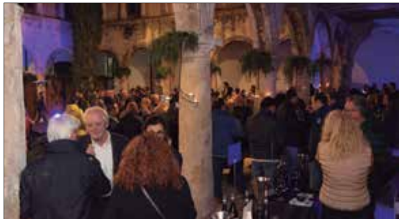
L'acte va tenir lloc el dissabte 9 de novembre. ✖ DO PENEDÈS

El dissabte 9 de novembre el Claustre dels Trinitaris va acollir la tercera edició de L'Espectacle: Vins Negres Penedès , organitzat pel restaurant El Gat Blau amb la col·laboració de la DO Penedès.