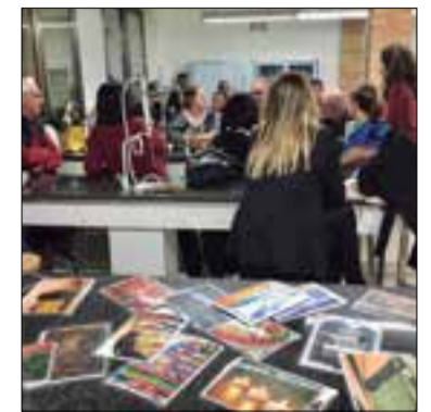
La jornada de treball de la FEGP va tenir lloc dimecres passat.

Per inscriure's i participar en les xerrades, que tenen un preu de cinc euros, cal fer-ho a través del web www.catcon.cat . La resta d'activitats programades són d'entrada gratuïta.