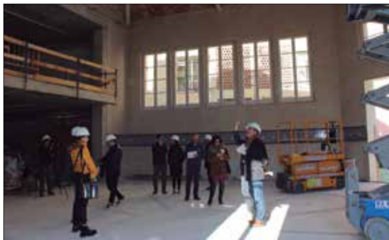
A l'espai de l'antic mercat hi haurà la museografia, que es podrà veure des de la planta superior com si fos el balcó de l'Ajuntament. ✱ LA FURA

L'accés a la casa serà a través del nou edifici del carrer de la Muralla dels Vallets. Allà hi haurà la recep-