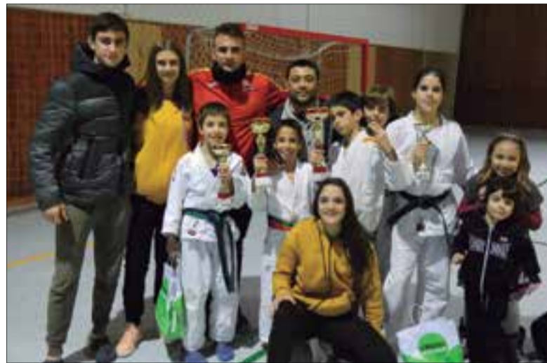
Els judokes del Club Judo Olèrdola amb els seus trofeus. ✦ JUDO OLÈRDOLA

El dissabte 16 de novembre se celebrava al pavelló municipal de la ciutat de Moià la 4a edició de la Copa Moianès alevina, considerada una de les competicions més rellevants en aquesta categoria (Sub-13). A la competició hi van participar un total de 170 joves judokes, que formaven part de 26 clubs de judo d'arreu de Catalunya: el Club de Judo L'Hospitalet, el Club de Judo Ripoll, el Club de Judo Molins de Rei, C.N. Terrassa, C.J. Mataró, Judo Pallaresos, N.T. Priorat-Tortosa, Ippon Farners, Judo Sentmenat, Judo Olèrdola, C.J. Baix Montseny, Girona-Judo, La Llagosta, Judo Barberà, J.C. Salle Horta, Judo Santpedor, Vital Esport, Judo Vilafranca, Judo Moià i Esport-7.