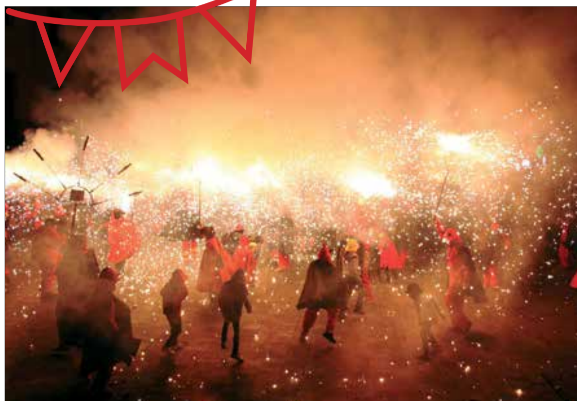
Durant la Festa Major de Sant Sadurní es programen dues cercaviles i dos correfocs. ✖ AJUNTAMENT DE SANT SADURNÍ

Aquesta serà la primera festa major que ballaran els Pastorets. Aquest nou ball del seguici festiu sadurninenc va estrenar-se a les passades Fires i Festes, coincidint amb el cinquè aniversari de l'Agrupació de Balls Populars.