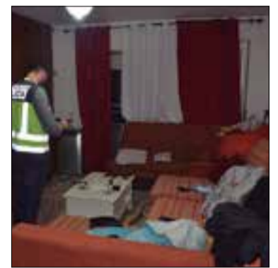
✱ POLICIA NACIONAL