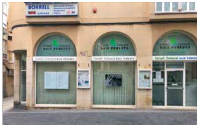
Les sol·licituds es poden presentar al Consell Comarcal o als ajuntaments.

Les persones interessades poden presentar la sol·licitud als ajuntaments de la comarca o bé a la seu del Consell Comarcal. Els terminis són de dilluns 25 fins dimecres 27