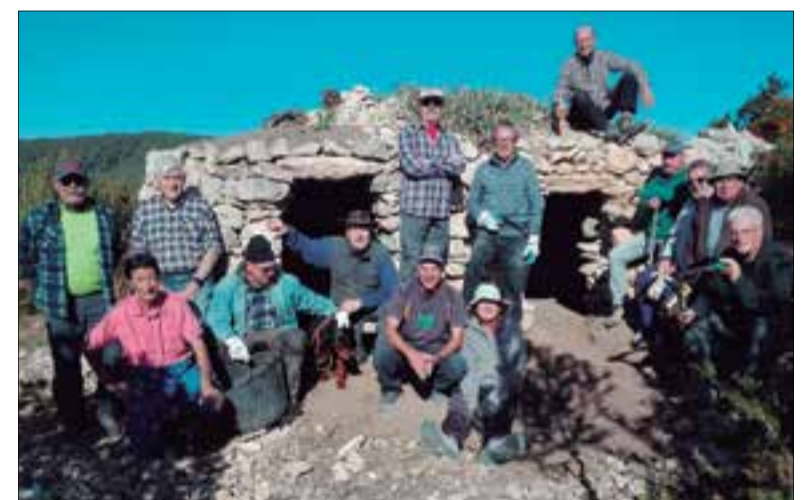
Grup de restauradors, amb la barraca recuperada. ✱ LA FURA

Entre la seva extensa bibliografia, destaquen Rondalles i llegendes catalanes (1996), La festa de Catalunya (1998), Llegendes del Penedès i de les valls del Garraf (2005) Cada dia és festa (2014) i el seu darrer Olèrdulae. Els contes del Penedès (2017). Bienve Moya va rebre el 2009 el Premi Nacional de Cultura Popular, concedit per la Generalitat.