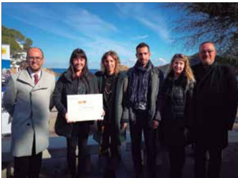
La consellera Àngels Chacón (al centre) va ser l'encarregada de lliurar el distintiu a l'alcalde de Vilanova i al regidor de Promoció Econòmica.

És un dels dotze primers municipis que reben aquesta distinció atorgada per l'Agència Catalana de Turisme