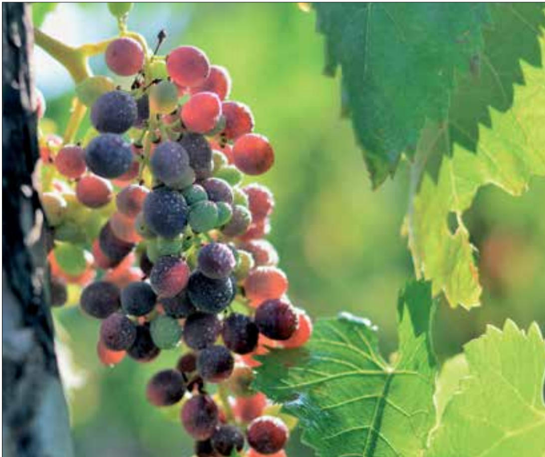
Gotim de raïm, encara en plena floració.

El període de temps en què s'aboquen els adobs –i també fems– a la vinya és llarg. Pot començar el mes de novembre, i fins ben bé el mes d'abril