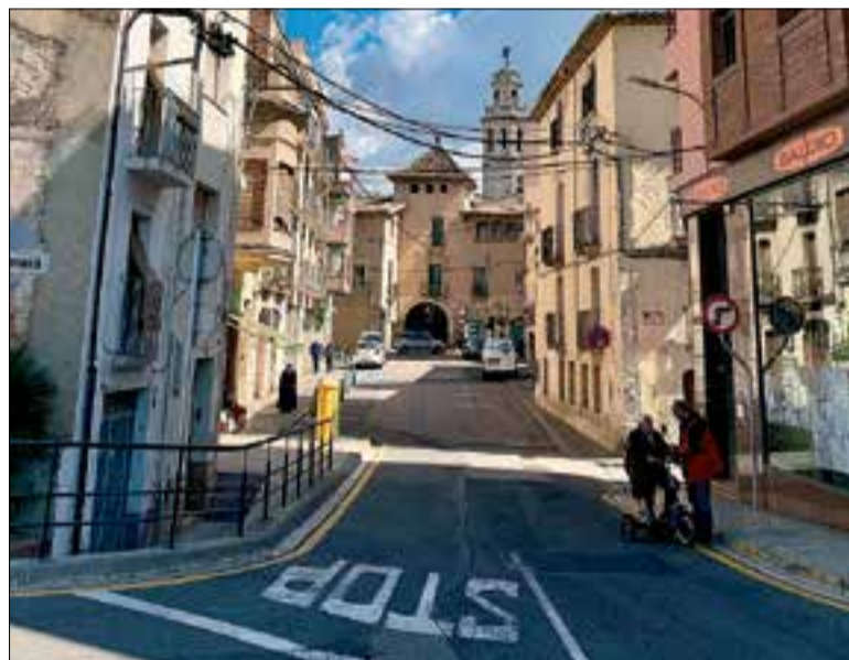
Espai entre el Portal del Pardo i el pont de França.

Amb aquesta obra es vol convertir aquest espai per a l'ús dels vianants per contribuir a la dinamització comercial del centre, donat que la zona d'actuació és un dels principals accessos al nucli antic. A més, segons es pretén dignificar una part del nucli antic de la vila amb un interès patrimonial i històric, ja que està comprès entre la Riera de la Bisbal amb el Pont de França i el Portal del Pardo.