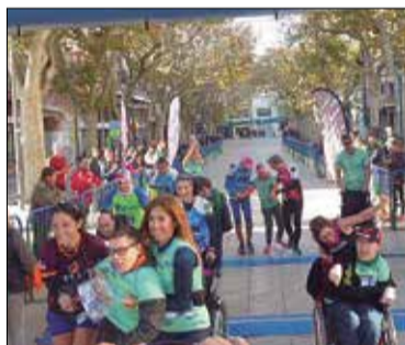
* AJUNTAMENT DEL VENDRELL