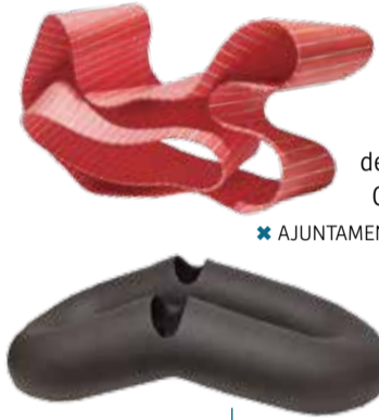
Segon premi de la Biennal de Ceràmica 2019.