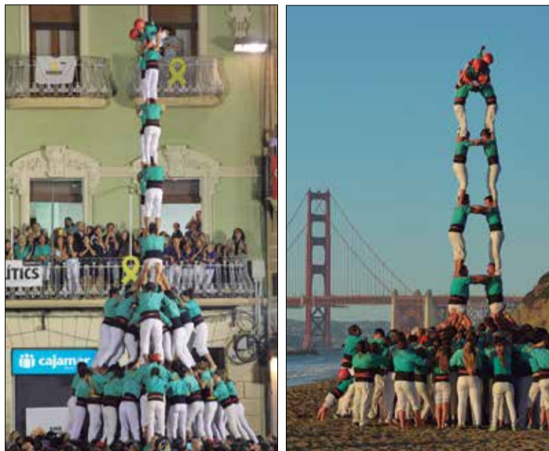
Torre de 9 a Reus i torre de 7 davant el Golden Gate.

Els verds es van recuperar descarregant tot seguit un bonic 4 de 9 amb folre, que ha superat els maldcaps que va arrossegar durant la primera meitat de temporada. Va ser en quarta ronda, ja negra nit, quan els vilafranquins hi va tornar a la càrrega amb l'únic gamma extra que completarien a Reus, la torre de 9. Una torre, la vuitena de l'any, que va tenir una descarregada èpica com poques se n'han vist. Una filera que s'ensorrava, castellers flexionats per mantenir