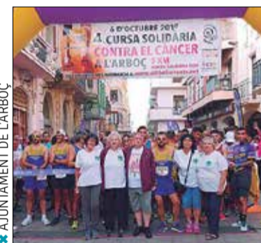
* AJUNTAMENT DE L'ARBOÇ

Els organitzadors de la cursa consideren que l'assistència va ser un èxit, ja que un total de 500 perso-