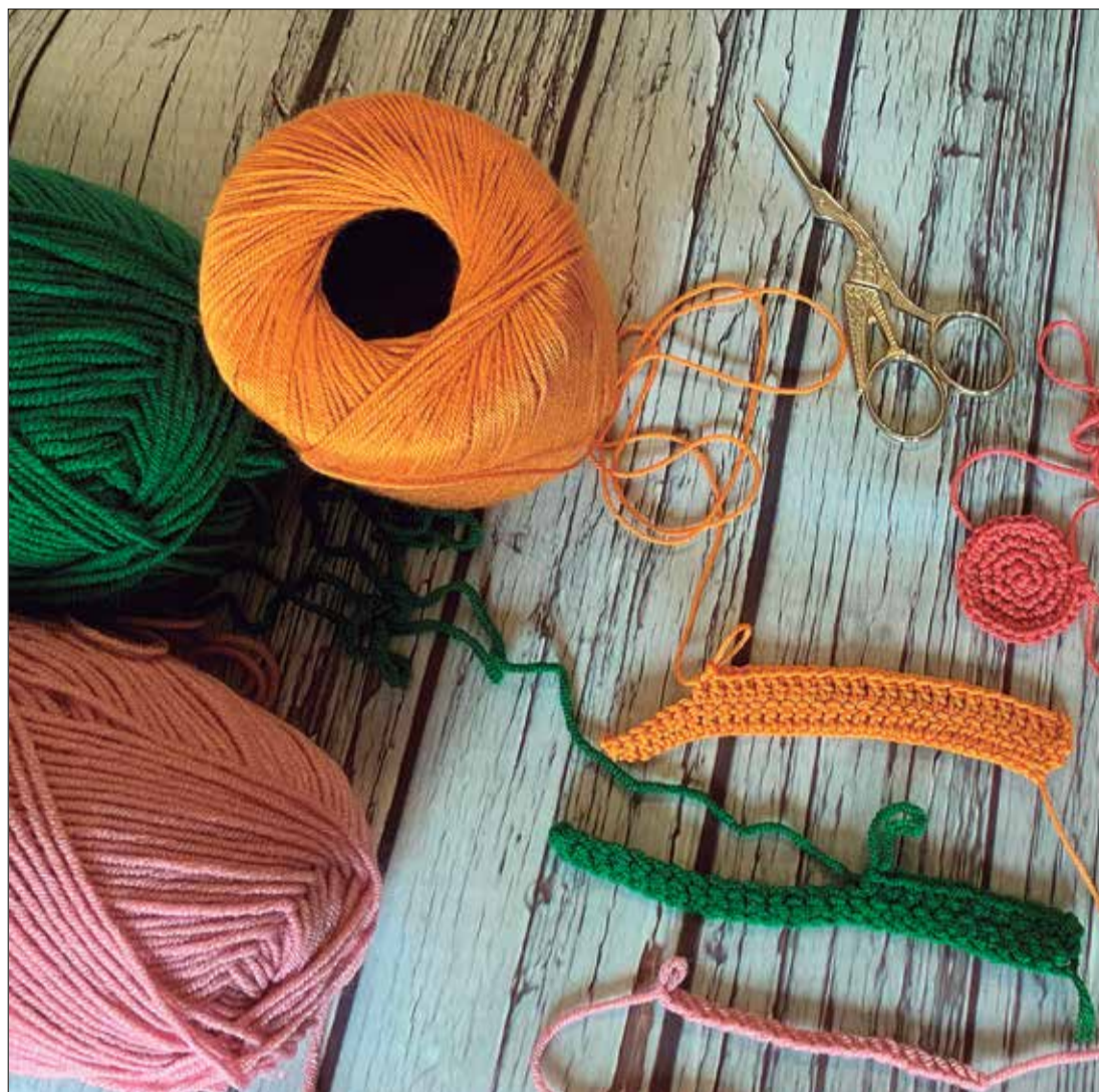
La Fira Handmade està a la plaça Nova i acull gairebé quaranta tallers. ✦ AJUNTAMENT DEL VENDRELL

plaça Nova s'instal·larà la carpa de la Fira Handmade. Finalment, a l'aparcament del Pèlag hi haurà representat el sector de l'automoció amb dotze concessionaris de vehicles i un de maquinària industrial.