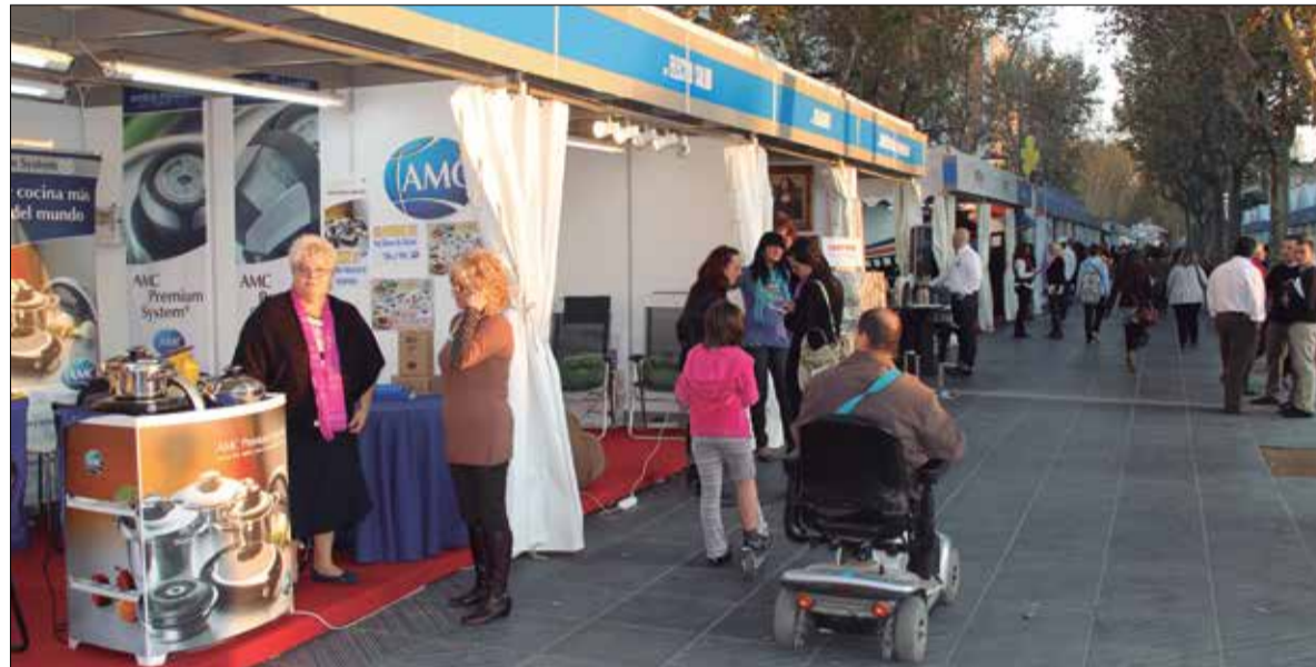
La Fira de Novembre d'enguany serà del 8 al 10. ✖ AJUNTAMENT

L'objectiu és adaptar la mostra a les tendències i les necessitats de l'economia de l'entorn i ciutat