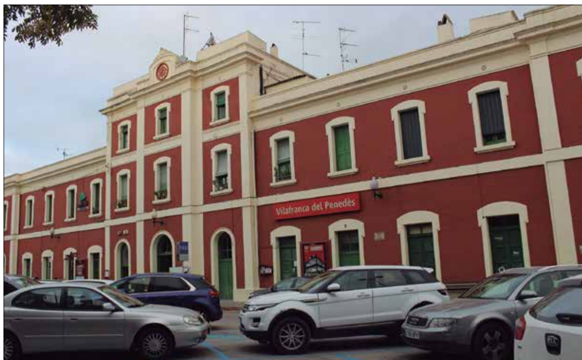
Les obres duraran quinze mesos i estan pressupostades en 3,6 milions d'euros. ✖ LA FURA