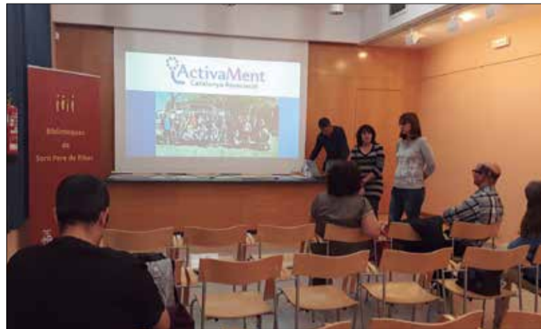
Sessió de presentació de projectes d'una edició anterior.

Un total de 46 propostes s'han presentat a la convocatòria d'enguany dels pressupostos participatius de l'Ajuntament (l'any passat en van ser 39). La majoria són projectes d'entitats culturals, esportives, de la comunitat educativa i d'associacions veïnals o urbanitzacions. Hi ha un total de 29 propostes d'inversions; 12 projectes socials, culturals o solidaris; quatre estan incloses en la categoria d'igualtat de gènere, LGTBI i feminisme i una s'ha presentat fora de termini. En aquests mo-