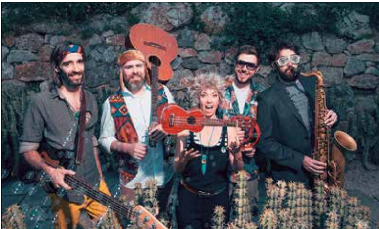
Lali Begood oferirà un concert familiar el pròxim 19 d'octubre al Casal.