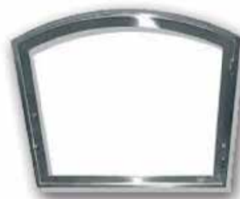
Marc amb vidre