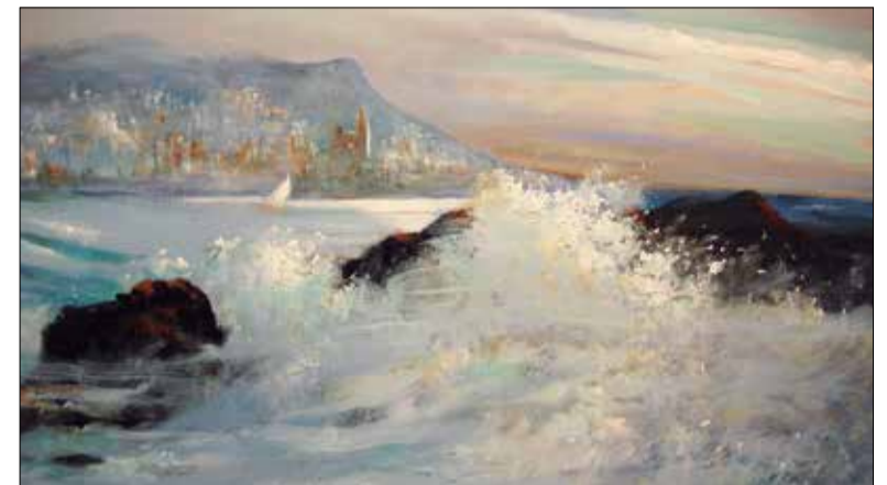
Quadre a l'oli d'onades al litoral de Sitges. ✱ FUNDACIÓ PINNAE