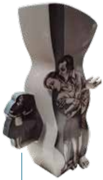
Primer premi de la Biennal de Ceràmica 2019.