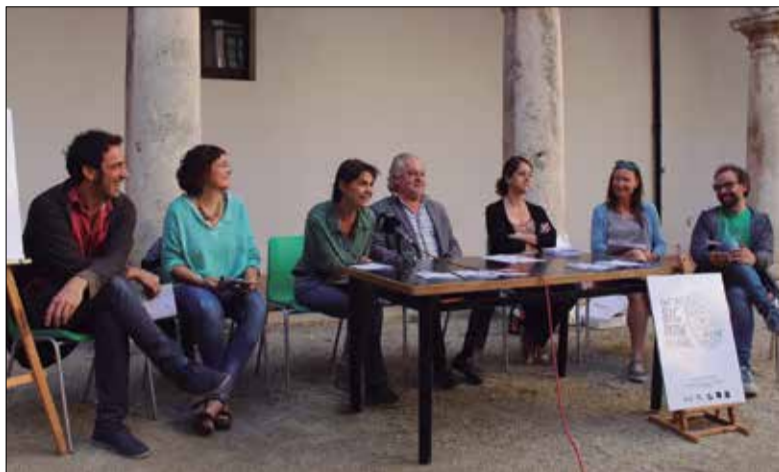
Presentació del Big Draw, al claustre dels Trinitaris. ✱ LA FURA

La dissabte 19 d'octubre tindrà lloc pel centre de Vilafranca la cinquena edició del festival Big Draw; una acció col·lectiva, impulsada per l'Ajuntament i diversos col·lectius pictòrics de la vila, que de manera coordinada oferiran sis tallers de creativitat, il·lustració i dibuix oberts a tothom, grans i petits. Serà de 2/4 de 6 a 8 de la tarda, i la idea