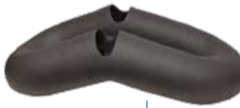
Tercer premi de la Biennal de Ceràmica 2019.