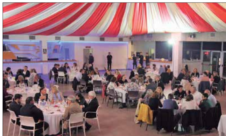
Acte de lliurament dels Lalo 2018. ✦ FUNDACIÓ SANT ANTONI ABAT

de la Pau. En concret, al passatge s'hi estan renovant parets, terra i sostre, s'il·luminarà, es canviarà el graó per una rampa que el faci 100% accessible, etc.