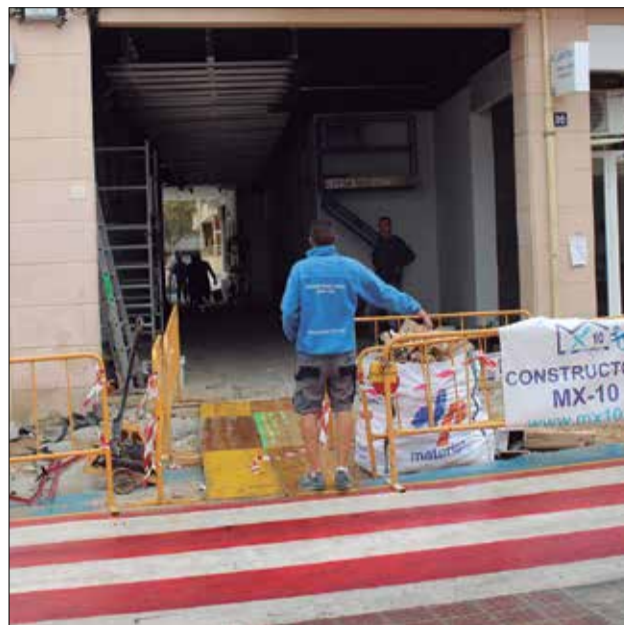
Obres al passatge del carrer del Gas i prototip de cartell per al desencotxament, davant l'IES Baix-a-Mar. ✦ LA FURA

El regidor comenta que no arribar amb el cotxe fins a la porta no és només una qüestió de seguretat, sinó que també genera "problemes de trànsit, cues, cotxes que avancen, respiren els fums...".