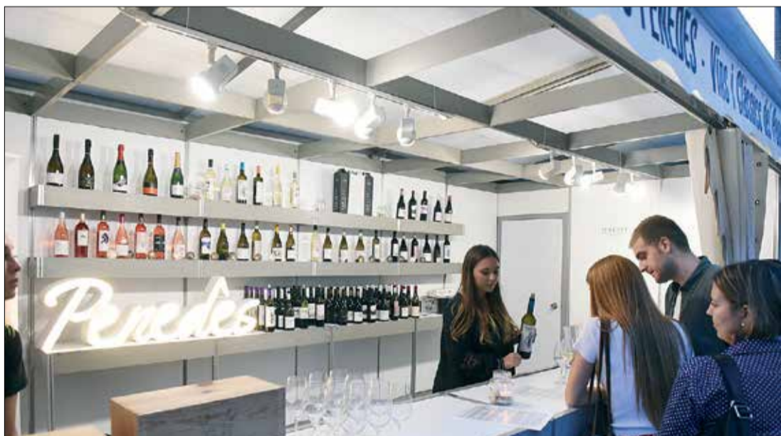
A dalt, moment d'una de les representacions de "La Fira d'abans" que fa La Lira Vendrellenca a la Ctra. del Dr. Robert. A baix, la DO Penedès té un espai a la zona del Firatast. ✦ AJUNTAMENT DEL VENDRELL

En aquest mateix emplaçament, però en un espai diferenciat s'ubica la zona gastronòmica i de tastos, enguany amb més participants i més espai que en anteriors edicions. Comprant un tiquet, el visitant pot degustar alguna de les propostes gastronòmiques elaborades per restauradors locals i maridar-les amb els vins i Clàssic Penedès d'onze cellers inscrits a la DO Penedès.