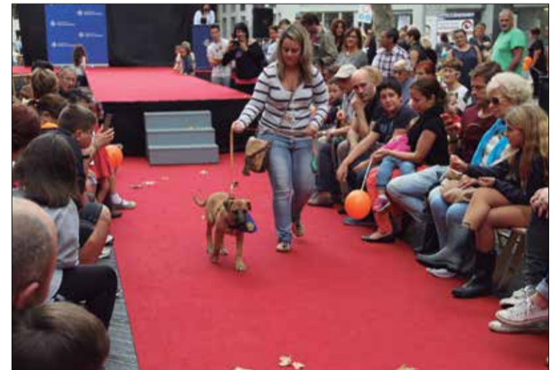
Desfilada d'una edició anterior de la Festa, a la rambla.