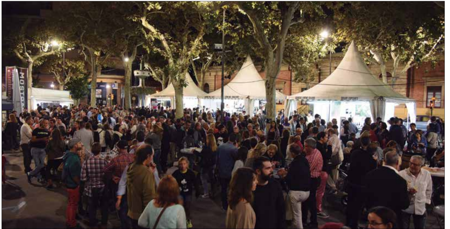
Enguany la zona Firatast comptarà amb més espais i més estands. ✦ AJUNTAMENT DEL VENDRELL