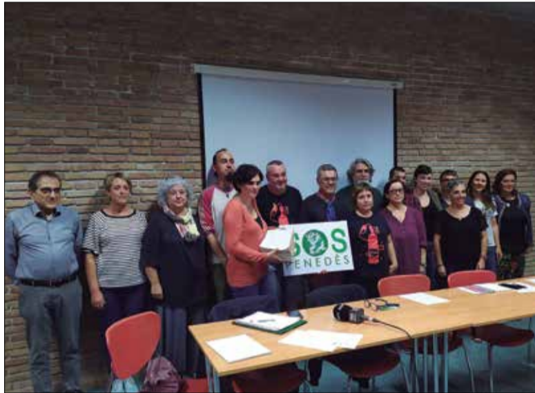
Representants de diferents entitats que formen part de SOS Penedès.