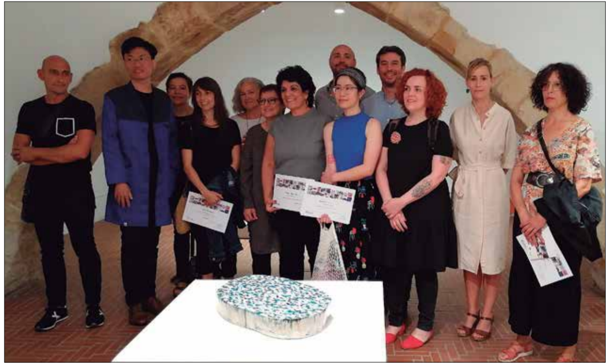
Ceramistes premiats seleccionats pel jurat de la Biennal.

La presència de la ceràmica com a activitat econòmica al Vendrell es remunta als segles XVII i XVIII. Les primeres referències de tallers terrissaires a la vila daten de 1879. Se sap que aquests tallers s'instal·laven fora de les muralles per evitar els fums molestos i el risc d'incendis, justament per això tota l'activitat terrissaire es concentrava als voltants del torrent de la Bisbal, que, alhora, era un dels llocs on s'obtenia la matèria primera, l'argila. També s'obtenia en altres indrets com Mas Borràs, Mas Canyís, les Torretes i Tomoví. Un altre material imprescindible per fer terrissa i que es trobava a la zona era el sauló (saldo al Vendrell), una sorra groguenca que s'emprava per recobrir les parets interiors dels forns. El sauló s'obtenia a Sant Vicenç de Calders.