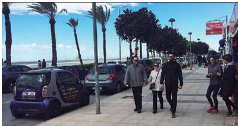
La vorera del passeig es farà tota nova. ✦ AJUNTAMENT DE CALAFELL

L'Ajuntament de Calafell començarà aquest mateix mes d'octubre les obres de reurbanització de la vorera de banda muntanya del passeig Marítim a Segur de Calafell, que han de resoldre els problemes històrics de conservació causats pel mal estat de les conduccions soterrànies d'aigua i clavegueram i pels arbres plantats. Afectaran un quilòmetre de vorera, tindrà un cost d'un milió d'euros i els treballs s'allargaran durant cinc mesos i mig, amb aturades per Nadal i per Setmana Santa.