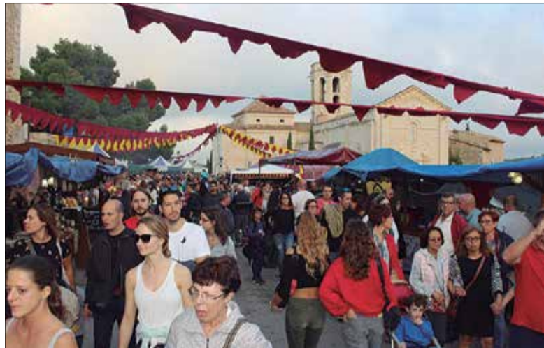
El conjunt monumental acull la fira medieval martinenca.

Un dels punts forts serà la visita teatralitzada al castell, prèvia inscripció al punt d'informació. Durant la visita, centrada entre el període medieval i la Guerra de Successió, es podrà veure la Reina