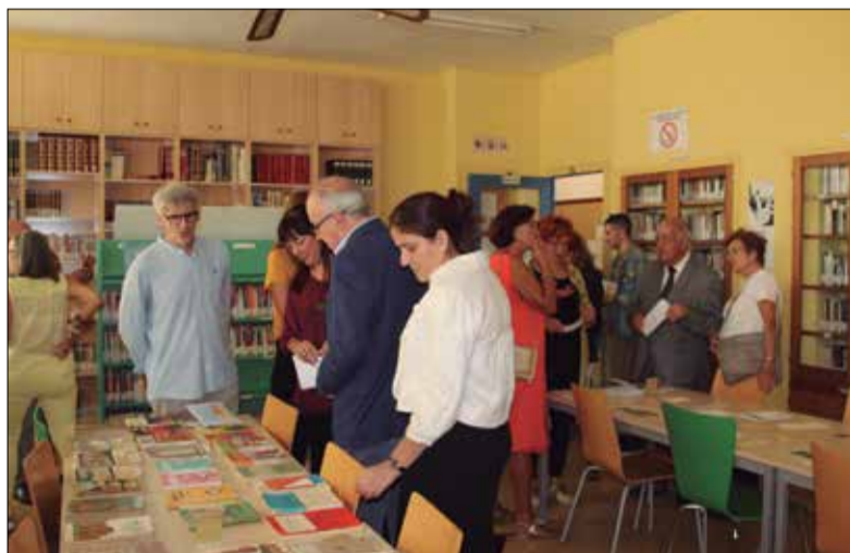
Visita de les autoritats a la biblioteca de l'escola. ✦ LA FURA

El conseller d'Ensenyament de la Generalitat, Josep Bargalló, i l'alcalde Olga Arnau van ser les màximes autoritats que van participar diumenge en l'acte de celebració del cinquantesim aniversari de l'Institut Manel de Cabanyes, coin-