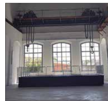
La Nau passarà a formar part de l'exposició del museu dels trens.