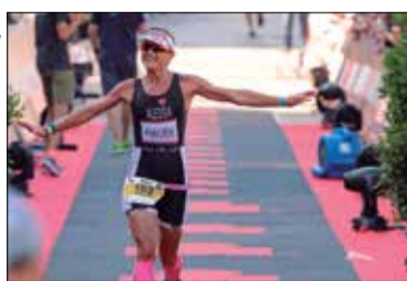
* TRIATHLON VILARENC AÏUA

Aqua, pel seu paper de promoció de l'esport i la salut. A més, va ser la primera dona que va finalitzar l'Ultra Tri Spain i desena classificada absoluta el mes de maig.