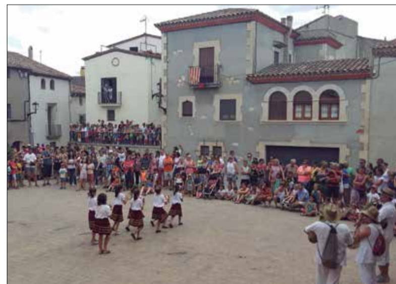
El diumenge a la tarda els petits agafen el relleu. ✦ AJUNTAMENT DE LA GRANADA

Aquest cap de setmana els carrers de la Granada acolliran la seva Festa del Most per celebrar que s'acaba la verema d'aquest 2019. La pedalada popular i el sopar d'entitats encetaran la festa avui al vespre, i el dissabte al matí els més esportistes podran participar a la 3a Cronoescalada, que també s'emmarca a la festa major de Santa Fe.