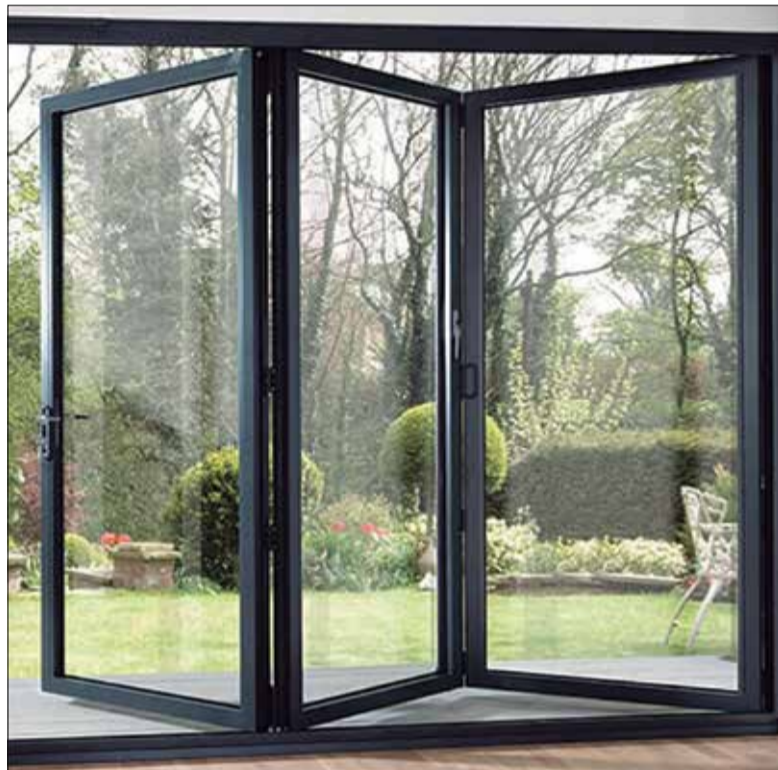
* ACE ARCHITECTURAL PRODUCTS