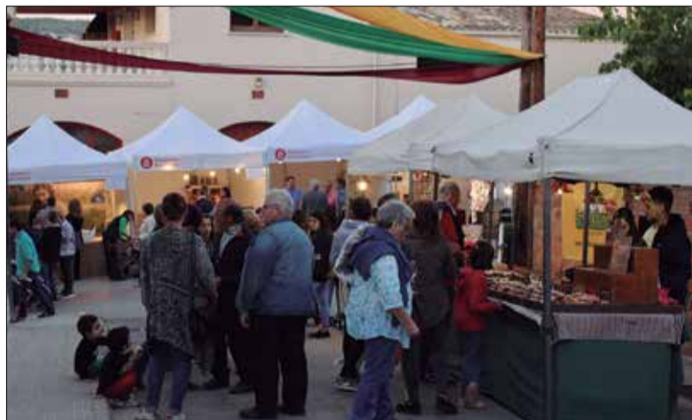
El Vinòleum i la Festa del Most se celebraran el 19 i 20 d'octubre.

El cap de setmana que ve, 19 i 20 d'octubre, Guardiola de Font-rubí celebrarà la tercera edició de la Fira Vinòleum i la Festa del Most; dos esdeveniments que tenen el vi, l'oli, la gastronomia i l'artesanía com a eixos vertebradors al voltant