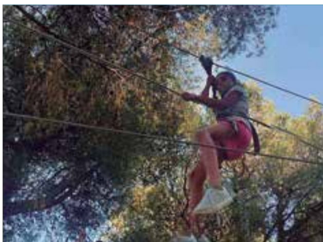
El mar i la muntanya són alguns dels llocs que més impacten els joves refugiats sahrauís.