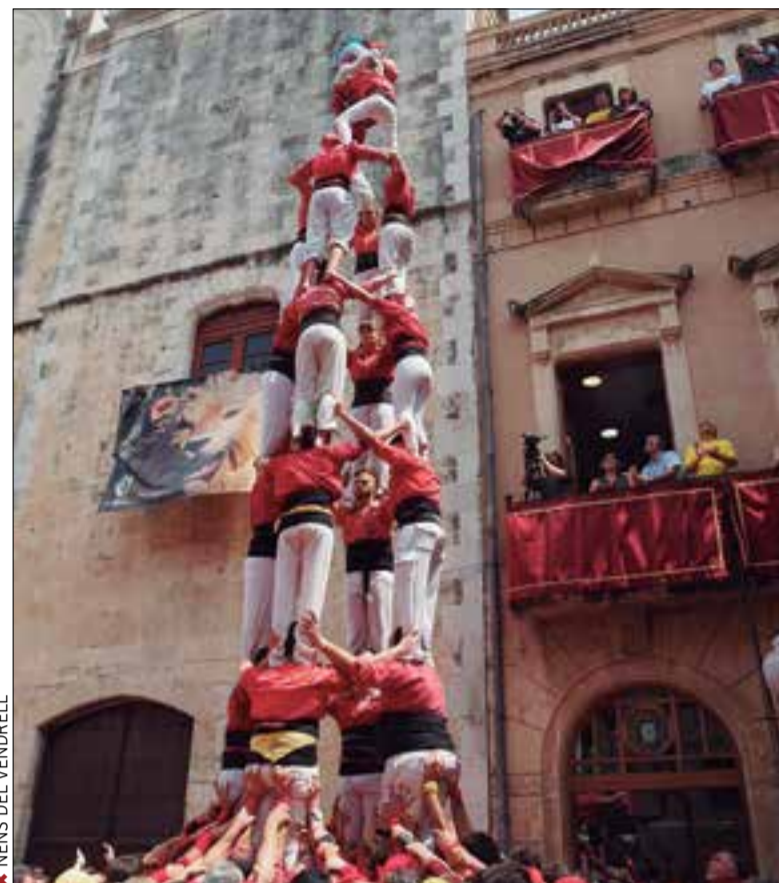
✖ NENS DEL VENDRELL