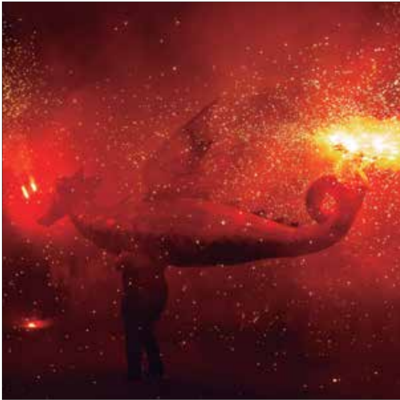
El Drac Quintifoc va ser construït ara fa 65 anys