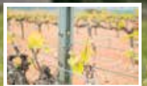
Separador de filferros per a emparat