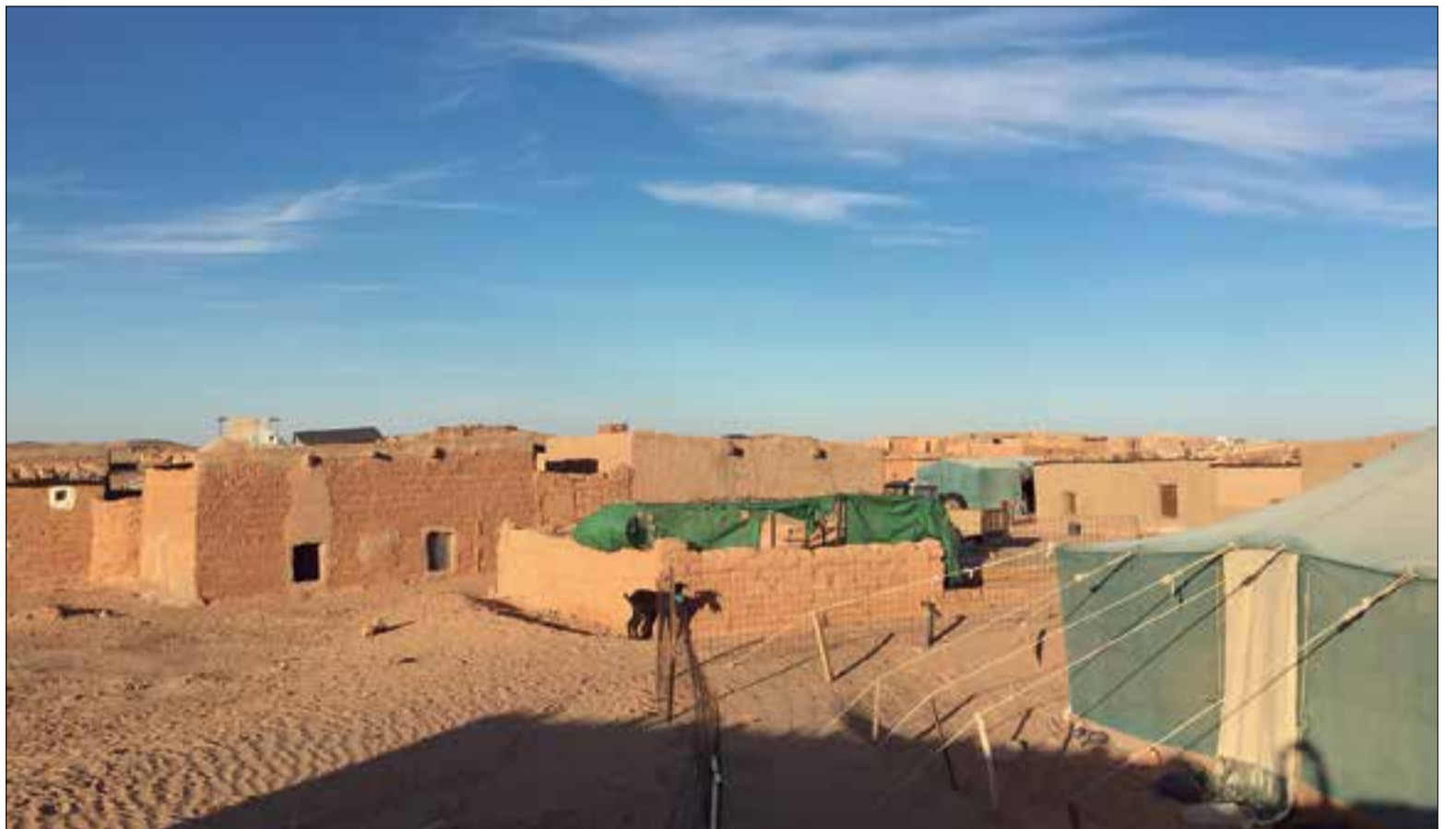
A Algèria els sahrauís viuen al mig del desert repartits en diversos campaments, anomenats wilaies, sense aigua corrent. ✦ CATALUNYA AMB EL SÀHARA