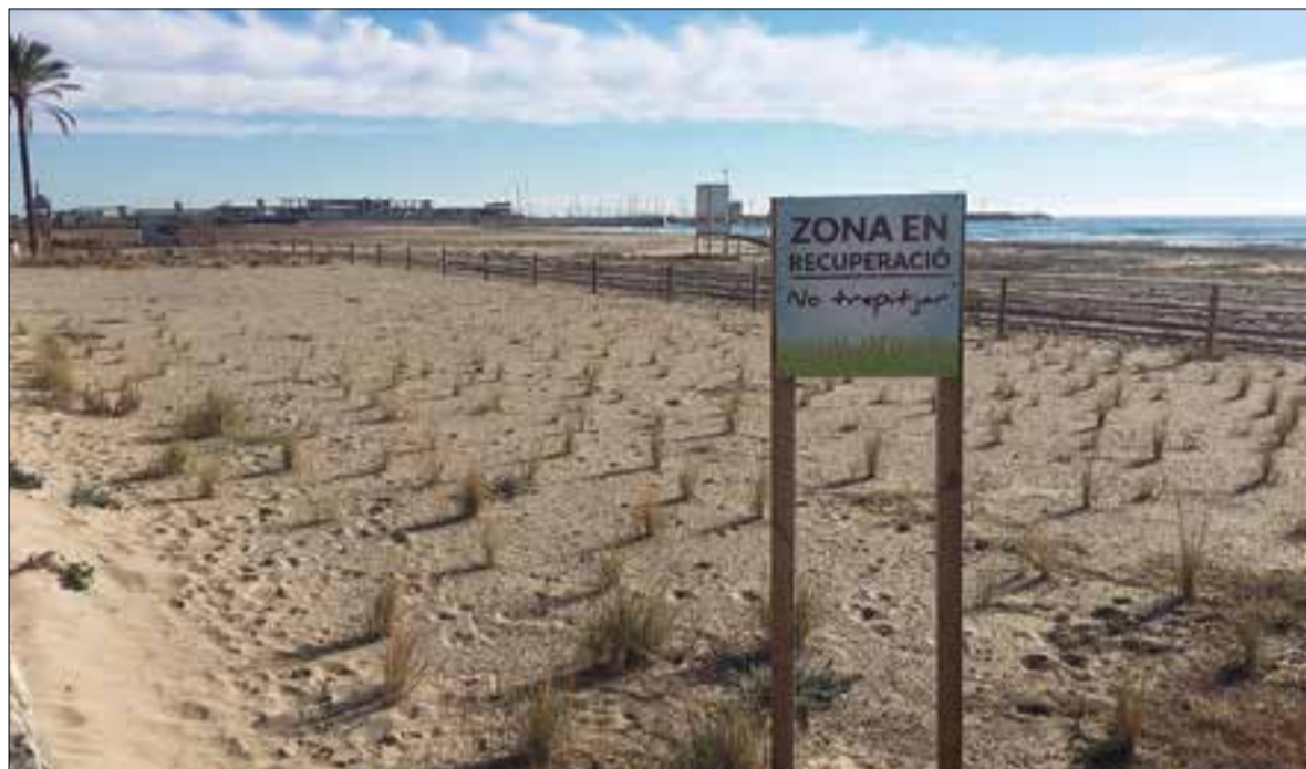
Prova pilot de plantació vegetal a la platja de Segur.

El Servei de Costes de l'Estat finançarà al 100% el projecte per a la regeneració natural de les platges de Calafell. Hi destinarà 308.000 euros del pressupost per a la lluita contra el canvi climàtic, i la seva intenció és fer-ho abans d'acabar l'any entre l'Estany de Mas Mel i el límit de terme amb Cunit, segons informa l'Ajuntament.