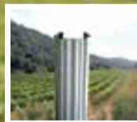
Pals per a emparat

TDF és un producte amb patent a la UE que serveix per tibar i destensar gradualment els filferros, com el doble filferro mòbil de l'emparat de les vinyes