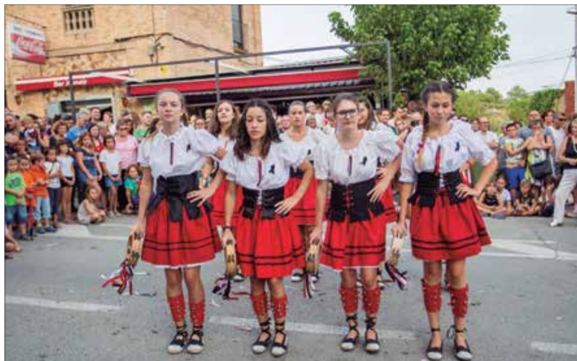
El Ball de Panderetes enguany celebra el seu 50è aniversari i per això farà el pregó de la festa major. ✳ AJUNTAMENT

Plaça Pi i Margall, 2 · Sant Quintí de Mediona · Tel. 93 899 84 67