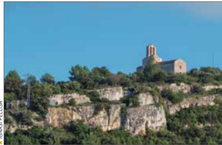
❖ IGNASI PELLUSA

El Museu d'Arqueologia de Catalunya i l'Ajuntament d'Olerdola han organitzat per a aquest mes d'agost tres capvespres especials al conjunt històric per reivindicar el paisatge i el patrimoni penedesenc.