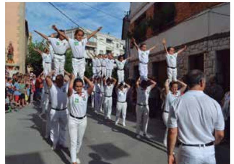
Els grups folklòrics locals faran l'ofrena al patró el dia 10. ✨ AJUNTAMENT

A la nit començarà el correfoc que precedirà la lectura dels versots i la carretillada. En acabar, al carrer Francesc Macià es faran els castells dels aficionats locals, un dels actes més singulars i especials de la festa major. Nens, joves i grans perta-