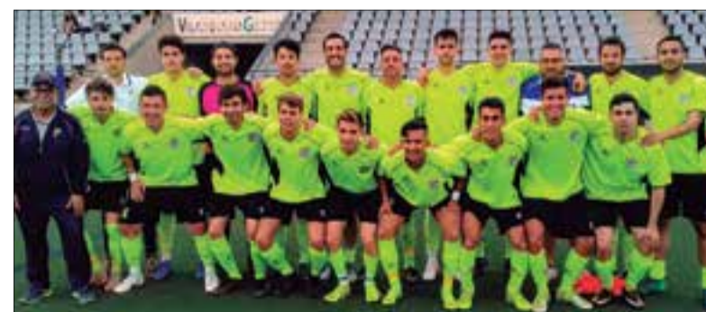
La plantilla del Molanta d'enguany.

El dissabte 10 d'agost, a 2/4 de 7 de la tarda, el CFP Sant Pere Molanta i l'Atlètic Vilafranca es disputaran a partit únic la 32a Copa Olèrdola de futbol, un clàssic de l'estiu. El partit es jugarà al camp del Molanta i permetrà veure en acció al segon millor club de la comarca, l'Atlètic Vilafranca, po-