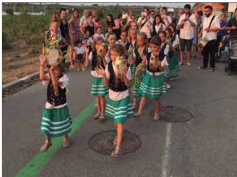
Les panderetes sortiran, com la resta de balls, el divendres 2. ✦ AJUNTAMENT

Des d'avui i fins al 6 d'agost les Cabanyes viu la seva festa grossa. Aquest divendres la festa major arrenca amb tot el seguici popular local. I és que a les vuit del vespre pels carrers del poble, hi ballaran el Drac, els Diables, les Panderetes, els Gegants i el Ball del Patufet acompanyats pels Falcons de Vilafranca i un grup de grallers. En arribar al Centre Cultural i Lúdic tots faran una ballada de lluïment i tot seguit, a la pista del Centre començarà el concert amb el conjunt MúXXXL.