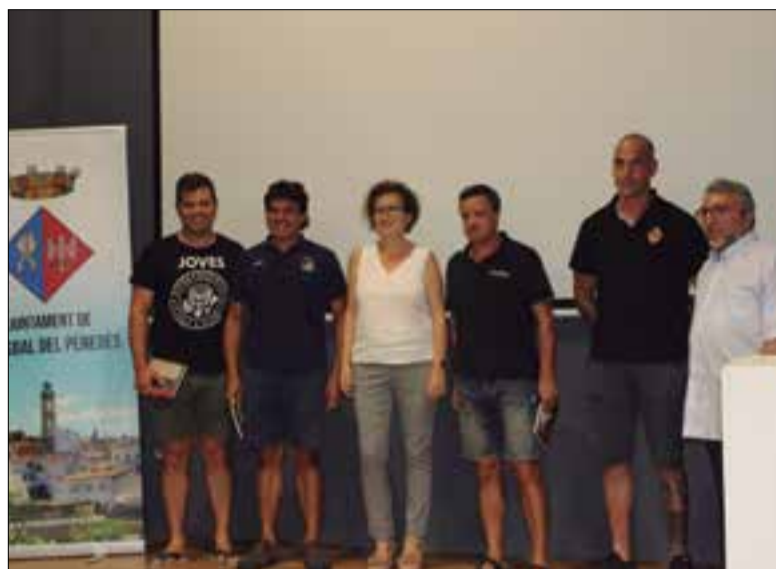
Els caps de colla, amb l'alcaldessa i el regidor bisbalenc de festes. ✖ LA FURA

Quan encara falten quinze dies pel 15 d'agost, dimarts a la tarda es va presentar al Centre Municipal de Cultura de la Bisbal del Penedès la diada de la Mare de Déu d'Agost, amb la presència dels caps de colla de les tres agrupacions que hi "competiran" i d'un representant de la colla local. El sorteig va permetre als Castellers de Vilafranca decidir obrir plaça, la Colla Vella de Valls va triar ser segona i la Joves de Valls actuarà tercera. Com és habitual els últims anys, la Colla Castellera de la Bisbal aixecarà un castell abans de la diada i farà un pilar al final.