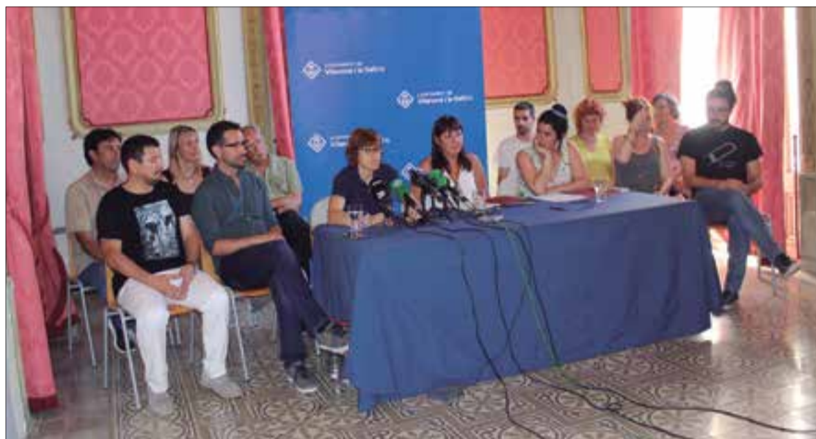
Els tretze regidors i regidores de govern, presents a la firma del pacte, a la sala noble de la Casa Olivella. ✦ LA FURA

ERC, JxC i CUP consideren que la llarga negociació els ha enfortit. Han pactat 288 mesures concretes, ampliables