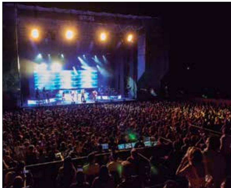
George Benson i Rick Astley, dues de les estrelles que han passat per l'auditori dels jardins Terramar.

La tercera edició del festival Terramar Sitges arriba aquest cap de setmana a la seva fi amb tres concerts protagonitzats per algunes de les estrelles d'avui i d'ahir, com són Morat (avui divendres), Hombres G (demà dissabte) i Niña Pastori (diumenge), en tots tres casos a les 10 del vespre, a l'auditori dels jardins de Terramar.