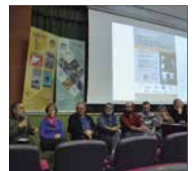
Taller a la Casa de Cultura.