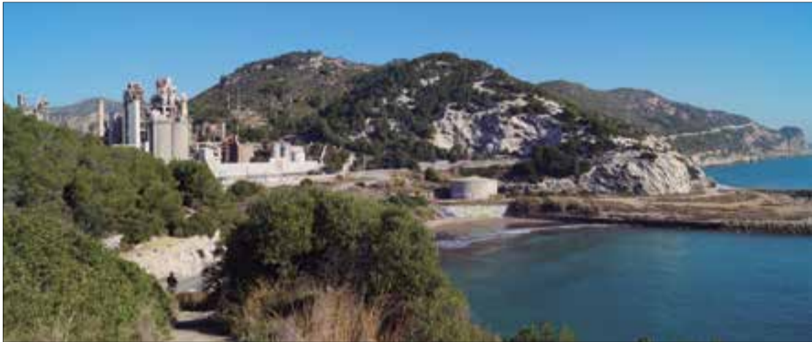
✖ OBSERVATORI DEL PAISATGE

Aquesta unitat de paisatge del Penedès engloba, bàsicament, la part més septentrional dels municipis de Calafell, Cunit i Cubelles, una part de Castellet i la Gornal, Santa Margarida i els Monjos, Sant Pere de Ribes, Olèrdola, Avinyonet del Penedès, Olesa de Bonesvalls, Sitges i Begues, així com la totalitat de Canyelles i Olivella.