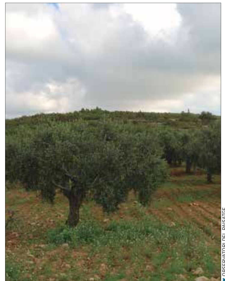
✖ OBSERVATORI DEL PAISATGE

Són nombrosos els valors d'aquest paisatge. La peculiar geomorfologia associada al paisatge càrstic, amb rasclers, dolines, pòlies, fondos i avencs representa un valor natural important i distintiu. Pel que fa als valors patrimonials i històrics, destaca el conjunt emmurallat d'Olèrdola, amb el castell, l'església i restes arquitectòniques de diferents èpoques. Els diversos castells i torres de defensa (castell d'Olèrdola, el castell d'Eramprunyà, el de Canyelles, el de Castellet...) evidencien que fou un territori de frontera i també la necessitat de defensa contra la pirateria. També sobresurt l'hospital medieval d'Olesa de Bonesvalls. La platja del Garraf, relativament poc urbanitzada i amb unes casetes de bany de principis de segle té també un valor paisatgístic destacat.