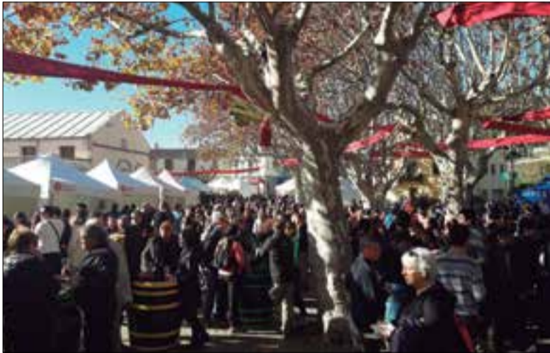
Gernació omplint l'any passat la plaça Subirats.

Diumenge tindrà lloc a la plaça Subirats la 14a edició del Subirats Tasta'l, la fira de vins, caves, gastronomia i productes de la terra que organitza l'Ajuntament per mostrar en un sol dia el bo i millor del municipi en aquests àmbits. Serà d'11 del matí a 3 de la tarda, enguany amb disset parades de cellers i caves del municipi, vuit de productes de la terra i artesans, set de gastronomia i vuit artistes també presents. La inauguració anirà a càrrec de l'alcalde d'Avinyonet del Penedès, Oriol de la Cruz.