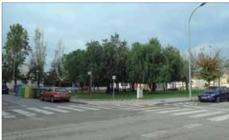
El nou ambulatori es construirà davant la Biblioteca. ✱ AJUNTAMENT

La nova ABS Alt Penedès Sud quedaria formada pels municipis de Santa Margarida i els Monjos, Olèrdola (excepte els nuclis de Sant Pere Molanta i Can Trabal), Castellví de la Marca (la Múnia), Sant Martí Sarroca, Torrelles de Foix, Pontons, els nuclis de Torrelletes, Sant