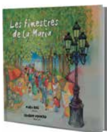
El llibre serà presentat diumenge.

Amb aquest conte, aquesta pionera del món de la il·lustració a Catalunya i autora dels dibuixos de més de 350 llibres celebra els seus 80 anys i els més de 50 anys de professional de la il·lustració. Amb textos de Joaquim Nogueira, Rius hi explica la seva trajec-