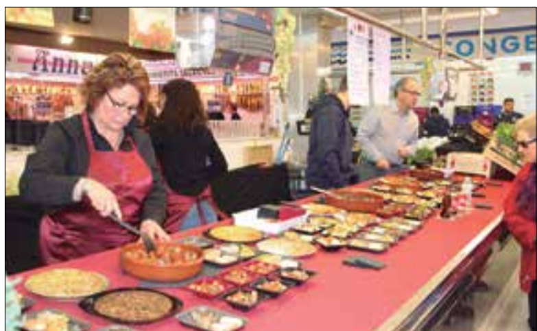
Taulerell parat al Mercat, durant la xatonada de l'any passat.