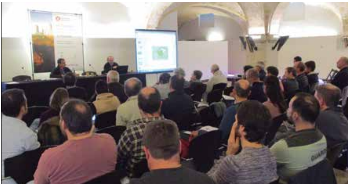
A la trobada d'estudiosos es van pronunciar una cinquantena de ponències. ✦ LA FURA

La trobada d'estudiosos dels parcs naturals constaten la mala salut de ferro de les zones més vulnerables