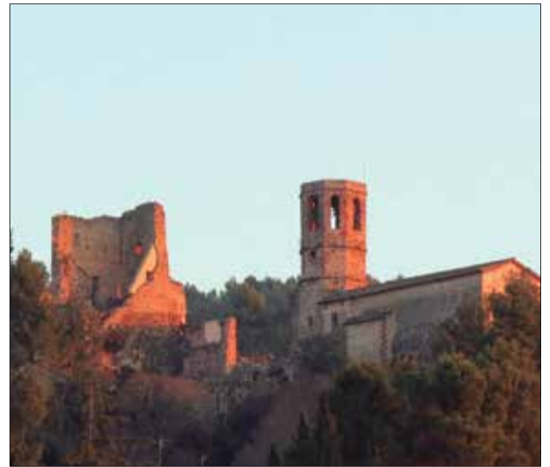
L'Església va posar al seu nom l'església del Castell de Gelida.