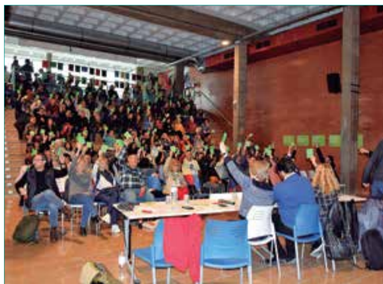
Dissabte va tenir lloc a El Local de Ribes la primera assemblea.