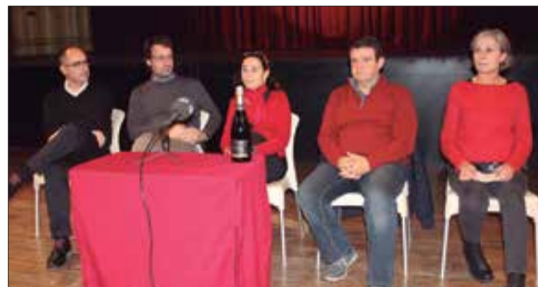
Presentació de la Setmana, a la platea del Casal.