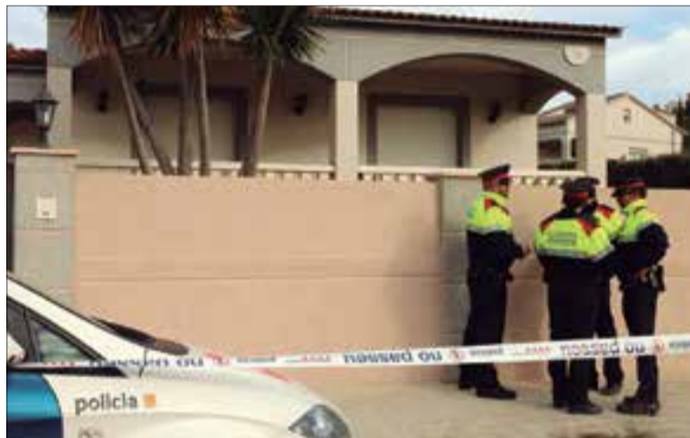
Els Mossos, davant la porta de la casa on residia.

Una dona apareix morta a casa seva al Nou Vendrell