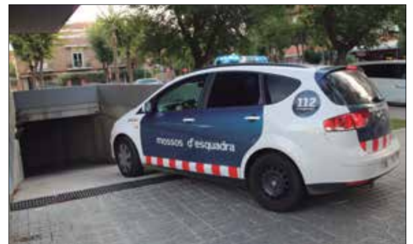
En el que es porta d'any hi ha hagut 2.450 infraccions penals. ✦ ACN