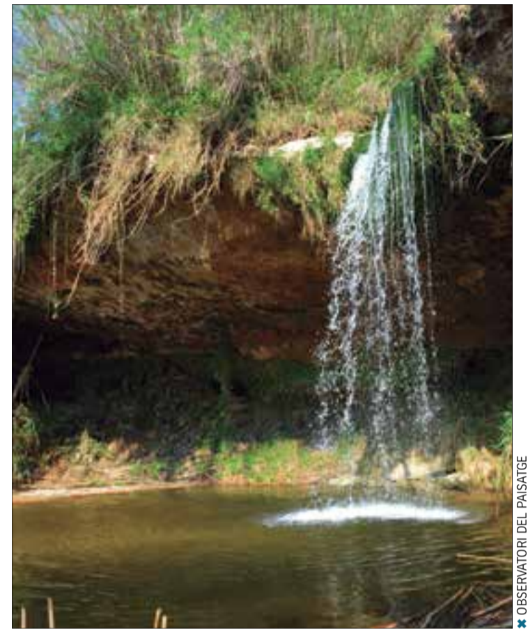
★ OBSERVATORI DEL PAISATGE

Els valors del paisatge de la Plana del Penedès són nombrosos. Destaca la silueta de Montserrat com a fons escènic del paisatge de la unitat. També les abundants mostres d'arquitectura rural i les esglésies i monestirs romànics, com Sant Martí Sarroca, Sant Sebastià dels Gorgs i Sant Valentí de les Cabanyes. Els castells i les torres són altres elements de referència que, per la seva localització, es divideixen des de diferents àmbits de la unitat; per exemple, el castell de Sant Martí Sarroca, el castell de Castellet (Castellet i la Gornal) o el Castellot (Castellví de la Marca).