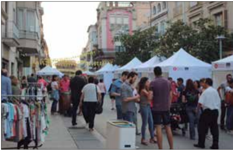
Cavamarket que es va fer a l'estiu al carrer Raval.