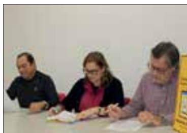
La fira l'organitza l'ANC. ✱ LA FURA