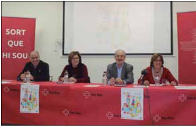
L'any passat la campanya va atendre entre 500 i 600 infants. ✱ LA FURA