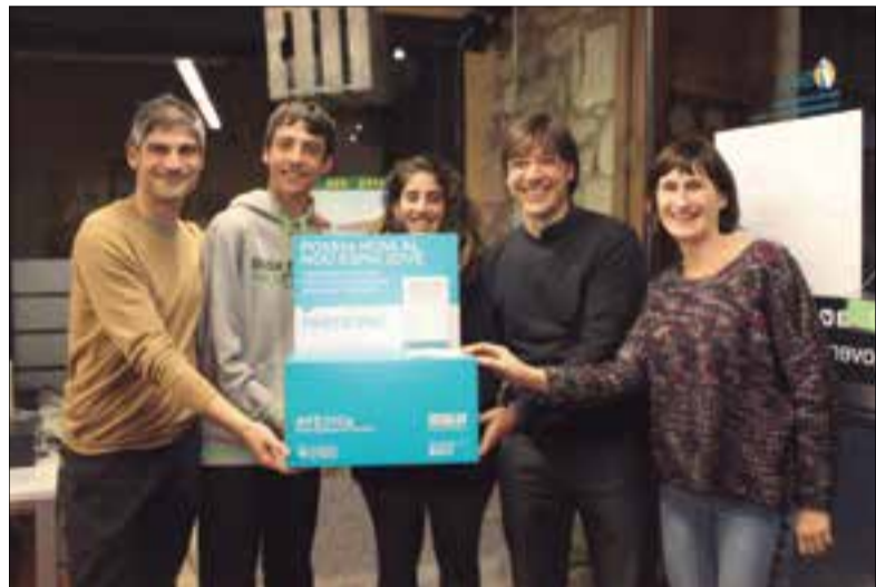
Hi ha tretze urnes per poder votar i decidir el nom de l'espai. ✱ LA FURA

Fins al 14 de desembre els joves de la vila poden escollir el nom entre quatre propostes