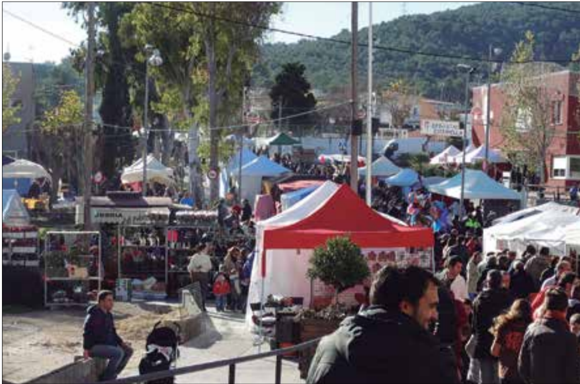
Amb 350 parades, és la segona Fira de Santa Llúcia per dimensió de Catalunya.

Els dies 1 i 2 de desembre tindrà lloc la 16a edició de la Fira de Santa Llúcia a Canyelles, avantsala del Nadal