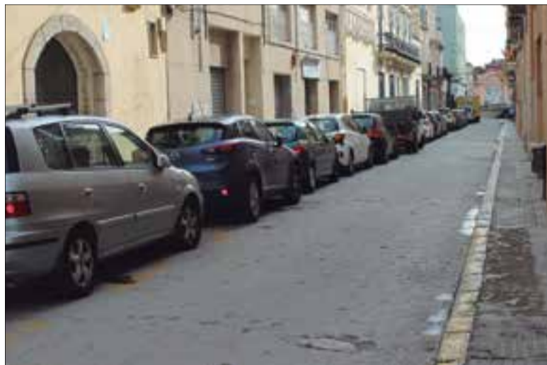
El carrer s'omplirà de jardineres i no s'hi podrà aparcar.

L'equip de govern de l'Ajuntament de Vilafranca ha presentat la remodelació que es desenvoluparà al carrer del Casal, que afectarà el tram des del passatge de l'Alcover fins a l'alçada de les escales dels serveis mèdics.