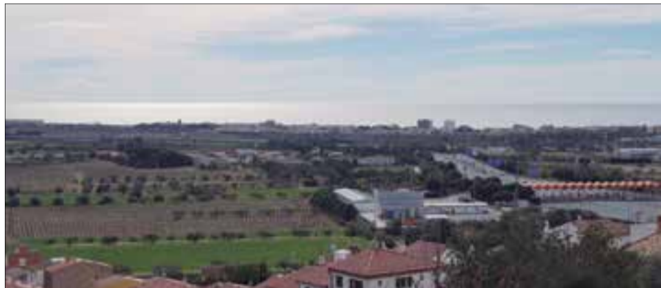
✦ OBSERVATORI DEL PAISATGE

Aquesta unitat pertany a la faixa de costa baixa densament urbanitzada, amb un continu de construccions que s'estén des de Cunit fins al promontori de Berà. El paisatge de primera línia de costa està format per abundants construccions i cap a l'interior hi ha urbanitzacions compactes.