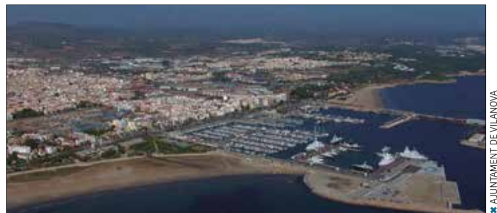
* AJUNTAMENT DE VILANOVA

Els valors del paisatge de les Serres d'Ancosa són nombrosos. Sobresurten els molins hidràulics que ressegueixen la riera de Pontons i el riu Foix. De patrimoni rural cal mencionar les grans masies amb valor històric i arquitectònic, com les de mas Pontons, Ginols, can Vic o Puigfred, així com les barraques de vinya i els marges de pedra seca. Pel que fa al patrimoni religiós, destacar les nombroses capelles romàniques, com la de Sant Joan de la Muntanya, Sant Pere Sacarrera i Santa Margarida d'Agulladolç i el santuari i mirador de la Mare de Déu de Foix. La unitat té diversos castells i fortificacions d'època medieval ubicats en els punts més elevats i de millor control del territori, com el de Mediona i el de Font-rubí.