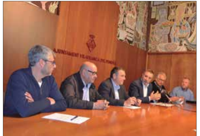
Representants del gremi amb l'alcalde i el regidor de medi ambient.

l'opció de finançar-ho en 36 mesos sense interessos. Les persones interessades a acollir-se a aquesta campanya han de posar-se en contacte amb el Gremi d'Instal·ladors de l'Alt Penedès (93 890 27 06 o info@griap.org) que els informarà sobre les tres ofertes i els facilitarà les dades de diferents instal·ladors perquè puguin posar-s'hi en contacte i fer l'estudi previ i el pressupost. A partir d'aquí caldrà demanar la llicència d'obres a l'Ajuntament (també bonificada) i, finalment, amb la instal·lació ja feta, caldrà demanar a l'Organis-