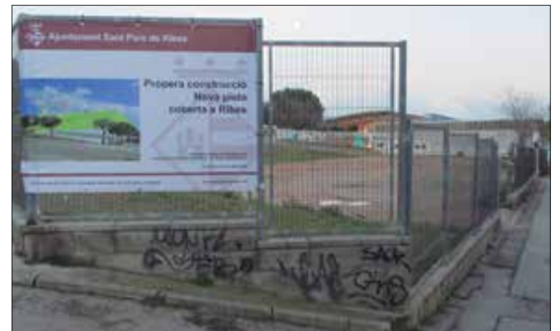
La nova pista estarà al costat del pavelló actual. ✦ LA FURA