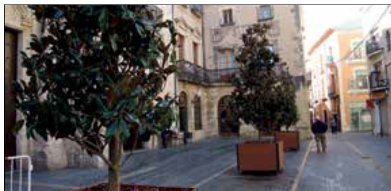
Foto d'arxiu de l'Ajuntament del Vendrell.