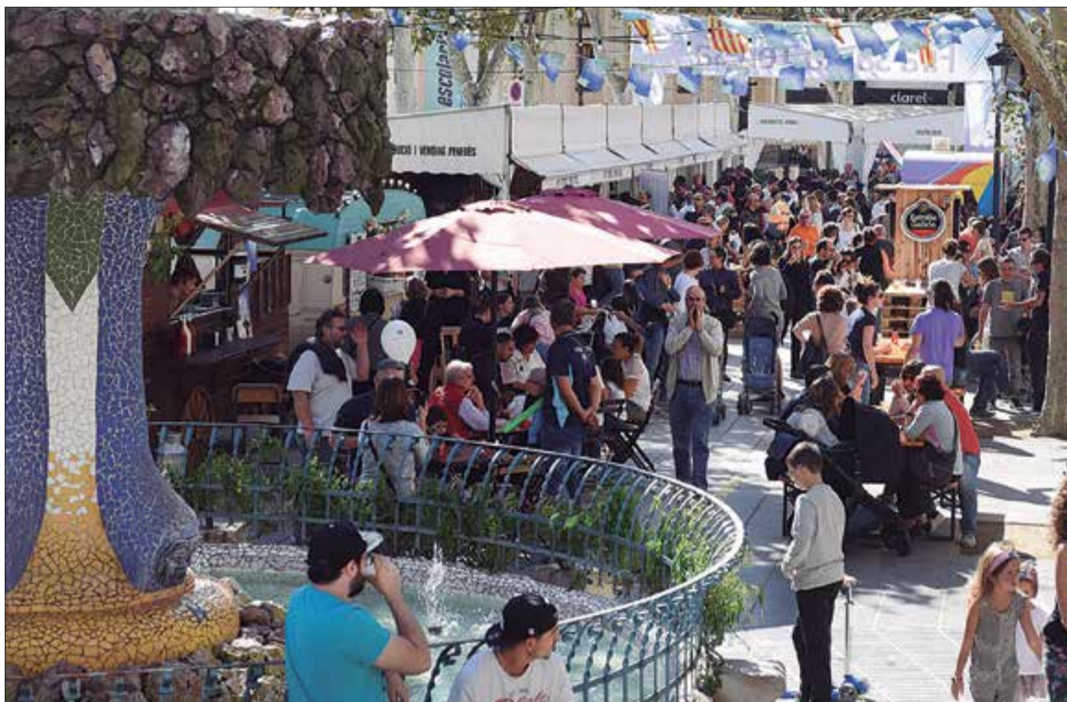
Font de la Rambla, amb els estands de fons.