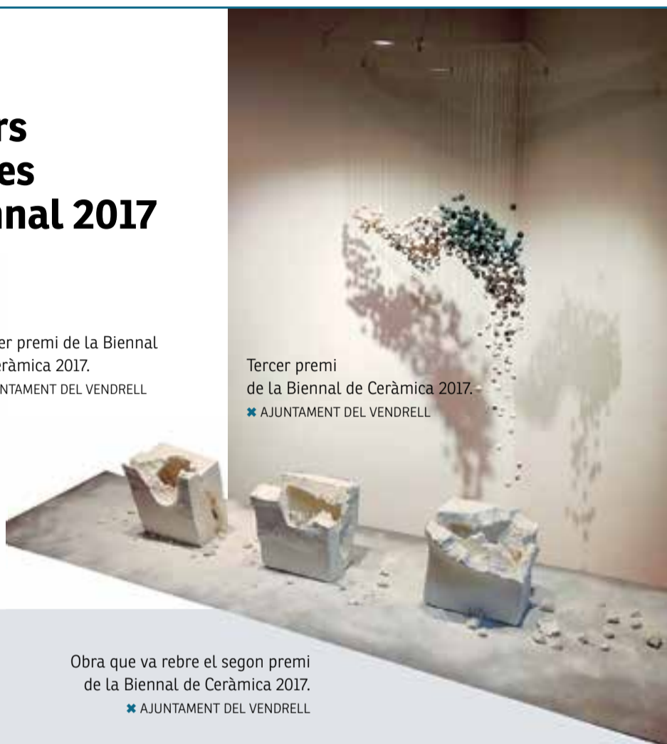
Tercer premi de la Biennal de Ceràmica 2017. ✦ AJUNTAMENT DEL VENDRELL