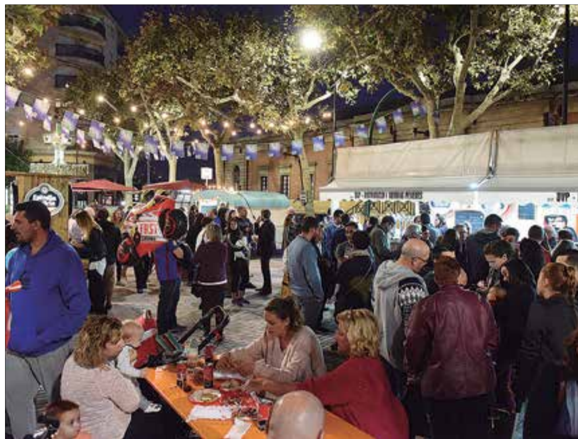
La gastronomia agafa protagonisme a l'hora foscant. ✦ AJUNTAMENT DEL VENDRELL