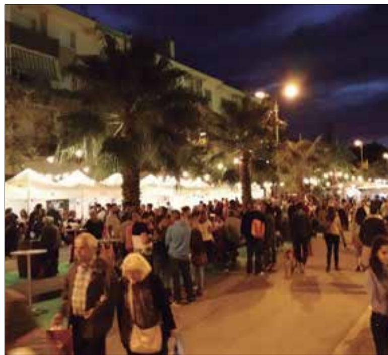
El 2017 la Mostra va estrenar ubicació.

Entre les activitats programades i novetats hi ha un porta-copes commemoratiu del desè aniversari; una actuació musical itinerant pels carrers de les Roquetes; un espectacle d'animació per a tota la família; tallers infantils saludables i sobre la sensibilització