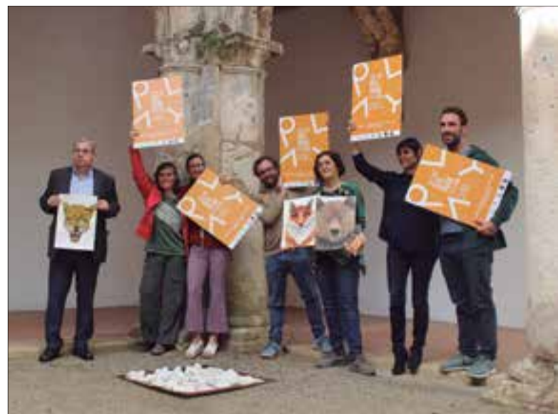
El Big Draw l'impulsen sis col·lectius d'il·lustradors i l'Ajuntament. ✱ LA FURA