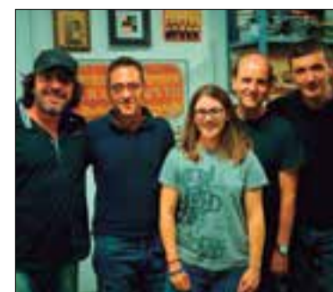
Bassart és cantautora.