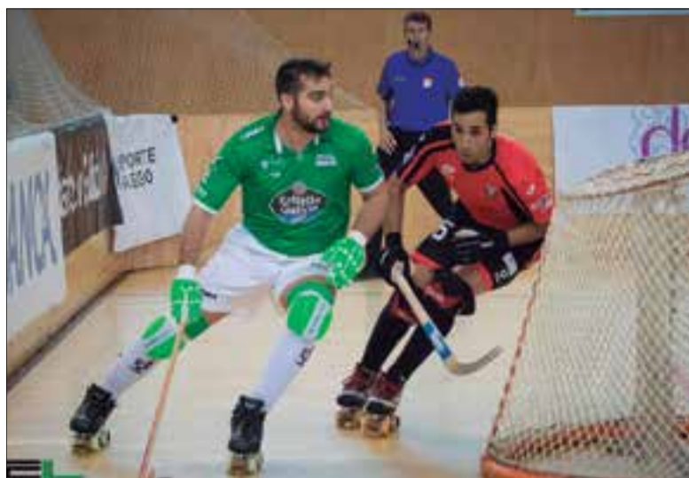
El Vendrell va encaixar un 8 a 2 en contra a la pista del Liceo. ✦ HOQUEI CLUB LICEO