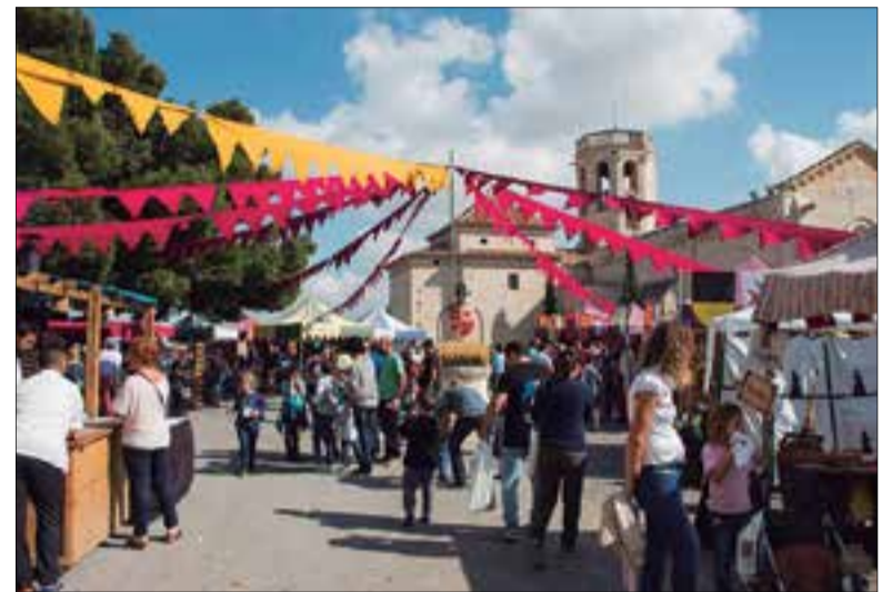
Mercat medieval al voltant del castell.

Dissabte a les 11, a la sala Ponent del Castell, es farà l'acte d'atorga-