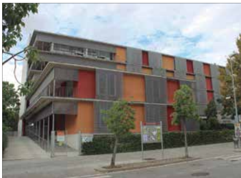
Façana del Centre Sociosanitari Ricard Fortuny.

Amb l'ampliació del Ricard Fortuny també es crearan nous llocs de treball a la comarca, s'aconseguirà una separació física de l'activitat de la residència de l'activitat sociosanitària, sense perdre les sinergies de tenir les dues activitats comunicades; i també es construirà un aparcament soterrat, de manera que les places