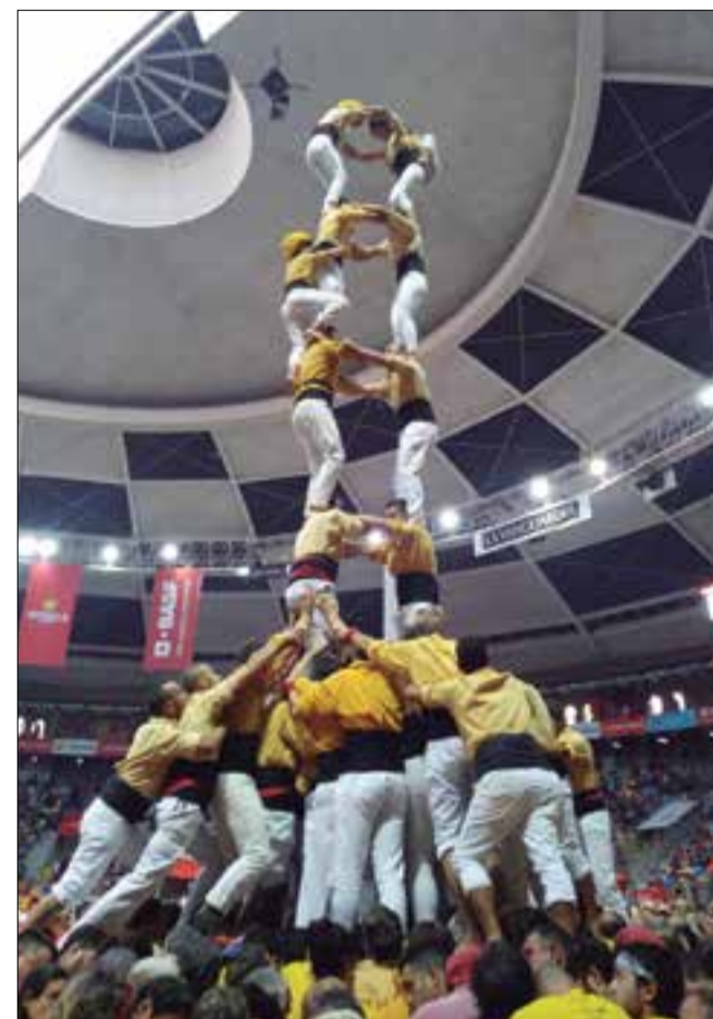
3 de 8 dels Xicots i intents de torre de 8 amb folre dels Nens i dels Bordegassos en l'actuació de dissabte. ✖ PIRO / LA FURA

ronda se'ls ensorrava de cop a les primeres de canvi, de manera inesperada, quan començaven a pujar sisens, en perdre peu un terç. Un intent decebedor que no reflectia el treball d'assaig, i que finalment i després d'una llarga deliberació no va tenir una rèplica en forma de segon intent. Els Xicots havien obert plaça amb un bon 3 de 8; després de l'intent de castell de nou van bastir la torre de 7 i, en quarta ronda, van plantar un 4 de 8 per acabar amb la clàssica de vuit, però va quedar en només carregat. No els queia el carro gros des de 2014; en portaven més de cent descarregats sense patir llenya. Tot i la fluixa actuació, van quedar quarts de dissabte, empatats amb els Castellers de Sant Pere i Sant Pau, i setzens en el global del concurs.