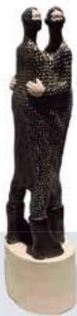
Primer premi de la Biennal de Ceràmica 2017.