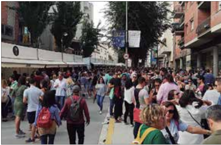
El cap de setmana passat la rambla Generalitat va acollir el 22è Cavatast.