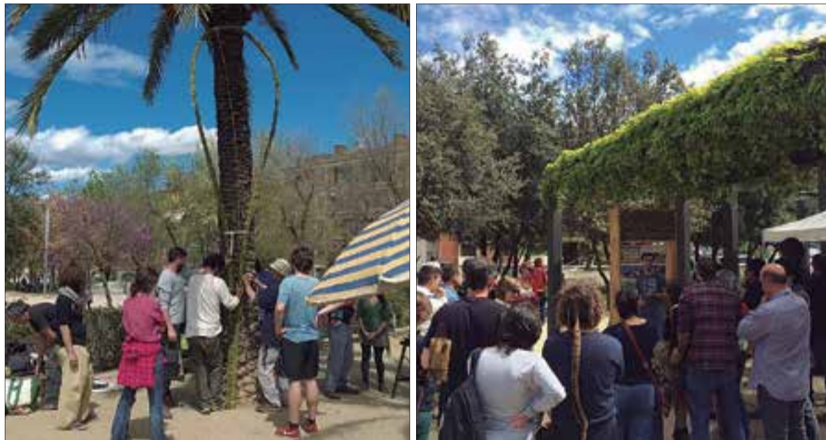
A la mostra es faran demostracions sobre bioconstrucció de tota mena. ✖ ECOXARXA PENEDÈS

La tercera Mostra de Bioconstrucció i Permacultura que havia de tenir lloc al parc de Sant Julià de Vilafranca el 14 d'abril i que es va ajornar, es farà finalment aquest dissabte, 13 d'octubre, al mateix indret. Serà entre les 10 del matí i les 8 del vespre, ininterrompudament, i s'hi podran trobar una vintena de parades/estands d'empreses i entitats relacionades amb la temàtica, i que es complementaran amb tallers, xerrades a càrrec d'experts vinguts d'arreu de Catalunya, i també activitats lúdiques i de sensibilització per a totes les edats. És el tercer any consecutiu que Ecoxarxa Penedès, amb la col·laboració de Lo Traginer, organitza una mostra que és l'única del sector que es fa a Catalunya.