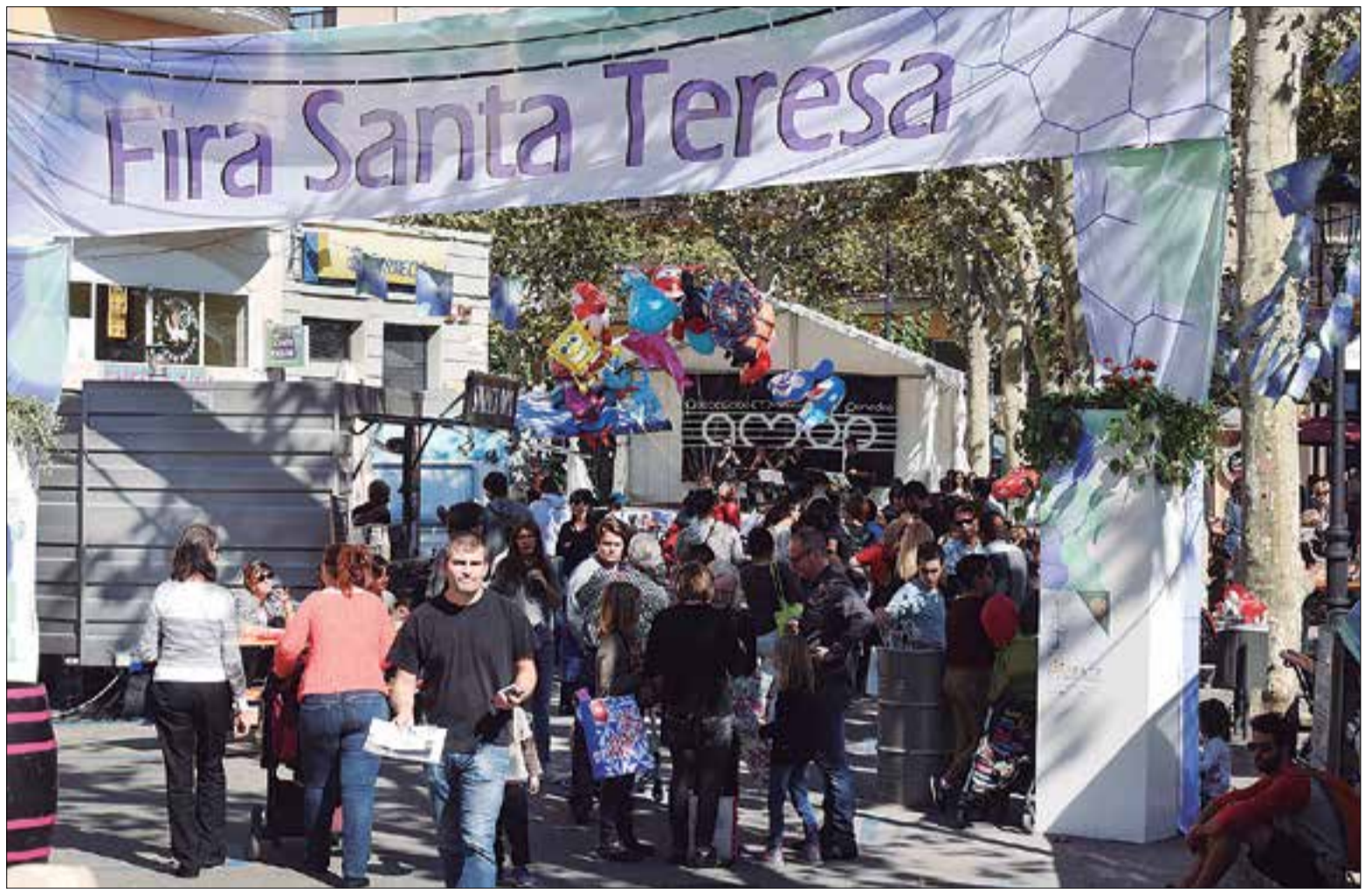
La Fira de Santa Teresa sol ser molt concorreguda.