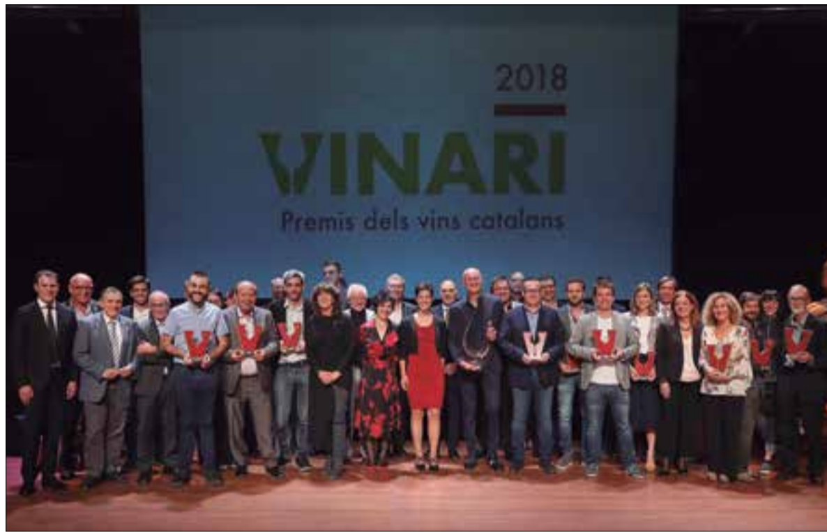
Els guanyadors dels Premis Vinari 2018.