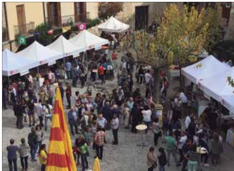
La mostra tindrà lloc al bell mig del poble. ✦ AJUNTAMENT