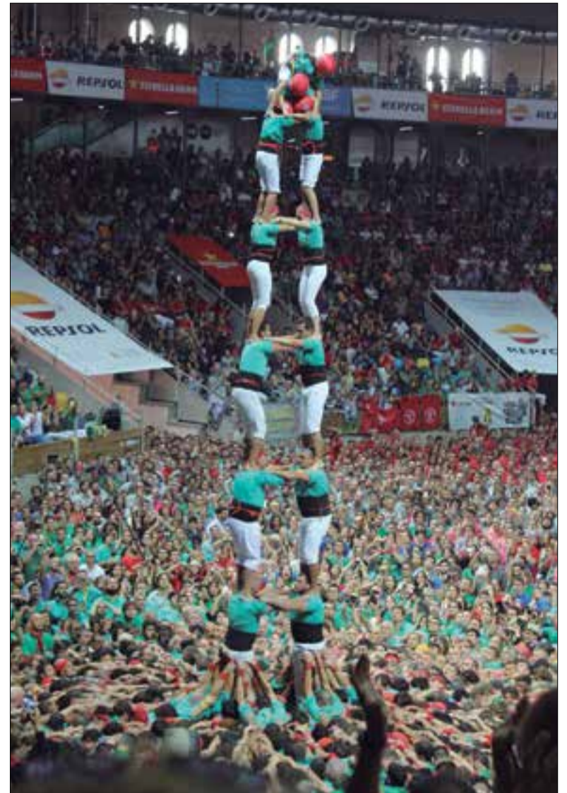
3 de 10 descarregat i torre de 8 carregada dels Castellers de Vilafranca al Tàrraco Arena. ✖ LA FURA