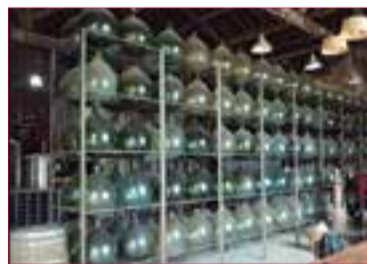
L'acció és obra de Fèlix Vinyals.