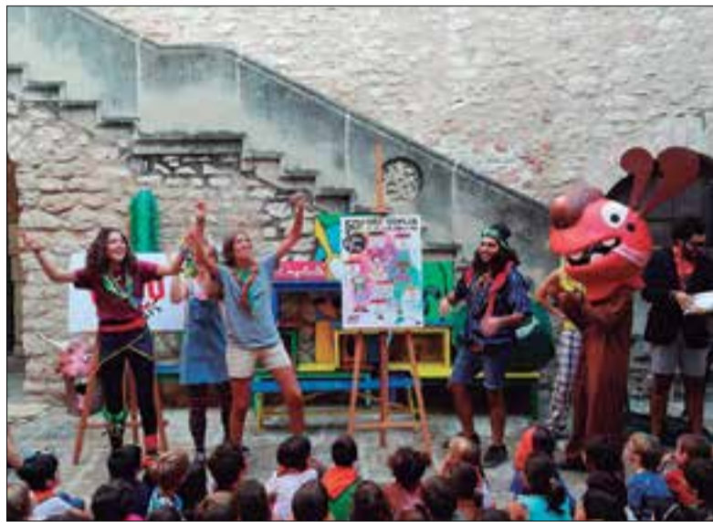
La Geltruc es va donar a conèixer durant la presentació dels actes del cinquantè aniversari de l'entitat.