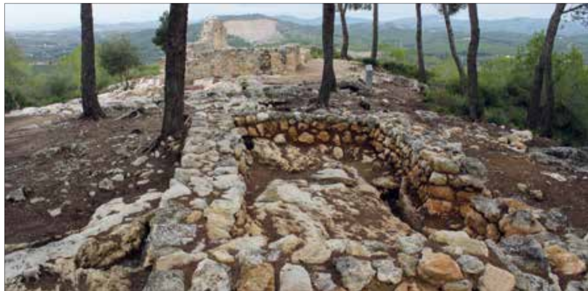
La descoberta s'ha fet després de desbrossar la zona entre l'aparcament i l'accés al Pla dels Albats. ✦ LA FURA

Estructures de cases tallades a la roca amb amplades de fins a deu metres, restes de cellers o les traces de l'antic camí d'accés al Castell d'Olèrdola han quedat al descobert després dels treballs de desbrossat que el servei de Parcs Naturals de la Diputació de Barcelona ha realitzat en el bosc al castell d'Olèrdola.