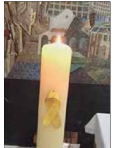
El llaç de la discòrdia.

L'Arquebisbat de Tarragona ha explicat a l'ACN que el mossèn els