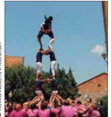
✳ MOIXIGANGUERS D'IGUALADA

Castellers de Mediona: 3/6, T/6, 4/6, P/4 Moixiganguers d'Igualada: 3/8, 4/7, 4/7a, V/5