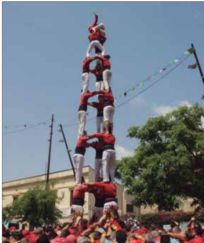
Setantè 3 de 8 descarregat pels Nens, diumenge a Calafell. ✖ JÚLIA HUGUET

Quant al pilar de 6, Vinyes vol deixar una porta oberta a intentar-lo, però veu "molt, molt, molt complicat" que estigui a punt per al dia 26 perquè "està tendre". L'assagen des de principis d'any amb dues alineacions diferents.