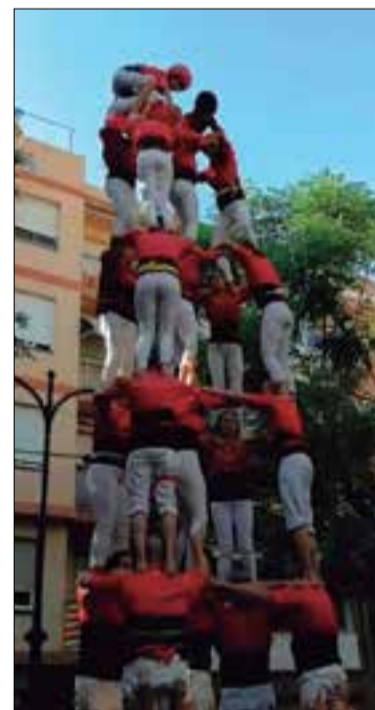
5 de 7 dels vilafranquins. ✖ XICOTS

Els Xicots de Vilafranca van descarregar el 5 de 7 com a millor castell en la diada de la Verge del Carme que va tenir lloc dissabte a la tarda al barri mariner del Serrallo, de Tarragona. Una diada de rodatge de castellers, que va començar amb uns 3 i 4 de 7 de troncs lleugers, orientats a preparar els mateixos castells amb un pis més, abans d'acabar l'actuació amb el 5 de 7.