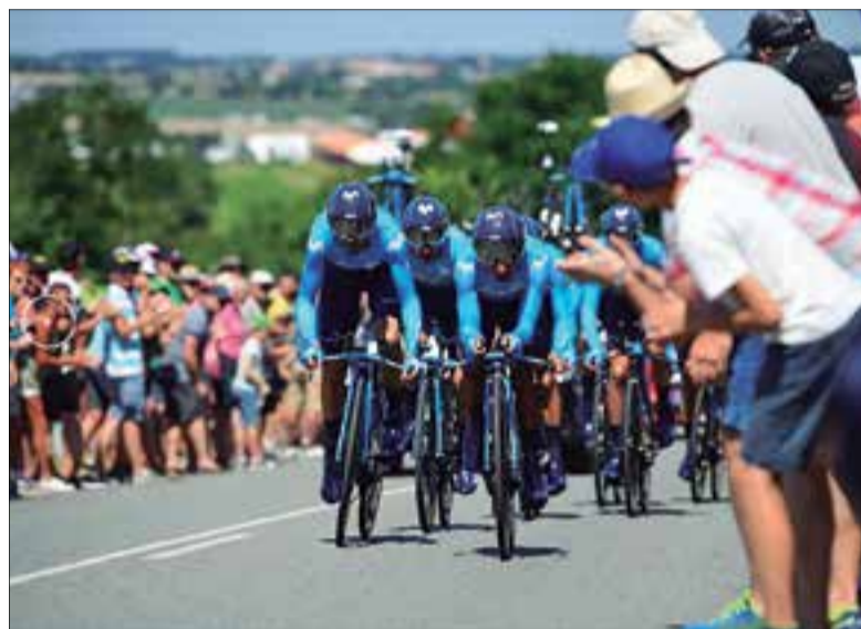
Equip Movistar Team, a la contrarellotge de la tercera etapa. ✦ TOUR DE FRANÇA

El ciclista vilanoví està tenint un molt bon debut a la prova de ciclisme en ruta més important