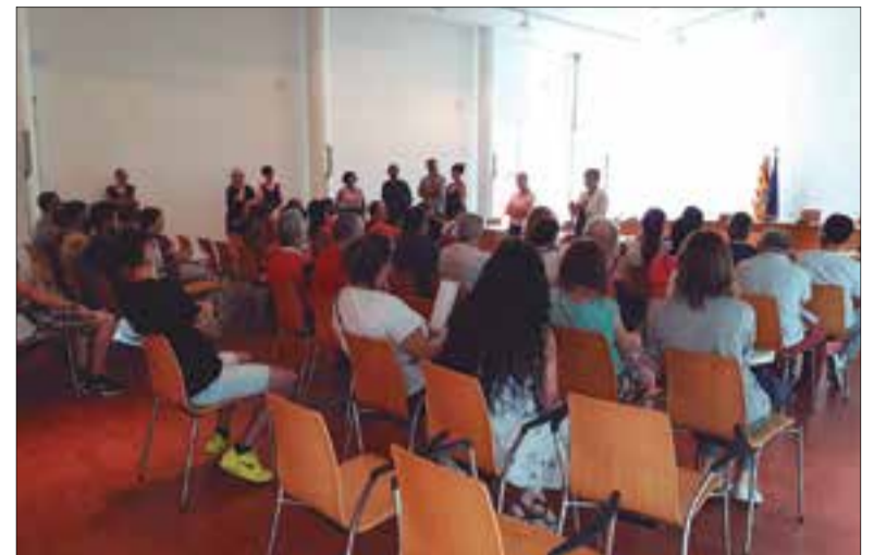
Acte de benvinguda als nous treballadors municipals. ✦ AJUNTAMENT