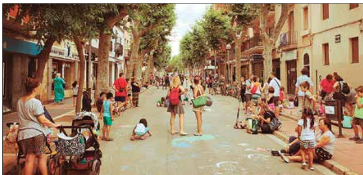
Tarda de joc lliure al carrer Llibertat tallat al trànsit, dimecres de la setmana passada. ✦ PLATAFORMA CAMINS ESCOLARS

El tall a la circulació de vehicles del carrer Llibertat, entre el carrer de l'Àgora i la plaça de la Im-