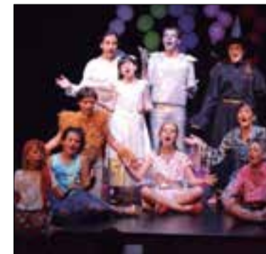
Els joves intèrprets de la cantata.

Divendres passat onze infants penedesencs d'entre 7 i 14 anys, del grup Espai de Veus, van estrenar, a l'auditori de Sant Cugat Sesgarigues, la cantata La màgia d'Oz , una de les històries nord-americanes de més èxit entre els infants d'arreu. Un cicló s'endú la Dorothy al país d'Oz, on fa tres amics: un espantaocells, un home de llauana i un lleó poruc. Junts, van a la recerca de la Ciutat Maragda, on esperen que el Màgic d'Oz doni a cadascú el que necessita.