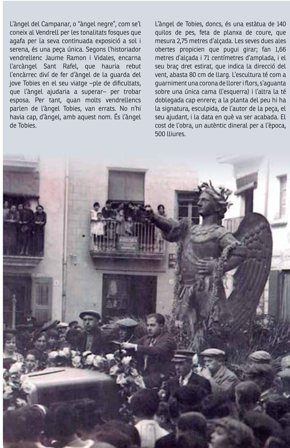
L'àngel, traslladat dalt d'un tractor pels carrers del Vendrell, després de la seva baixada l'any 1928.