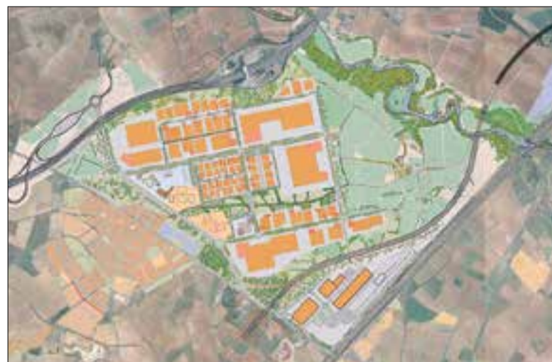
Banyeres és el municipi més afectat pel Logis.

L'alcalde banyerenc discrepa amb el sistema intermodal per traslladar les mercaderies dels camions al transport ferroviari,