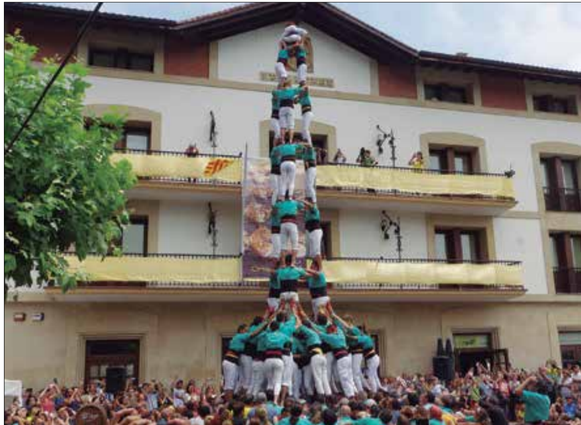
3 de 9 amb folre descarregat a Orio. ✳ CASTELLERS DE VILAFRANCA