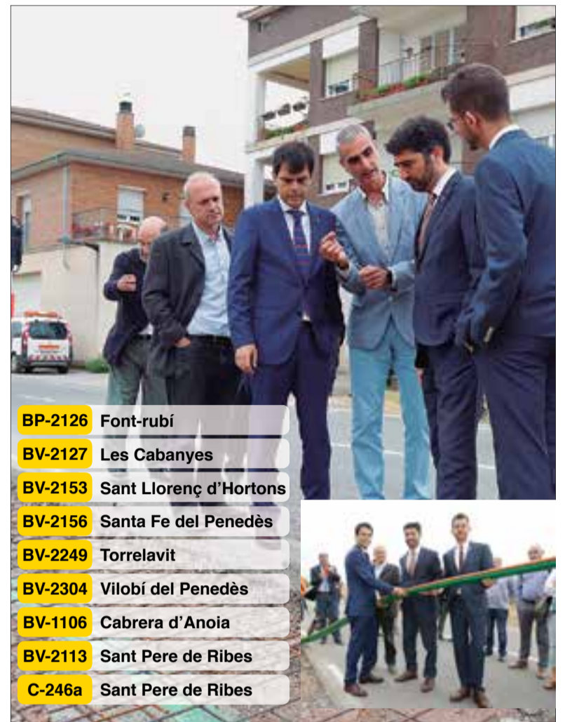
Es passarà la fibra òptica per uns 29 km de carreteres de la vegueria.

Es preveu que un cop finalitzada aquesta primera fase, el projecte es vagi ampliant amb actuacions a més carreteres.