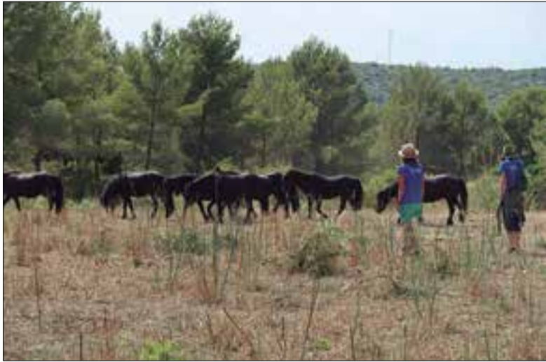
El parc ja té experiència en equins alliberats. ✦ DIPUTACIÓ DE BARCELONA