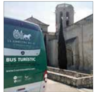
El bus té parada a tots els municipis de La Carretera del Vi.

La iniciativa està especialment adreçada als visitants de la costa que vulguin conèixer els cellers i els atractius turístics dels diferents pobles que formen part de La Carretera del Vi i funcionarà tots els dimecres i dissabtes de 9.30 a 17.30 h fins a mitjans de setembre. El servei compta també amb un guia turístic (català, castellà i anglès) que anirà explicant, durant el trajecte, la història i els paisatges de l'antiga ruta que uneix les vinyes del Penedès amb les platges del Garraf. El bus valdrà 18 euros per persona i tindrà