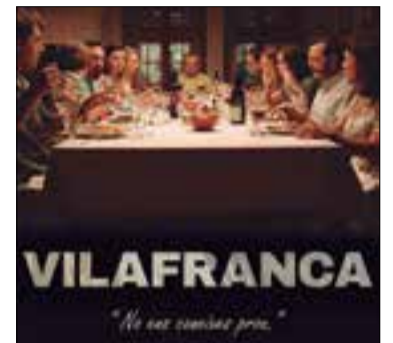
Imatge del cartell.