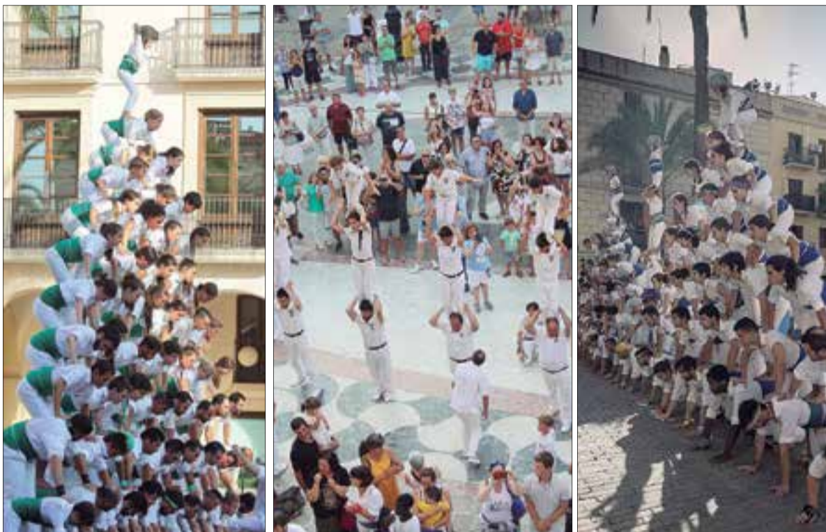
Escala de 10 dels de Vilafranca, pilars de 3 dels llorencencs i Món falconer 7x8 dels vilanovins. ✦ FALCONS DE VILANOVA

Més de 500 falconers d'arreu del país van participar dissabte a la tarda a Vilanova en la 17a Trobada Nacional de Falcons, que organitzava la colla de Vilanova en un dels actes previs de festa major destacats i coincidint amb el seu vintè aniversari. S'hi van donar cita les onze colles existents als Països Catalans: les colles de Llorenç, Vilanova, Vilafranca, Barcelona, Malla, Vallbona d'Anoia, Vilanova d'Espoia, Piera, Castellcir, Riberal i Capellades, que es van repartir en dues cercaviles simultànies amb sortida des de la places de les Neus i del Mercat. En cercavila, la colla llorencenca va aixecar tres piràmides de 3; Conjunts de 3; i Tres 3-2-1; els vilafranquins van alçar l'escala de 9, la pira 5/5, la torreta i el pilar de 4 aixecat per sota; i els amfitrions van fer el món falconer 7x8, dos vols de 4 i tres vols de 3, dues tripires de 7 amb cristo final i vuit pilars de 3 caminats amb 5 agulles.