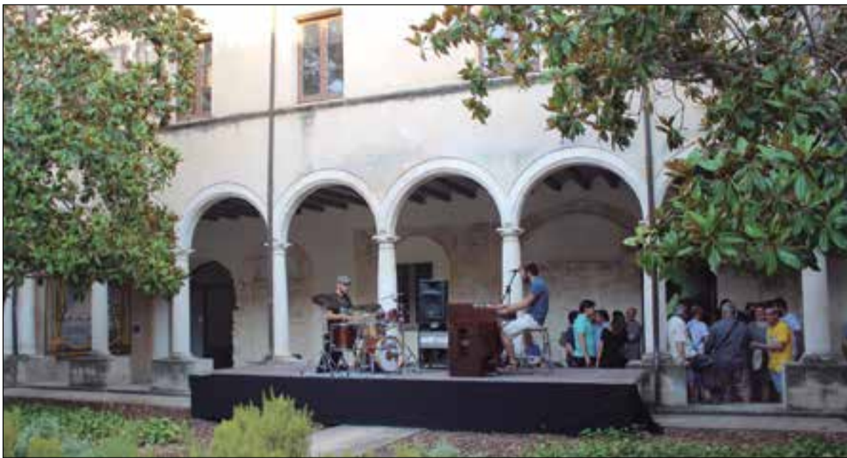
La festa de presentació del festival El Gloriós va tenir lloc al claustre de Sant Francesc. ✱ LA FURA