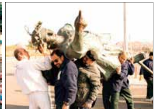
Preparació de la baixada per part dels Campaners; castell de focs dedicat a l'àngel; l'estàtua presidint la ballada folklòrica del 27 de juliol a la plaça Nova; i quan era carregat a collibè per voluntariat, l'any 1998.