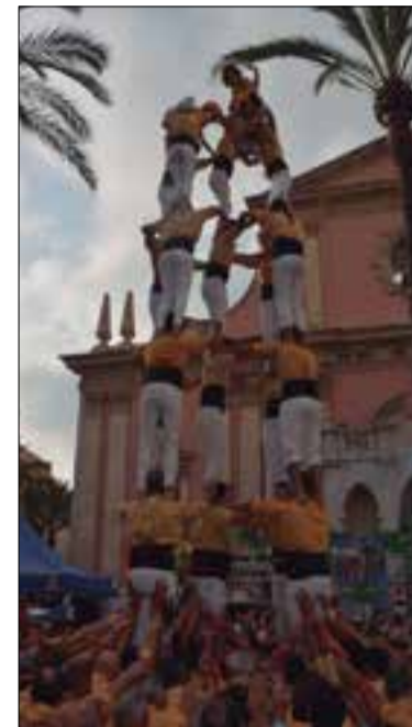
5 de 7 dels vilanovins. ✖ MAITE GOMÀ

Els Bordegassos de Vilanova no van tenir diumenge a la tarda el seu dia. I de fet, fa més d'un mes que no assoleixen el castell de vuit, malgrat haver descarregat ja quatre vegades el 4 de 8. Un seguit de baixes i un menor ritme d'assaig han fet que es trenqués la dinàmica positiva dels primers mesos de temporada i es perdés certa confiança. La conseqüència és tres intents desmuntats consecutius de carro gros, dos dels quals diumenge passat, en la festa major del Centre Vila de Vilanova: el primer perquè va perdre mides amb l'entrada de quarts i quints, i el segon perquè amb dosos entrant, un moviment a quarts mentre l'enxaneta passava per aquell pis va generar nerviosisme al pom de dalt i van optar per recular. La plaça de les Neus també va veure desmuntat un intent de 5 de 7 (perquè un dels ai-