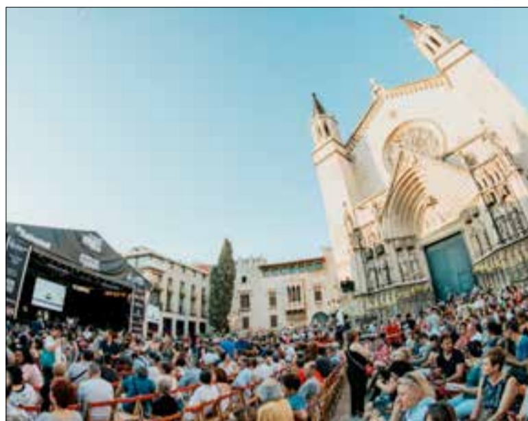
La plaça de Jaume I es va quedar petita en tots quatre concerts. *VIJAZZ

Pel que fa a l'impacte econòmic, enguany no s'ha encarregat l'estudi, però des de l'Acadèmia dels