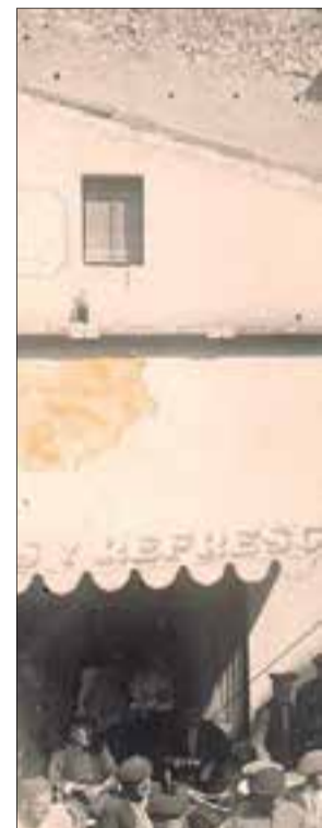
A l'esquerra, l'àngel a mig baixar del campanar, amb una corriola; al mig, l'àngel a la confluència dels carrers Cafès i Dr. Robert (1928).

i de fotos de vendrellencs amb l'àngel, quan les càmeres encara no eren digitals, se'n van fer milers. Tothom volia la seva. I tothom va acabar tenint la seva. Però quan arrenca tota aquesta devoció?