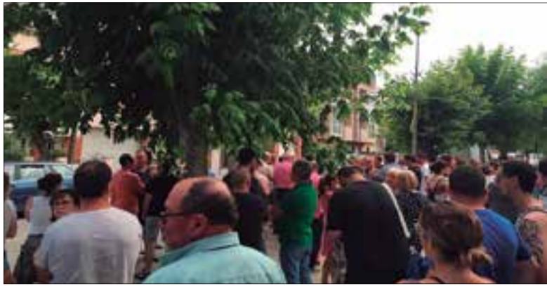
La concentració va tenir lloc dimecres al vespre. ✳