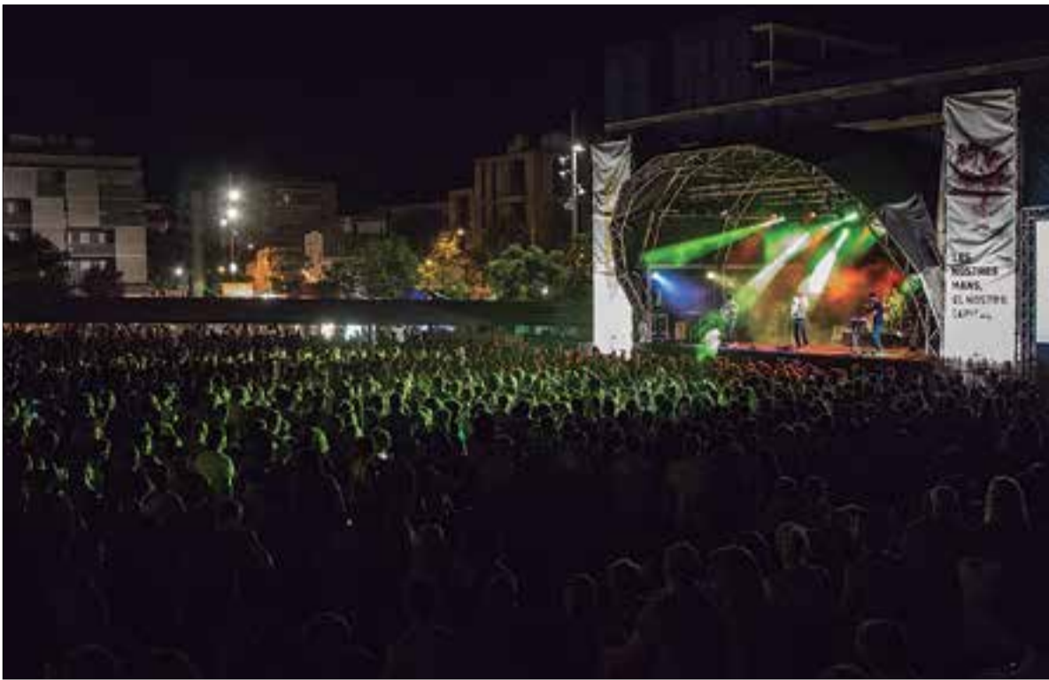
Els concerts del Tingladu arrosseguen milers de persones. ✦ RAI MOLINARI