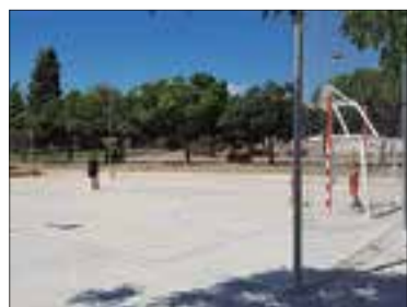
La pista és al parc de Santa Llúcia.

L'Arboç compta amb una nova pista esportiva a l'aire lliure equipada per jugar a futbol i a bàsquet. Situada al parc de Santa Llúcia, a la banda de l'avinguda de l'Abat Josep Freixas, està just al costat del Workout recentment inaugurat. Amb aquest nou equipament, la vila guanya una nova zona esportiva a l'aire lliure i oberta a tot-