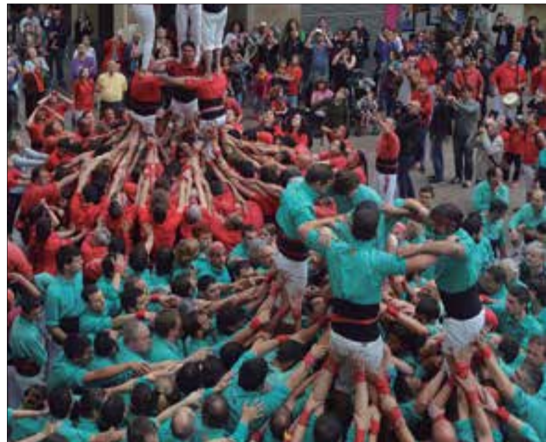
Xicots i verds, aixecant un castell simultàniament, l'any 2017. ✱ EMMA PAGÈS

Les tres colles vilafranquines actuaran diumenge a 2/4 d'1 del migdia a la plaça de la Vila de Vilafranca en una diada de Fires de Maig a l'antiga, és a dir, totes tres