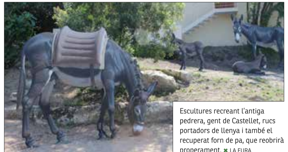
Escultures recreant l'antiga pedrera, gent de Castellet, rucs portadors de llenya i també el recuperat forn de pa, que reobrirà properament.