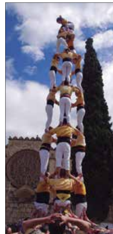
4 de 8 davant del monestir.