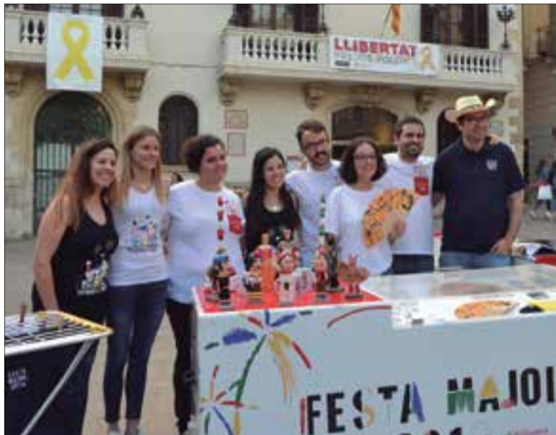
A partir d'aquest cap de setmana es començarà a vendre el marxandatge.