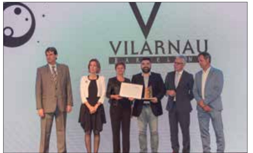
Caves Vilarnau va recollir el premi el 17 d'abril en el decurs de la Nit de l'Empresa.