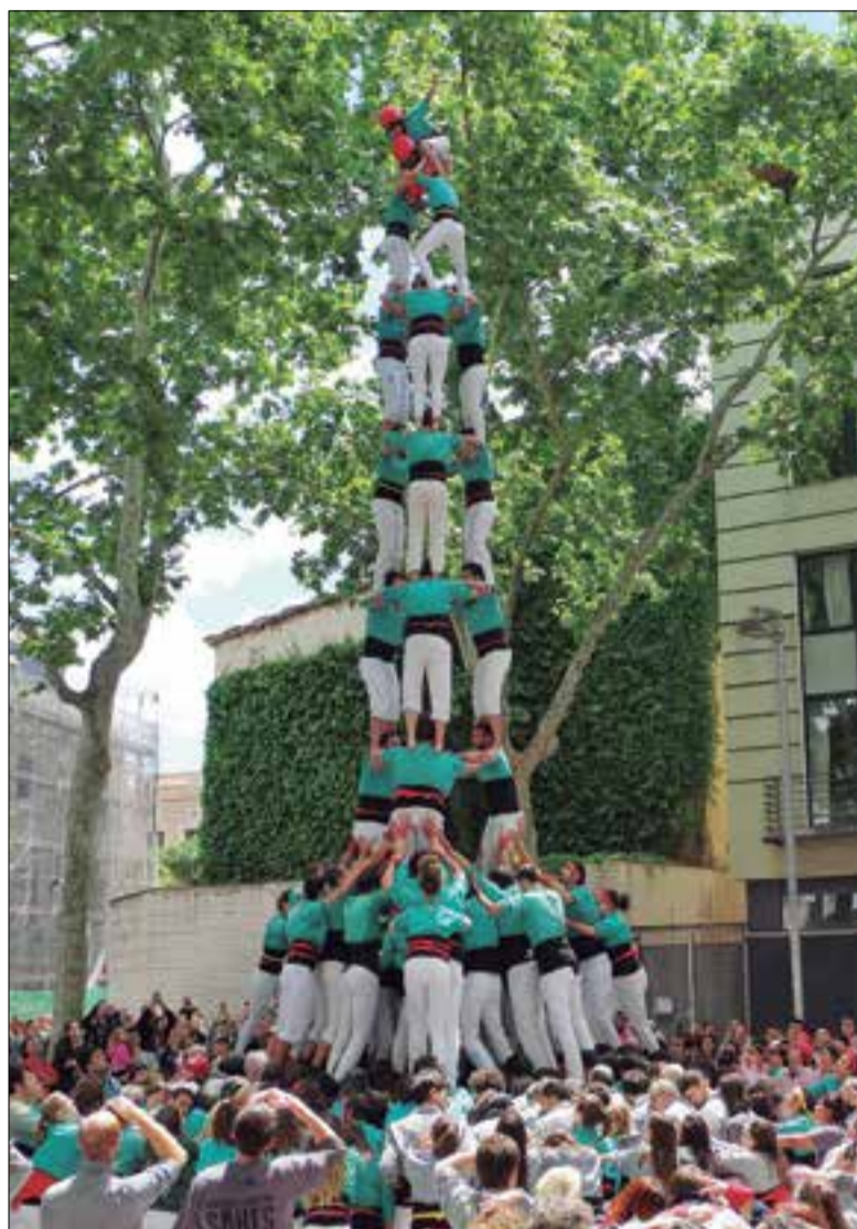
3 de 9 amb folre carregat pels verds. ✳ CASTELLERS DE VILAFRANCA