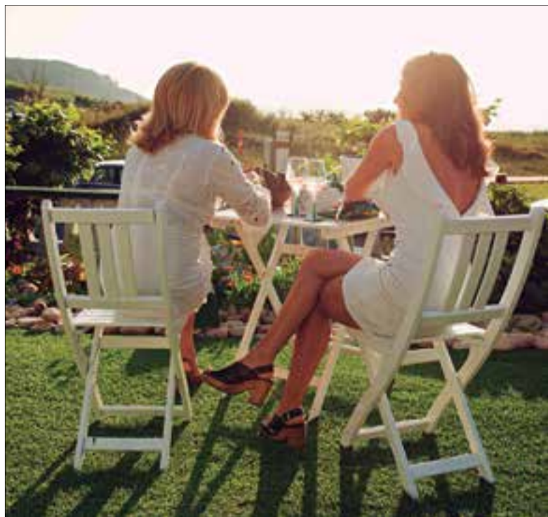
La festa de la floració tindrà lloc el 25 de maig.