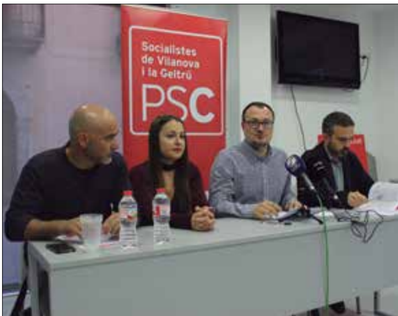
Regidors socialistes, dimecres en roda de premsa a la seu del PSC.