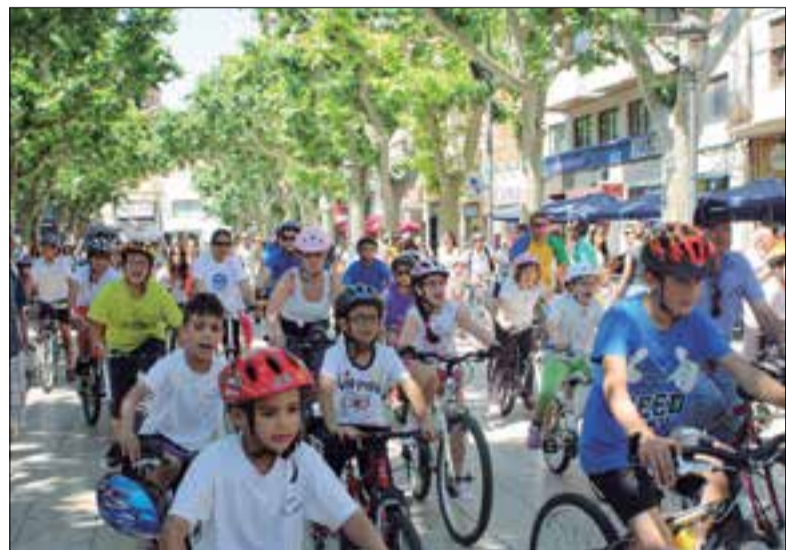
La Festa de la Bicicleta atrau cada any centenars de persones. ✦ AJUNTAMENT

Els participants pedalaran enguany a favor de l'associació oncològica Crisàlide del Baix Penedès