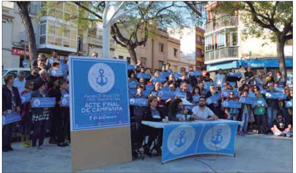
Per la defensa dels encausats, és important visibilitzar la causa. ✦ LA FURA

El judici serà entre el 24 i el 29 de juny i el Fiscal els demana penes de 4 a 8 anys de presó i fins a 10.000 euros de multa