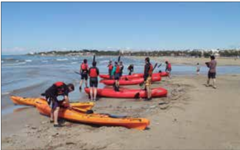
Activitat de caiac a la platja. ✦ AJUNTAMENT