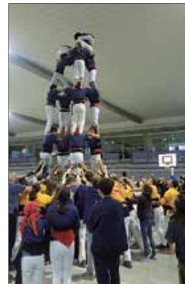
5 de 6 indoor dels medionencs a causa de la pluja. ✱ CAST. DE MEDIONA

Els Castellers de Mediona van celebrar dissabte a la tarda al poliesportiu Antoni Ramallets, de Sant Joan de Mediona, la diada del primer aniversari de la colla, en la qual van descarregar tres castells de sis, entre ells dos de gamma alta. Una actuació de mèrit per a una colla novella, que no és a l'abast de moltes de les colles creades els últims anys, i que consolida la línia de continuïtat que ha agafat una colla que, d'entrada, no es plantejava fer una temporada estable, però que ara ja és colla de ple dret. El 5 de 6 va ser el seu millor castell, mentre que el 4 de 6 amb agulla era el primer que bastia la colla. Abans dels castells, les dues colles havien alçat pilars de 4 de salutació, i pilars de dol en record al casteller bisbalenc José Manuel Romero.