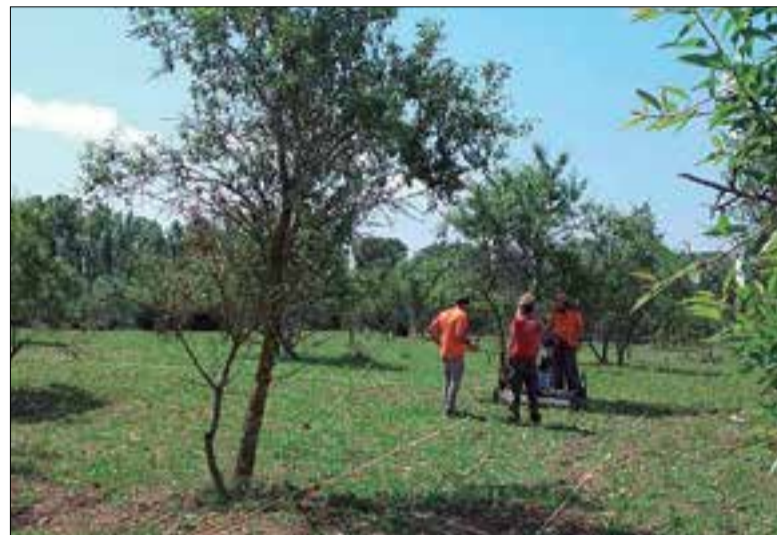
Imatges de les prospeccions amb georadar.

La Universitat de Barcelona, per encàrrec de l'Ajuntament de Banyeres, ha iniciat les primeres prospeccions amb georadar al jaciment iber de les Masies de Sant Miquel. L'objectiu és poder disposar d'una radiografia del terreny que indicarà on es troben les construccions, l'estructura, els murs i les restes d'eines, metall i ceràmica que encara no han estat descoberts.