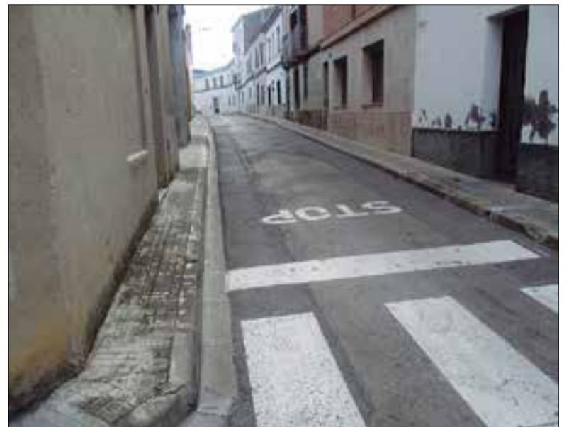
La majoria de voreres no superen els 90 centímetres d'amplada.

L'alcalde, Lucas Ramírez, anunciava que aquest 2018 es preveu treure a concurs públic la redacció del projecte. La redacció es planifica per al 2019, amb la perspectiva que les actuacions puguin començar a partir del 2020. El batlle apuntava que l'actuació es contempla fer per fases, en un