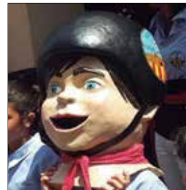
Nan a la Jove. ✳ COLLA JOVE

Per tal de potenciar la seva imatge, la Colla Jove Xiquets de Vilafranca ha decidit enguany tenir doble presència a les Fires de Maig. A banda d'actuar diumenge al migdia en la diada castellera amb les tres colles locals, al llarg dels tres dies de fires tindrà presència a la zona d'entitats de la mostra amb un estand, en el qual serà present el nan de la Jove (a imatge), que és obra de Gerard Fernandes, del taller Encartornats, i que fins ara únicament havia sortit a la cercavila de la festa major dels Petits de l'any 2015. Amb aquest estand, els de blau