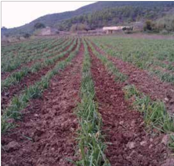
Manats de calçots. Graella de calçots al foc. I plantació de calçots.