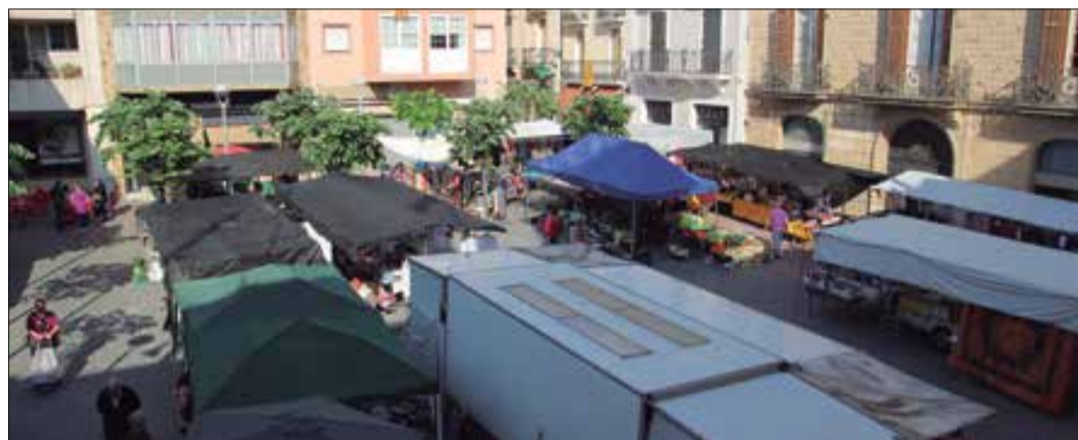
El mercat municipal de Sant Sadurní se celebra els dijous i els dissabtes. ✱ PSC

Els socialistes denuncien que la disminució de parades ha suposat una reducció dels ingressos anuals del 40,5%