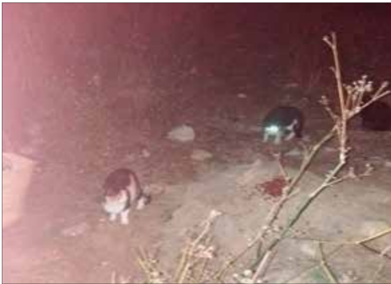
Gats que viuen en una colònia al carrer.