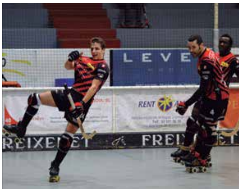
La victòria del Noia al partit d'anada va ser insuficient.