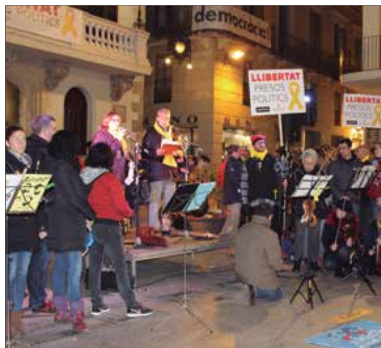
A la plaça de la Vila de Vilafranca hi van acudir 500 persones. ✪ LA FURA

"Ara mateix a l'Estat espanyol s'estan vulnerant drets bàsics i fonamentals", remarcava el text, que també recordava que "els Jordis han estat empresonats per ordre d'un tribunal que no era competent per fer-ho, l'Audiència Nacional".