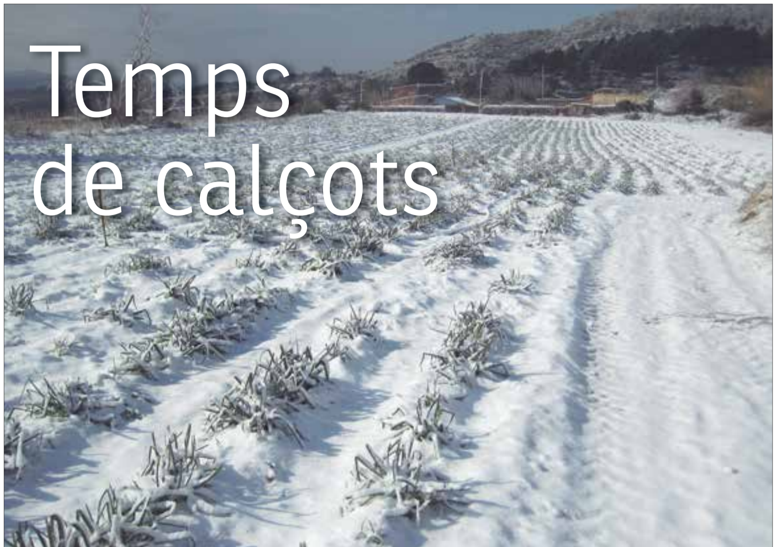
El calçot és una planta que aguanta molt bé el fred; de fet, el necessita.

E l diumenge 28 de gener –sempre el darrer diumenge del primer mes de l'any– tindrà lloc la 37a Festa de la Calçotada de Valls, l'activitat que tradicionalment dona el tret de sortida a les famoses calçotades. Una festa popular que se celebra al bressol del calçot i que ha ajudat a popularitzar com mai les calçotades, fins al punt que hi ha disseminats per tot el territori infinitat de restaurants que per aquestes dates n'ofereixen. I no només això. El fet que els restaurants en serveixin és el reflex que hi ha demanda i que no se circumscriu únicament als establiments que serveixen menjars, sinó que per tot de masies, solars d'urbanitzacions i barbacoes públiques és