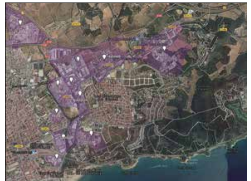
Les actuacions de millora es concentrarien als polígons de la zona sud.