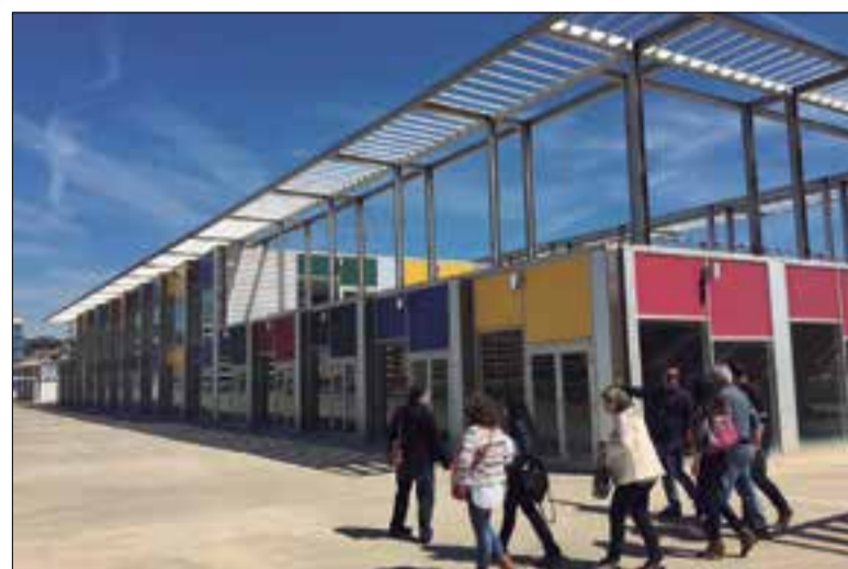
El nou centre cívic s'ubicarà en l'edifici G del Port de Segur.

L'Ajuntament de Calafell ha tret a subhasta un paquet d'obres al nucli de Segur, que inclou dues grans actuacions per valor de 2.661.157 euros. Es tracta del pla de voreres, en el marc del qual es realitzaran més de 300 actuacions en 65 carrers, i del centre cí-