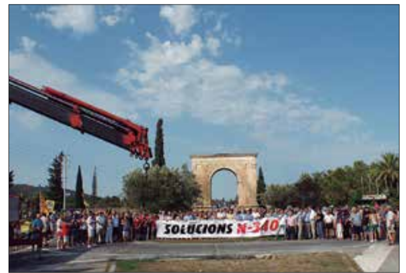
Els alcaldes dels municipis afectats han tallat l'N-340 en més d'una ocasió per reclamar solucions al col·lapse i als accidents.

Segons aquest acord, l'1 de gener passat els camions haurien d'ha-