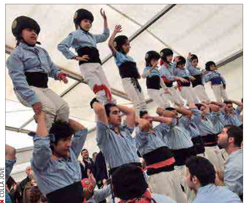
✘ COLLA JOVE

La Jove vol recuperar enguany el nivell perdut al 2016. Té un calendari amb una vintena d'actuacions programades, entre elles a Tolosa de Llenguadoc i a Tauste (Saragossa), i la intenció és consolidar tota la gamma de castells de sis per atacar els castells de set quan els tinguin a punt i disposin de prou pinya, sense posar-se pressió per la data. Els assajos els fan a l'Escorxador.