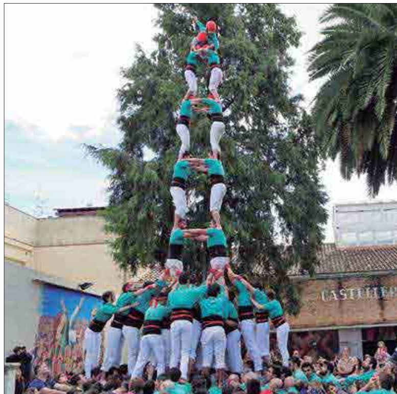
Van posar folre a la torre de 8 i a la prova de 3 de 9 fins a dosos. ✘ CASTELLERS