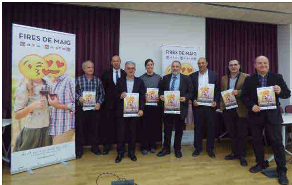
La imatge gràfica de les Fires de Maig es va presentar dilluns amb la presència de representants dels diferents sectors.

La imatge gràfica de les Fires de Maig d'aquest 2017 tornarà a jugar amb els emojis. Les bones crítiques rebudes l'any passat, han portat a l'empresa de màrqueting FeedbackMP a tornar a optar per aquest recurs tot i que plantejant una evolució en el concepte i l'ús de nous tractaments gràfics.