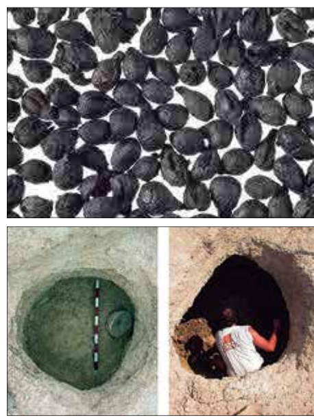
Imatge de la màscara de terracota i de les llavors de raïm localitzades i d'alguna de les sitges excavades.

Aquest 2017 es reprendran les excavacions al jaciment ibèric de Mas d'en Gual, després de 12 anys d'estar aturades. Serà gràcies a un programa de Garantia Juvenil de formació i inserció laboral que anirà a càrrec de les cooperatives d'iniciativa social Actua i ArqueoVitis, amb el suport de l'Ajuntament del Vendrell.