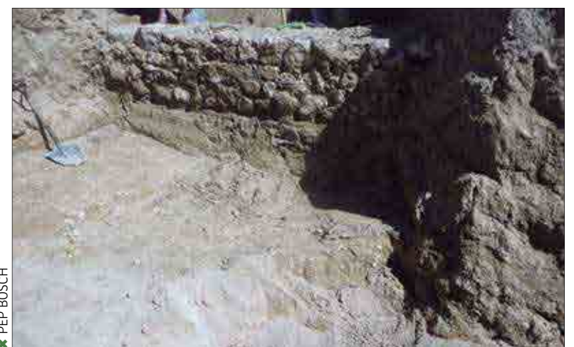
✱ PEP BOSCH

Aquesta setmana s'han reprès les excavacions arqueològiques al pati de Cal Badia, on se sap que hi havia l'antic call jueu de Vilafranca. L'Ajuntament ha donat permís i finança 15 dies més d'excavacions, que no donaran per a tot el pati però sí una part. Després, si no hi ha contraordre, quedarà tot tapat, amb les estructures colgades de nou a una fondària a tres-quatre metres.