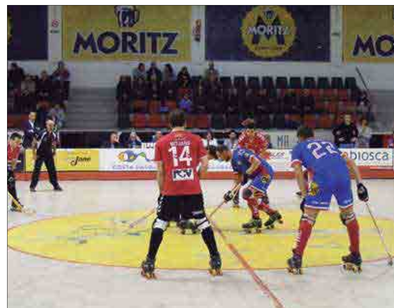
Els vendrellencs continuen sisens a l'OK Lliga. ✦ CE VENDRELL