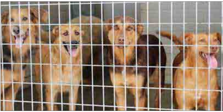
EL CAAD acull actualment 500 gossos i gats. ✱ LA FURA