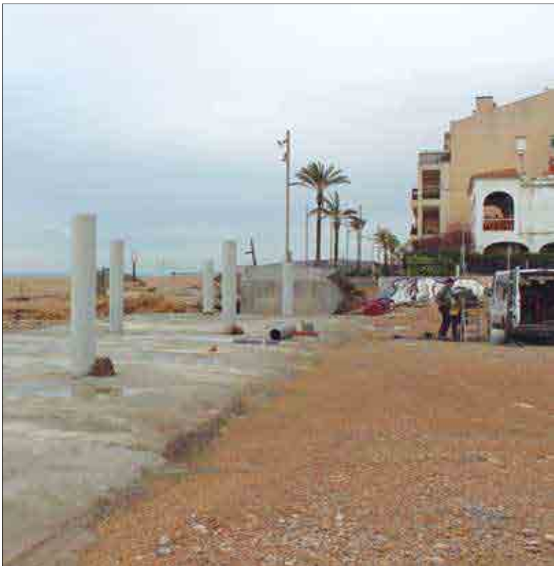
Obres de construcció de la passera que ha d'unir Sant Salvador amb les Madrigueres.