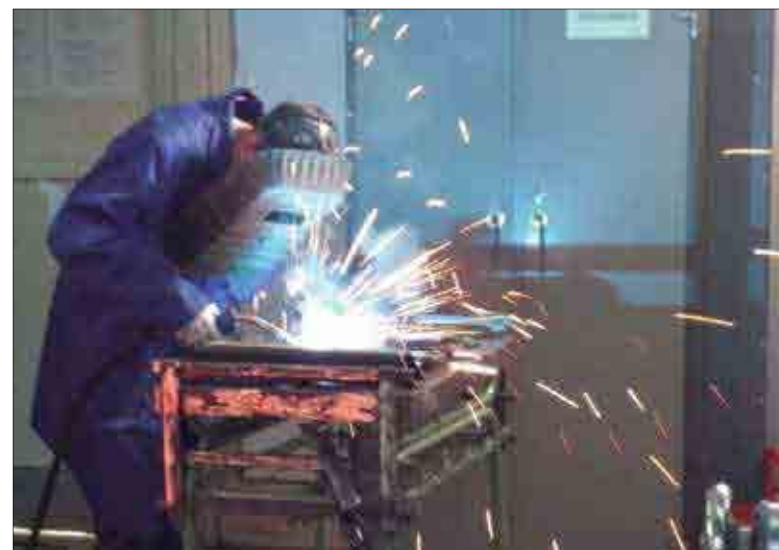
Un alumne treballant en la construcció dels aparcabicicletes.