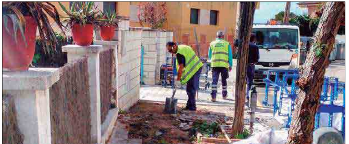
Els principals treballs se centraran al nucli de Segur, el més abandonat del municipi.

L'Ajuntament de Calafell executarà un pla de millora de voreres valorat en dos milions d'euros. Els treballs es faran al llarg de diverses anualitats, segons les disponibilitats econòmiques que hi hagi cada any. I el gruix es realitzarà al nucli de Segur, el més abandonat històricament del municipi.