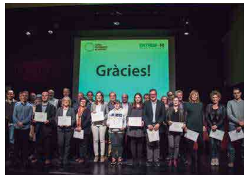
Foto de grup dels empresaris que van recollir el diploma. ✱ LA FURA

En aquests tres anys Junts trenquem el cercle! Ha atès 216 persones, de les quals 76 han aconse-