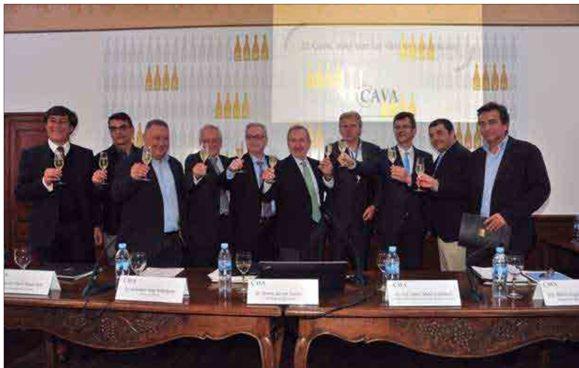
Pel Consell Regulador del Cava, el futur passa per apostar pels productes Premium.

Aquesta xifra suposa un lleuger increment del 0,45%, que s'explica gràcies a la bona evolució de l'exportació a països de fora la UE