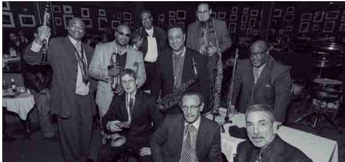
El conjunt nord-americà està format per alguns dels millors exponents internacionals del jazz actual. ✦ VIJAZZ

El febrer de 1917 es va publicar el primer disc on apareixia la paraula "jazz" impresa. Aquest disc va suposar per a molts el naixement del llenguatge musical que trasbalsaria el segle XX. Coincidint amb el centenari d'aquest primer àlbum, l'11a edició del Banc Sabadell Vijazz Penedès s'inaugurarà el 7 de juliol amb l'espectacle Jazz-The Story. Celebrating 100 years of jazz recording , a càrrec d'un conjunt nord-americà format per alguns dels millors exponents del jazz internacional actual.