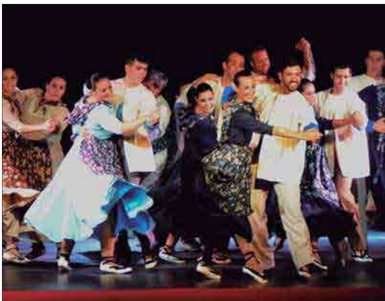
Un dels espectacles que ha portat als escenaris. ✱ ESBART ROCASAGNA