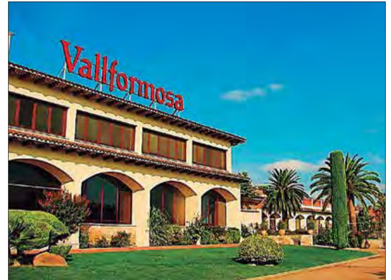
Vallformosa serà distingit amb el premi a millor celler de l'any.