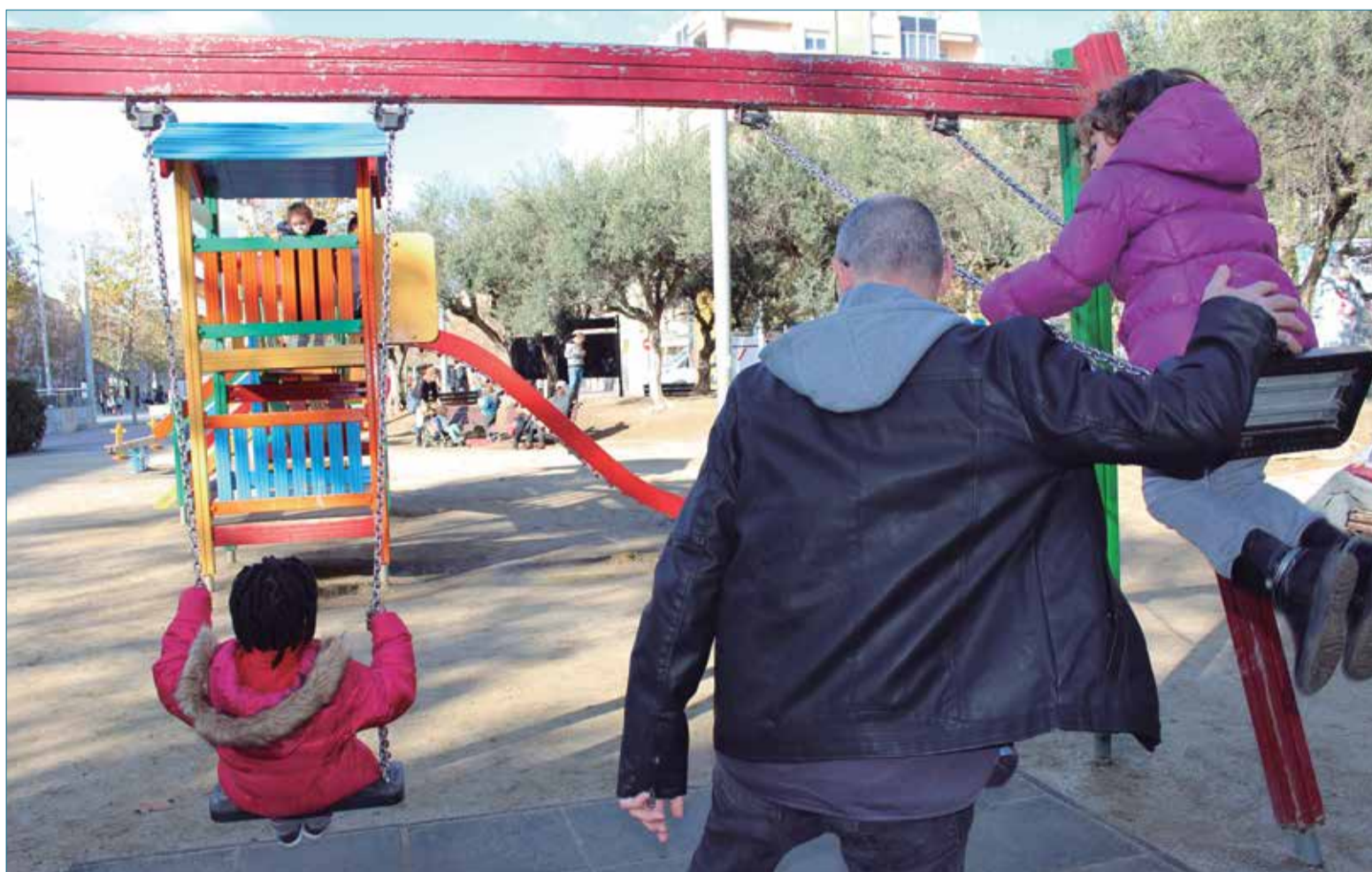
Un pare, gronxant les seves filles en una plaça.

Ara que s'acosten festes, és important que el tió rumii bé el tipus de joguina que cagarà o els Reis la que portaran.