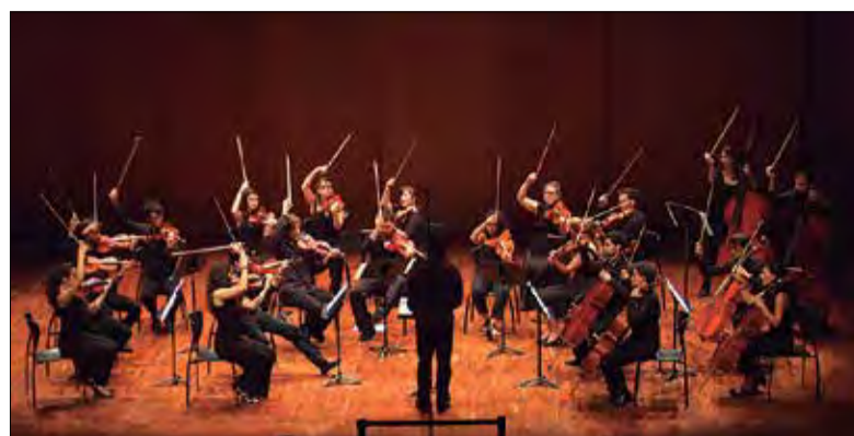
Les entrades es posen a la venda al preu de 25 euros.