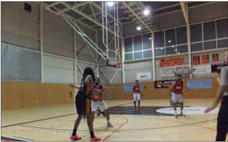
L'AB Vendrell supera al Manyanet Reus i se situa líder de Segona Catalana.