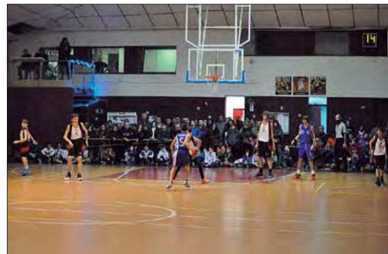
Instantània d'un dels partits jugats l'any passat a la pista del Casal Vilafranca. ✦ SE CASAL

Hi haurà segon Torneig de Bàsquet Infantil del Casal Vilafranca durant les festes de Nadal, organitzat per la SE Casal. Es jugarà entre Nadal i Cap d'Any (els dies 27, 28 i 29 de desembre) al pavelló poliesportiu Joan Marquès (passatge Alcover), amb la participació de vuit equips de jugadors d'entre 11 i 13 anys. Els àrbitres (dos per partit) seran federats.