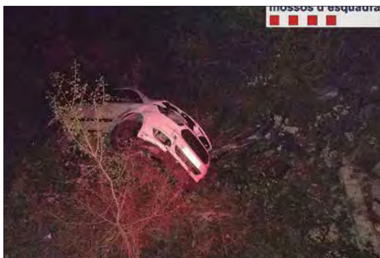
El cotxe accidentat.