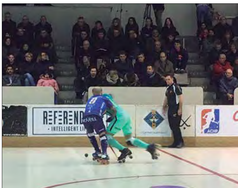
El partit entre Vilafranca i Barça va ser força disputat. ✦ RAIMON MASCARÓ