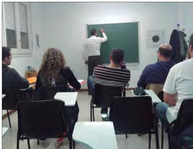
El local està situat al número 18 del carrer Sant Sebastià (c. Caputxins).

Al llarg de dues dècades hi han passat més de 2.000 persones, el 80% de les quals han aconseguit aprovar i tenir plaça