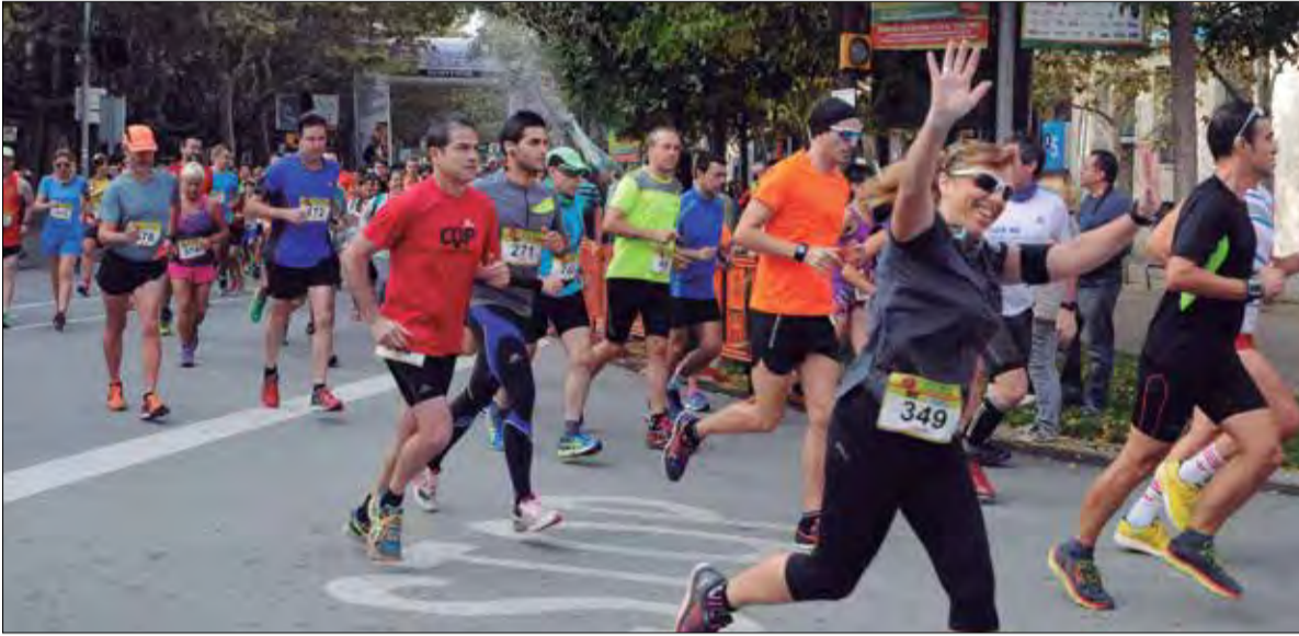
La Cursa Solidària País del Cava, que va tenir lloc el 31 d'octubre, va recollir 14.000 euros per la Marató de TV3.

El 18 de desembre se celebrarà la Marató de TV3 que, en la seva 25a edició, recollirà fons per donar un impuls econòmic a la recerca sobre l'ictus i les lesions medul·lars i cerebrals traumàtiques.