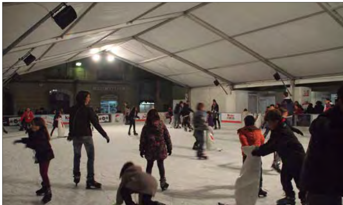
La pista de gel atreia cada any centenars d'infants.