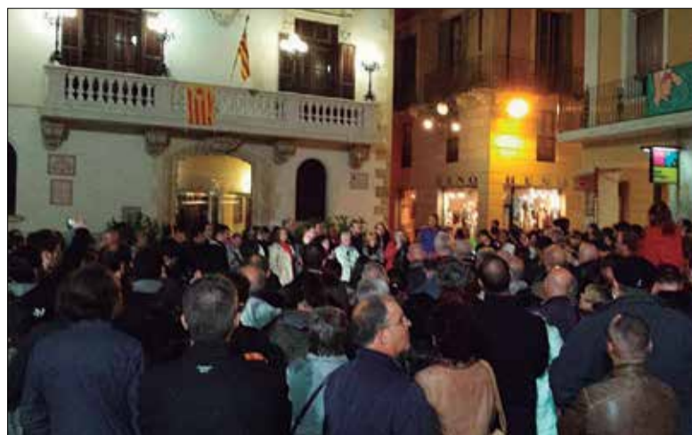
Concentració a Vilafranca. ✖ ERC VILAFRANCA