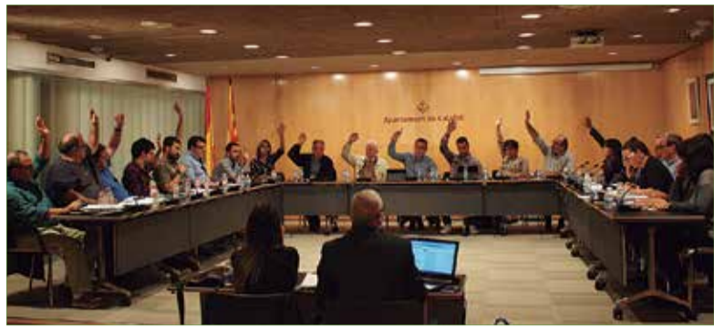
PSC, PP, UAM, la CUP i ERC hi voten a favor. ✱ AJUNTAMENT DE CALAFELL