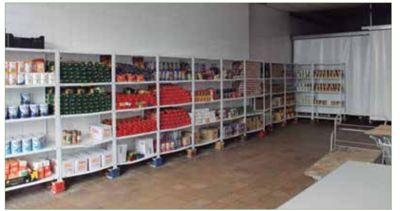
Centre de distribució d'aliments de Càritas. ✱ LA FURA