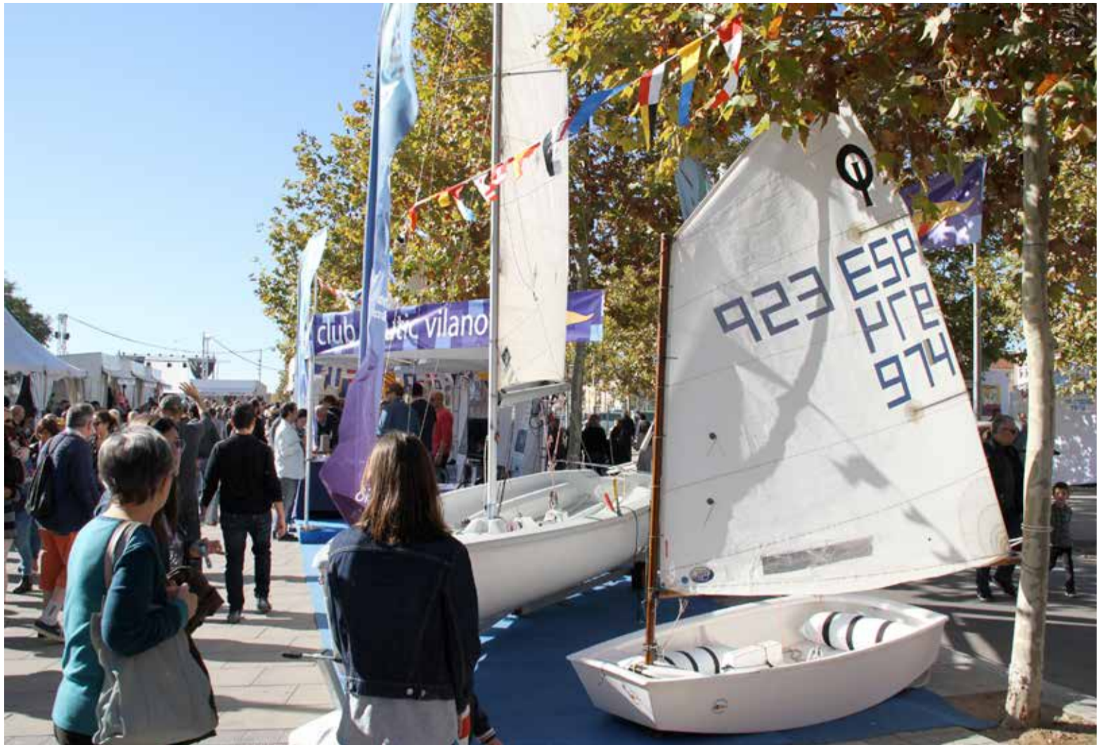
Una de les idiosincràsies de la fira vilanovina és l'espai dedicat a embarcacions.