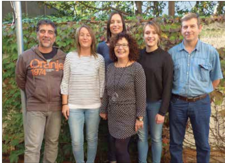
Equip de l'Oficina d'Habitatge del Consell Comarcal. ✱ CCAP

El Ministeri de Foment ha seleccionat el projecte "Microcrèdits socials per facilitar l'accés a l'habitatge o per evitar la pèrdua de l'habitatge habitual", del Consell Comarcal de l'Alt Penedès, per concórrer a l'onzè Premi Internacional de Dubai, en el marc del Concurs Internacional de Bones Pràctiques que convoca l'ONU. El premi es lliurarà l'any que ve.