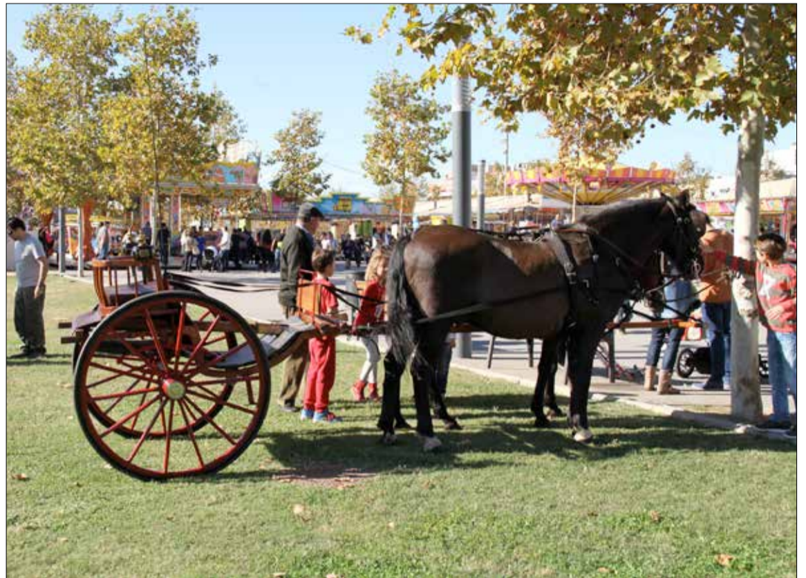
Al parc de Baix-a-Mar es fan moltes activitats paral·leles durant tot el cap de setmana.

de tot tipus: plaques de cava, Kinder, sobres de sucre, punts de llibre, didals, trens, postals, calendaris, còmics, taps de corona, goigs, brocanters, miniatures, modelisme... També es podrà gaudir d'una exposició de Playmobil o d'una col·lecció de motos de la prestigiosa marca catalana Bultaco.