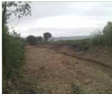
✱ DEPARTAMENT DE TERRITORI