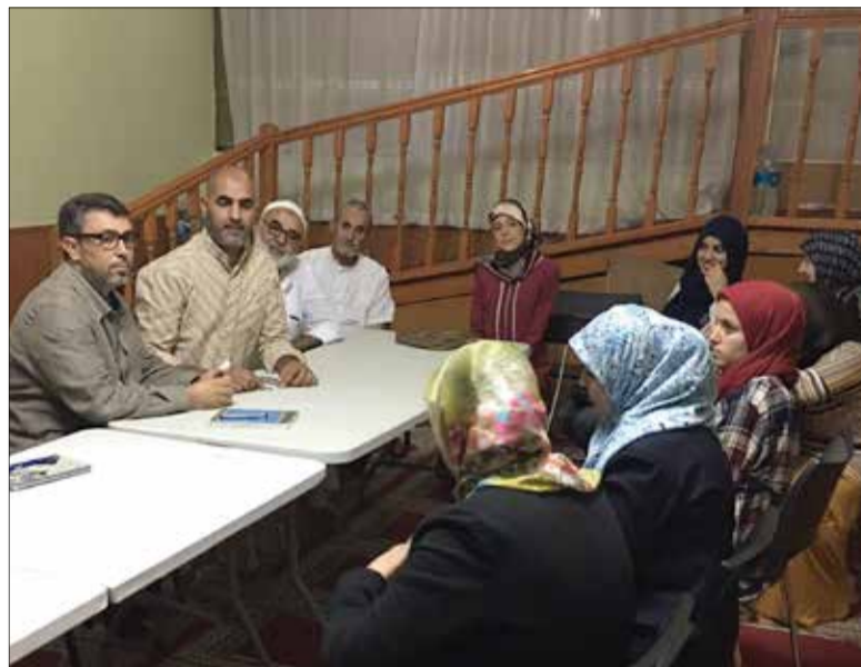
Reunió entre representants de l'Associació El Fath per a dones i Al Fath.