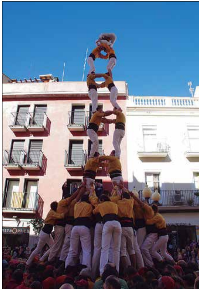
Els vilanovins han carregat la torre de 8 amb folre per segon any consecutiu. Els Minyons van fer el 3 de 7. ✘ YOKO ONO

Diada gloriosa per als Bordegassos de Vilanova, que en aquest esprint final que estan fent a la temporada 2016 s'han convertit de nou en colla folrada. Efectivament, diumenge al migdia, a la plaça de les Cols i en el marc del 45è Dia de la Colla, els Bordegassos van revalidar la torre de 8 amb folre que ja van carregar per la festa major de l'any passat i descarregar al concurs de 2012. No és un castell que sovintegi gaire entre els de groc terrós (exceptuant el quinquenni màgic 1998 a 2002), de manera que tan sols coronar-lo ja és tot un èxit. Els de Vilanova van obrir plaça amb el sisè 4 de 8 de l'any, castell que ja