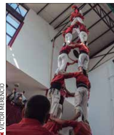
✘ VÍCTOR MERENCIÓ

traslladar a dins del local a causa del vent. Hi van fer torre de 7 amb doble figuereta, el darrer 4 de 8 de l'any, un 7 de 7, pilar de 4 amb folre de la canalla, 4 de 6 de dones, tres pilars de 5 simultanis i dos pilars de quatre al balcó en què va anar pujant tota la canalla dels Nens. I dinar final.