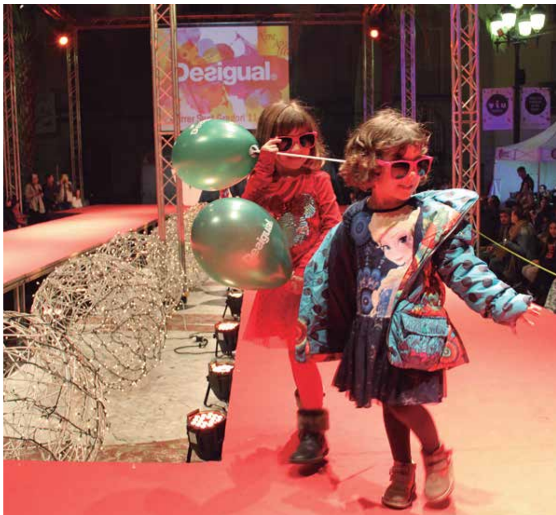
Desfilada de moda infantil a la passarel·la de la plaça de la Vila.

a la nàutica, l'artesanía, els tallers, l'espai equí de l'Associació dels Tres Tombs i l'escenari gran, on tindran lloc moltes de les activitats paral·leles.