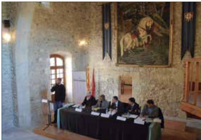
L'acte de presentació es va fer al castell dels Santmartí.