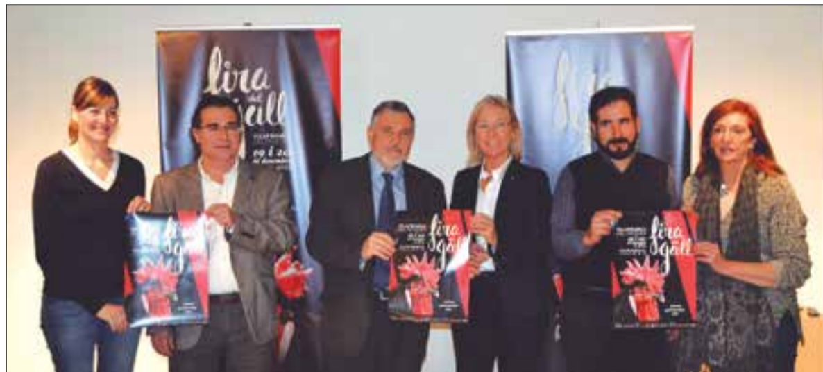
Els membres de la comissió organitzadora de la Fira del Gall durant la presentació de l'edició d'enguany. ✱ LA FURA

La mostra d'artesans dobla espai i paradistes fins arribar al pavelló firal, on s'exposaran 1.250 peces que competiran en el Campionat d'Espanya d'Avicultura