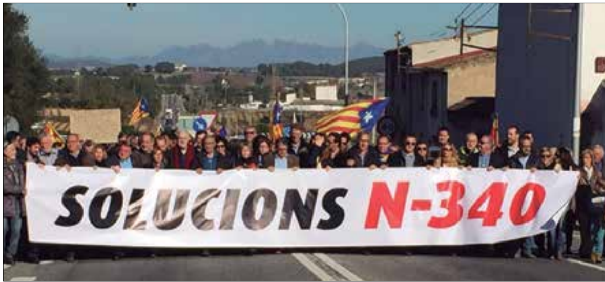
Els manifestants, encapçalats pels alcaldes, van tallar la nacional durant 55 minuts