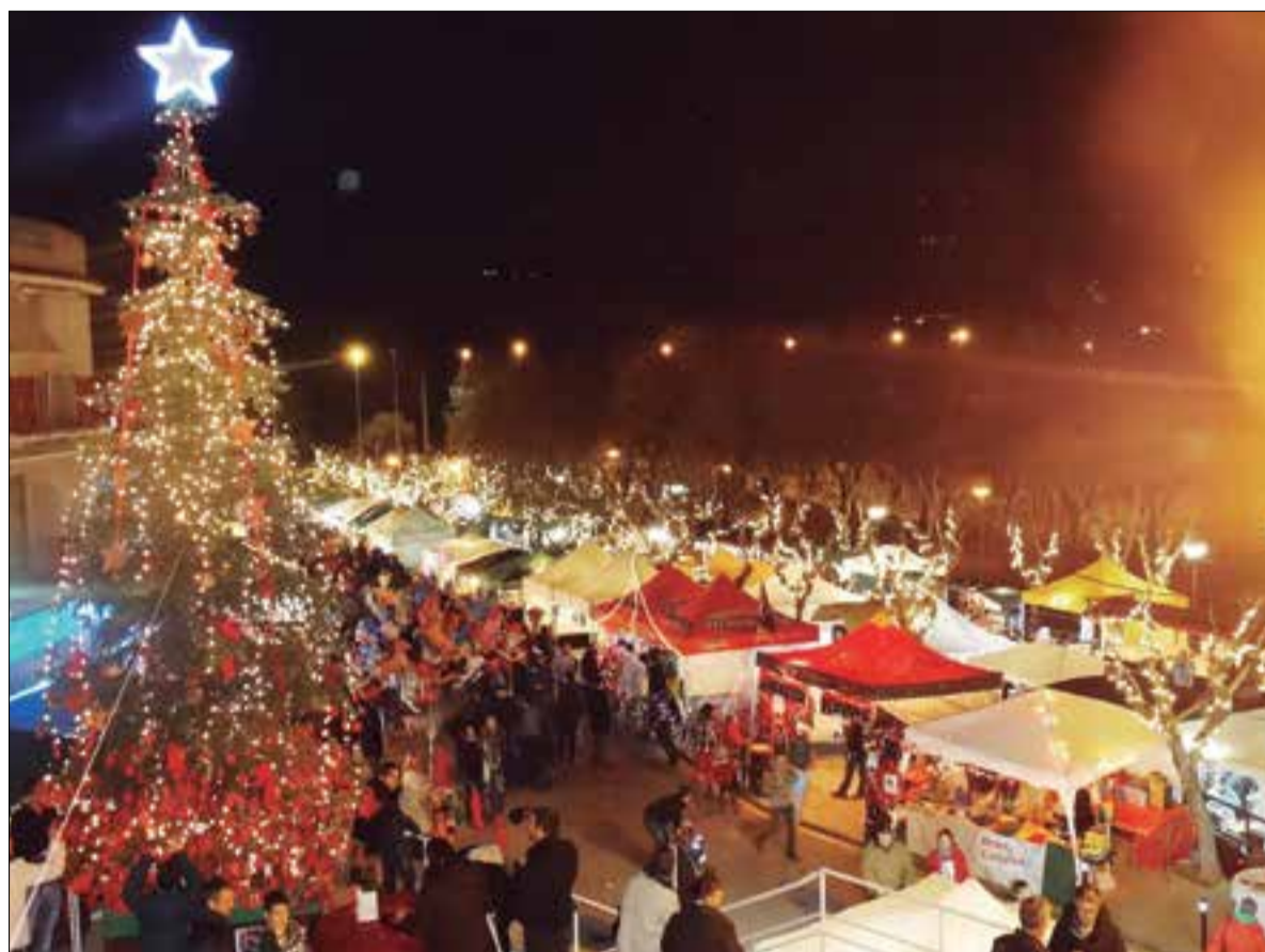
Fira de Santa Llúcia 2014 ✦ FLICKR AJUNTAMENT DE CANYELLES.