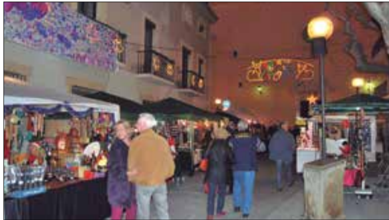
Fira de Nadal 2014 ✦ AJUNTAMENT DE CUBELLES

Cubelles ja ho té tot a punt per la Fira de Nadal, que se celebrarà els dies 12 i 13 de desembre al casc antic del municipi. La Fira, que enguany arriba a la seva setena edició, comptarà amb prop d'un centenar de parades amb articles de temàtica nadalenca. A part de les parades, un 50% de les quals estaran ocupades pel