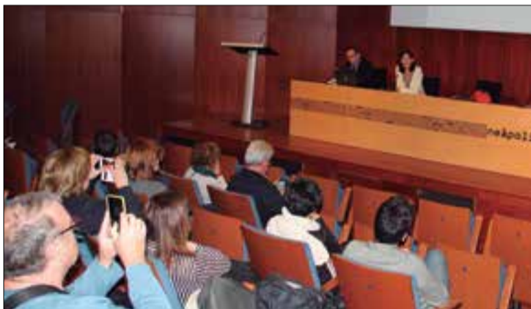
Acte de presentació del nou viver d'empresa ✦ AJUNTAMENT DE VILANOVA

L'Ajuntament ha creat un viver d'empreses dedicat al sector de les TIC. El nou espai, que estarà ubicat a la planta baixa de Neàpolis, es posarà en marxa durant el primer trimestre de 2016 i estarà destinat a empreses integrades per entre 3 i 5 professionals.