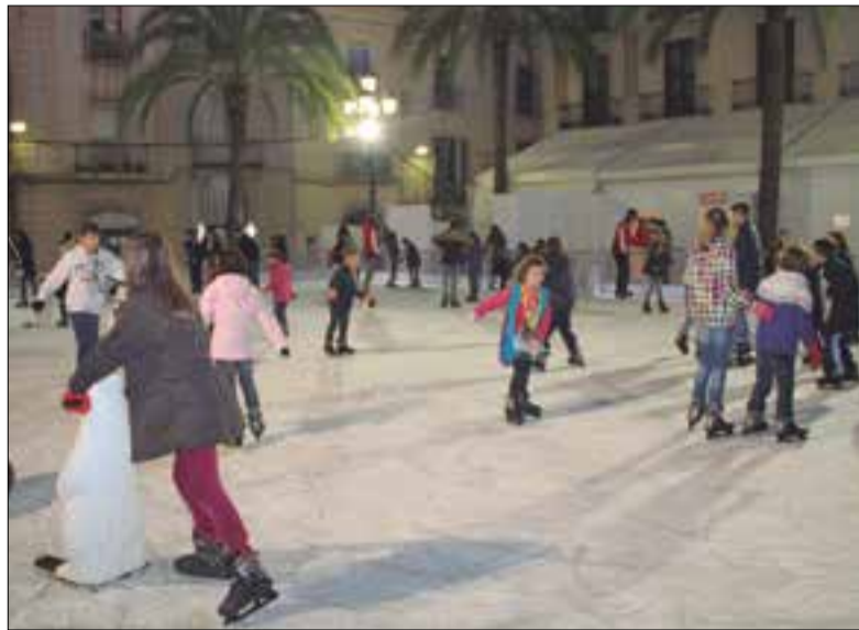
Imatge d'arxiu de la pista de gel