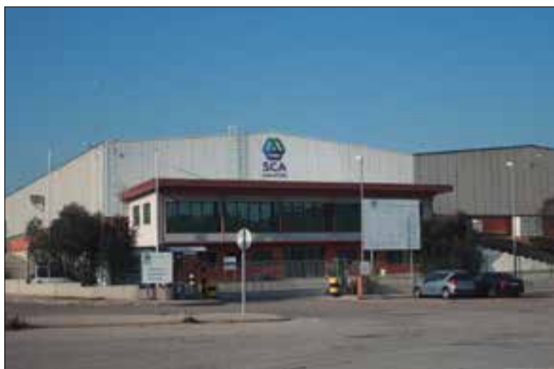
Entrada de la paperera de Mediona ✪ LA FURA