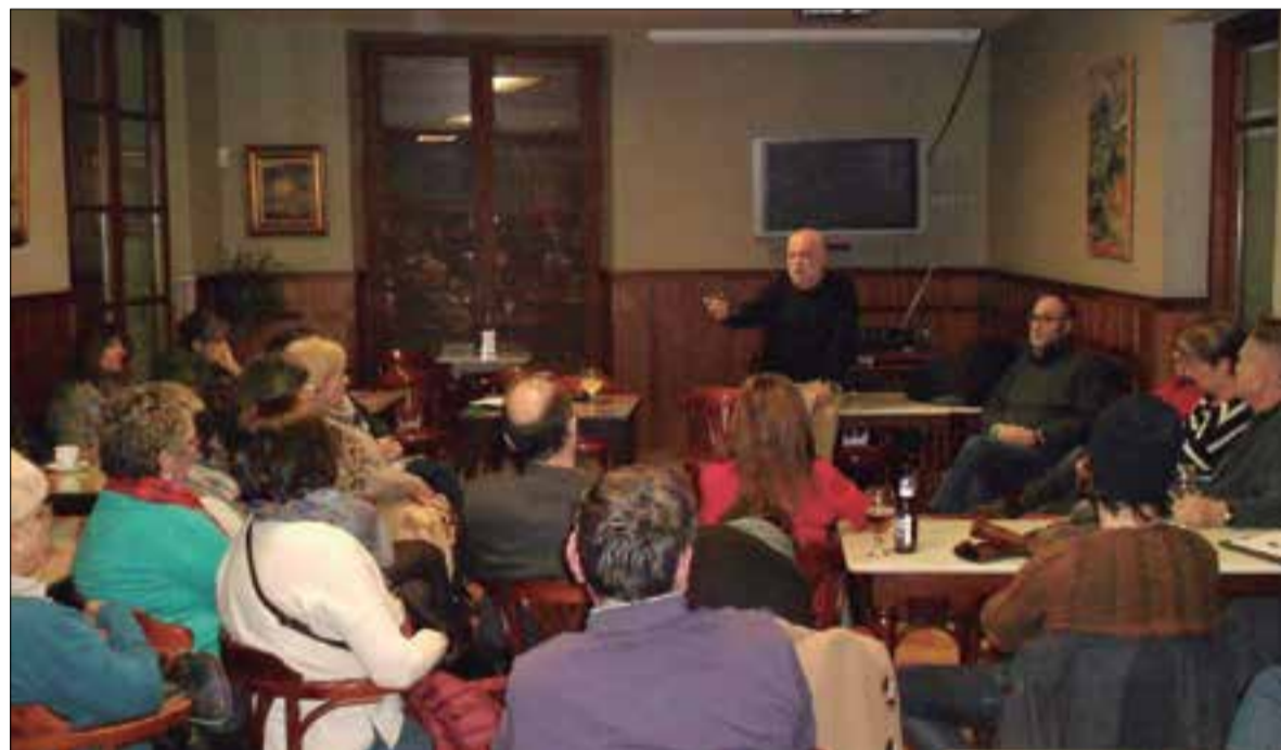
A la reunió de divendres hi va assistir un centenar de persones * LA FURA

Els antics exhibidors posen a disposició de Junts pel cinema tot l'equip tècnic (digital) i butaques. El col·lectiu centrarà els esforços a trobar un local