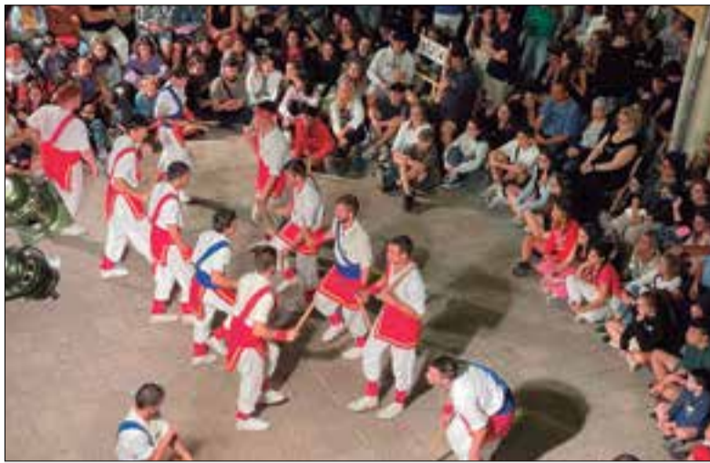
Els bastoners van estar fent pavanas d'1 a 3 de la matinada. ✳ BALL DE BASTONS