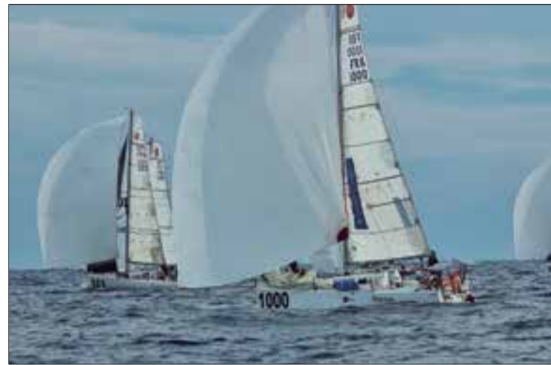
La regata es va celebrar en aigües del Club Nàutic Garraf. ✦ CN VILANOVA