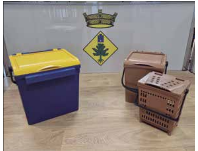
Durant el setembre es repartiran els cubells de cada fracció.

A partir de l'1 d'octubre, Llorenç del Penedès farà la recollida de residus mitjançant el porta a porta. D'aquesta manera, desapareixeran tots els contenidors dels carrers, tant els de la fracció resta com els del paper, envasos, vidre i orgànica.