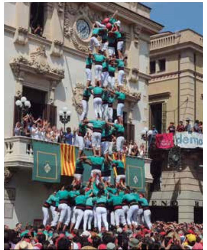
3 de 10 carregat i 5 de 9 descarregat pels Castellers de Vilafranca el 30 d'agost.