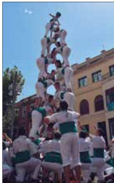
Pira 6/6. ✳ FALCONS DE VILAFRANCA

Els Falcons de Vilafranca van recuperar per la festa major la Pira 6/6, després de cinc anys de no assolir-la. Ho van fer durant l'actuació de lluïment del 31 d'agost al migdia, a la plaça de la Vila, després d'haver descarregat també la primera escala de 10 de l'any, que va pujar ordenada i en cap moment va perillar. També van fer 12 pilars de 3, dues piràmides drets de 5, dues torretes, tres ventalls (un d'ell de tres pisos), dos castells de 6 i el pilar de 5 aixecat per sota i deixat net.