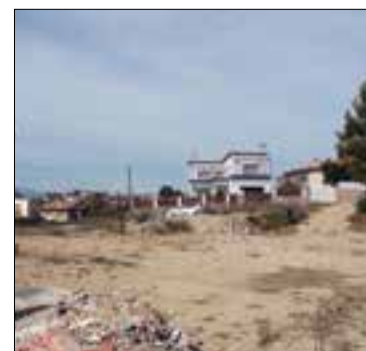
putació de Tarragona de 692.471,24 euros. Els treballs duraran un any. ✱ AJUNTAMENT

Les obres del nou centre cívic de Valldemar, Montmar i les Brises ja han començat. El centre cívic s'està fent en un terreny entre el carrer Molina i l'avinguda Marca Hispànica, per crear un "punt de trobada" als barris més allunyats del nucli històric. Ocuparà una superfície d'uns 400 metres quadrats, i disposarà de bar, dues sales, dutxes, vestidors i una pista poliesportiva de 40x20 metres. Les obres tindran un cost d'1,3 milions d'euros, amb una subvenció de la Di-