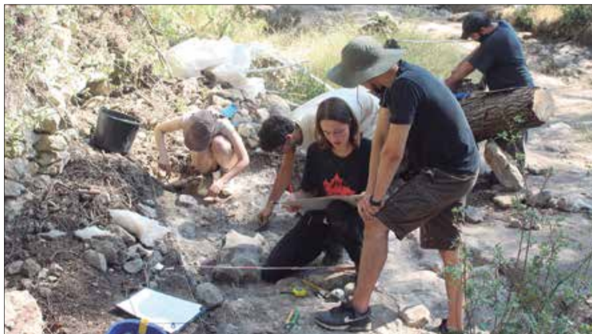
Estudiants d'arqueologia de la UB, en l'excavació d'aquest mes d'agost.

També és excepcional perquè es troba a l'aire lliure. S'hi han localitzat tres cabanes i dos enterraments