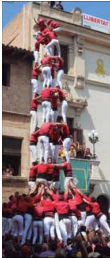
Torre de 8 de la Vella i 5 de 9 de la Joves.

prés de Vilafranca, el Concurs i Vilanova), i ho tornarien a fer ara a Vilafranca amb una gran autoritat, ja que el tremolor del descens no els va fer posar nerviosos. Tenen un gran 5 de 9.