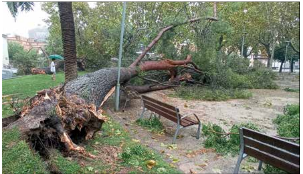
El dia 31 d'agost la Policia Local va rebre 230 trucades per l'esclafit. * LA FURA