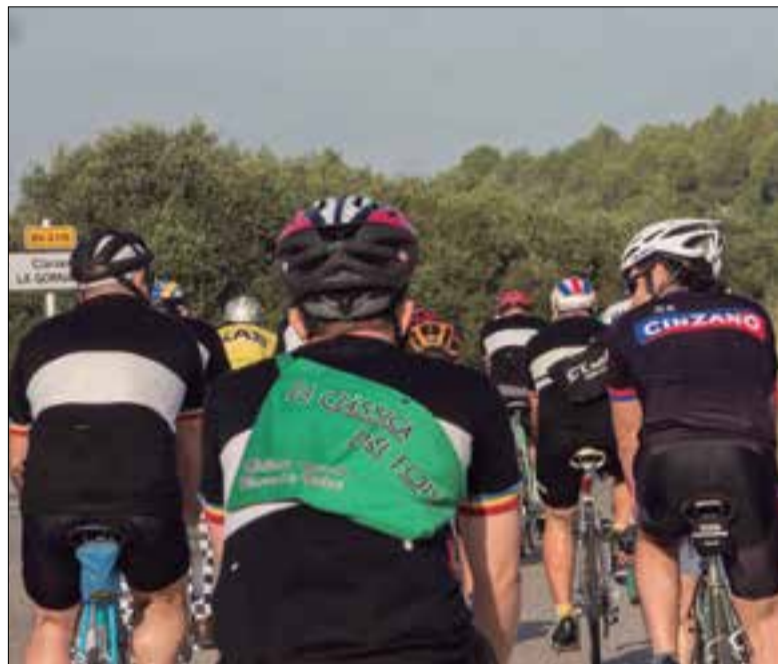
L'organització fixa en 140 el topall màxim de participants. ✦ CLÀSSICA DEL FOIX

La festa de la bicicleta clàssica se celebrarà el 25 de setembre i acollirà un màxim de 140 participants