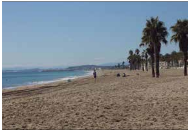
Platja de Coma-ruga. ✱ LA FURA