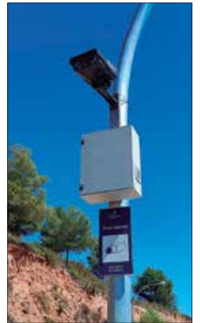
Càmera ubicada a la Bòria.

funcionament del sistema de vigilància, que està operatiu les 24 hores del dia i que estan preparades per funcionar amb qualsevol mena d'il·luminació. Les càmeres estan connectades directament a les oficines dels Mossos d'Esquadra, que es fan càrrec de la gestió del sistema. A més, el lector de matrícula envia informació a una base de dades internacional amb què operen diversos cossos policials. El projecte ha tingut un cost de gairebé 19.000 euros, que ha finançat l'Ajuntament amb fons propis.