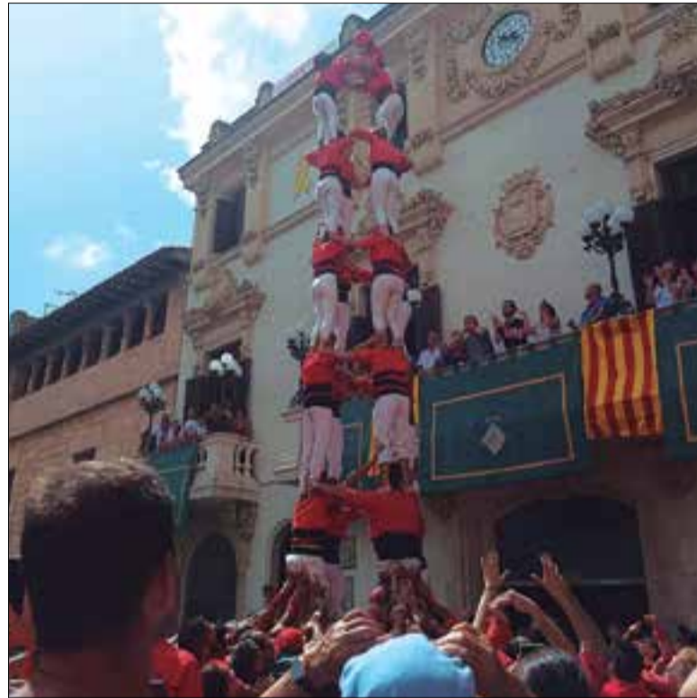
Els vermells van coronar el carro gros el 29 d'agost. ✳ XICOTS

Xicots de Vilafranca: 5/7, 4/8(c), 3/7, 3P/4 Castellers de Vilafranca: 3/9f, T/8f, 4/8, P/6