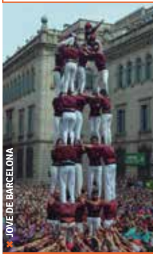
JOVE DE BARCELONA