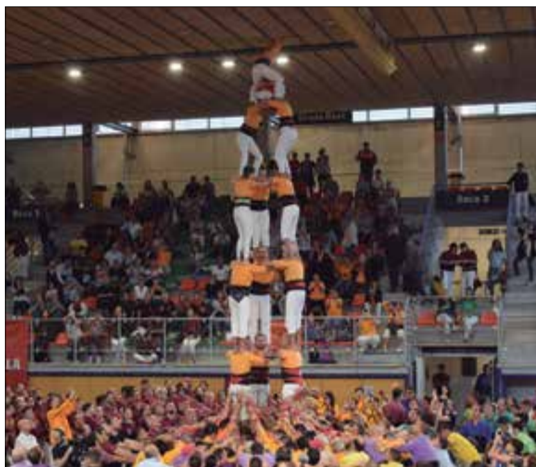
El 3 de 7 va ser el primer i millor castell dels Bous. ✱ JOAN GRÍFOLS

Els bisbalencs actuaven finalment dins el pavelló Sant Jordi de Tor-