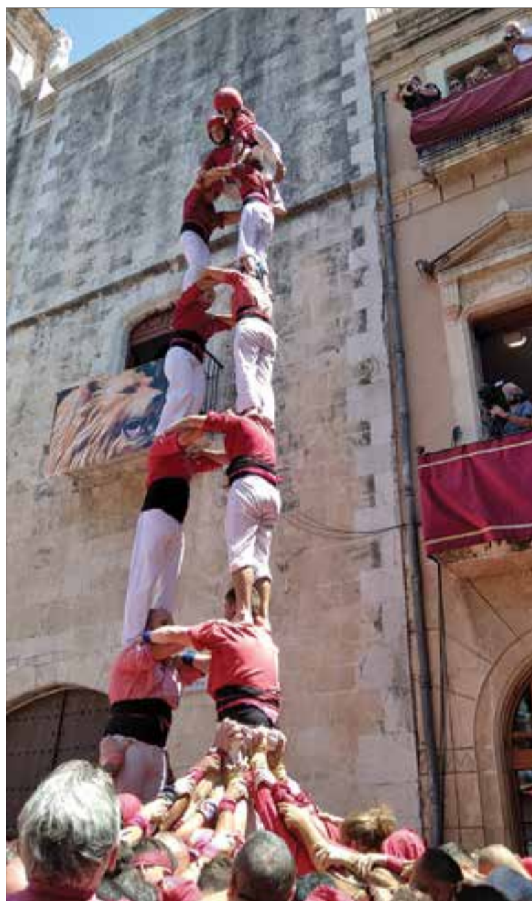
Torre de 7 descarregada per Santa Anna. ✖ NENS

Els Nens van ser fins als anys 70, fins que van perdre el 3 de 8, una colla puntera. Entre les seves gestes històriques destaca la victòria al concurs de 1970, en el qual van descarregar el pilar de 6 i van carregar el pilar de 7 amb folre en les dues primeres rondes, mentre que la Vella de Valls hi carregava la primera torre de 8 amb folre del segle i coronava el seu primer pilar de 7 folrat. A la tercera ronda, els rivals vallencs van carregar el pilar de 6 i semblava que s'endurien el concurs, però els Nens van completar la primera torre de 8 folrada del segle i es van emportar el ceptre en la diada més espectacular del segle XX.