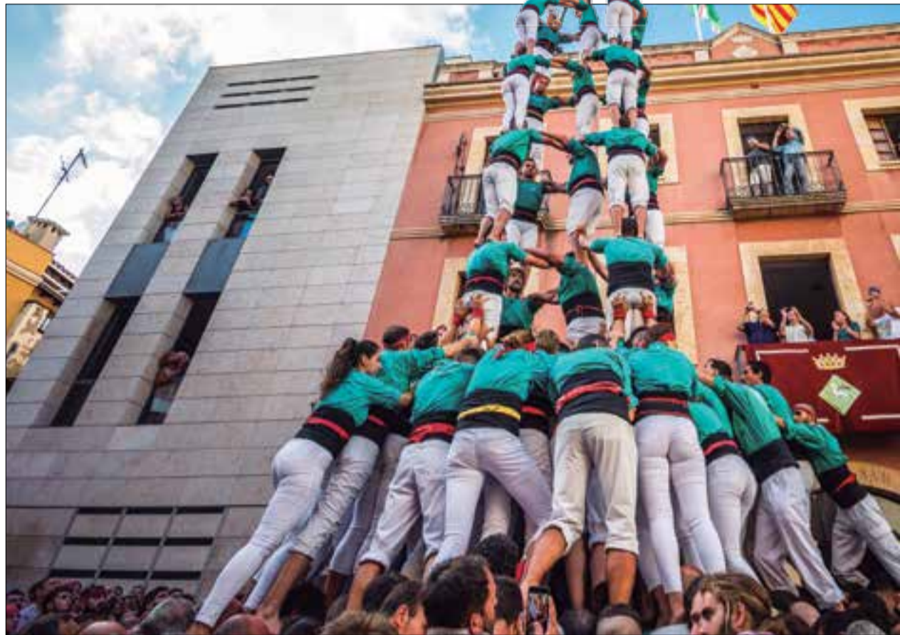
CASTELLERS DE VILAFRANCA

Els Castellers de Vilafranca aniran a totes per guanyar la 18a edició del Concurs de Tarragona. Després de vuit concursos consecutius guanyats pels verds –un rècord sense precedents–, la Vella de Valls va capgirar la tendència i es va fer amb la primera posició el 2018. De llavors ençà, els verds han fet bona feina de renovació de troncs per tornar a començar un cicle guanyador. Diumenge ha de ser la posada de llarg d'aquest nou cicle, després de tota una temporada en què la colla de Cal Figarot ha marcat el ritme, com estava acostumada a fer durant la major part de les dues primeres dècades del segle XXI.