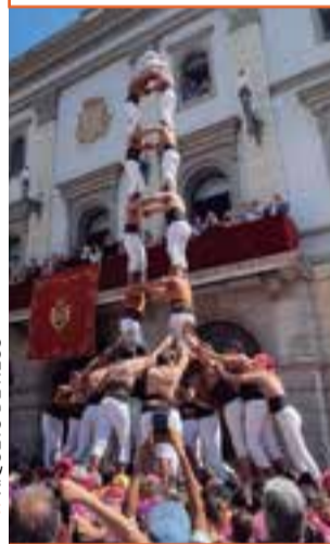
XIQUETS DE REUS