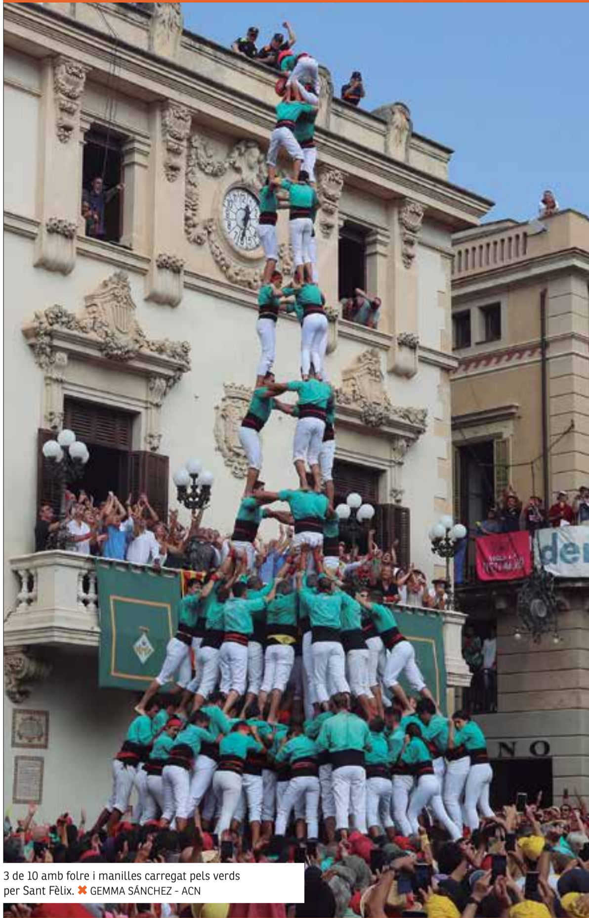
3 de 10 amb folre i manilles carregat pels verds per Sant Fèlix.