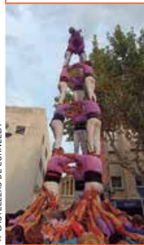
CASTELLERS DE CORNELLÀ