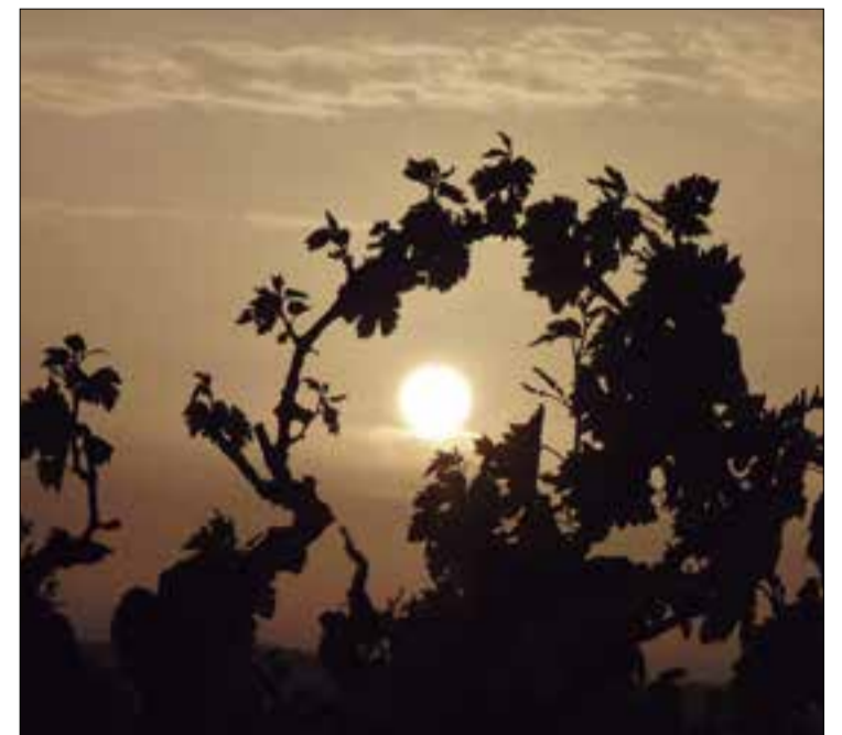
Surt el sol Sant Pau d'Ordal - Abril 2021