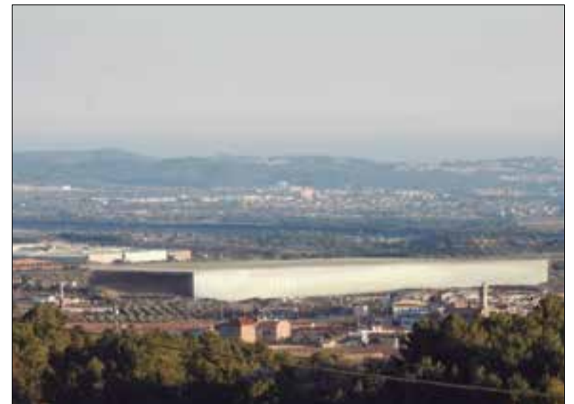
El GEPEC s'oposa a fer un nou polígon a la Bisbal. ✱ GEPEC