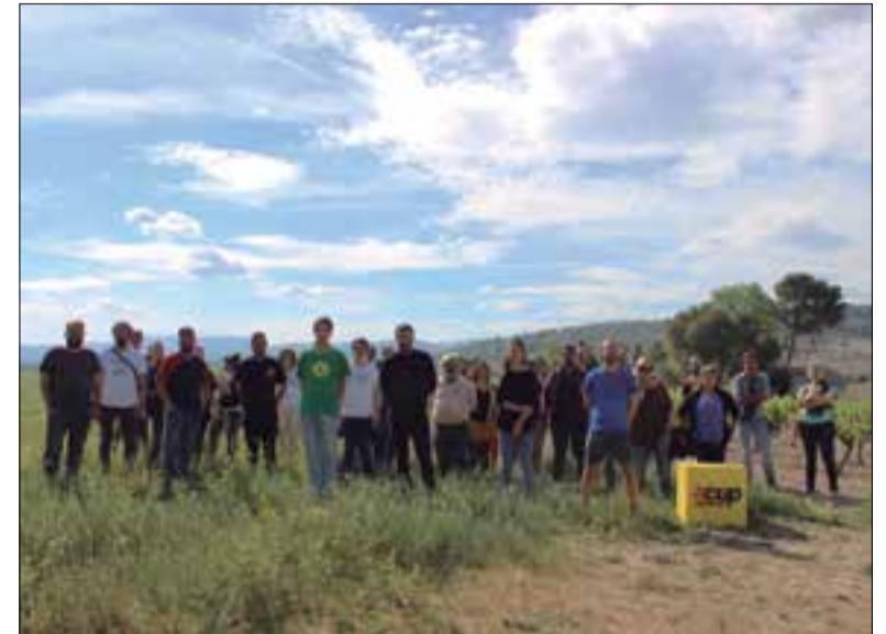
Les 22 candidatures s'han presentat aquesta setmana a Vilafranca. ✱ LA FURA

Amb la intenció d'articular la vegueria Penedès, la Candidatura d'Unitat Popular ha presentat sis propostes amb les quals es compromet a treballar “per donar resposta a les necessitats les persones que viuen a les quatre comarques”. Entre elles, recuperar el Penedès agrari impulsant la Regió Agroalimentària del Penedès de forma coordinada amb entitats i col·lectius ecologistes del territori per “valorar la terra i qui la treballa”. Seguit de la intenció