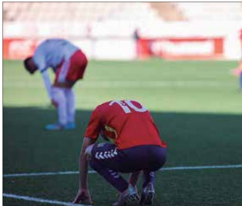
El FC Vilafranca tanca el curs amb 30 punts. ✱ FC VILAFRANCA

Així, el Vilafranca ha acabat la temporada en catorzè lloc, amb 30 punts, a només un del Badalona, que va firmar un empat amb el Tona (1-1) que evitava ensurts de darrera hora i permetia als dos equips acabar de certificar la per-