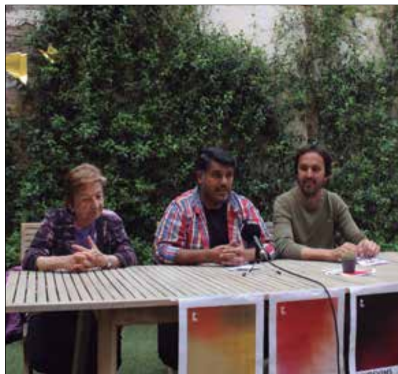
Tindrà lloc el 6 de maig al Barri Vell del poble. ✳ LA FURA

La mostra aposta per cellers de producció ecològica i proximitat que, si bé no són del nucli mateix de Sant Pere de Riudebitlles, sí que es troben situats en els territoris adjacents i de la conca del Mediona-Riudebitlles, "una petita vall que té molt a explicar i amb una gran