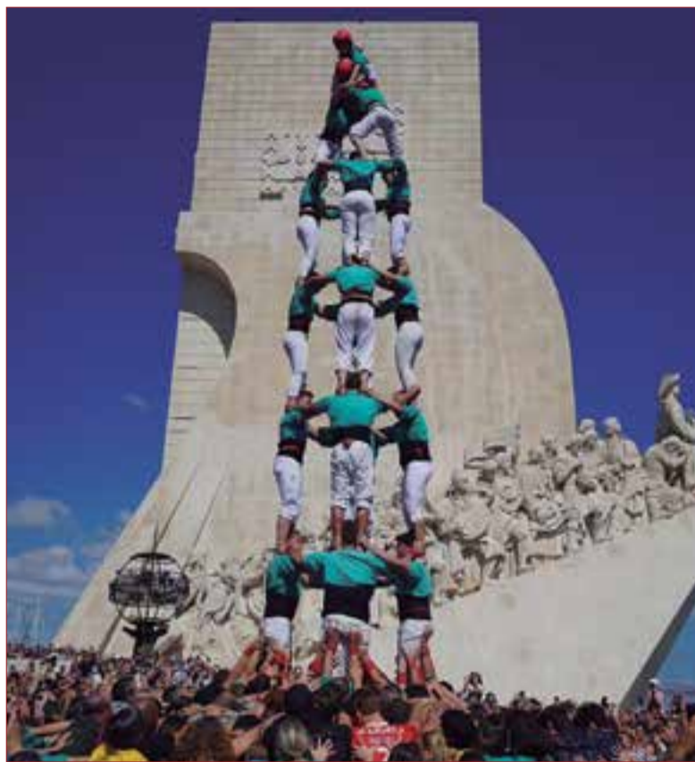
4 de 8 al Padrão dos Descobrimentos. ✖ TONI SOLER - CASTELLERS DE VILAFRANCA