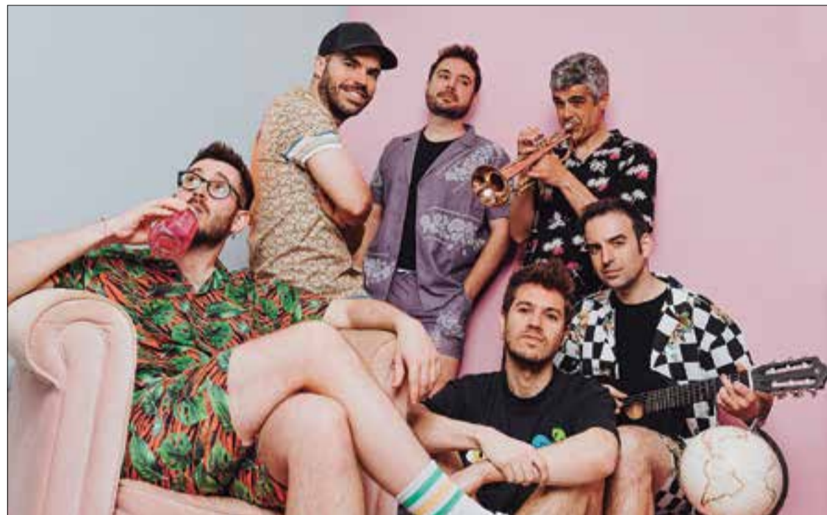
Doctor Prats actuarà diumenge. ✦ BEER LIVE

Els dies 28, 29 i 30 d'abril, La Daurada omplirà el seu recinte d'activitats culturals, concerts i gastronomia