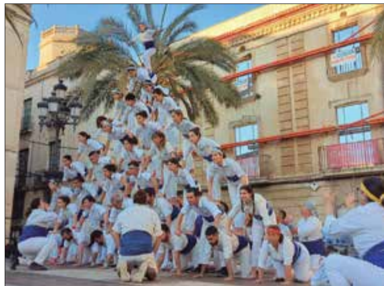
✖ FALCONS DE VILANOVA

La diada de Sant Jordi va ser també diada falconera a la capital del Garraf, on els Falcons de Vilanova van portar a plaça, per primer cop des de la pandèmia, la pira de 8 aixecada per sota. Aquesta, però, no va ser l'única fita dels blaus i blancs, que també van culminar figures com la pira de 10 o el capdil 8x9.