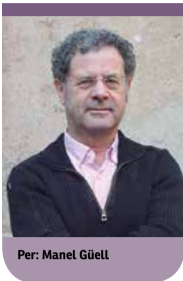
Per: Manel Güell