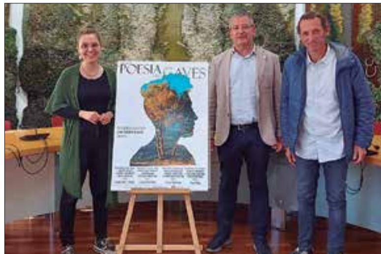
S'allargarà durant els quatre divendres del mes de maig. ✳ AJUNTAMENT

El primer dels recitals serà el divendres 5 de maig a la finca d'Espells