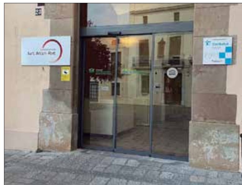
Algú hauria deixat el maletí a l'entrada de l'Hospital.