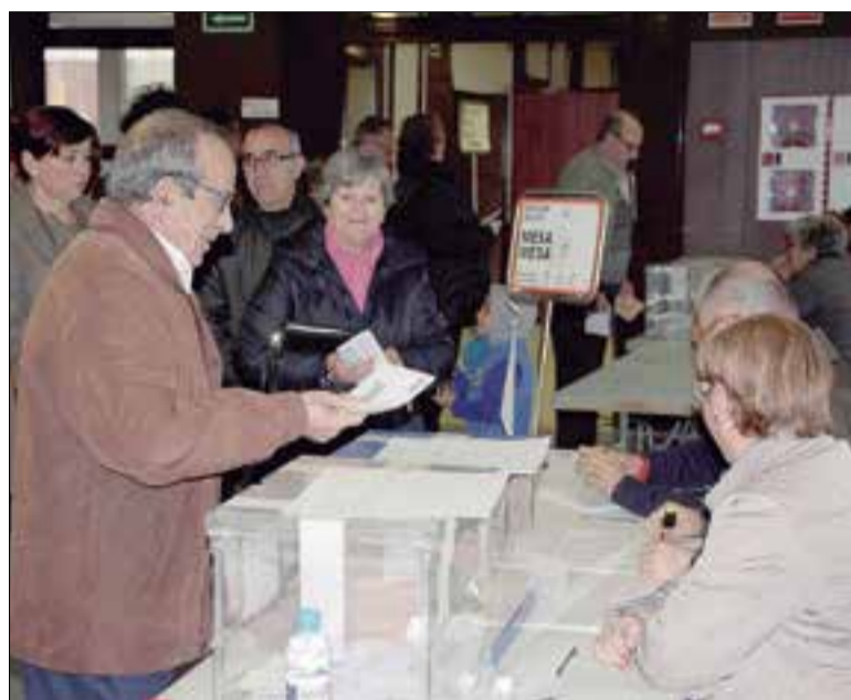
Es presenten quatre candidatures menys que el 2019. ✱ LA FURA

ERC es manté com el segon partit amb major implantació local amb 24 candidatures (una més que el 2019); tan sols no han fet candidatura a Avinyonet, Santa Fe i Pontons, i entre les 24 llistes, n'hi ha tres que són d'agrupacions locals independents però que donen els vots a Esquerra per al Consell Comarcal i la Diputació. El PSC és el partit amb més "marques blanques": set de les seves vint candidatures són de grups locals