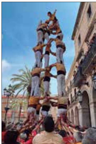
5 de 7 dels de groc terrós.

La diada de Sant Jordi va portar el primer 5 de 7 de la temporada dels Bordegassos de Vilanova, a la plaça de la Vila vilanovina, juntament amb el segon 4 de 7 amb agulla i el 4 de 7, amb pilar de 5 final. Idèntics castells van bastir els Nens del Vendrell, en una actuació que va comptar amb el 3 de 8 i el 4 de 8 de la Joves de Valls (tots dos, els primers de 2023 de la colla) i el 4 de 8 dels Castellers de Barcelona, com a construccions destacades.