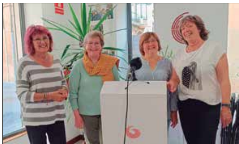
Posen d'exemple l'Escola de Música o el Complex Aquàtic. ✳ VEC