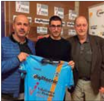
✱ CP VILAFRANCA