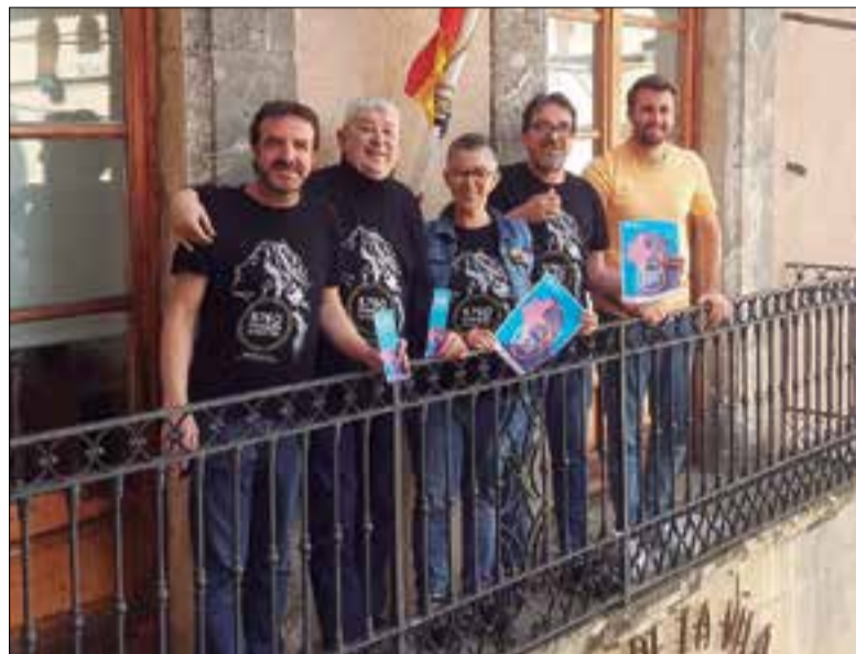
Els administradors de la festa major del Vendrell. ✱ LA FURA

El lema de la festa major 2023 del Vendrell serà "5.760 minuts de ball i foc". Segons els administradors,