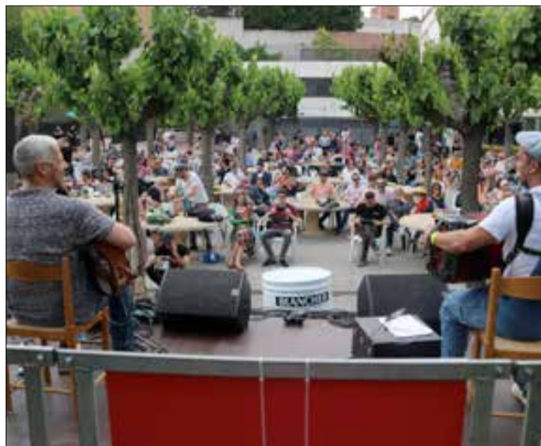
Entre el 28 i el 30 d'abril van tenir lloc 29 espectacles.