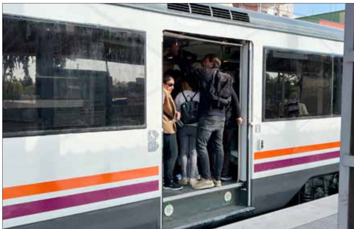
Un incendi en un quadre de senyals a Gavà ha reduït a la meitat el pas de trens de l'R2 Sud.

Durant un mes circularan la meitat dels trens entre Sant Vicenç de Calders i Barcelona per una avaria a les instal·lacions d'Adif a Gavà