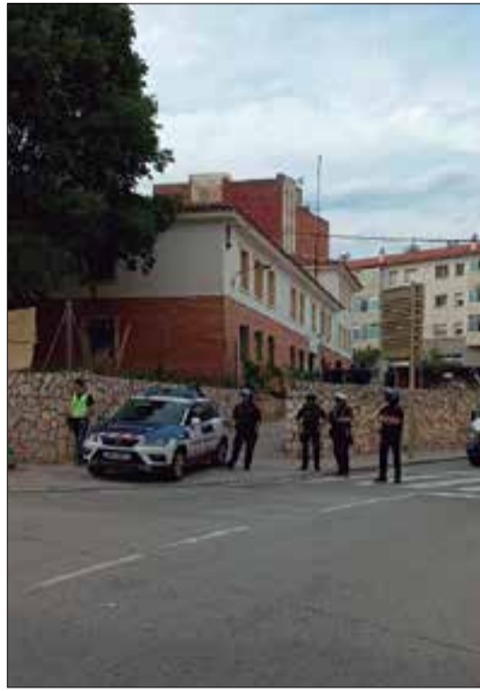
Manifestants concentrats davant de la caserna de la Guàrdia Civil i els antiavalots fent el cordó policial. ✖ RÀDIO SANT SADURNÍ