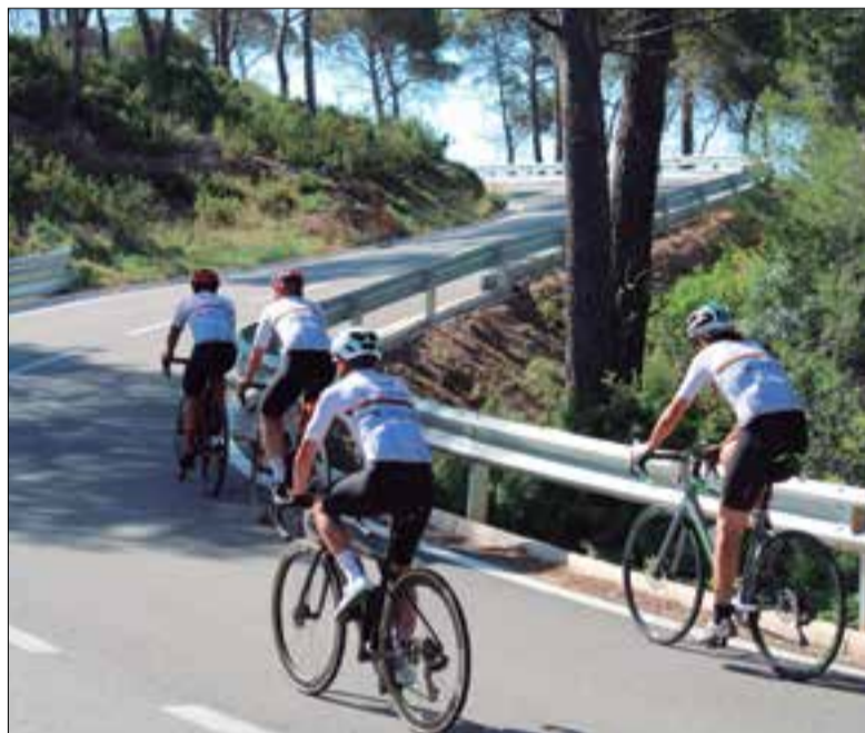
Cursa de l'edició de 2022. ✱ CLÀSSICA PENEDÈS

Serà l'11 de juny, amb dos circuits de 123 i 83 km, respectivament