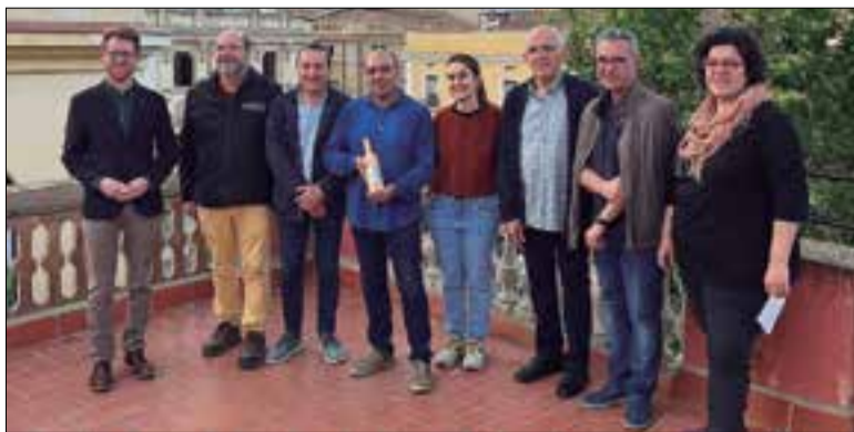
Amb el guardó, el jurat reconeix els 55 anys de trajectòria del Cineclub.

El Cineclub Vilafranca ha guanyat el XV Premi Salvador Armendares que atorga anualment Esquerra