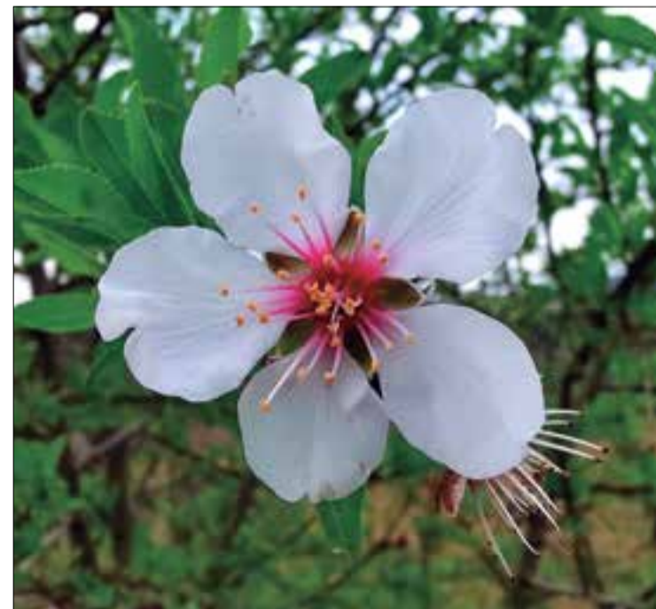
Últimes flors de l'ametller Viladellops - 2021