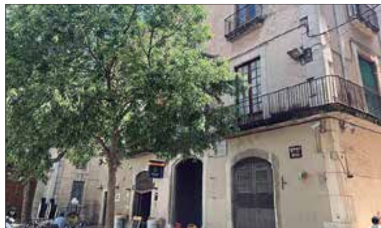
Totes les dependències de la Policia Nacional es traslladaran al c. Olèrdola.