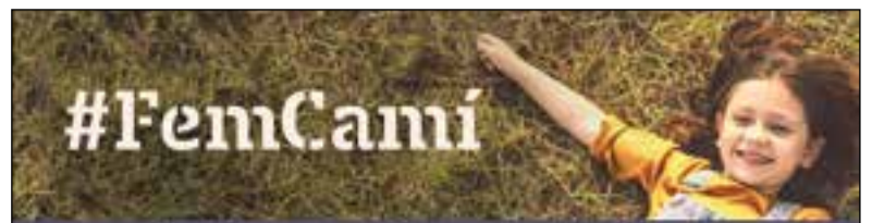
Contingut patrocinat per Ametller Origen

Dins el seu programa, Junts també proposa el tancament de les pistes exteriors del pavelló de la Gamba, millorar l'aïllament de la coberta del pavelló d'hoquei, reformar els vestidors, amb l'objectiu “d'aprofitar el potencial que tenim i donar resposta a les necessitats”, promoure el turisme esportiu i habilitar més de 500 noves places d'aparcament a la Zona Esportiva.