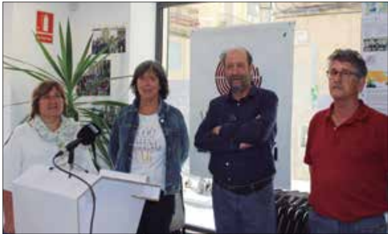
La transició energètica i la gestió dels residus, eixos de VeC. ✱ LA FURA