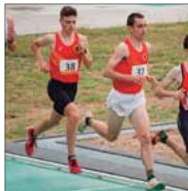
Montaner i Valdepeñas. ✱ ESPORTIU