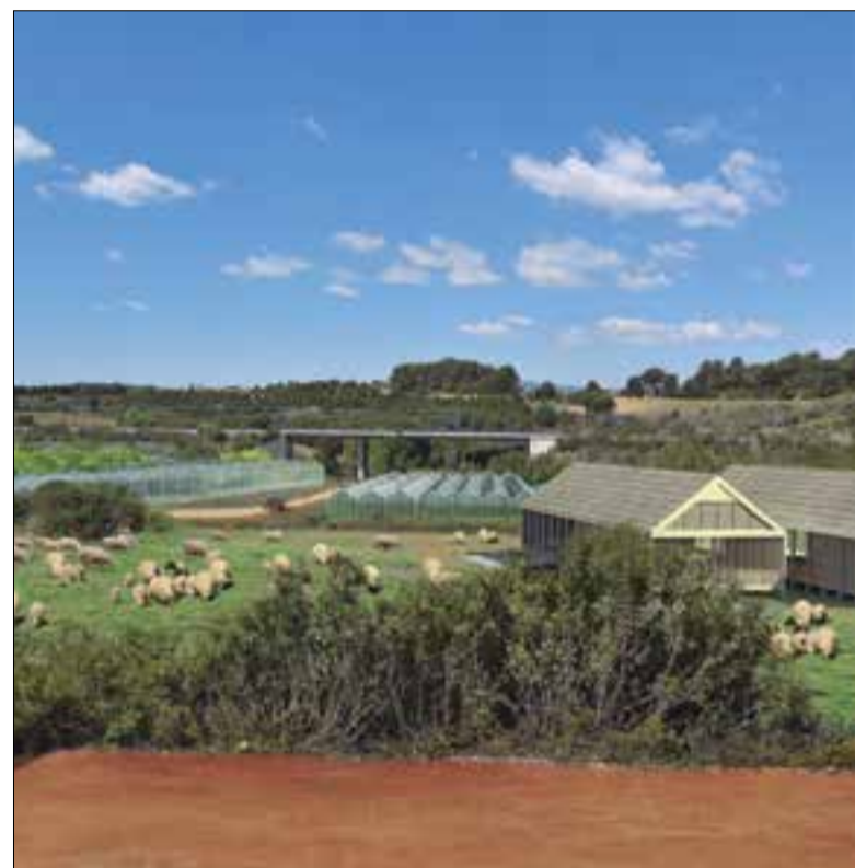
Render del projecte d'agroparc.