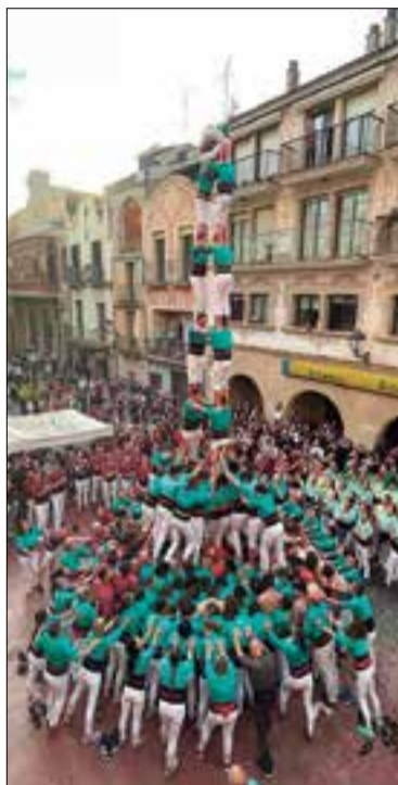
* CASTELLERS DE VILAFRANCA

A la mateixa diada de la Festa de Primavera, els Vailets de Gelida començava bé la temporada descarregant tres castells de sis: 4 de 6, 3 de 6 i 3 de 6 amb agulla, amb