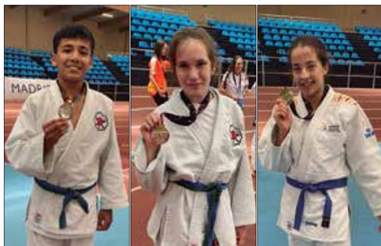
✱ ESCOLA DE JUDO