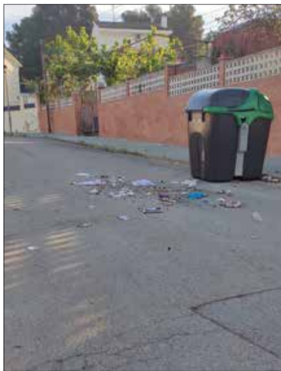
Dos senglars la campen pel Nou Vendrell i restes de brossa deixades al carrer. ✖ CEDIDES PER VEÏNS