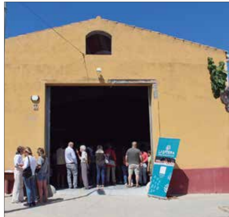
L'obrador es preveu que obri el mes de setembre.

La iniciativa està liderada per una cooperativa que es va fundar el