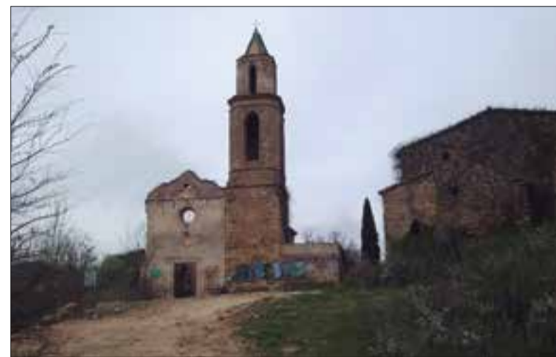
Església encimbellada al Marmellar. ✱ LA FURA

L'Ajuntament del Montmell ha informat que la festa de celebració del mil·lenari del poble deshabitat de Marmellar, prevista pel diumenge 14 de maig, s'ha hagut de posposar. La situació meteorològica d'intensa sequera fa que el risc d'incendi sigui elevat. Tampoc les previsions per a les dues pròximes setmanes sembla que han de millorar, i les autoritats han decidit finalment ajornar la festa seguint les recomanacions dels Agents Rurals.