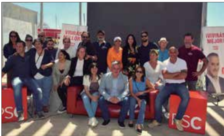
La presentació de la llista es va fer al port de Segur. ✱ LA FURA

El PSC de Calafell va presentar dilluns la seva candidatura per a les eleccions municipals del 28 de maig. Ho va fer amb un acte al Port de Segur, on es va donar a conèixer la llista sencera. Es tracta d'un projecte continuïsta, en el qual els primers vuit llocs de la llista l'ocupen regidors que actualment ja estan al govern municipal.