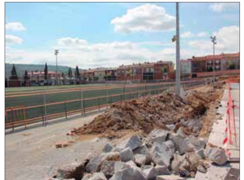
Acabar el pla de reordenació de la zona esportiva és prioritari per Junts.