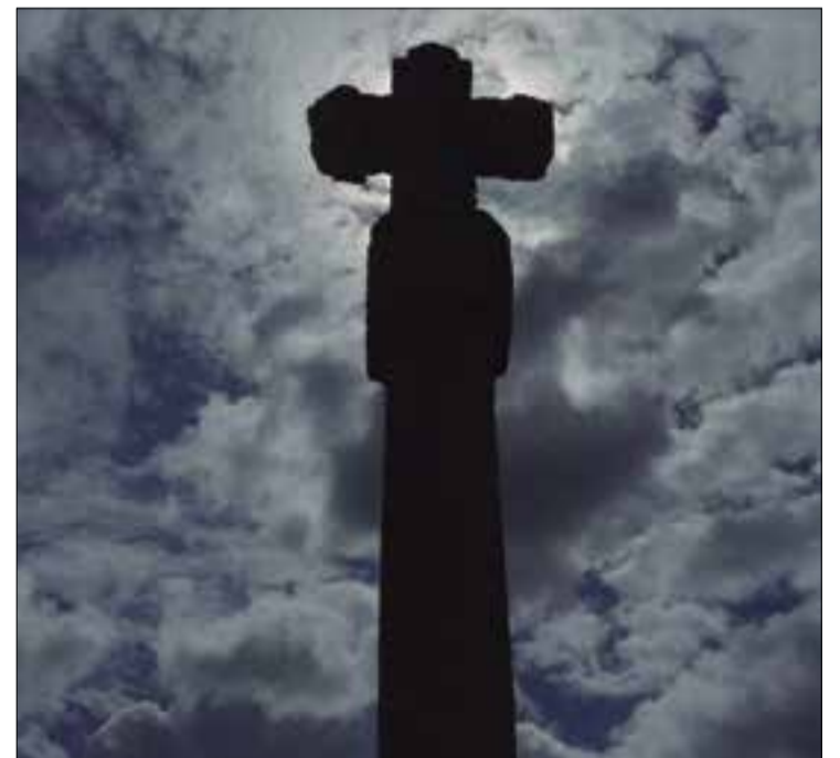
Creu de Santa Digna recuperada Vilafranca del Penedès - 2023