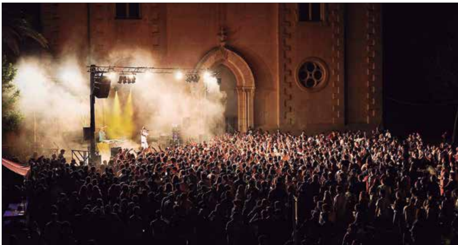
Aquestes retallades dificulten la viabilitat econòmica del festival, segons expliquen des de Barraques. ✖ TOMÁS GONZÁLEZ