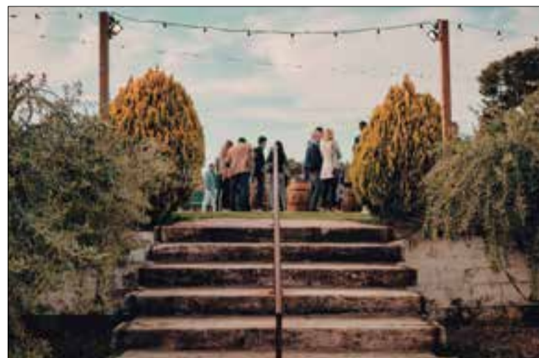
Durant la vetllada es podrà gaudir de música en directe.