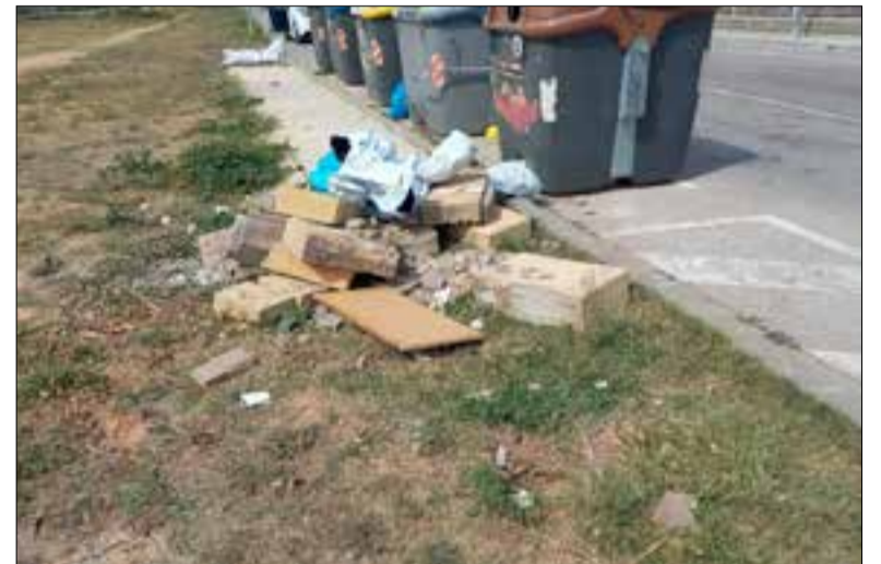
Denuncien l'incivisme que pateix la ciutat.