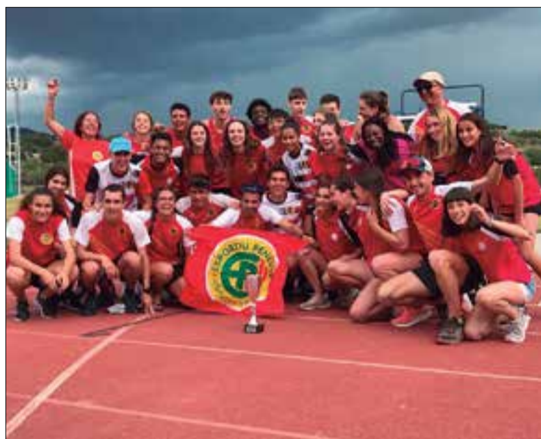
L'Esportiu Penedès celebrant el títol de lliga. ✦ ESPORTIU PENEDÈS