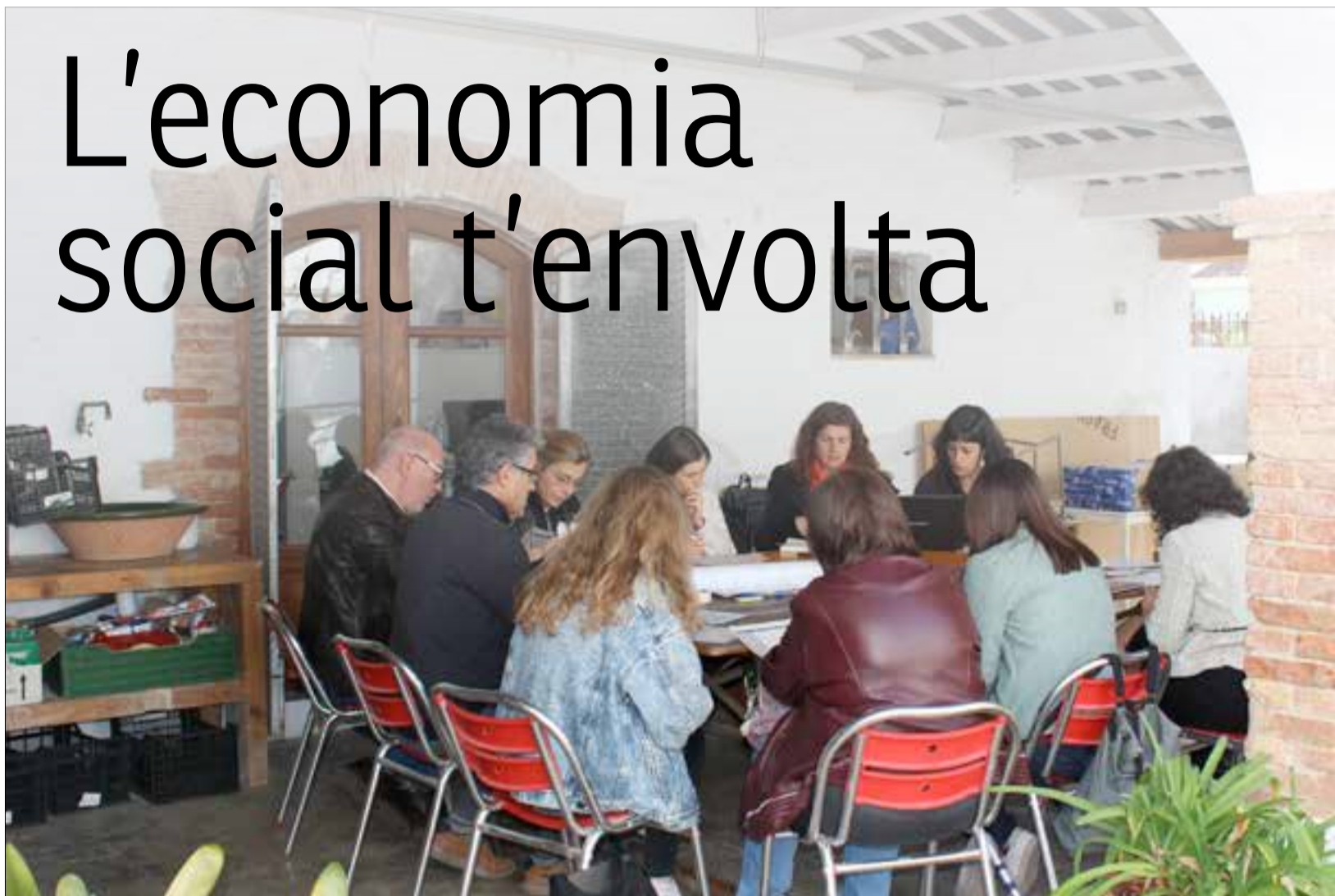
Moment de la primera assemblea de l'any de Coopsetània, l'Ateneu Cooperatiu de l'Alt Penedès, Baix Penedès, Anoia i Garraf. ✦ LA FURA

D el 2 al 16 de juny Coopsetània, l'Ateneu Cooperatiu de la vegueria Penedès, celebra la cinquena edició de la Quinzena de l'ESS. Enguany el fil conductor dels més de quaranta actes programats és "L'economia social i solidària t'envolta".