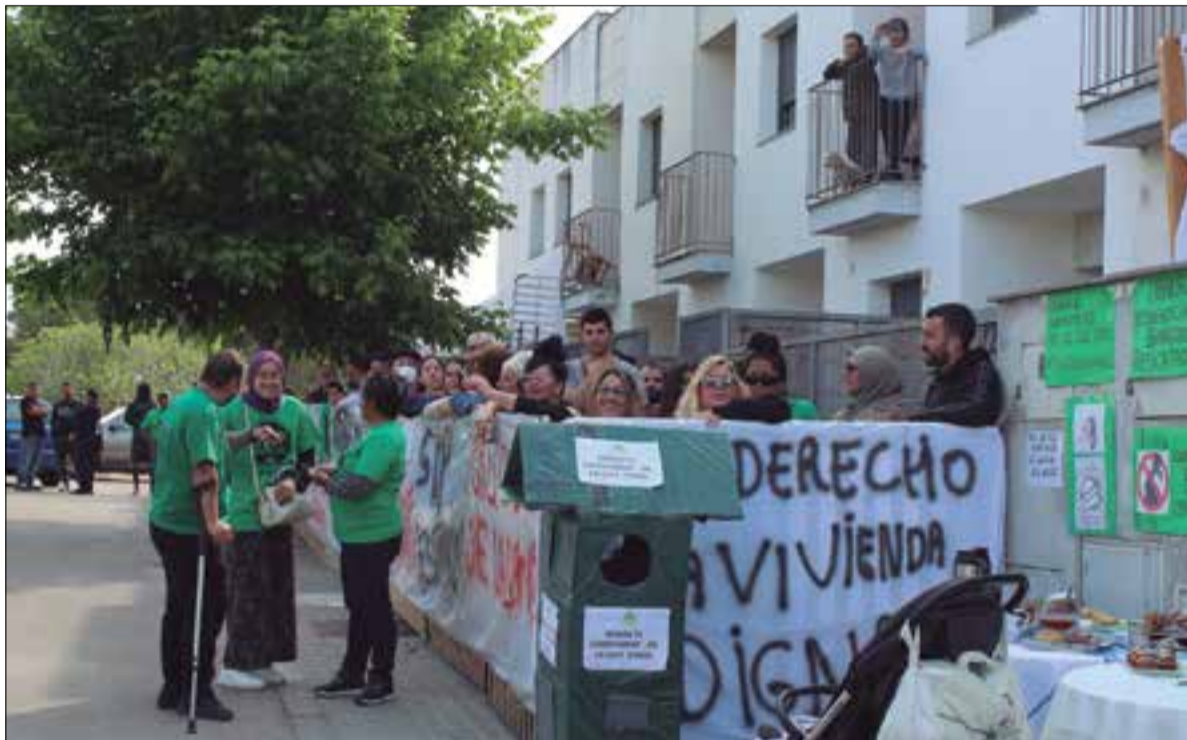
Han col·locat barricades a l'entrada de les cases per impedir l'accés als Mossos d'Esquadra. ✖ LA FURA

La PAH demana a l'Ajuntament que reubiqui els afectats en un pis de lloguer social a la rambla Sant Jordi