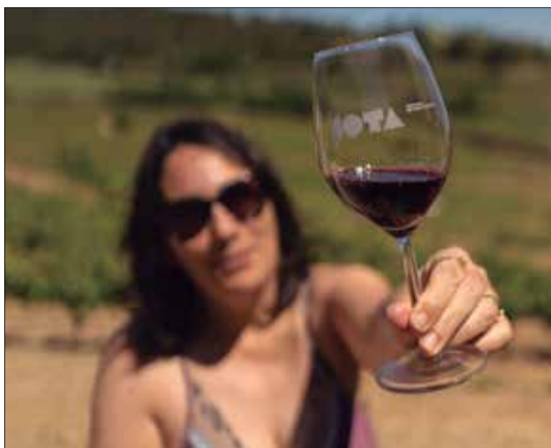
Amb l'accés, es rep una copa i el dret a 18 tastos. ✱ COTA 2022

Les portes de la fira obriran a les 12 del migdia. S'hi podrà accedir amb la compra d'un Bonoví (21 euros) a taquilla o bé prèviament a través de la pàgina web ( www.cotavins.cat ). L'accés dona dret a una copa i a 18 microtastos per poder degustar un vi de cada celler. Un cop fetes les 18 microdegustacions, es podran demanar vins a copes directament al celler o una ampolla de vi per compartir a la fira o per emportar-se cap a casa. La fira estarà ambientada al llarg del migdia i la tarda (tancarà a les 9 del vespre) amb tres actuacions de jazz, també hi haurà tres food-