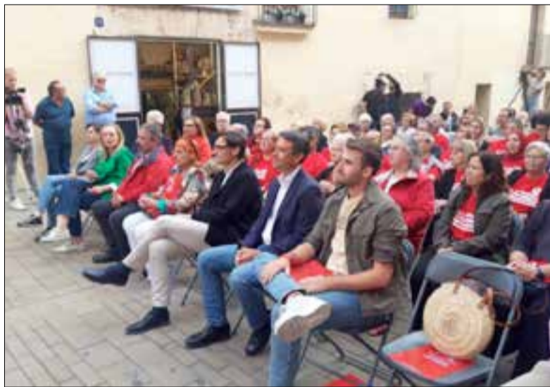
El carrer de les Quatre Fonts ha acollit l'acte socialista. ✪ LA FURA

El PSC ha proposat pagar un cap de setmana cada any a la gent gran