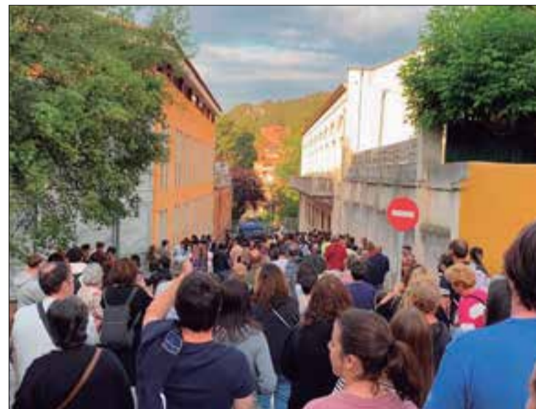
Concentració veïnal davant l'immoble ocupat. ✱ RÀDIO GELIDA

Els dos últims ocupants que quedaven al pis conflictiu del carrer Francesc Peracaula de Gelida van marxar dimarts a la tarda, segons fonts policials. En els darrers dies els veïns de l'immoble havien fet concentracions de protesta per la presència en un dels pisos d'uns ocupants als quals s'acusava de robatoris i furt a la zona. Sobre el pis pesava una ordre de desallotjament i, en paral·lel, els Mossos d'Esquadra van mediar entre veïns i ocupants per redreçar la situació. La mediació havia comportat que alguns dels cinc ocupants ja haguessin marxat del pis abans. Un cop l'immoble va quedar buit, els propietaris van prendre mesures per evitar noves ocupacions.