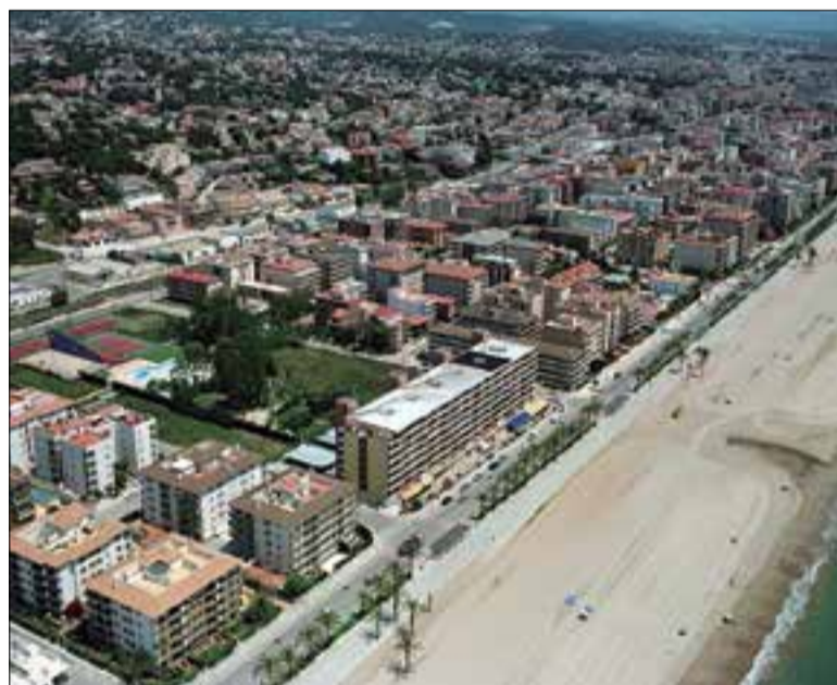
El cens electoral ha crescut un 8,8%. ✳ AJUNTAMENT

En canvi, la pujada és molt més suau a la capital de comarca, el Vendrell, on el cens actual d'electors és de 27.481, una mica per