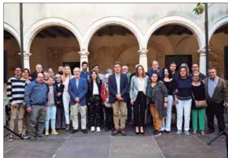
La candidatura es va fer la foto de grup al claustre.