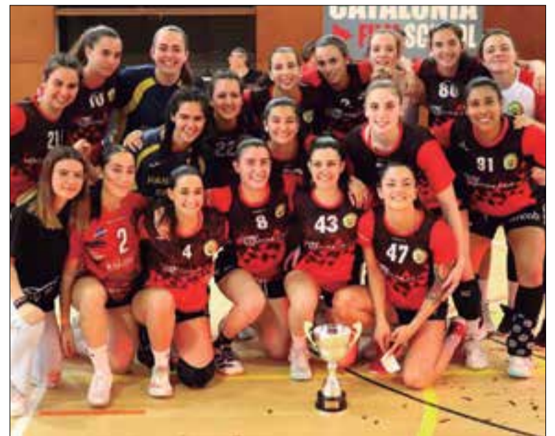
Les ribetanes celebrant el títol. ✦ HANDBOL RIBES