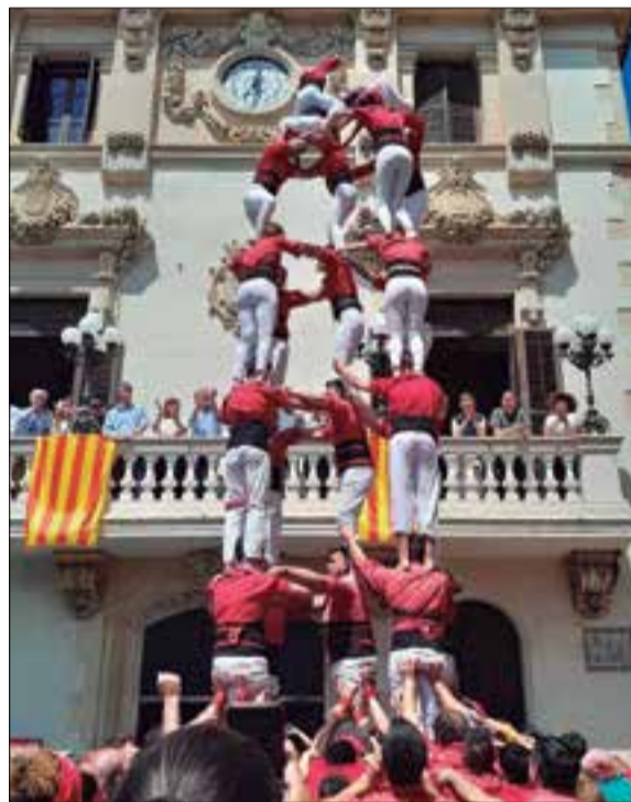
3 de 9 folrat dels verds i 5 de 7 dels vermells. ✖ CASTELLERS DE VILAFRANCA / XICOTS DE VILAFRANCA

Molta bona diada casteller de Fires de Maig, la que es va veure diumenge al migdia a la plaça de la Vila de Vilafranca, amb Castellers i Xicots que hi van estrenar dos castells i pilar cadascuna, i amb el 3 de 9 amb folre dels verds com a gran construcció. Una actuació ràpida, àgil que va deixar contentes les dues colles vilafranquines.