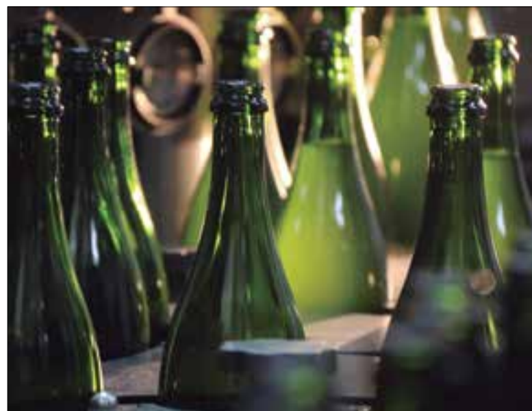
Ampolles de cava, en una línia de producció.

En matèria econòmica s'ha pactat un increment salarial del 3% per als anys 2023, 2024 i 2025, que s'aplicarà sobre tots els conceptes salarials, inclosa la paga extra de conveni. A més, s'incorpora una clàusula de revisió salarial al final de la vigència, que pot arribar fins a l'1,5% (amb un total d'increment del 14,93%) en cas que la suma dels IPC dels anys 2022, 2023, 2024 i 2025 superi el 13,43%. Això signi-