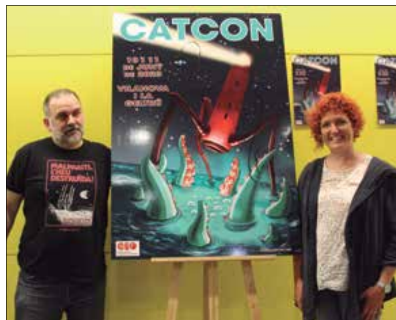
La CatCon es farà els dies 10 i 11 de juny a l'Auditori Eduard Toldrà.