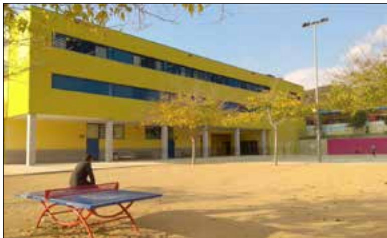
L'escola La Ginesta de Calafell. ✦ LA FURA

Aquesta era una demanda de la comunitat educativa, a causa de l'ascens de temperatures que hi ha hagut els últims anys i que afecta les aules especialment durant les primeres i les últimes setmanes del curs escolar. Des de l'Ajuntament esperen que la mesura faci "més passadores les hores de calor" i eviti que s'hagin