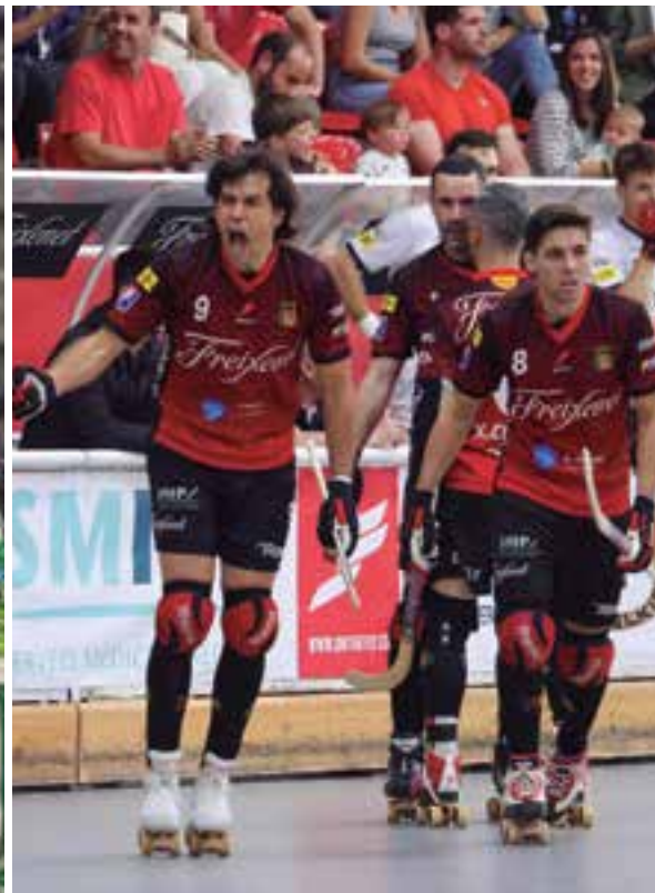
Els dos equips s'encomanen al factor pista per remuntar l'eliminatòria. ✖ REFP

El Patí Calafell i el Noia estan obligats a guanyar aquest divendres, si volen continuar vius per intentar aconseguir el títol de l'OK Lliga. Tots dos equips arriben a la segona volta de les semifinals en la mateixa situació: dos partits jugats fora de casa, dos partits perduts. Així doncs, verds i negre-i-vermells s'encomanen al factor pista per remuntar l'eliminatòria.