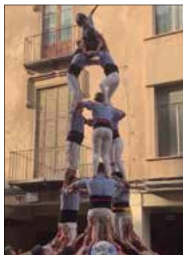
✦ JOVE DE VILAFRANCA