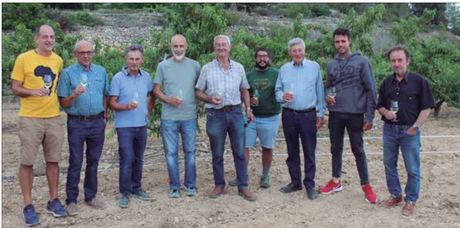
Foto de família dels nou productors que integren l'Associació de Productors de Prèssec d'Ordal. ✱ LA FURA