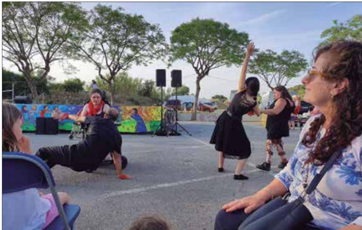
Serà la 20a edició de l'esdeveniment i se celebrarà al recinte de l'IMET.

Sota el lema “Una societat inclusiva és la que et permet ser únic o única en un món divers”, arriba la 20a edició de la Festa per una Societat Inclusiva que se celebrarà dissabte 3 de juny al recinte de l'IMET de Vilanova i la Geltrú. Es durà a terme a partir de les 4 de la tarda amb una programació molt àmplia que, a més, allarga l'horari fins a les 11 de la nit.