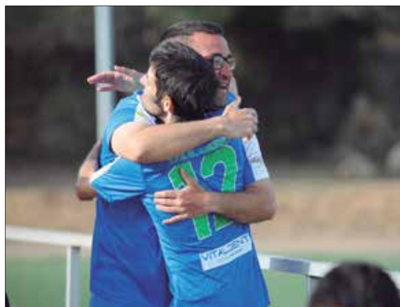
La Copa tindrà lloc al camp de futbol de La Llacuna.