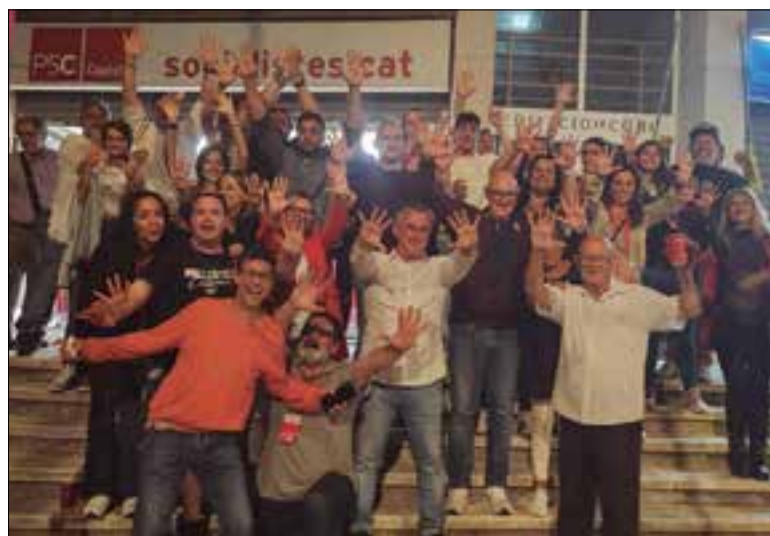
L'alcalde Ramon Ferré (PSC) celebra la victòria electoral a Calafell.