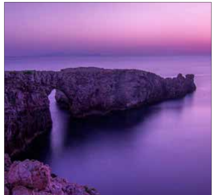
Fa olor d'estiu Menorca - 2021