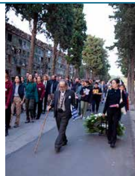
Visita guiada al cementiri de Vilafranca. * EVA

Un recorregut que, el dissabte 10 de juny, començarà de la plaça de la Vila a les 20.30 hores per desplaçar-se fins al cementiri, on diferents treballadors explicaran la seva història i la seva relació amb aquest emplaçament. Aquesta coproducció del Teatre Lliure i Contenidos Superfluos, que ha rebut el setè premi de la Crítica de Carrer al Millor Espectacle d'Arts de Carrer i el premi Temps de les Arts 2022 en arts escèniques, serà un dels plats forts de l'EVA23.