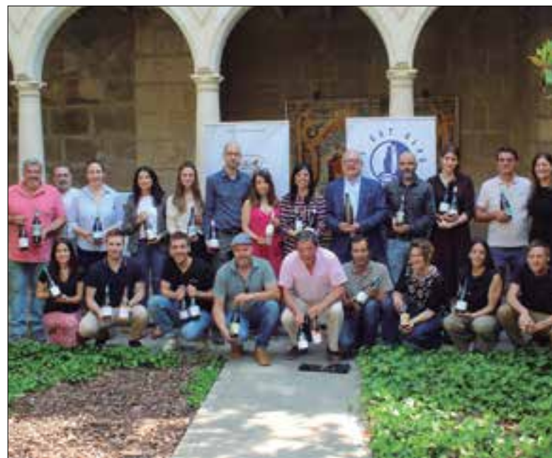
L'esdeveniment celebra enguany la 14a edició.