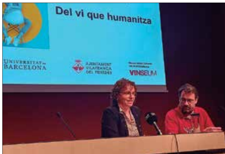
El curs es farà del 3 al 7 de juliol.