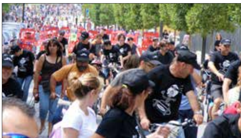
Imatge d'arxiu de la Festa de la Bicicleta del Vendrell.

La Festa de la Bicicleta tindrà un acte previ amb la pedalada nocturna que es farà la nit del divendres 2, i que sortirà a les 21.00 hores del Monument als Castellers de la carretera de Tarragona per anar a Coma-ruga i tornar. L'activitat es fa amb el suport del club Open Natura i les inscripcions, que es poden fer fins al dia 31 de maig