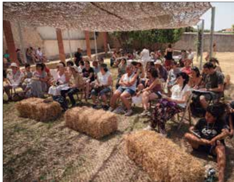
El Remeiart oferirà més d'una cinquantena de propostes. ✦ LA FURA

Arriba la dotzena edició de la fira Remeiart a Santa Margarida i els Monjos, que es convertirà durant un dia en l'epicentre del sector de les herbes remeieres a Catalunya. Enguany, la programació es dedica al coneixement i a la difusió de les plantes i les seves aplicacions.