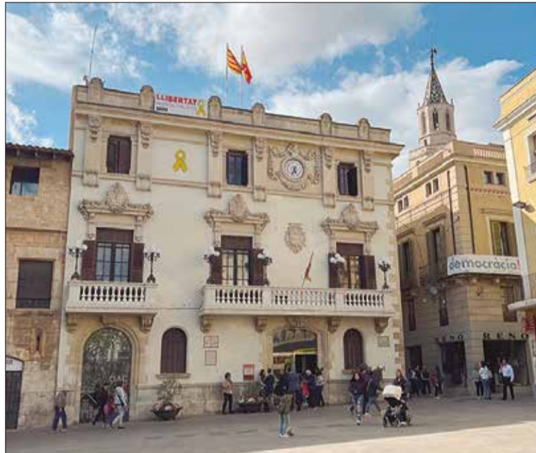
El PSC va comptar amb el suport d'ERC i VeC i l'abstenció de Junts i CUP.

Quant a l'IBI, es planteja un increment del 3% i la principal novetat