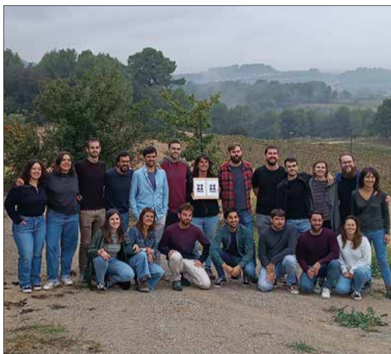
Dilluns es va llegir el manifest fundacional de Vida Penedès. ✱ LA FURA

Vida Penedès es defineix com un col·lectiu molt divers: "Som vinyers i elaboradors d'origens molt diversos", diuen. L'impulsen, per ara, microcellers que comencen de zero fins a projectes personals que troben el seu espai dins de cellers consolidats, alguns formen part de la DO i marques col·lectives i d'altres no... Des de la nova entitat insisteixen que la porta és oberta a tothom que vulgui sumar-s'hi: "El territori no només és paisatge, també és cuidar-nos entre totes, per nosaltres el factor humà és clau", indiquen. És per això que un dels seus principals objectius és fer xarxa, promoure l'autoorganització de tots els viticultors que tinguin aquesta manera de veure, viure i treballar la terra i el vi.