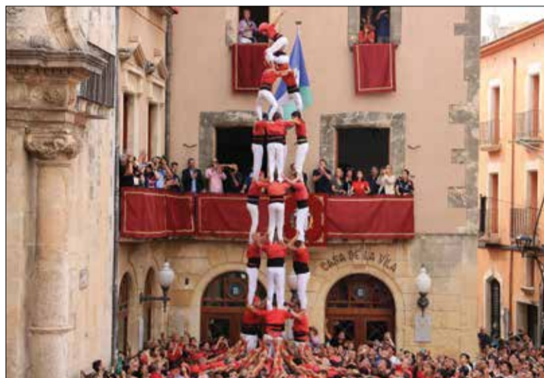
El 4 de 8 dels Nens del Vendrell a la Fira de Santa Teresa.

Nens del Vendrell: 4/8, 2/7, 7/7 Jove Xiquets de Tarragona: 5/9f Jove Xiquets de Valls: 3/9f, 4/9f, 5/8