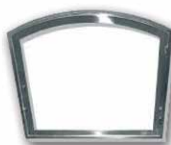
Marc amb vidre