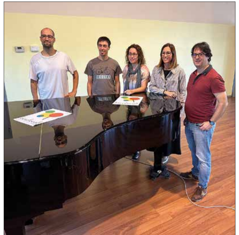
L'equip directiu de l'escola i la regidora d'Educació. ✱ LA FURA

L'Escola Maria Dolors Calvet va obrir portes l'any 1999 amb 280 alumnes i actualment en té gairebé 600. Cada curs organitza una mit-