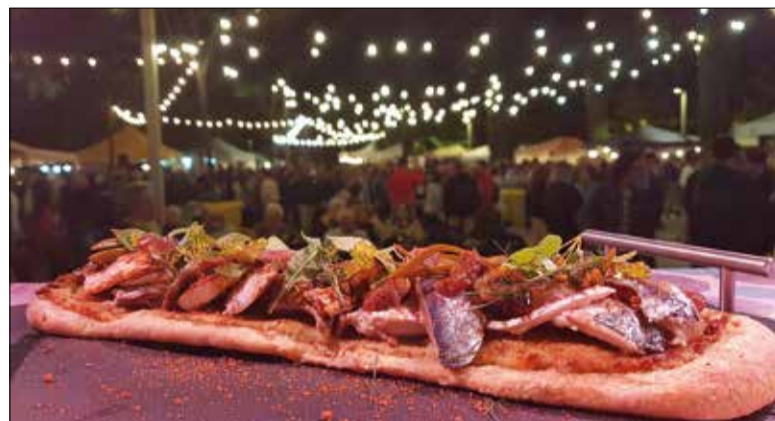
L'Enramada arriba als deu anys ✦ AJUNTAMENT

L'Arboç ja ho té tot a punt per acollir aquest cap de setmana la desena edició de la Mostra de l'Enramada del Penedès, una fira enogastronòmica que se celebra entre el 20 i el 22 d'octubre a l'espai adjacent al poliesportiu municipal. En aquesta edició tan especial hi haurà una destacada presència de parades arbocenes.