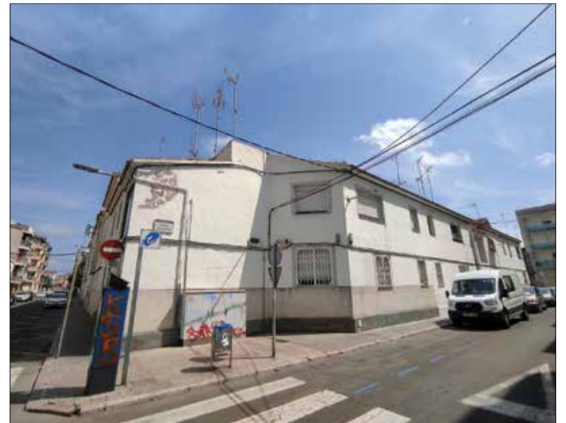
L'actuació es farà en dos barris del poble i la platja. ✦ AJUNTAMENT

Entre tots dos barris sumen més de 80 habitatges que tenen diversos problemes relacionats amb la pobresa energètica. Per això s'aplicaran mesures com ara la instal·lació de plaques solars, el canvi