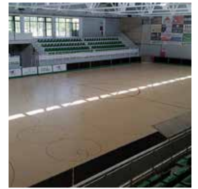
Pavelló Joan Ortoll. ✖ AJUNTAMENT