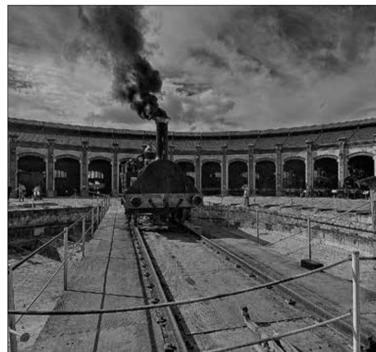
Dipòsit de màquines del Museu del Ferrocarril de Catalunya Vilanova - 2010