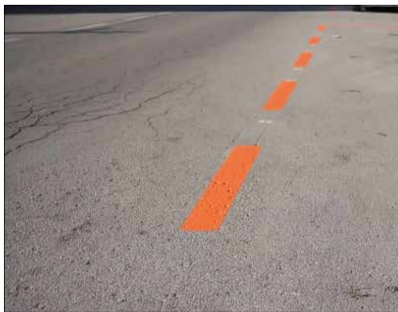
La zona taronja de Cunit s'ha estrenat aquest any. ✱ AJUNTAMENT

On no es volen introduir canvis és a les tarifes d'aquesta zona de pagament, un aspecte que reclama l'Associació Veïnal de Cunit, que ha presentat una proposta