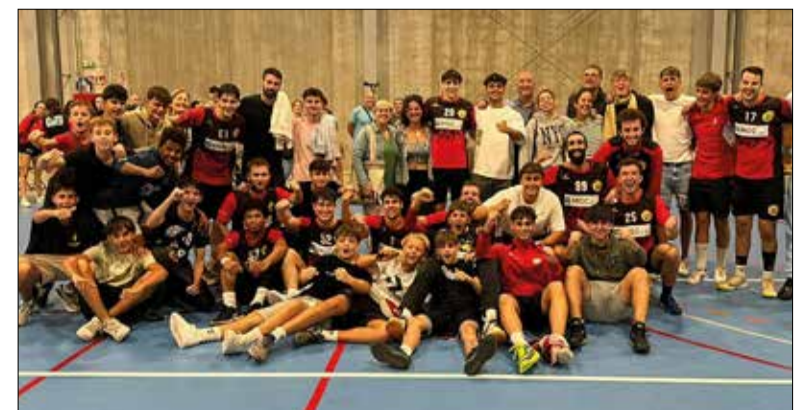
L'equip celebrant la victòria. ✖ HANDBOL RIBES

Apropant-se l'últim període del partit, els ribetans es van posar per davant del marcador, però seguia la petita diferència al resultat i la tensió era palpable a l'ambient. Més encara quan el partit s'encallava pocs minuts abans del final amb un empat a 26. La glòria local va esclatar pocs instants abans del final,