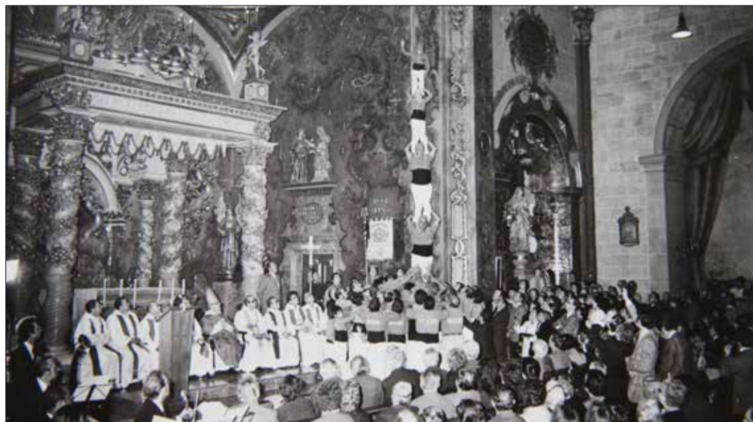
Pilar dels Nens al funeral de Casals.

banderes catalana i porto-riquenya. L'Orquestra Simfònica de Puerto Rico, que havia fundat el mateix Casals, va tocar la marxa fúnebre de la Tercera simfonia de Beethoven. També la coral del conservatori de música de la ciutat es va sumar a l'homenatge interpretant dues seleccions d' El pessebre , amb l'acompanyament de la soprano Olga Iglesias. El govern del país va decretar tres dies de dol.