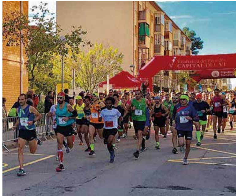
La Mitja Marató es farà el 19 de novembre. ✖ LA FURA

Per quarta edició consecutiva, Vilafranca serà la seu del Campionat de Catalunya Universitari de mitja marató, que puntua per la Lliga Universitària de Curses Populares. Per a les persones que no s'atre-