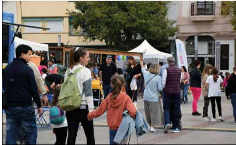
Una edició anterior de la Fira de Novembre. ✦ AJUNTAMENT

Enguany destaca la reformulació del pòrtic de la Fira, que passa a ser el primer dels actes de la inauguració oficial. Una altra novetat és el canvi del tradicional discurs per una taula rodona entre experts al teatre Principal, coordinada entre l'Ajuntament i la Federació d'Empresaris Garraf Penedès. Al programa de la fira s'incorpora la convocatòria de Gira Feina, esdeveniment promogut des de l'IMET, l'Oficina municipal d'Atenció a l'Empresa, el servei de Joventut i la Cambra de Comerç. A l'espai es promourà el contacte entre em-