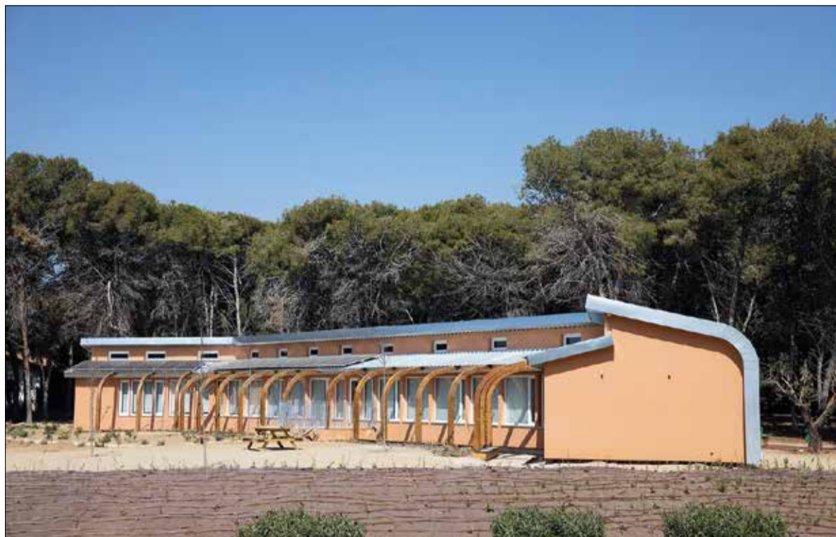
La Barnahus de Tarragona, que va entrar en funcionament el 2020.