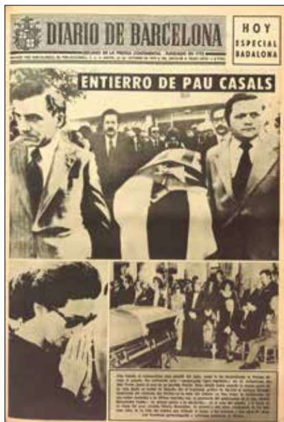
L'enterrament de Casals a Puerto Rico.