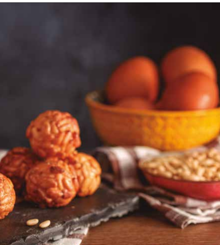
✳ ADOBE STOCK