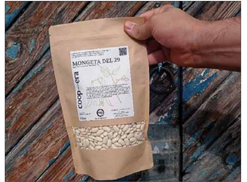
Se'n diuen del 29 perquè tradicionalment es plantaven el 29 de març.