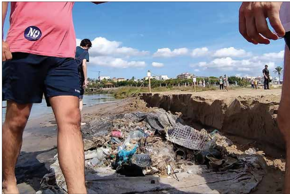
La recollida de residus es va fer el 16 de setembre. ✦ TWITTER CUSTÒDIA PLATGES GARRAF