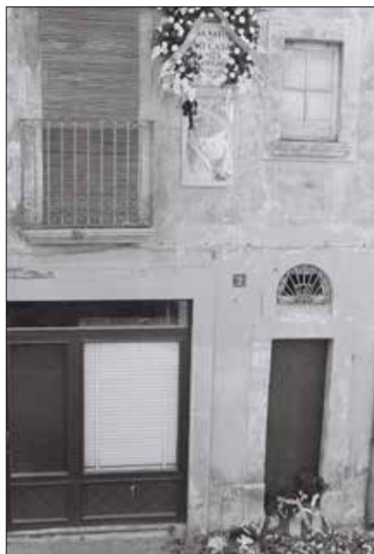
La casa nadiua el dia de la mort de Casals