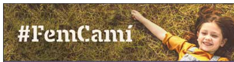
Contingut patrocinat per Ametller Origen

La Fundació Pere Tarrés, adjudicatària del servei, impulsarà diferents activitats de lleure que es faran als mateixos centres escolars dels municipis, per evitar que les famílies hagin de desplaçar els seus fills després de l'horari escolar. Per inscriure-s'hi, de forma gratuïta, es pot enviar un correu electrònic a ludotequesbaixpenedes@peretarres.org, o contactar-hi a través del WhatsApp 689 526 356, amb almenys 48 hores d'antelació, segons han informat.