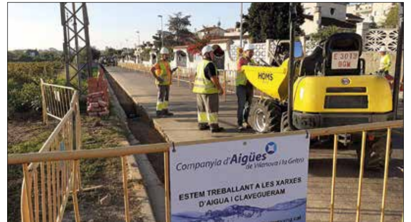
Les obres al Prat de Vilanova. ✦ AJUNTAMENT