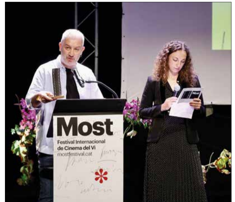
El director de la cinta guanyadora ha recollit el premi amb el permís especial de les autoritats ucraïneses. ✱ FESTIVAL MOST

El film relata la resistència dels viticultors enmig de la guerra