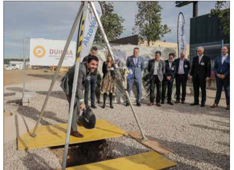
Roger Torrent, en l'acte de col·locació de la primera pedra

La multinacional neerlandesa ja té una planta de producció al municipi