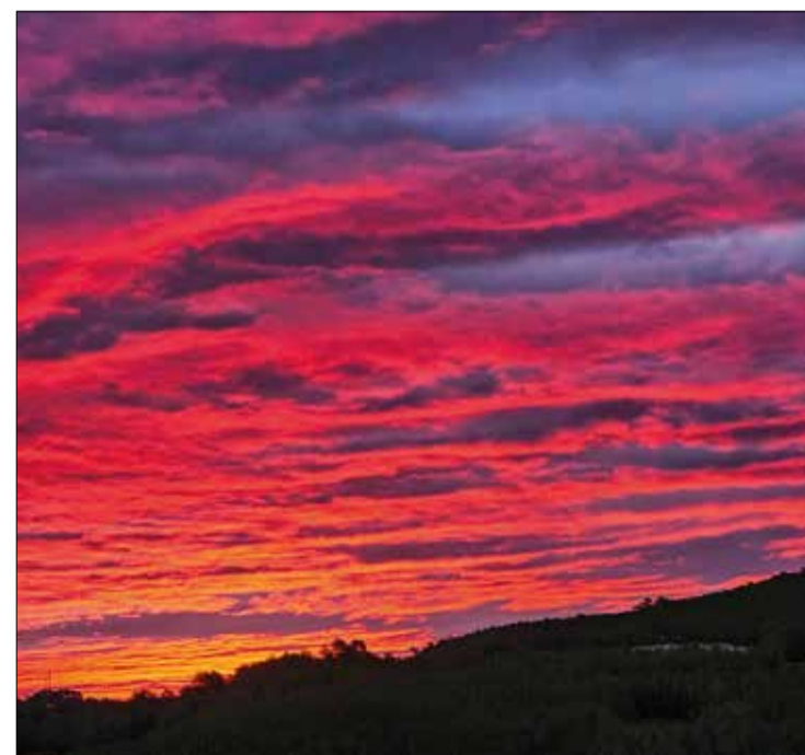
Explosió de colors durant les primeres llums del dia Viladellòps, Olèrdola - Novembre 2023