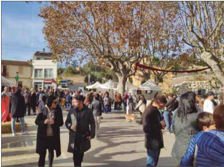
Una edició anterior del Subirats Tasta'l.

El diumenge 26 de novembre, Sant Pau d'Ordal celebrarà la 18a edició del Subirats Tasta'l. La fira permetrà tastar la qualitat dels vins i escumosos dels cellers del municipi i la gastronomia local, a més de reivindicar el valor dels productes del territori.