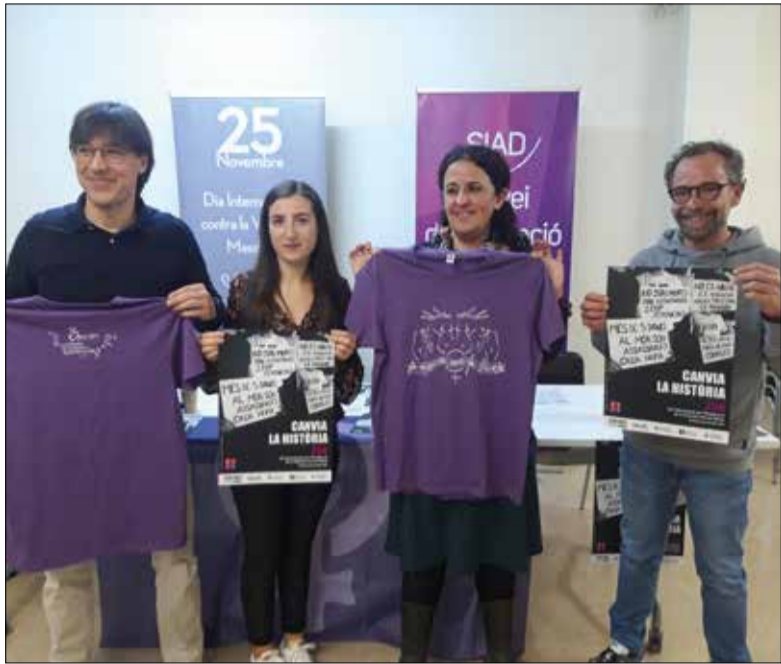
El programa inclou una desena d'actes. ✦ LA FURA