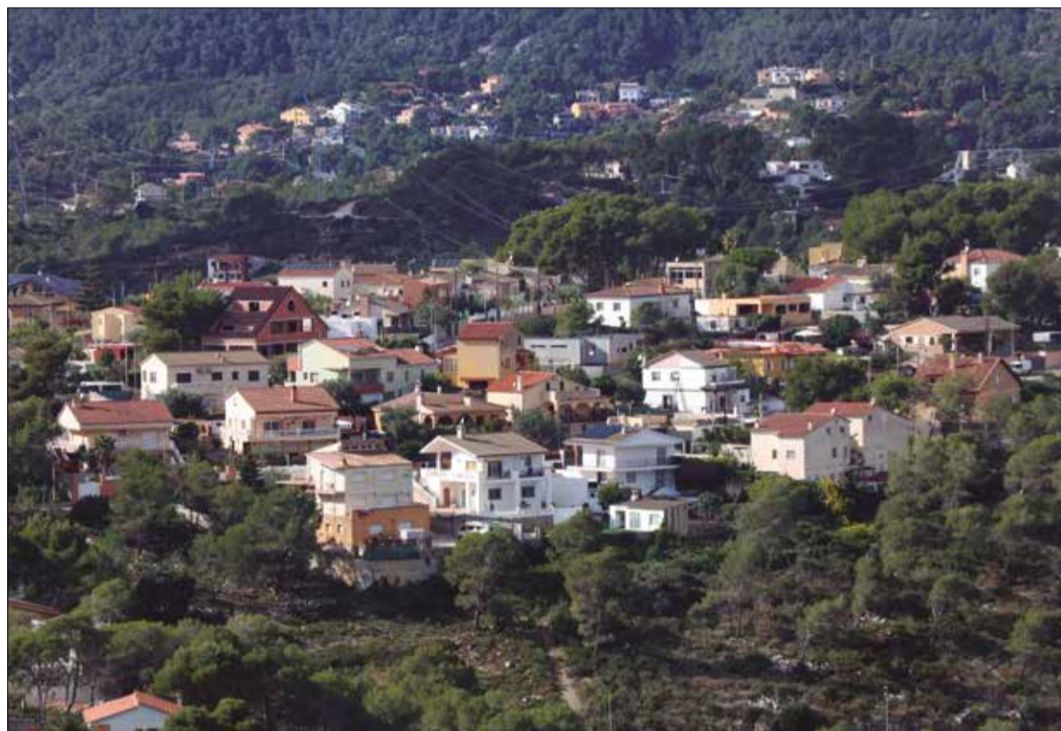
Cases unifamiliars d'una de les urbanitzacions de Canyelles ubicades enmig del bosc.

El municipi queda fora del decret llei del Govern, però exigeix acabar amb el "buit legal" que ha disparat el sector