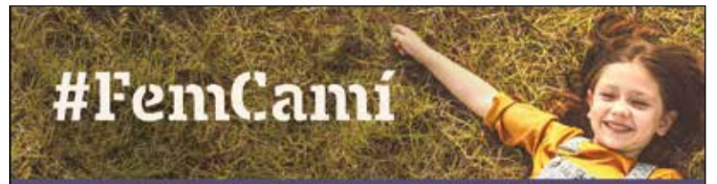
Contingut patrocinat per Ametller Origen

Pel que fa als paradistes, la fira ha tancat l'edició d'enguany amb 150 expositors, dels quals un 29% eren nous. Això vol dir que un terç dels expositors han apostat per ser en un esdeveniment que, segons l'estudi d'impacte econòmic del 2022, ofereix expectatives de retorn econòmic. En concret, per cada euro invertit genera un retorn de la inversió de més de 18 euros. Dels paradistes que han repetit, un 58% són negocis locals.