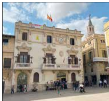
✱ LA FURA

La Diputació de Barcelona ha aprovat la distribució d'un nou fons extraordinari destinat als ajuntaments de la província, amb l'objectiu que, per una banda, puguin tancar l'any i els seus exercicis pressupostaris sense dèficit i, per l'altra, que puguin començar el 2024 amb la liquiditat necessària. Els consistoris de l'Alt Penedès rebran en total 4,16 milions d'euros, destacant els 569.000 de Vilafranca del Penedès, els 232.000 de Sant Sadurní d'Anoia, i els 207.000 de Gelida. Des de la Diputació han explicat que la distribució dels ajuts s'ha fet "d'acord amb criteris públics, objectius i acotats", com ara el nombre d'habitants, la desocupació o l'extensió territorial del municipi. També s'ha buscat donar una assignació mínima a cada ajuntament.