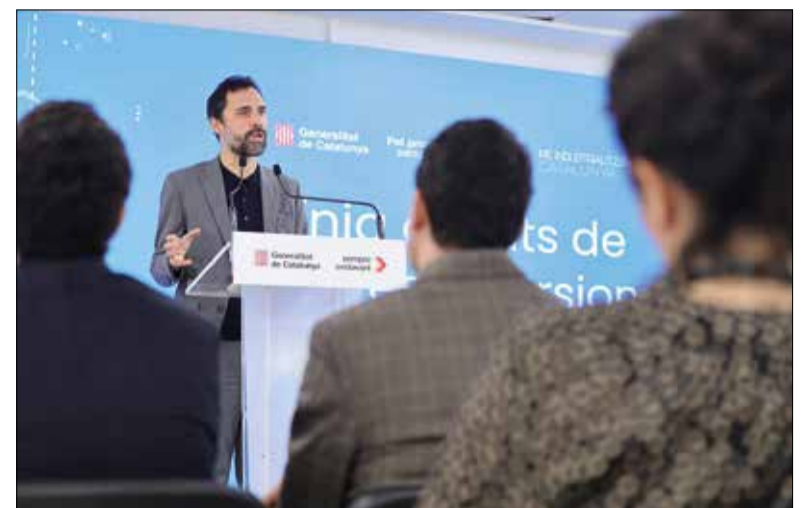
El conseller d'Empresa, Roger Torrent.