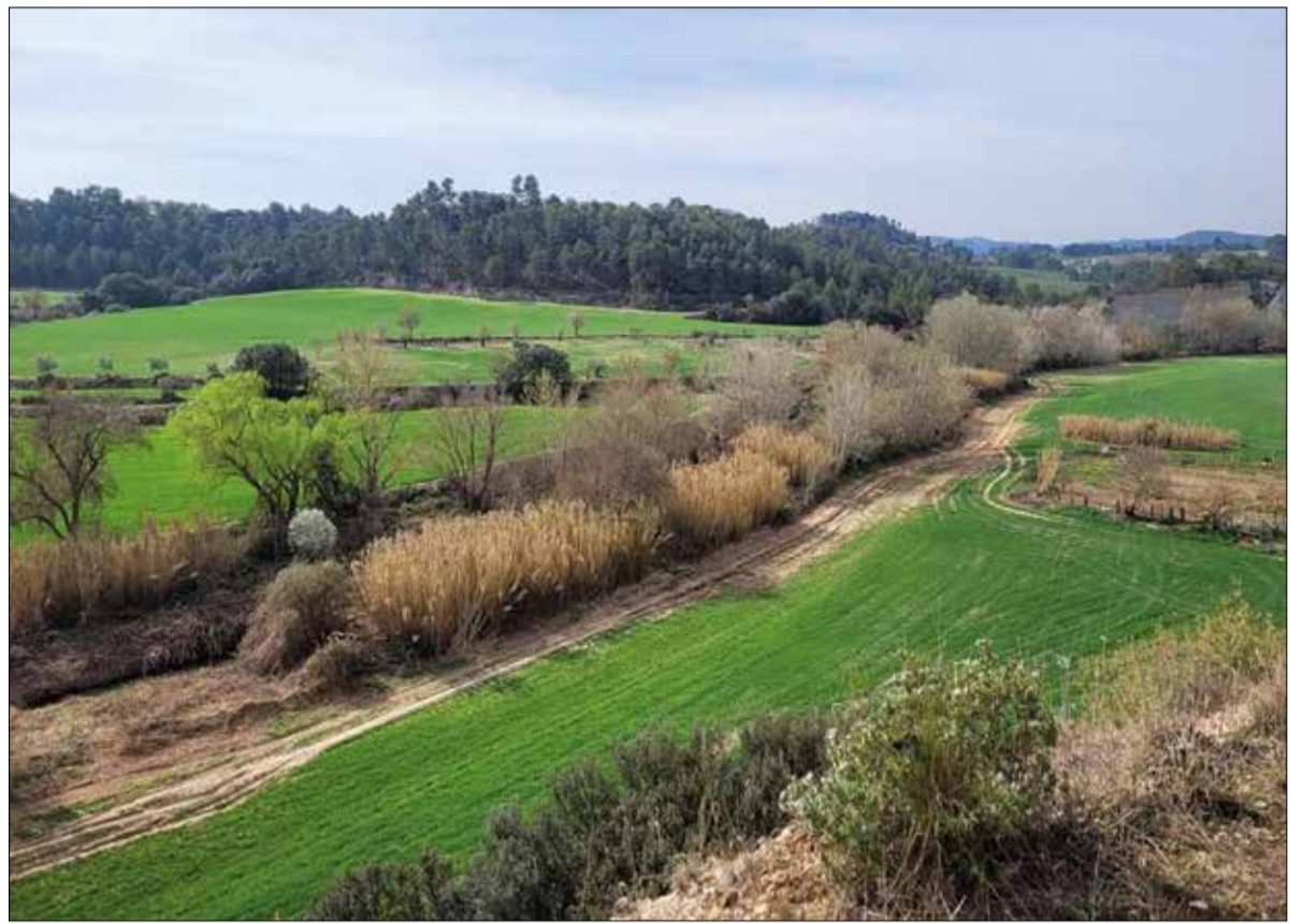
El projecte de les Vies Blaves ja s'ha començat a executar. ✳ DIPUTACIÓ DE BARCELONA