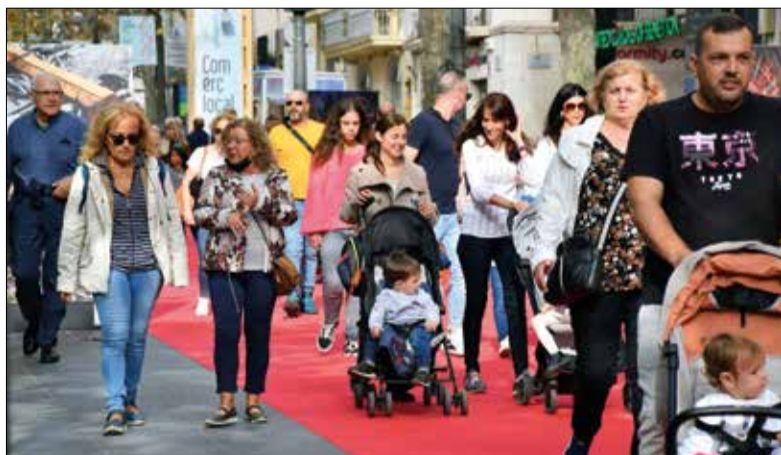
La fira també ha comptat amb 150 expositors. ✦ AJUNTAMENT

Després de tres dies d'activitat frenètica, la ciutat de Vilanova es va acomiadar diumenge de la 32a Fira de Novembre, que ha tornat a batre rècords d'assistència. Se-