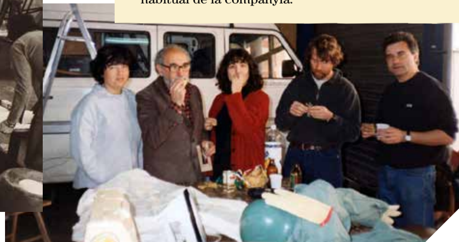
Els membres de l'Estaquirot al seu taller de Vilanova. ✖ L'ESTAQUIROT