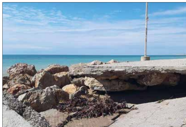
Destrosses a la platja del Francàs. ✱ LA FURA