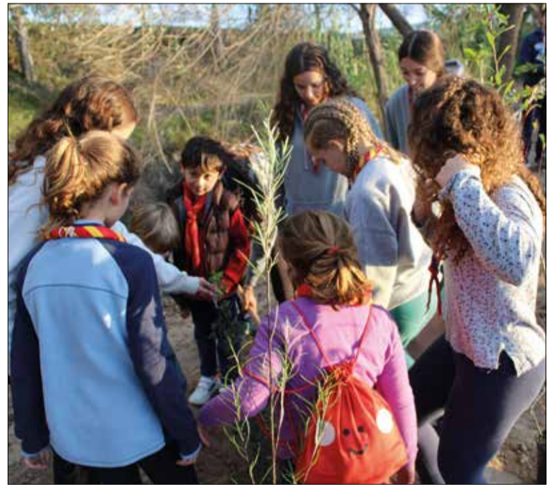
El 60è aniversari va començar amb una plantada d'arbres. ✦ AIG PERE II

L'11 de novembre passat, l'Agrupament Escolta va iniciar la commemoració amb la plantada de 60 arbres. A més del discurs d'inauguració, es van presentar la imatge i l'eslògan del 60è aniversari, a més del cartell d'actes. A la plantada d'arbres, hi van col·laborar actuals i antics membres del cau, membres de Mas Albornà i el suport del personal de l'ADF en recursos i coneixements.