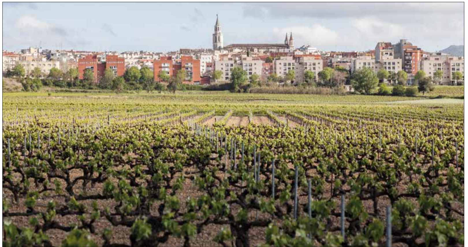
Vista de Vilafranca des de les vinyes.