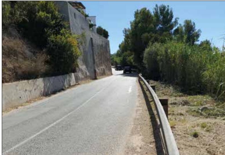
El carril bici anirà de Ribes a Sitges.

El projecte més votat és la construcció d'un carril bici i de vianants entre Can Macià i Vallpineda, amb gairebé 1.800 vots. L'Ajuntament, però, ja contempla la realització d'un itinerari de vianants i un carril bicicleta de Ribes cap a Sitges. Durant aquest any s'ha fet un estudi previ per valorar tècnicament i econòmicament el recorregut més adient per unir els nuclis de Ribes i Vallpineda. En aquest sentit, la dotació econòmica pressupostada en la proposta que s'ha presentat als pressupostos participatius, 40.000 euros, es destinarà a la fase 1, és a dir, a fer la redacció del projecte bàsic-executiu.