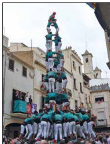
✱ CASTELLERS DE VILAFRANCA