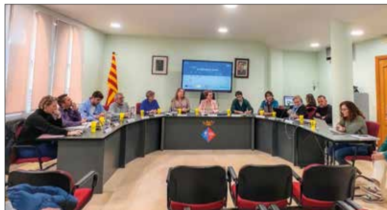
El ple del pressupost de la Bisbal. ✱ AJUNTAMENT

L'Ajuntament de la Bisbal del Penedès ha aprovat el pressupost per a l'any 2024, uns comptes que pu-