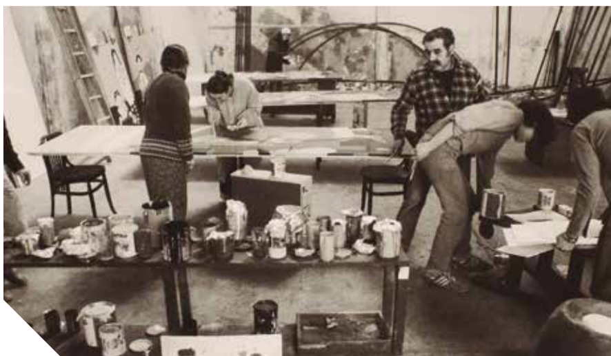
La construcció del Teatret, l'any 1981. ✖ L'ESTAQUIROT

En aquest sentit, poc temps després L'Estaquirot inaugurà, al seu taller de Vilanova, una petita sala amb capacitat per a cent persones, equipada tècnicament i amb unes grades retràctils que es podien plegar quan preparaven els espectacles. A partir d'aquell moment, la companyia decidí fer la campanya escolar al taller, on també s'exposava una mostra sobre la història dels titelles i sobre el procés de creació d'un espectacle. "Això ens ha permès oferir visites guiades als alumnes de les escoles i consolidar els contes de sobretaula", uns espectacles han quedat com a repertori habitual de la companyia.