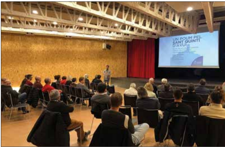
Sessió informativa sobre el nou POUM.

Sant Quintí de Mediona ha començat un procés de participació ciutadana per recollir propostes que ajudin a definir com ha de ser el nou Pla d'Ordenació Urbanística Municipal (POUM). L'Ajuntament ha fet una primera sessió informativa oberta a la ciutadania, que continuarà amb dos tallers participatius que tindran lloc els dies 23 i 30 de novembre, a les 18.30 hores, a la Sala Polivalent El Jardí. Per assistir cal fer inscripció prèvia.