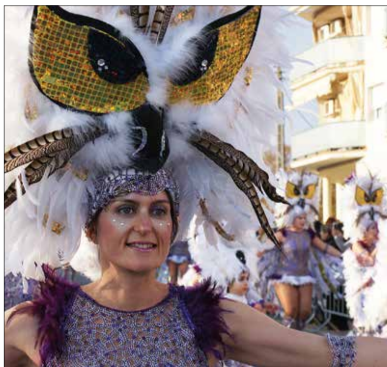
Imatge d'arxiu del Carnaval de Calafell.

Per la seva banda, la rua de Segur es farà el dissabte al migdia, amb la intenció d'atreure el públic familiar i fer que els participants es quedin a dinar al nucli un cop acabada. Des del Consistori creuen que això facilitarà que els grups vagin després a les rues de Cunit