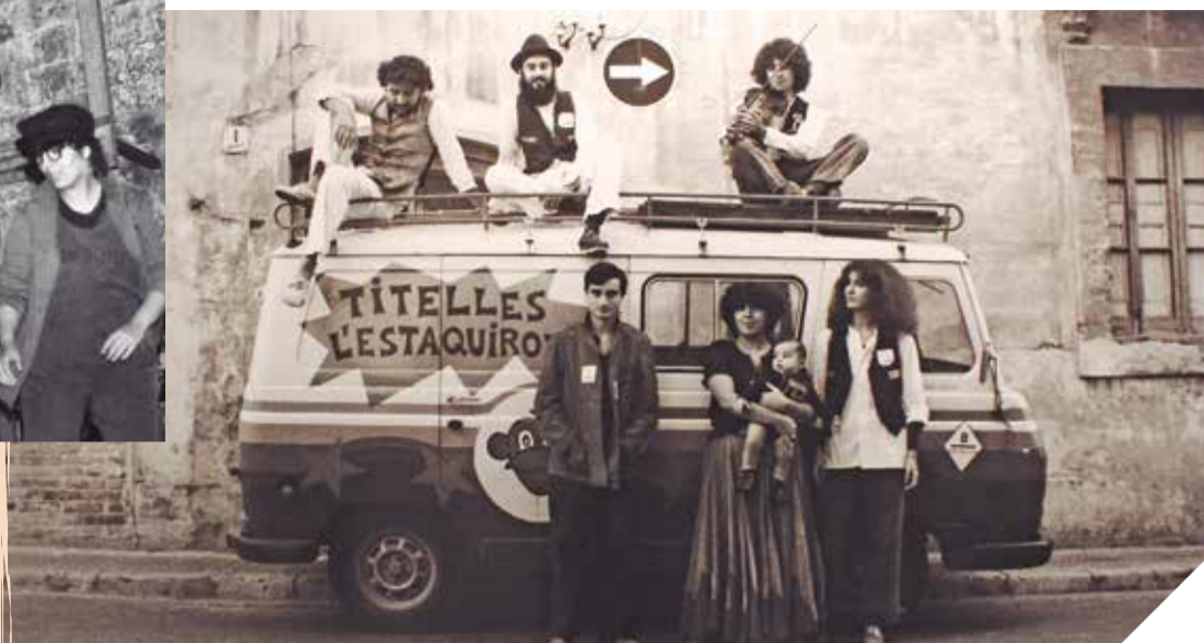
Entre el 1977 i el 1980 van fer espectacles inspirats en els antics còmics ambulants.