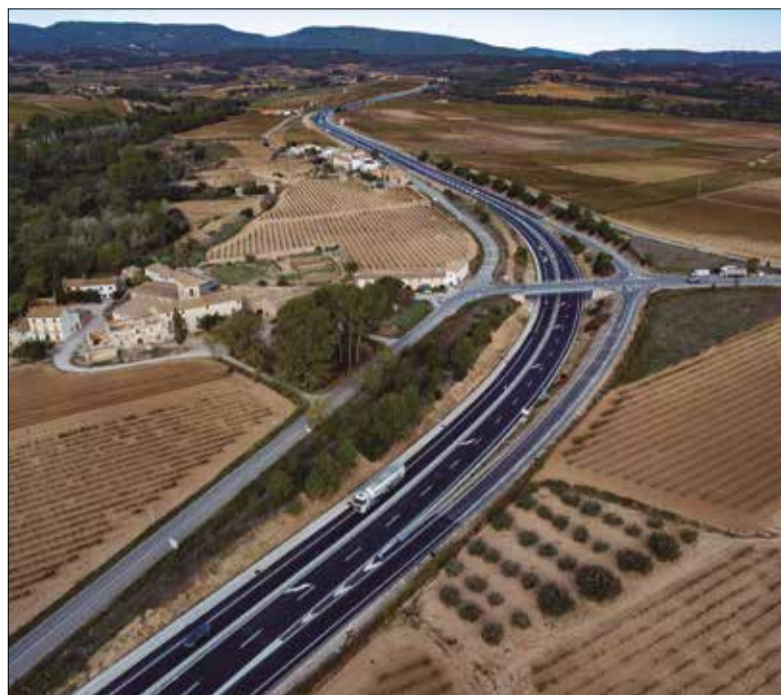
Són 16 quilòmetres més en sistema 2+1. ✱ GENERALITAT