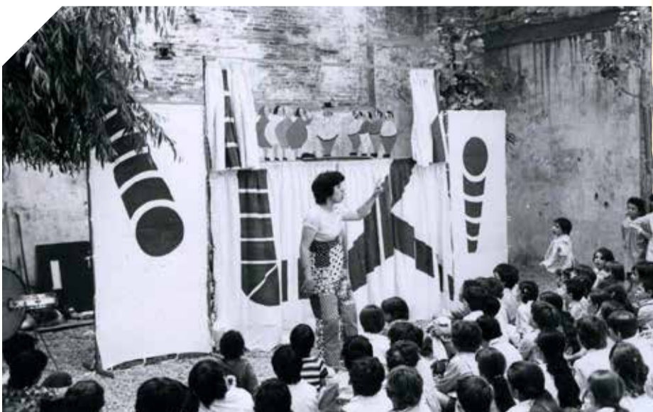
Primera funció escolar a l'escola Llebetx el 1974. ✳ L'ESTAQUIROT

Sense gairebé adonar-se'n, el teatre de titelles s'havia convertit en la seva feina.