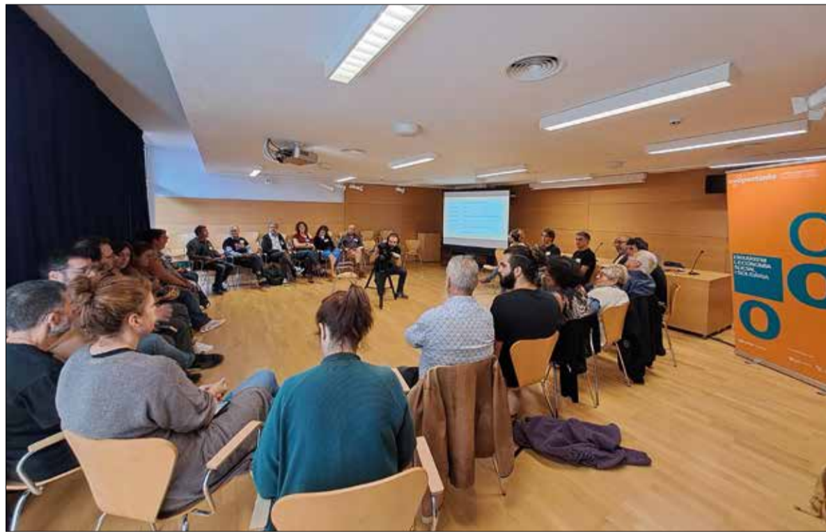
Imatge d'arxiu de la Taula Territorial de Cultura convocada per Coopsetània al Vendrell. * COOPSETÀNIA

EL 2023 l'Ateneu Cooperatiu Garraf va dur a terme 533 actuacions en les quals van participar-hi 1.600 persones