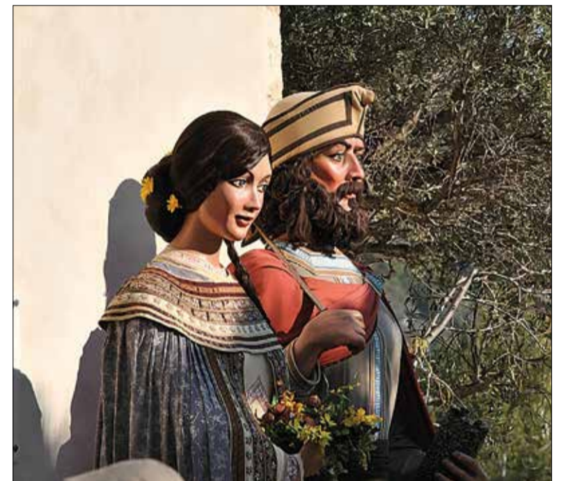
Els Gegants Nous fan 25 anys. ✳ AJUNTAMENT

Els Gegants Nous, que fan 25 anys, estrenen nova imatge i vestuari