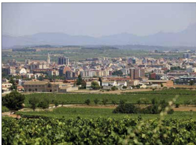
El preu mitjà del lloguer a Vilafranca és de 850 euros.

En una atenció als mitjans, els grups d'Esquerra Republicana a Vilafranca i Sant Sadurní han titllat la mesura "d'estratègica", tenint en compte que les dues poblacions estan "es-