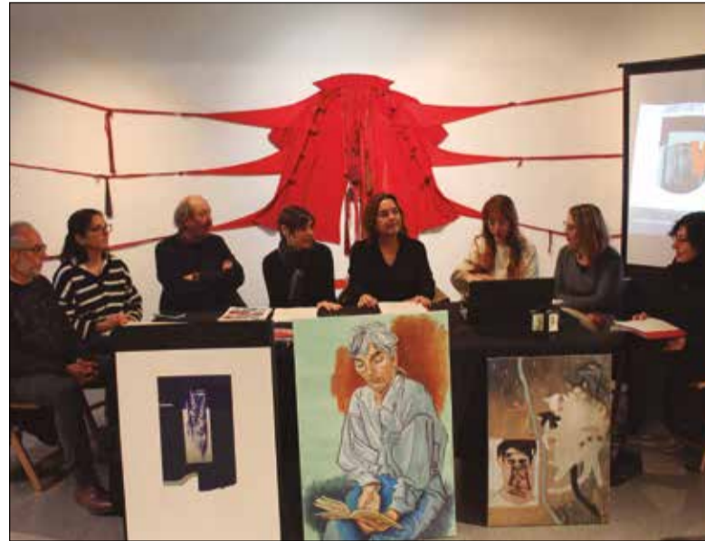
La programació comença el 26 de gener. * LA FURA

Un total de 17 propostes expositives protagonitzaran el programa d'Arts Visuals que impulsa l'Ajuntament de Vilafranca, des d'ara i fins al juliol. Les propostes estaran repartides entre la Capella de Sant Joan, la Sala Trinitaris, el Claustre de Sant Francesc i l'Escorxador.