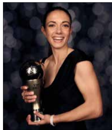
✖ FIFA FOOTBALL AWARDS

Aitana Bonmatí s'ha endut el premi The Best de la FIFA a millor jugadora del 2023, imposant-se a la colombiana Linda Caicedo, segona, i a Jennifer Hermoso, que ha tornat a quedar tercera. La migcampista del Barça suma, així, un nou reconeixement, després de guanyar la Pilota d'Or i convertir-se en la jugadora de l'any de la UEFA. “El 2023 ha estat un any excepcional que recordaré tota la vida. Començar el 2024 aixecant aquest premi és un orgull, però ho dec als equips dels quals he format part”, ha dit Bonmatí des de l'auditori Eventim Apollo de Londres. Per acabar, la jugadora de Sant Pere de Ribes ha celebrat formar part d'una generació de jugadores que estan canviant les normes del futbol.