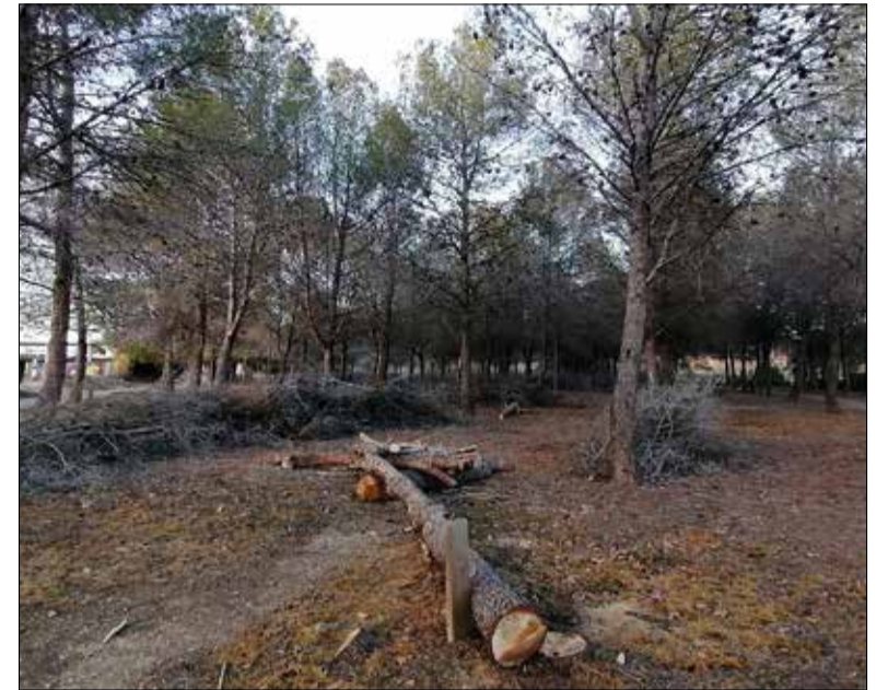
Els arbres estaven secs o en mal estat, segons l'Ajuntament. * AJUNTAMENT