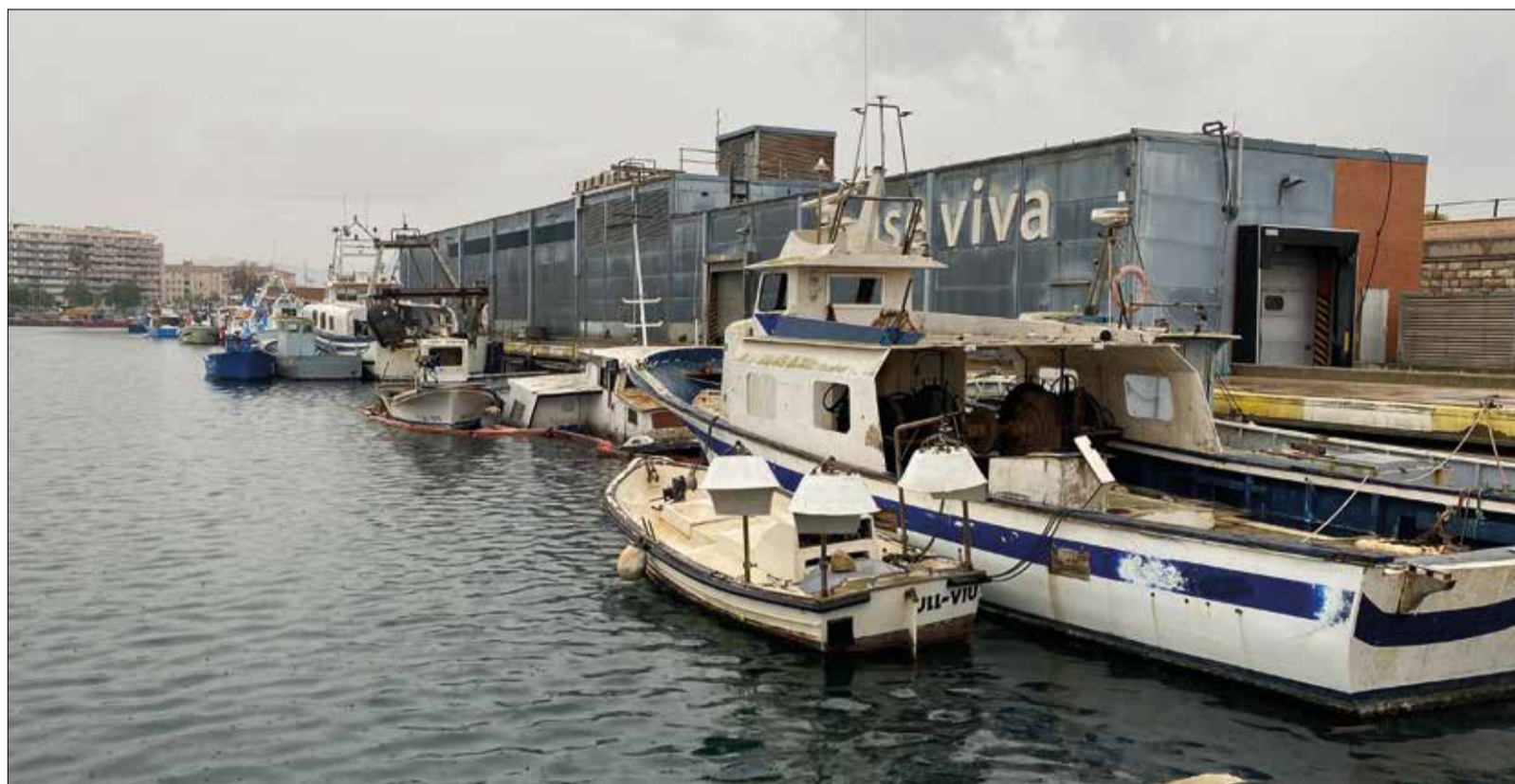
Algunes de les embarcacions abandonades al port. ✖ LA FURA