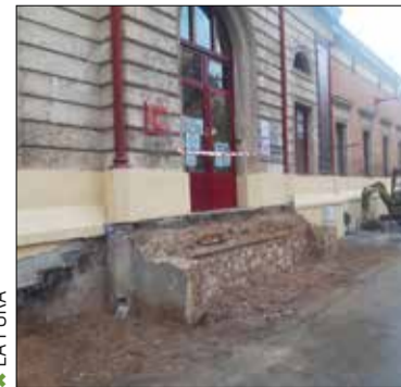
✱ LA FURA

Per fer els treballs s'ha tallat un carril de l'avinguda de Jaume Carner, i només circula el trànsit en direcció a Barcelona. També s'ha eliminat la parada de l'estació de busos en direcció a Tarragona i ara cal anar a la parada de la car-