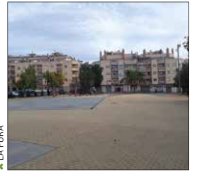
✱ LA FURA