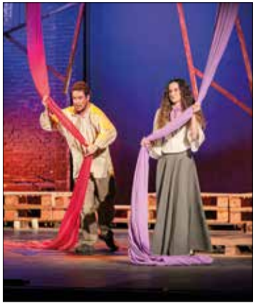
* CASAL DE VILAFRANCA