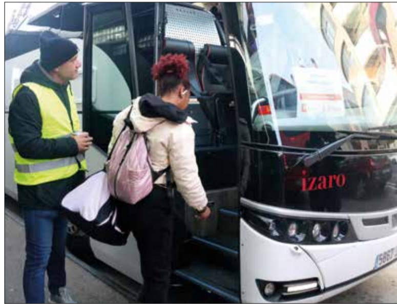
S'ha establert un servei de bus alternatiu.

Des de Renfe argumenten que no es va avisar amb més antelació perquè era període de vacances de Nadal i creien que la informació hauria quedat dispersa. Per això van decidir informar "a partir de