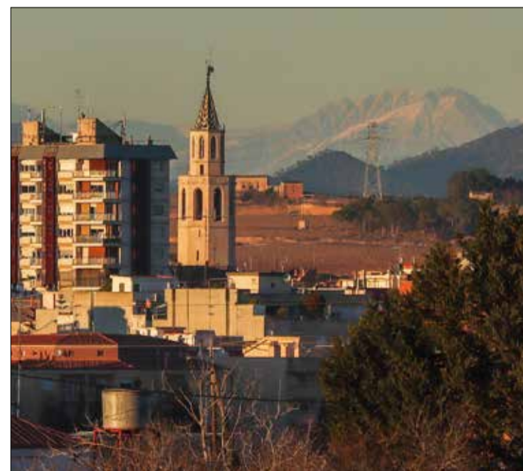
Vilafranca i el Pedraforca Olèrdola - 2024