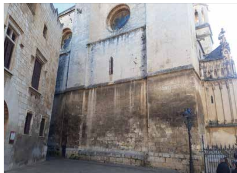
La restauració de la façana nord començarà aquest 2024. ✱ LA FURA