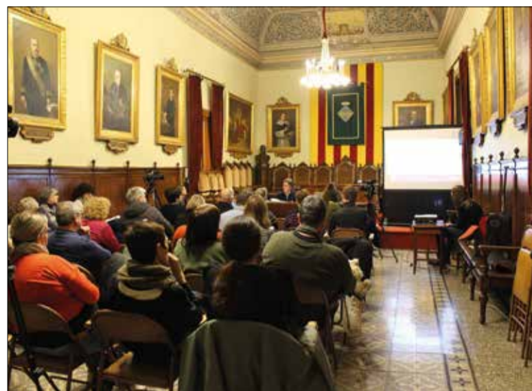
Els comptes ascendeixen a 67,6 milions d'euros. ✦ LA FURA

Pel que fa a les inversions, les més destacables són la rehabilitació de la Nau Cortina per acollir la segona biblioteca; la millora de carrers i, especialment, la rehabilitació integral dels carrers Sant Pere i Santa Magdalena; la instal·lació de plaques fotovoltaïques a teulades municipals; la renovació de la gespa del camp de futbol i els nous vestidors del pavelló d'hoquei; o els estudis per conservar l'edifici i determinar els usos de l'Antic Hospital, el Mercat de la Carn i l'antiga caserna de la Guàrdia Civil.