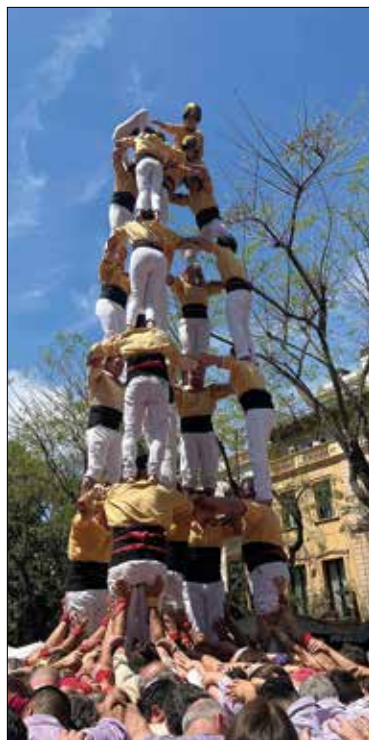
5de7 dels Bordegassos.

Bordegassos de Vilanova: 5/7, 4/7, 3/7 Minyons de Terrassa: 2/7, 3/8, 4/8 Castellers de Cornellà: 5/7, 3/7a, 4/7 Colla Jove de Sitges: 5/7, 4/7a, 4/7