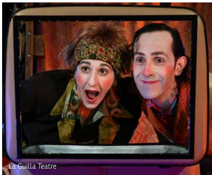
La Guilla Teatre