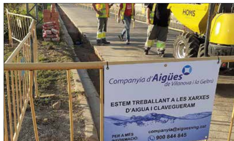
Treballs de la Companyia d'Aigües de Vilanova ✦ AJUNTAMENT