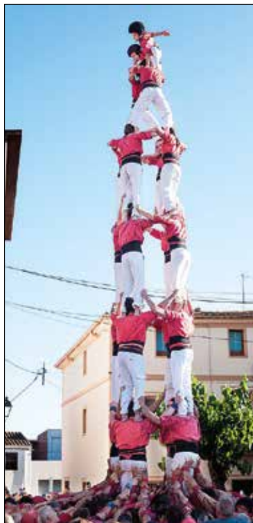
4de8 dels Nens.

Els vilanovins van començar la seva actuació descarregant el 5 de 7. En segona ronda van fer un 4 de 7 amb agulla i en tercera ronda van apostar pel 3 de 7. Per finalitzar, els Bordegassos van fer un pilar de 5 i dos pilars de 4. La pròxima actuació dels de la camisa groga serà el 2 de juny a Vilafranca.