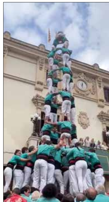
El 4de9 amb folre dels Castellers i el 7de7 dels Xicots.

Castellers de Vilafranca: 4/9f, 3/9f, 5/8 Xicots de Vilafranca: 7/7, 5/7, 4/7a