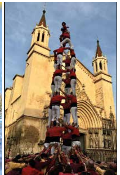
El nedador Toni Ponce i els Xicots, Medalla de la Vila 2024.