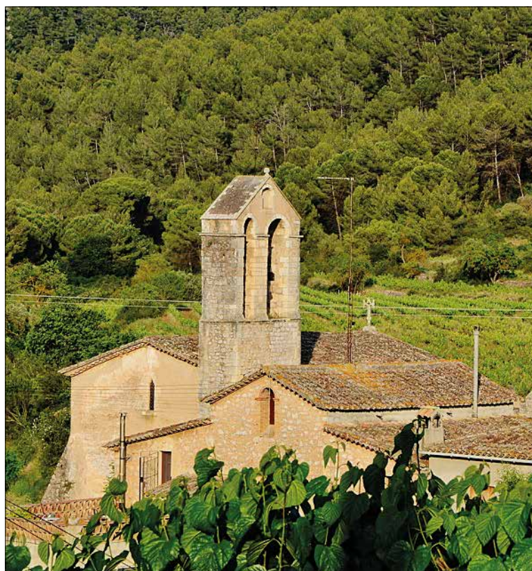
L'antic hospital dels Cervelló. ✱ MARIA ROSA FERRÉ

El preu dels tiquets, que es podran adquirir al punt d'informació ubicat a la mateixa fira, és de 4 euros per a un tiquet de vi i un de gastronomia i de 6 euros amb copa.