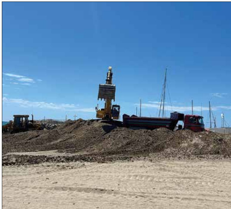
Una màquina dragant sorra del Port de Coma-ruga.

De cara als pròxims anys, està previst que aquesta gestió de la sorra ja la facin els mateixos municipis. En aquest sentit, l'Ajuntament del Vendrell licitarà aviat un nou servei de gestió de la platja