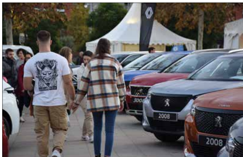
La Fira VO exposarà més de 300 vehicles.

La Fira del Vehicle d'Ocasió de Vilanova i la Geltrú, que se celebrarà els dies 1 i 2 de juny, canvia la seva ubicació. Després de cinc anys celebrant-se a la plaça del Port, enguany la fira es trasllada a la rambla de la Pau, cantonada amb el parc de Baix-a-mar. És el mateix lloc que ocupa l'automoció a les darreres edicions de la Fira de Novembre. En aquest nou emplaçament, la Fira VO oferirà un total de 6.500 metres quadrats d'exposició amb més de 300 vehicles de totes les marques.