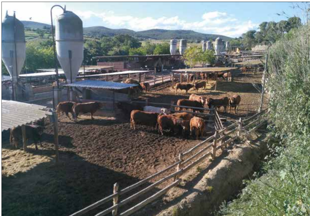
El judici se celebrarà a l'Audiència de Barcelona el 24, 25 i 26 de novembre. ✱ LA FURA