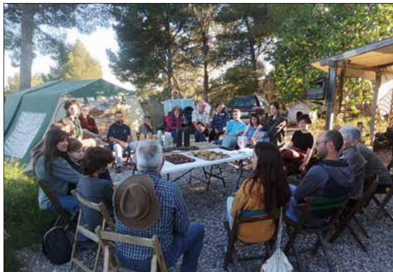
Les llavors es van repartir en una reunió a la Caseta de Font-rubí.

Fa dues setmanes tècnics de Consell Comarcal de l'Alt Penedès i membres d'Eixarcolant van reunir-se amb unes vint persones que treballen en els diferents horts col·laboradors (situats a Guardiola de Font-rubí, Sant Quintí de Mediona, Sant Joan de Mediona, Sant Llorenç d'Hortons, Olivella, Llorenç del Penedès i Vilafranca, entre altres). En aquesta trobada es van