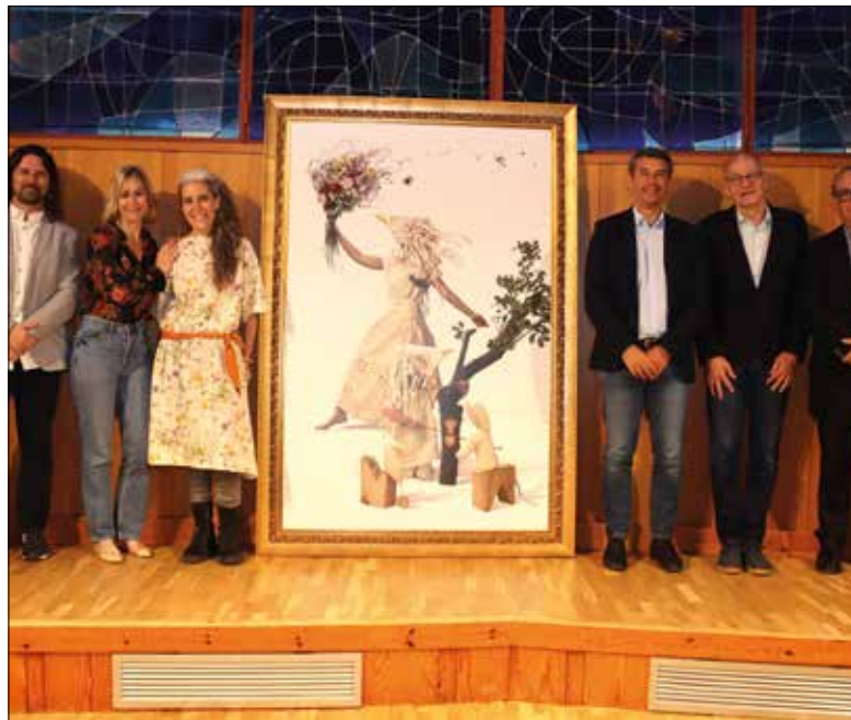
Presentació del 43è Festival Pau Casals.