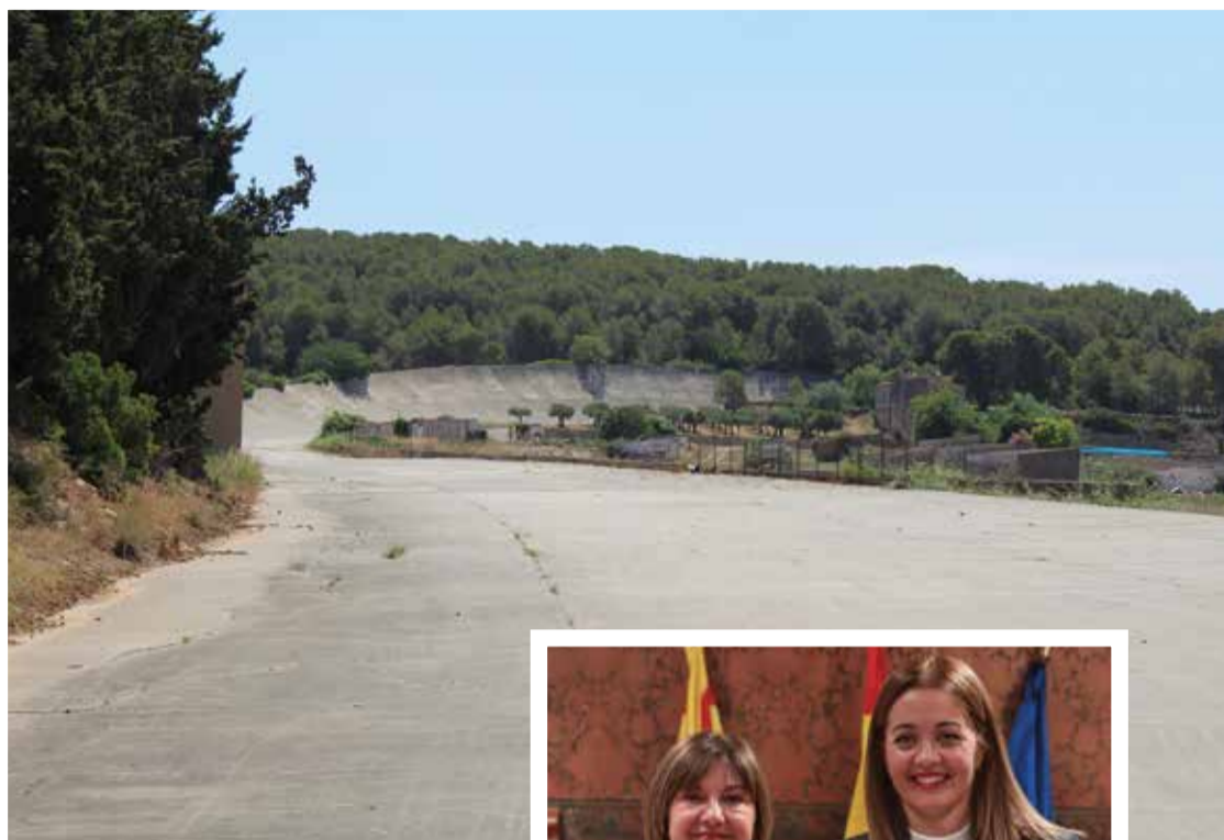
Autòdrom de Terramar. ✦ LA FURA