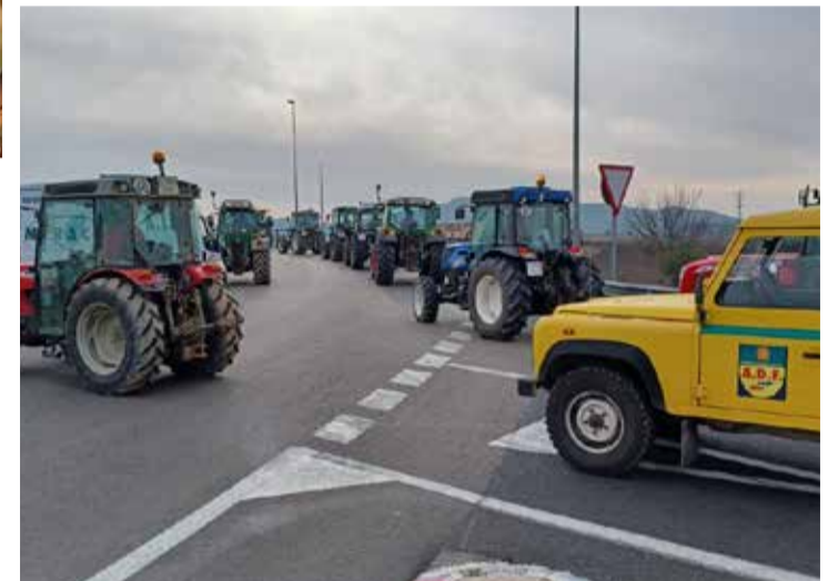
Marxa lenta dels pagesos. ✖ ADF

Paral·lelament, el sector de la pagesia es va organitzar per fer realitat el projecte d'impulsar una gran Comunitat de Regants al territori, que permetés implantar el reg de suport als cultius llenyosos del Penedès. Després de diverses reunions amb les administra-