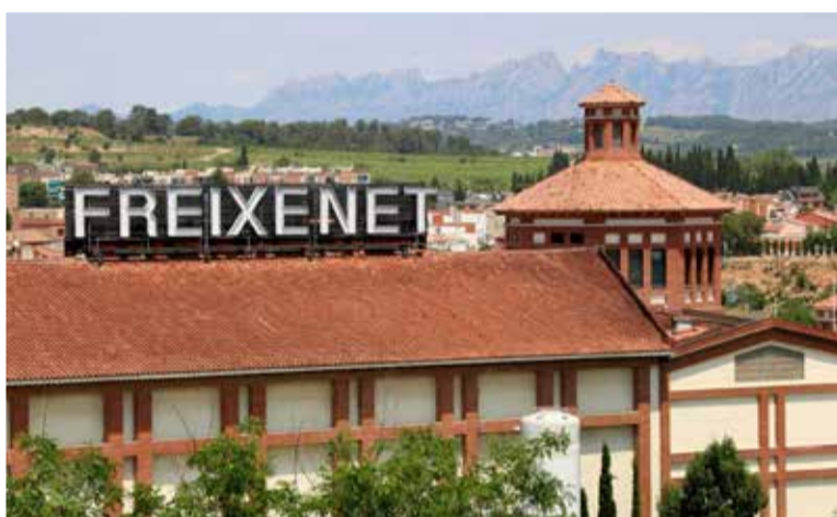
Freixenet ha presentat un ERTO que afecta més de 600 persones.