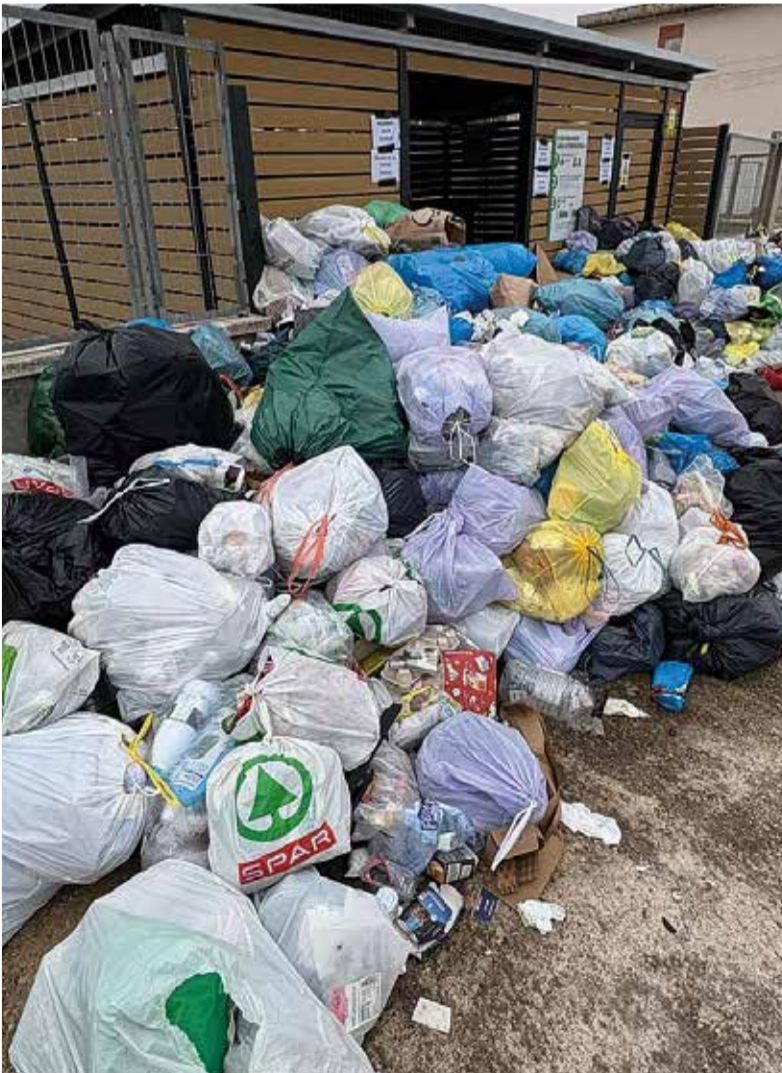
Brossa acumulada a l'àrea de Llorenç.