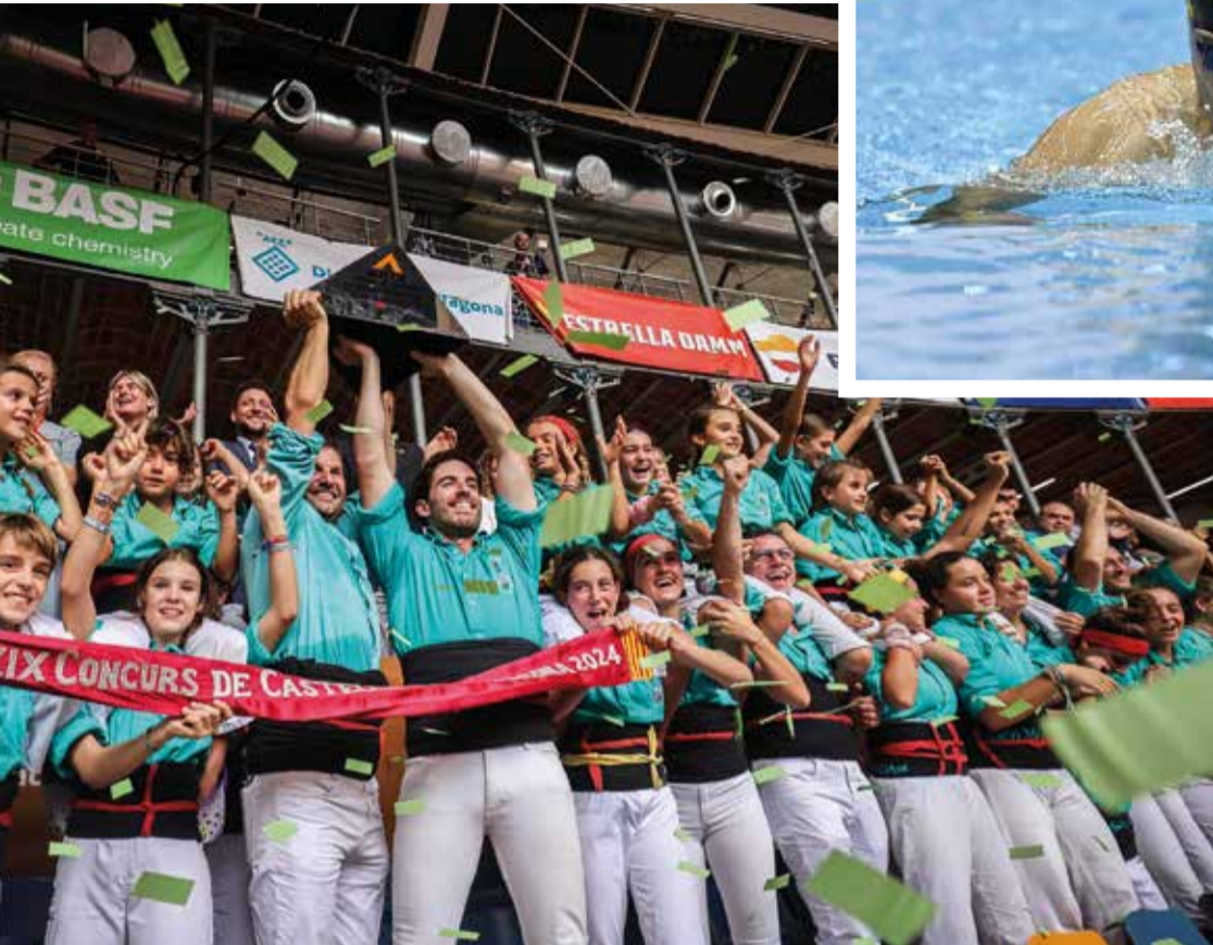
Els Castellers de Vilafranca han guanyat la 29a edició del Concurs de Castells de Tarragona