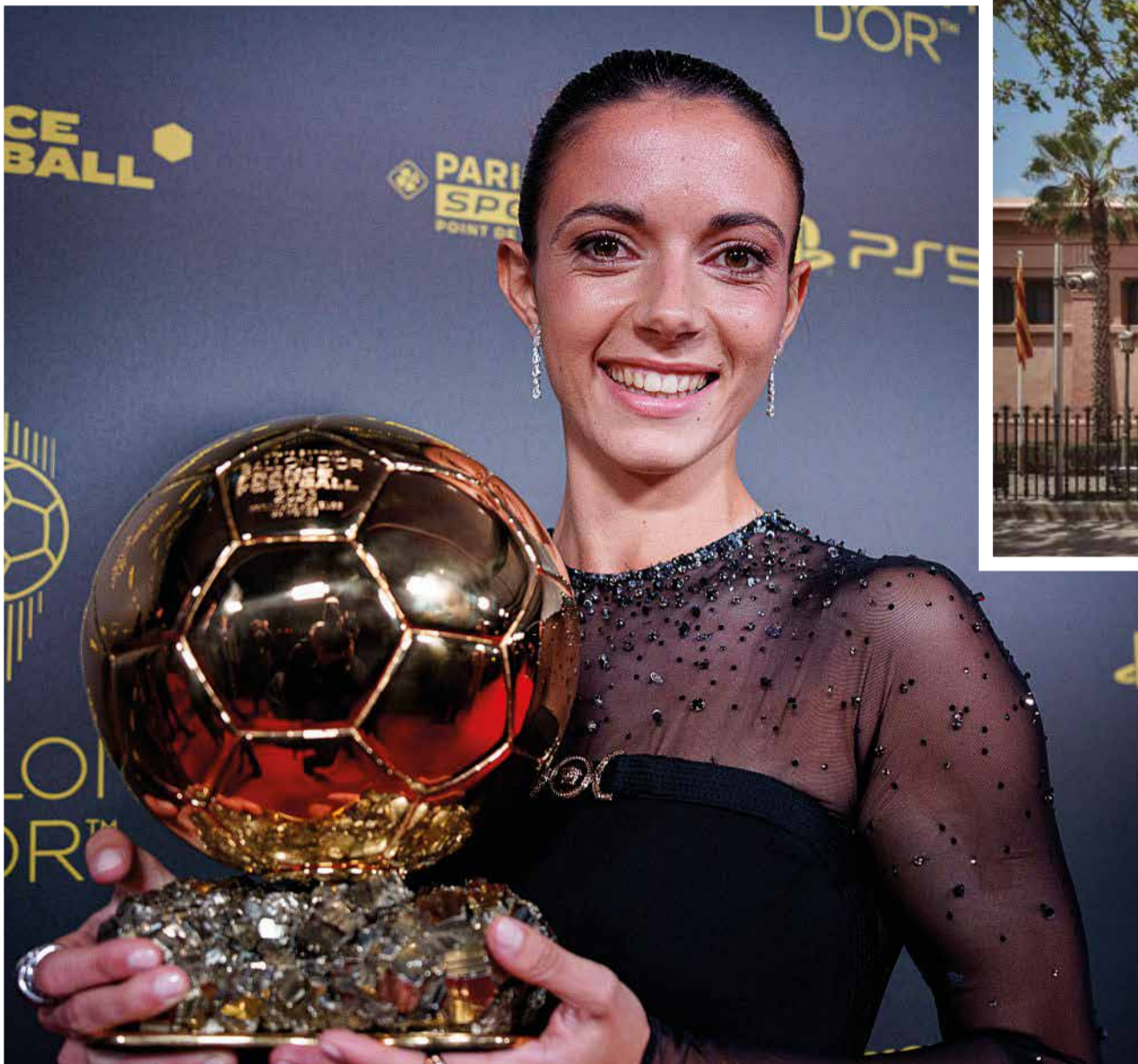
Aitana Bonmatí amb la seva segona Pilota d'Or.