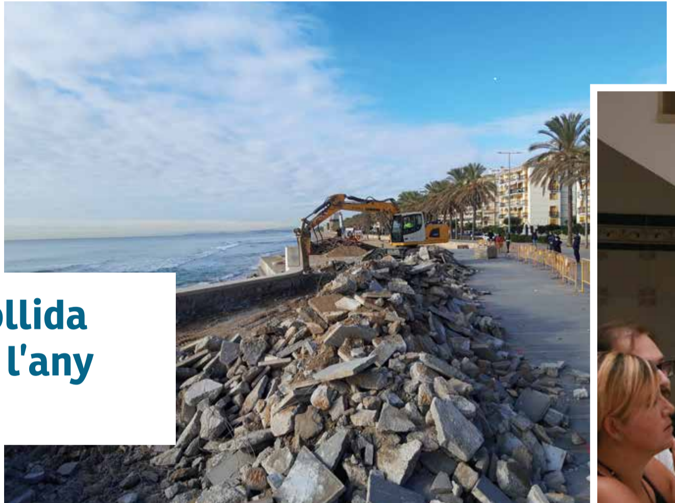
Demolició de la plaça del Mil·lenari de Calafell

Cunit ha entomat enguany el repte de desplegar sistemes més eficients de recollida de residus, impulsant la recollida porta a porta el mes de març i els contenidors intel·ligents abans de l'estiu. La transició, però, no ha estat plàcida, ja