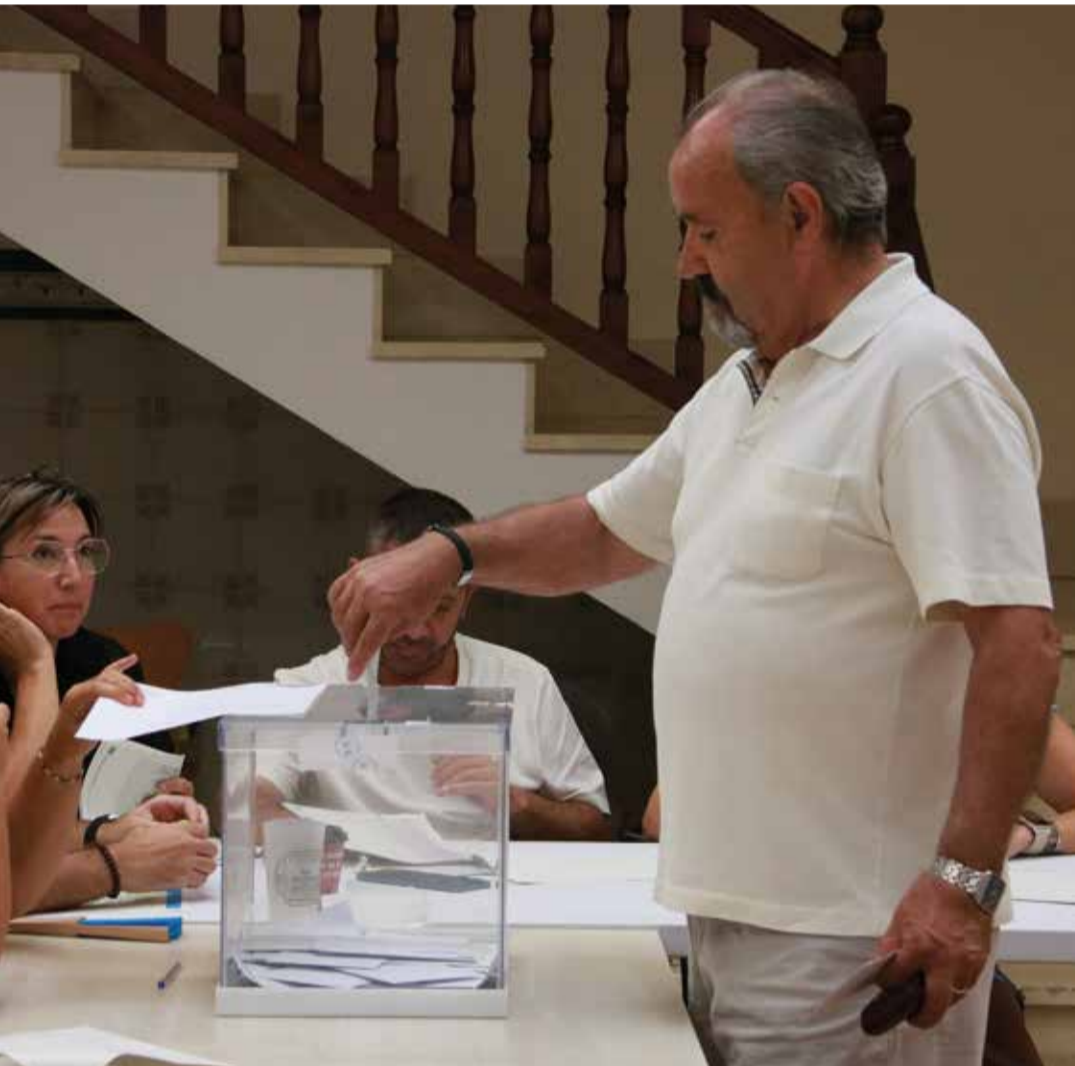
La consulta popular sobre les Planes del Vent es va fer a l'agost ✦ ACN