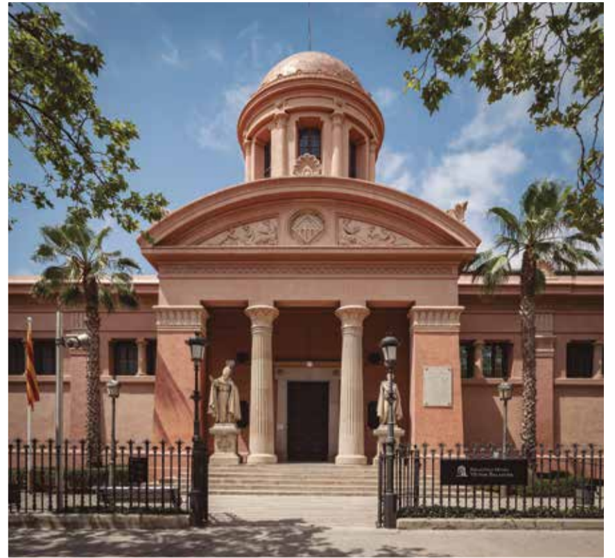
El Museu Víctor Balaguer.