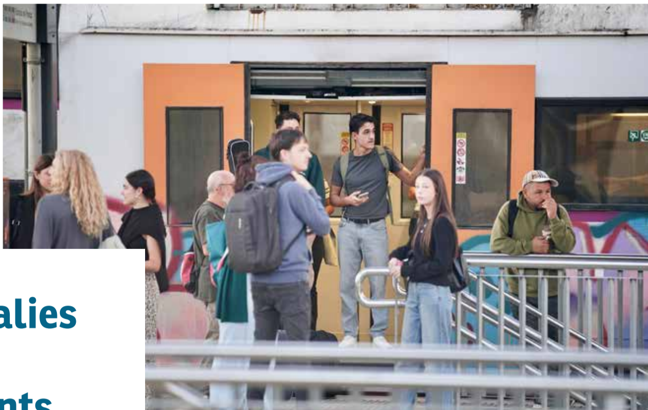
Els problemes de funcionament de les línies de Rodalies continuen. ✦ ACN

La implementació del topall dels preus dels lloguers als municipis considerats zones tenses, la gratuïtat de la C-32 entre el Vendrell i Sitges, els recels que provoca la nova MAT, o l'arribada de la banca mòbil a diferents municipis han estat algunes de les notícies destacades del 2024 al conjunt de la vegueria. Les cinc que considerem més importants han estat, però, les següents.