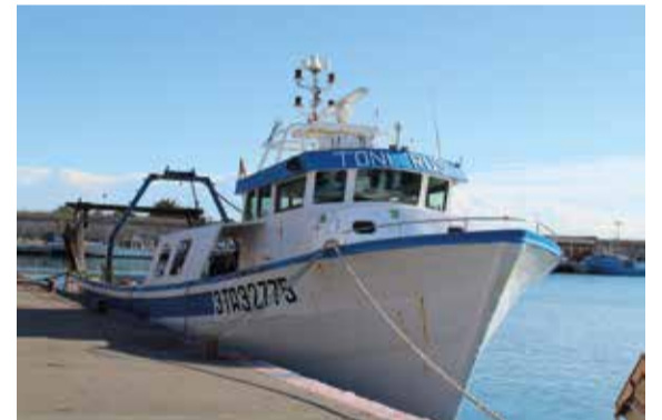
Els pescadors, al límit. ✦ LA FURA