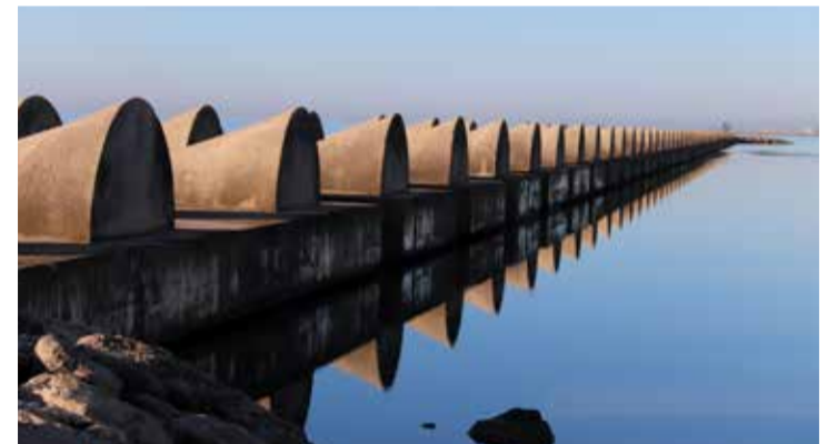
S'ha resolt el futur de la dàrsena del port de la tèrmica.