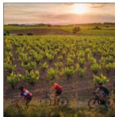
✳ PENEDÈS TURISME