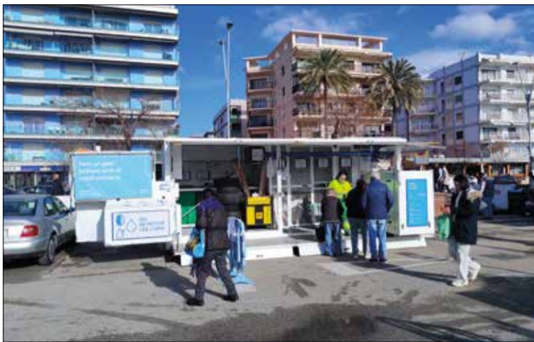
La deixalleria mòbil de Calafell.