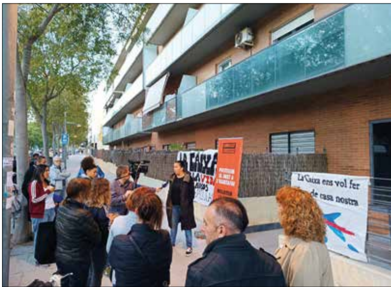
El bloc de pisos afectat està ubicat a la rambla Sant Jordi. ✦ CEDIDA