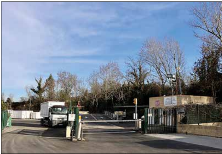
Imatge d'arxiu de la deixalleria municipal.