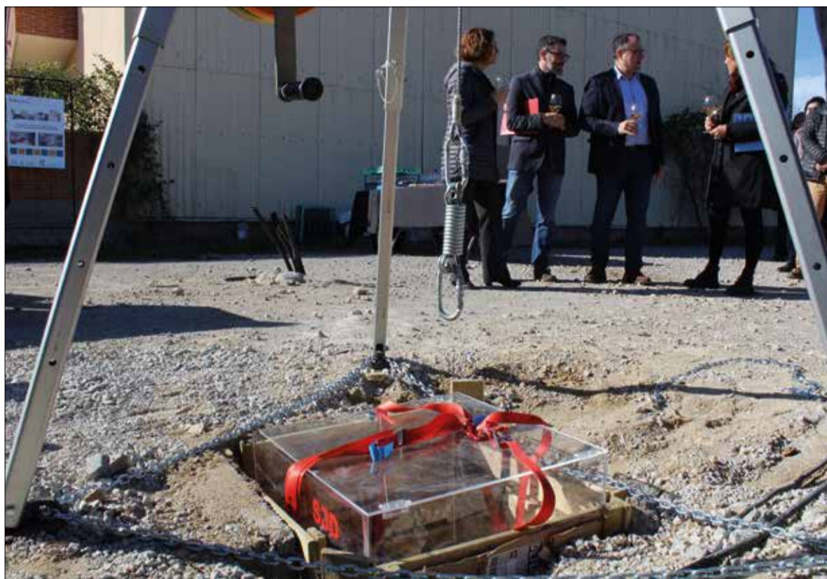
Acte de col·locació de la primera pedra del nou centre de salut mental del Garraf. ✖ LA FURA