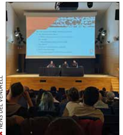
✖ NENS DEL VENDRELL

La Nit dels Castells, impulsada per la Revista Castells , ha reunit unes 400 persones, en representació de 78 colles i altres agents vinculats al món castelleres.