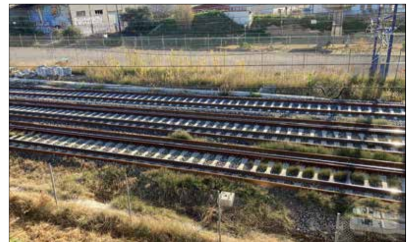
Les vies d'ample ibèric s'hauran de renovar. ✳ LA FURA

Quan es va posar el tercer carril, també es van canviar les travesses, però després es van tornar a posar a sobre les mateixes vies d'ample ibèric. Ara, quan els operaris d'Adif han volgut instal·lar el comptador d'eixos, han detectat que aquestes vies presenten un desgast important, amb la qual