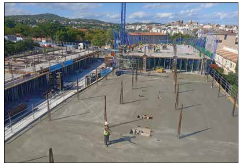
Els blocs s'estan fent en uns terrenys entre el poble i la platja.

El préstec s'ha atorgat a través d'ICF Habitatge Social Promoció, amb condicions avantatjoses com ara una bonificació del tipus d'interès per part de l'Agència de l'Habitatge de Catalunya. La promoció s'està construint en uns terrenys de titularitat municipal, situats entre els carrers Priorat i Jaume