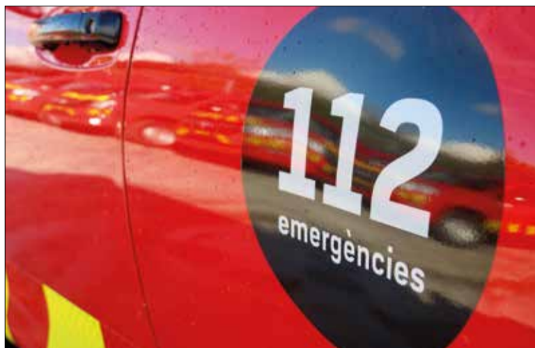
L'accident va tenir lloc a Sant Quintí de Mediona. ✳ ACN

L'Ajuntament de Santa Margarida i els Monjos va decretar dos dies de dol oficial com a mostra de su-