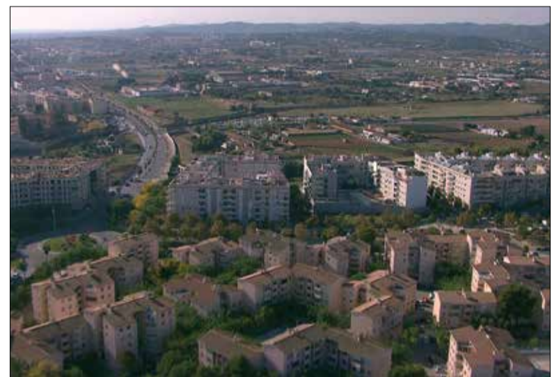
Imatge d'arxiu de l'Eixample Nord des de l'aire.

L'actualització d'aquest conveni es va aprovar al darrer ple municipal amb els vots favorables de tots els grups, l'abstenció de Transformem VNG i el vot en contra de la CUP. El seu portaveu, Josep Manel Ametllé, s'ha mostrat en contra d'aquest conveni perquè es tracta d'una operació urbanística que ha "hipotecat" la ciutat: "Aquesta maniobra, que inicialment va evitar l'edificació de Platja Llarga, ha deixat ara una factura de 60 milions d'euros per a l'Ajuntament". De fet, la CUP posa en dubte que aquesta sigui l'única manera d'assegurar la protecció de Platja Llarga, i recorda que durant la tramitació del Pla Director Urbanístic de sòls no sostenibles, la Generalitat va decidir desclassificar