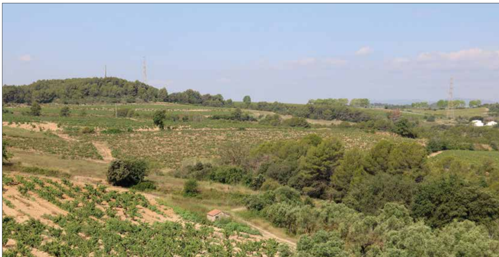
Terrenys on Ametller Origen té previst desenvolupar el projecte Agroparc Penedès.