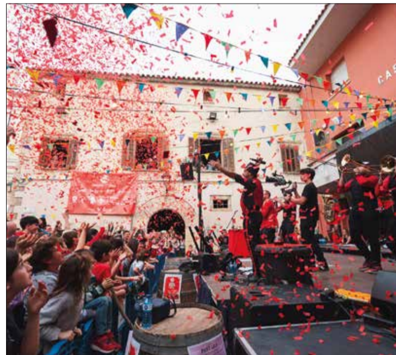
La Sidral Brass Band és la impulsora del festival. ✱ SIDRAL FEST

A banda dels espectacles, el Sidral Fest ofereix diverses activitats al llarg del dia: tallers de circ, pintacares, un mercat d'artesans, un espai de gastronomia... El festival es concentra a les places del casc antic del poble. Així, i com a novetat, enguany se n'hi suma una més, la de l'Onze de Setembre, que