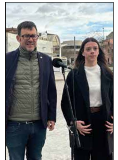
Casañas i Ortiz. ✳ LA FURA

Actualment, el Penedès està dividit en quatre zones, la qual cosa, segons denuncia Junts, dificulta la mobilitat i encareix el preu que paguen per quilòmetre els usuaris de transport públic de la vegueria respecte als d'altres zones del país. En aquesta reclamació per aconseguir l'ATM Penedès, Junts espera comptar amb el suport de la resta de partits polítics, dels sindicats i del teixit empresarial: "No és un interès partidista, sinó que és una iniciativa per millorar la qualitat del transport públic i, per tant, la qualitat de vida dels i les penedesenques".