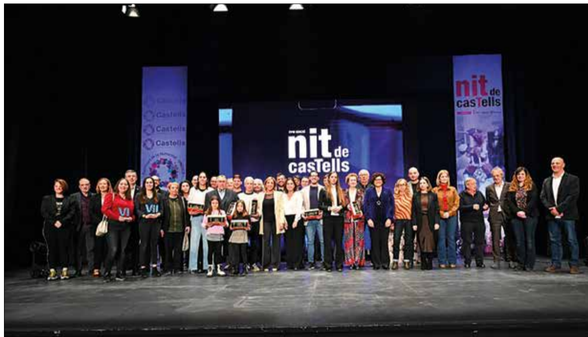
Tots els premiats de la 18a Nit de Castells. ✖ REVISTA CASTELLS

Els Castellers de Vilafranca i els Castellers del Foix de Cubelles han estat les dues colles castelleres penedesenques premiades a la divuitena edició de la Nit de Castells, celebrada a Valls el dissabte passat. Els verds han rebut el premi a colla amb millor temporada, mentre que als del Garraf se'ls ha reconegut per ser la colla més completa de castells de 6. En la mateixa gala, la Bisbal del Penedès ha rebut el premi a La Plaça de la temporada.