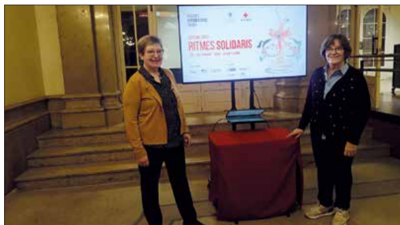
Tindrà lloc el 8 de febrer al Teatre El Casal. ✦ LA FURA