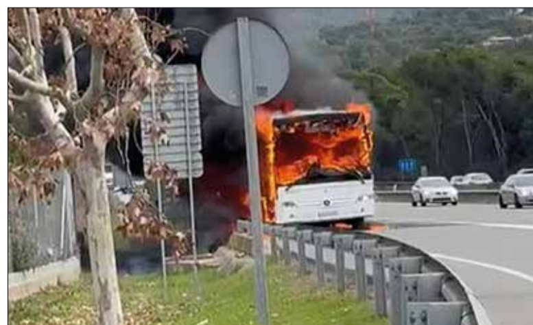
El vehicle portava passatgers, però no hi va haver ferits.