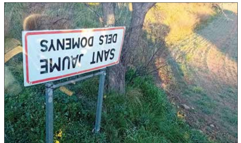
Cartell capgirat a Sant Jaume dels Domenys.