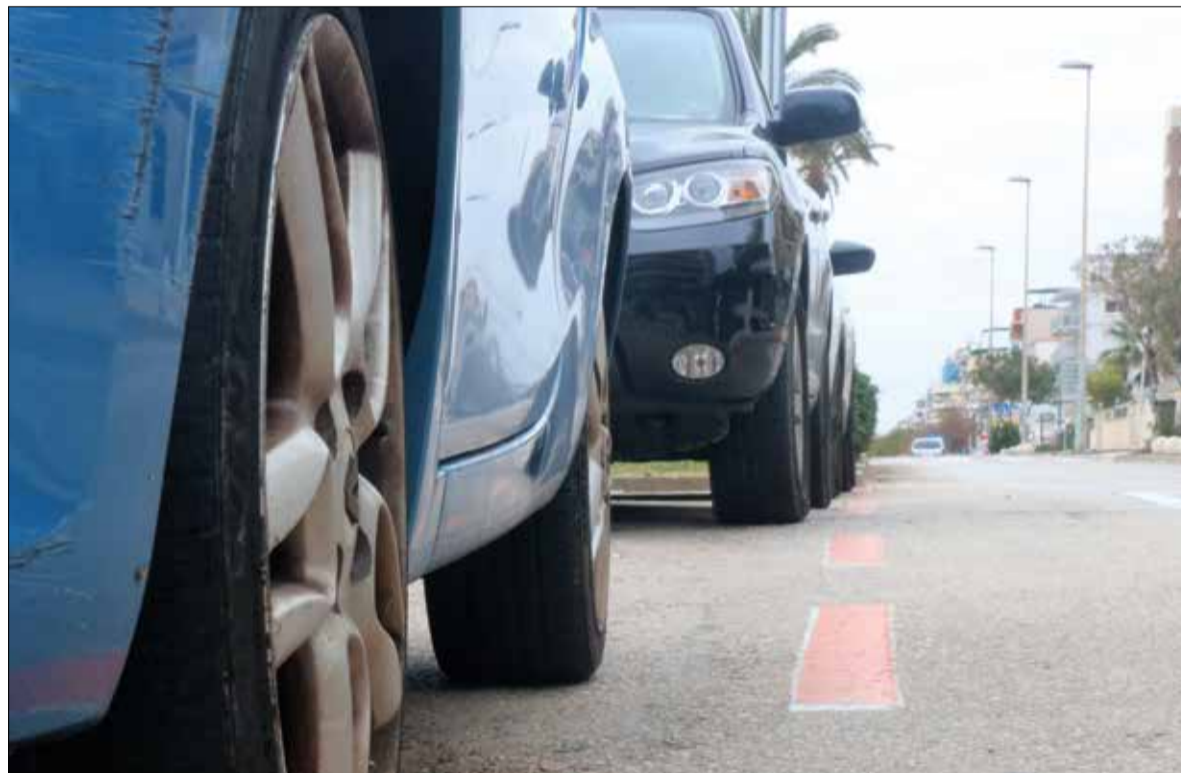
La zona taronja funciona des del 2023.

L'Ajuntament eliminarà el controvertit criteri de l'empadronament quan s'encari la nova concessió