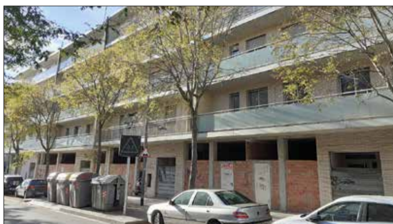
Els pisos han estat buits més de quinze anys. ✦ AJUNTAMENT

La Generalitat va adquirir aquesta promoció de 107 pisos a la rambla Sant Jordi a finals del 2023. L'objectiu era destinar-los a habitatge social, després d'estar més de