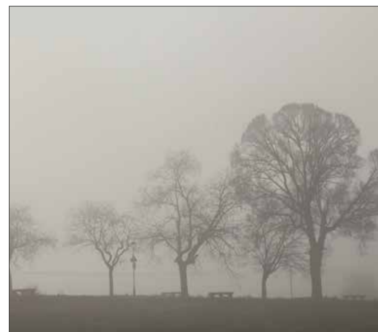
Boira Olèrdola - 2025