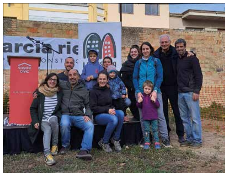
El grup impulsor de la iniciativa La Bastida-Pati del Gall.