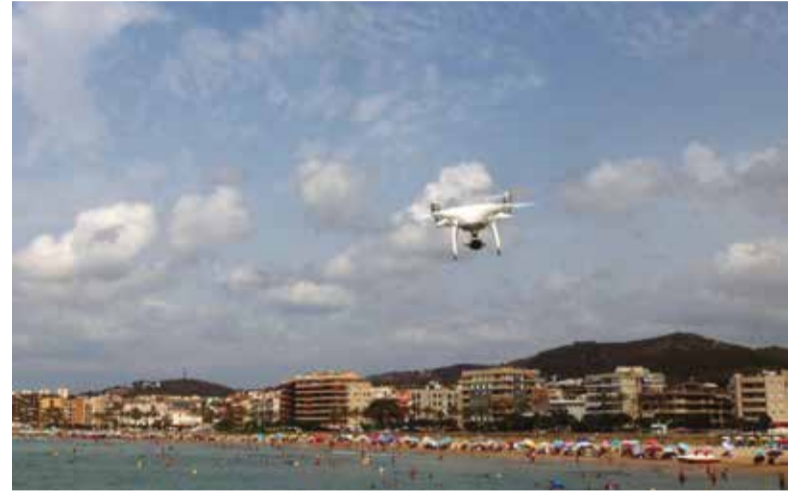
Imatge d'arxiu d'un dron.

L'Ajuntament de Cunit ha finalitzat un curs de formació per a pilots de dron que estava adreçat al personal municipal. En total, han obtingut l'acreditació tretze treballadors, que ja disposen de la capacitat necessària per operar els drons municipals d'acord amb la normativa vigent.