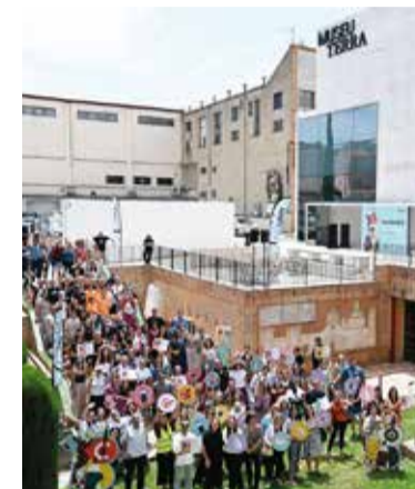
Guanyadors dels Baldiri Reixac.

L'escola Les Vinyes, de Sant Cugat Sesgarrigues, ha estat una de les guardonades en la darrera edició dels premis Baldiri Reixac, que atorga la Fundació Carulla per reconèixer projectes educatius vinculats a l'art, la cultura i la llengua catalanes. El centre ha rebut el premi en la categoria Experiències pel projecte "Mans petites que fan història", desenvolupat per l'alumnat d'educació infantil dins la proposta educativa "D'on venim? Cap on anem?".