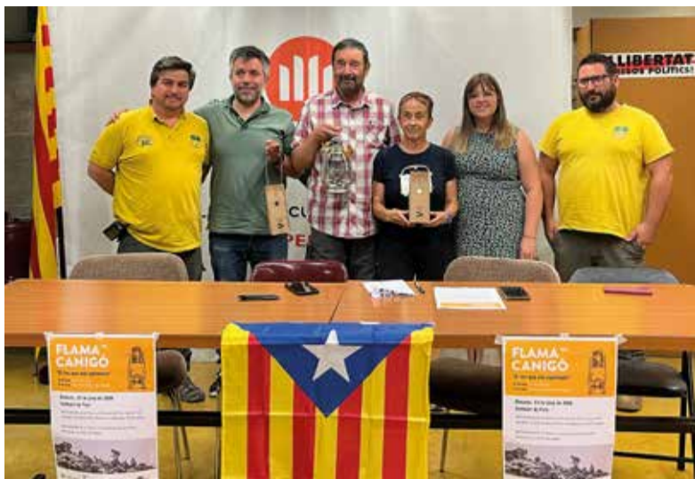
Òmnium Cultural és la impulsora de la iniciativa de la Flama. ✳ LA FURA