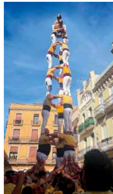
Els vilanovins descarreguen el 3 de 8 i el 4 de 8 a les Cols. ✖ BORDEGASSOS