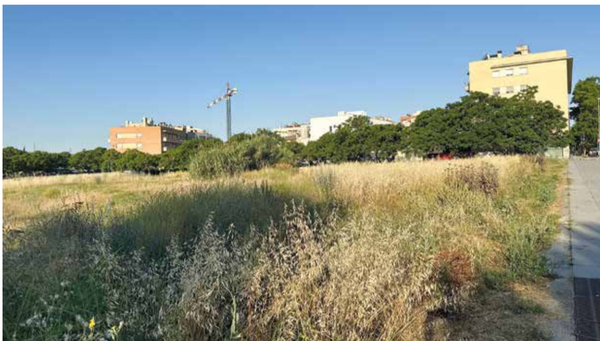
Al solar del carrer Dolors Piera es construiran 74 pisos. ✱ AJUNTAMENT

El Ple aprova la cessió de dos solars als carrers Gelida i Dolors Piera perquè una promotora social construeixi 110 habitatges que estarien acabats a finals de 2028