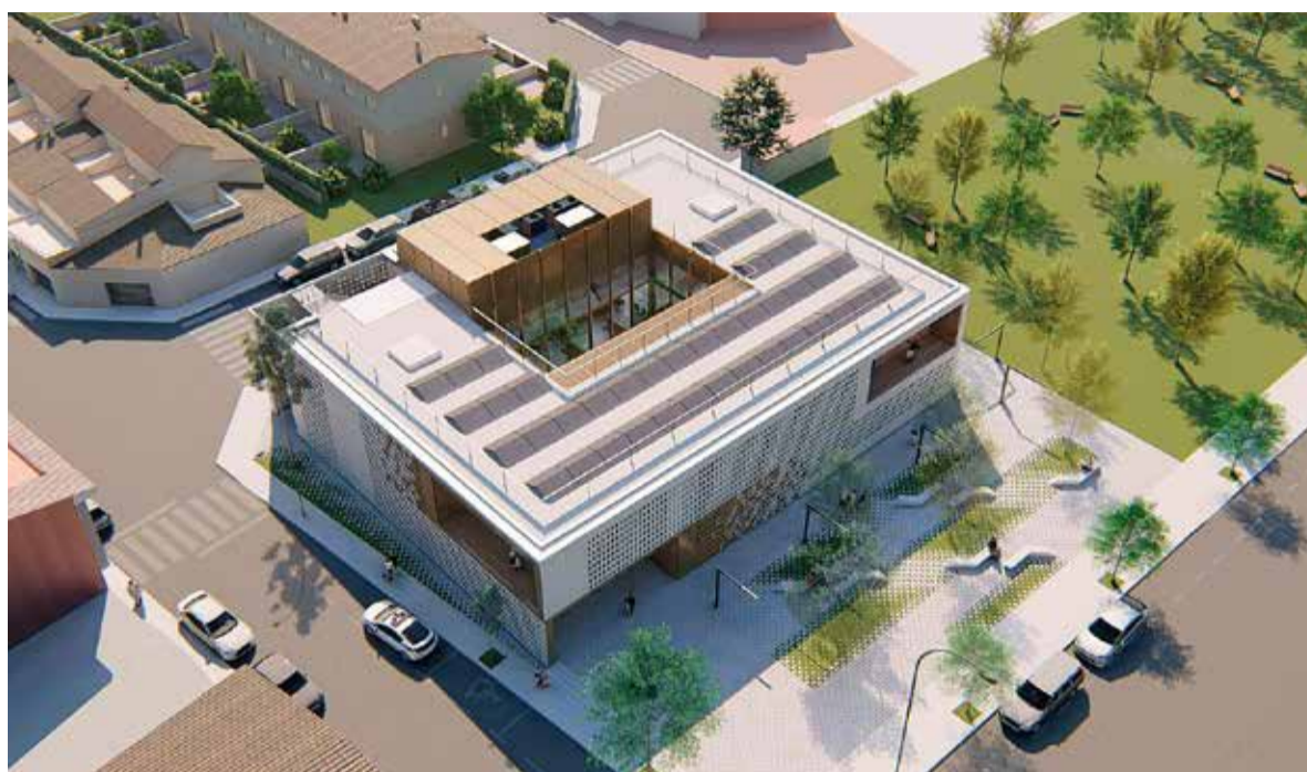
Projecció del nou CAP, que substituirà l'actual edifici. ✖ DEPARTAMENT DE SALUT