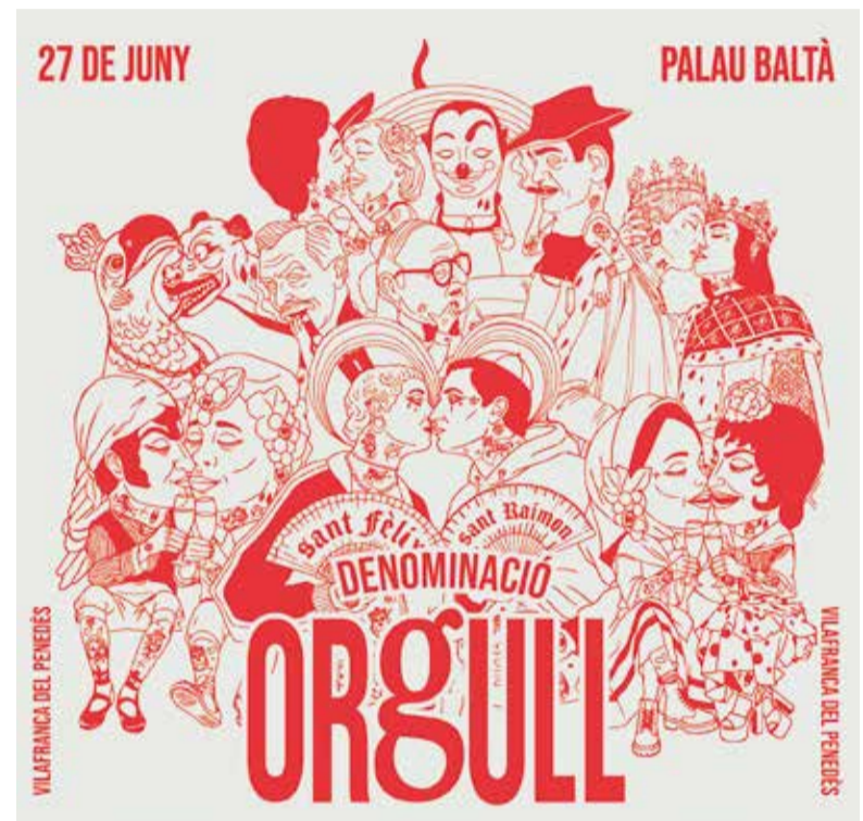
El cartell de la Denominació Orgull és obra de Javi Gutiérrez. ✳ JAVI GUTIÉRREZ

Denominació d'Orgull neix amb la voluntat d'esdevenir una proposta cultural i comunitària amb vocació de continuïtat i oberta a tothom. La jornada començarà a les cinc de la tarda amb el Mini Orgull, un espai per al públic familiar amb jocs i tallers. Al vespre hi haurà una jam session i micro obert amb artistes del territori i a la nit un cabaret drag. El dia de l'Orgull s'acabarà amb una