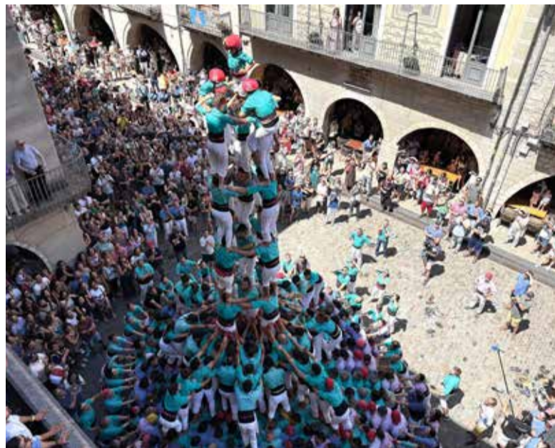
Segon 4 de 9 amb folre i agulla dels Castellers de Vilafranca.

Els verds igualen la millor actuació de la temporada, amb el 4d9fa i el pd8fm com castells més destacats