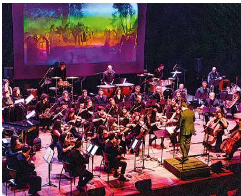
El concert tindrà lloc el 17 de juliol. ✱ PINNAE