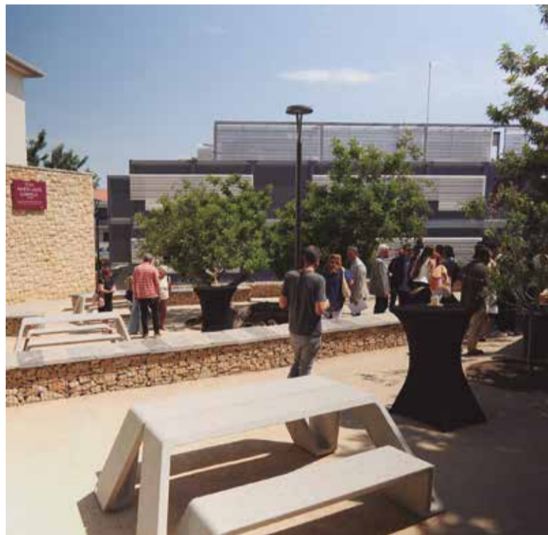
La plaça que ha estat batejada amb el nom de Marta Mata.