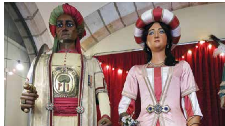
Els Gegants del Pi celebren enguany també 425 anys.

Dissabte vinent, 27 de juny, es commemoraran els 425 anys de la canonització de Sant Raimon de Penyafort. La diada, que transcorrerà entre el Castell de Penyafort de Santa Margarida i els Monjos —que és on va néixer el copatró de Vilafranca— i Vilafranca, tindrà un caràcter festiu i comptarà amb uns convidats d'alçada: els Gegants del Pi de Barcelona, que també celebren 425 anys.