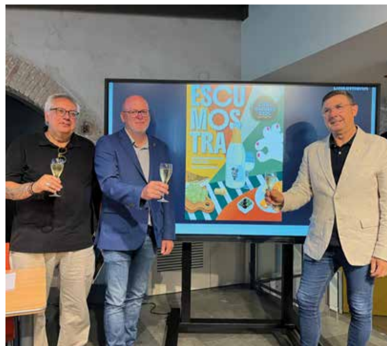
L'Escumostr se celebrarà el primer cap de setmana d'octubre.