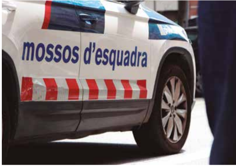
Imatge d'arxiu d'un cotxe dels Mossos d'Esquadra.

Les últimes dades de criminalitat del Ministeri de l'Interior pels municipis de més de 20.000 habitants apunten una estabilització dels fets delictius tant al Vendrell com a Calafell. Les dades del primer trimestre del 2026, en comparació amb les del mateix període del 2025, mostren poques variacions. Així, el Vendrell ha registrat enguany 277 delictes en aquests tres mesos, per 279 l'any passat (un descens de l'1,8%). Per la seva banda, Calafell n'ha registrat 247, sis més que els 241 de l'any passat (un augment del 2,5%).