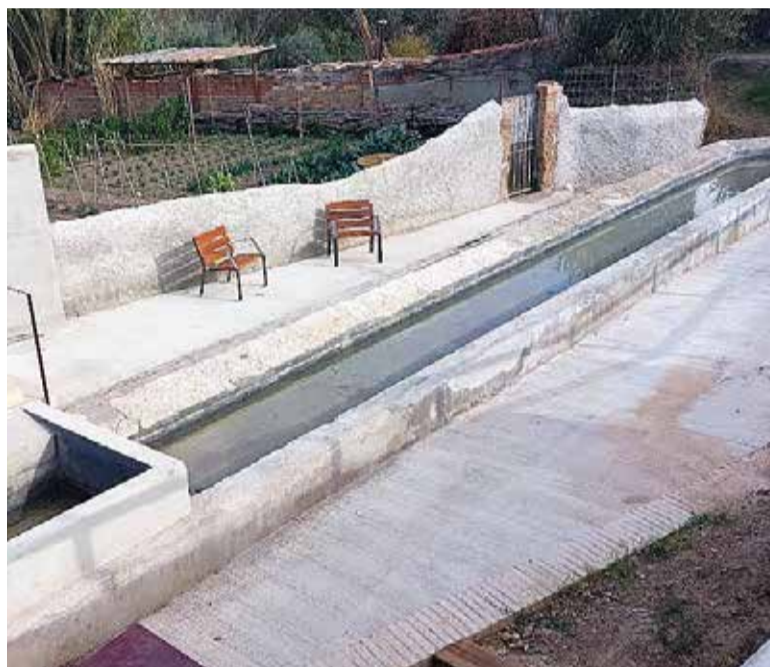
Safareig del Pla del Penedès.