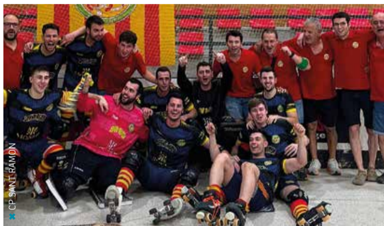
CP SANT RAMON