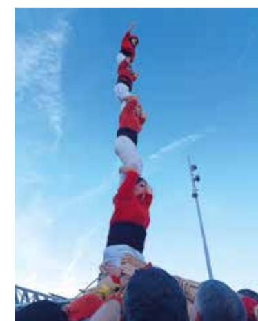
Pilar de 5 format per dones.

Diada de transició dels Xicots de Vilafranca a Barcelona, que ha tingut el pilar de cinc com a estructura més destacada. Això s'explica perquè els vilafranquins han alçat un pilar format íntegrament per dones. Els de la camisa vermella també han aprofitat l'aniversari dels Esquerdats per descarregar els dos castells bàsics de 7 i el 5 de 7.