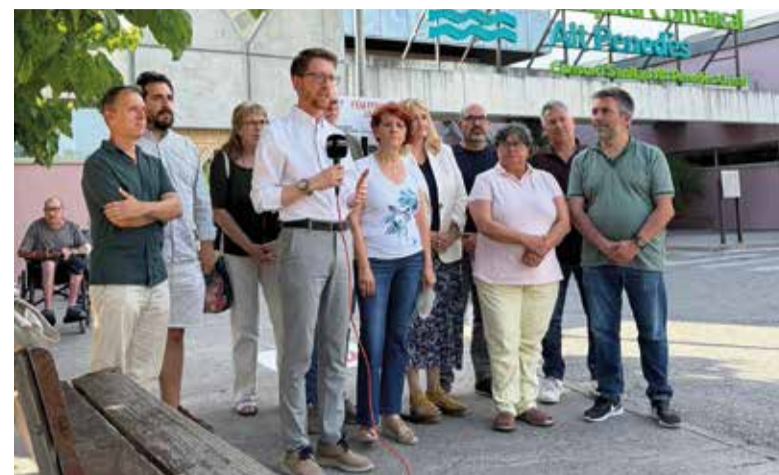
Diferents càrrecs electes d'ERC a la comarca davant de l'HCAP.