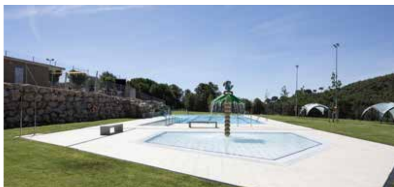
La piscina estarà oberta fins al 30 d'agost. ✳ AJUNTAMENT

La nova piscina d'estiu és d'aigua salada i incorpora un jacuzzi i salts