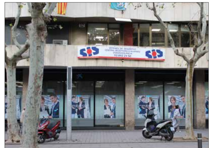
Les oficines de SIS estan al carrer Sant Joan, 14 de Vilafranca.

En aquest quart de segle els sistemes de seguretat han evolucionat notablement, passant de les primeres alarmes connectades a una línia telefònica, fins als sistemes actuals,