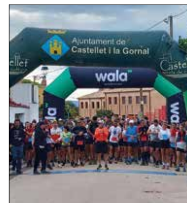
Sortida de la cursa.