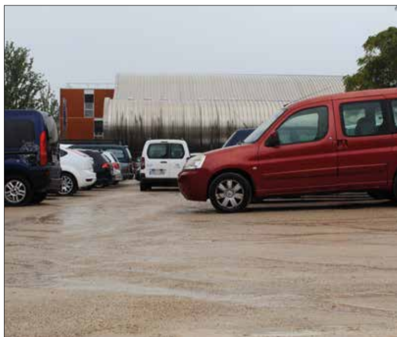
L'aparcament de l'Arxiu Històric.

Coincidint amb l'inici al barri de la Girada de la segona ronda de l'Alcaldia de Proximitat, que portarà l'equip de govern a fer estades a cada barri de Vilafranca, l'alcalde de la vila ha anunciat que l'Ajuntament ha encarregat a un equip tècnic especialitzat la redacció d'un projecte per començar a adequar definitivament els aparcaments de terra de l'avinguda d'Europa, entre l'Arxiu Històric i la Llar d'infants El Parquet.