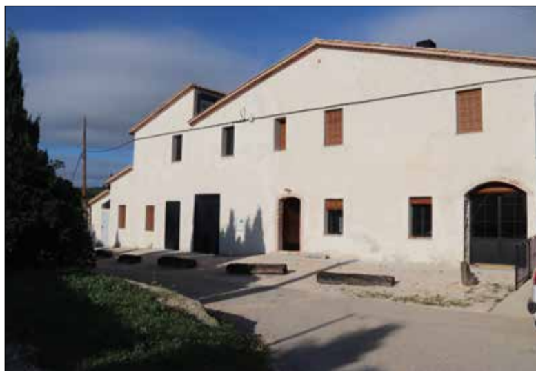
La masia on s'ubica la residència artística Espai de Marge.

La masia està oberta a ballarins, creadors plàstics, escriptors i artesans d'oficis tradicionals "que prioritzen l'ús de materials naturals