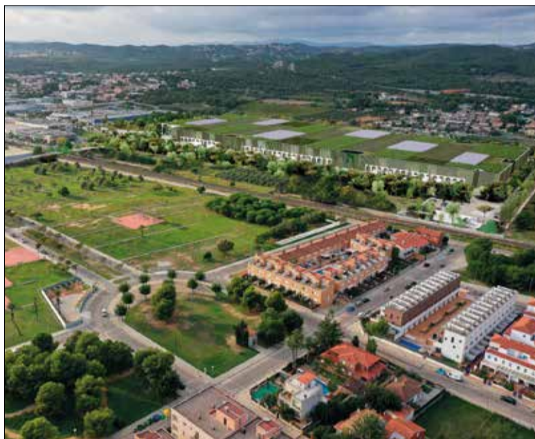
Render del parc logístic als terrenys de l'antiga tèrmica. ✦ AJUNTAMENT

A través d'un comunicat, la plataforma exigeix al govern local que anul·li l'aprovació dels projectes perquè s'està incomplint la legalitat vigent, consideren, en no fer-se l'avaluació ambiental estratègica. Alhora, alerten del "fort impacte en la connectivitat ecològica", afectant espècies protegides com el mussol o l'òliba, i arbredes centenàries com els oms de Mas Mortes o les alzines de Mas Guineu. Per tot plegat, la plataforma ecologista ha demanat a l'Ajuntament de Cubelles que declari els arbres centenaris i els marges de pedra seca com a béns d'interès local, una mesura que obligaria els promotors a revisar els projectes.