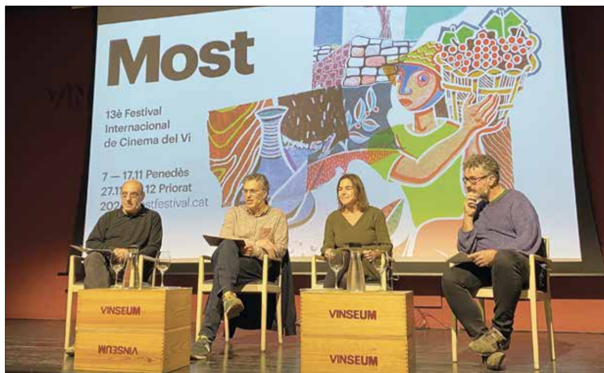
Serà del 7 al 17 de novembre i coincidirà amb la inauguració del nou Vinseum. ✳ LA FURA