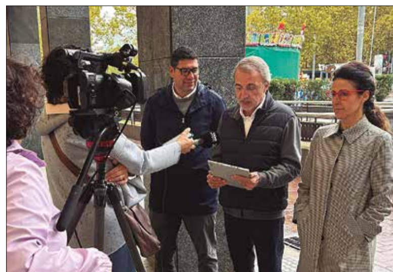
Amb les propostes el grup municipal vol potenciar el comerç local.