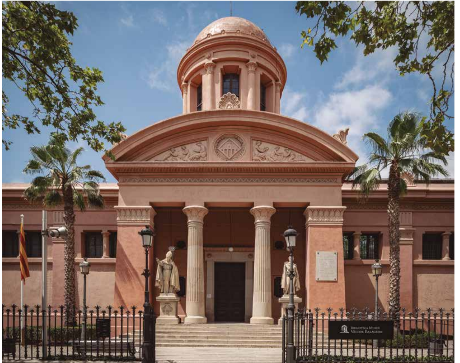
✦ JUAN FRANCO-STUDIO