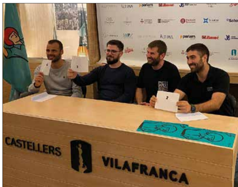
Sorteig de l'ordre d'actuació de la diada de Tots Sants. ✖ CASTELLERS

Els Castellers de Vilafranca obriran la diada de Tots Sants, en què actuaran acompanyats pels Castellers de Sants, els Capgrossos de Mataró i els Xiquets de Tarragona. Els de Sants a Tots Sants amb l'objectiu de completar el 4 de 9 i poder llençar també la torre de 8 amb folre, el 7 de 8 o el 3 de 8. Per la seva banda, els Capgrossos de Mataró porten en cartera el 3 de 9, la torre de 9, el 5 de 9 i el 4 de 9, mentre que els Xiquets de Tarragona reconeixen estar vivint un final de temporada "estrany" en el qual la feina dels assaigs no es veu a plaça i per la qual cosa han d'acabar d'elaborar el programa.