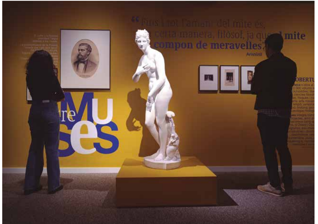
AJUNTAMENT DE VILANOVA