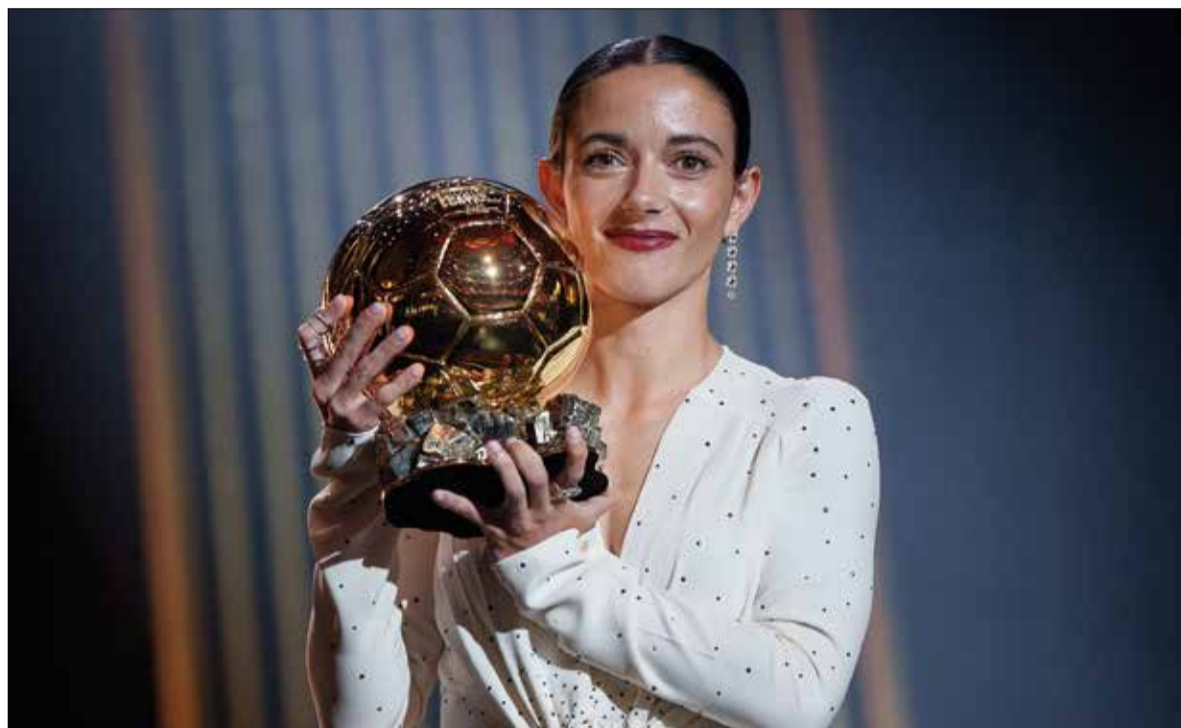
Aitana Bonmatí, amb la Pilota d'Or.

La futbolista de Sant Pere de Ribes s'endú per segon any consecutiu el prestigiós guardó que atorga France Football