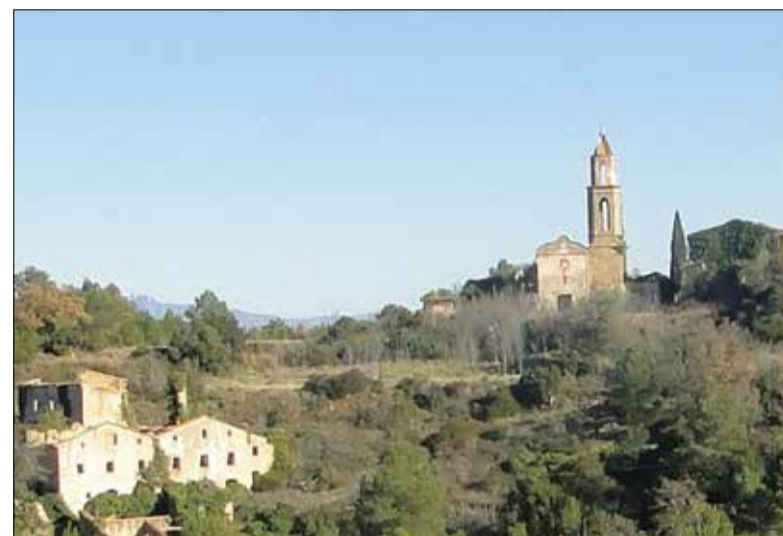
Vista del poble abandonat de Marmellar.

"Terraplèna" ha comptat amb la participació d'una trentena d'antics veïns del poble que han ajudat a fer un inventari amb 1.500 paraules