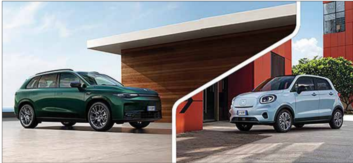
Els models SUV C10 i T03, de la marca xinesa Leapmotor. * JOUNOU

Grup Jounou és el nou distribuïdor oficial de Leapmotor al Penedès. La marca, fabricada a la Xina pel grup Stellantis, està revolucionant el món de la mobilitat oferint vehicles elèctrics i tecnològicament avançats a uns preus molt accessibles.