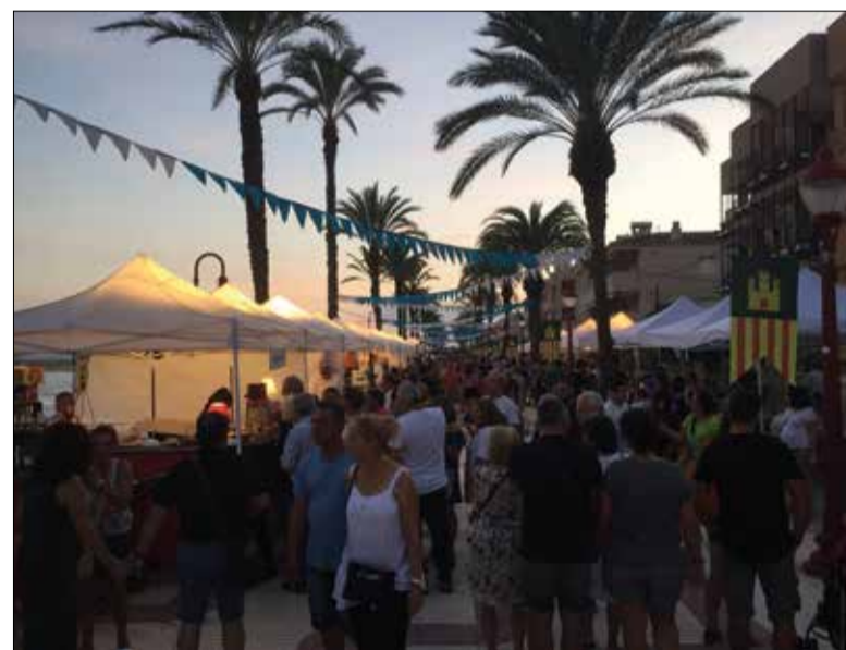
Imatge d'arxiu del Cubermut.

Un web per no perdre's res Una altra de les novetats d'aquesta edició és que la fira estrena pàgina web. L'objectiu és recollir tota la informació relacionada amb el Cubermut perquè el visitant pugui consultar els vermuts i marques presents a la fira i, fins i tot, reservar les activitats programades.