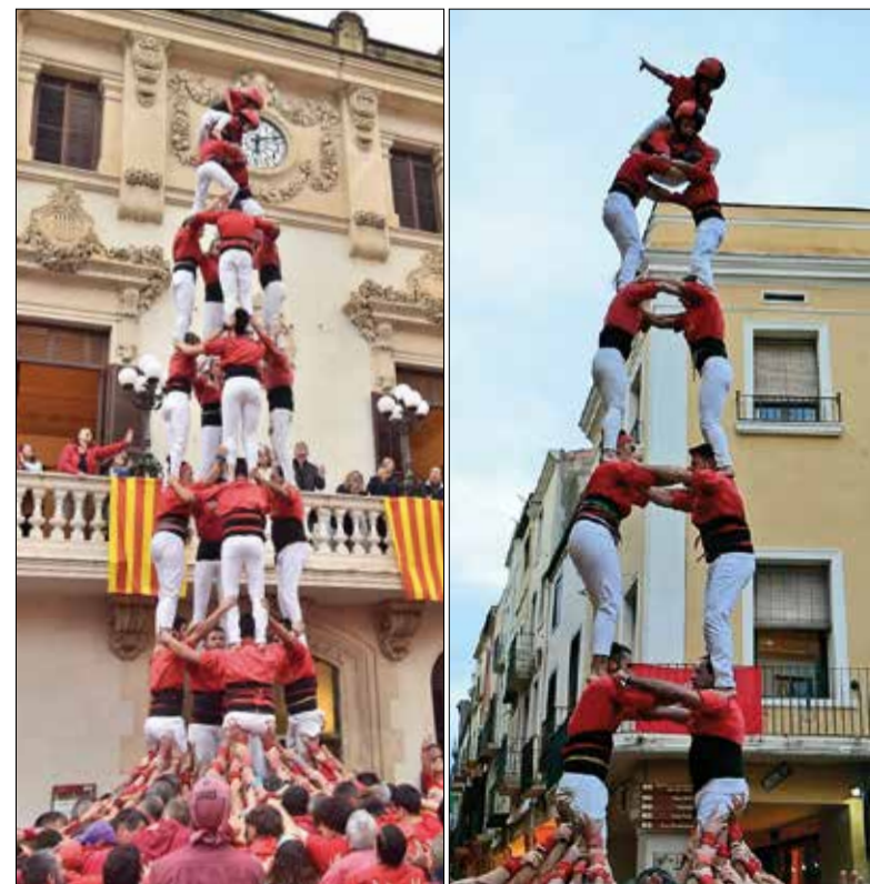
4 de 8 i torre de 7 dels Xicots. ✖ XICOTS DE VILAFRANCA

Els vilafranquins fan una valoració molt positiva de la temporada, tant pels castells aconseguits, com per la recuperació progressiva després de la crisi de la covid-19. Una recuperació que, tal com apunten, "obre noves portes de cara al futur i reforça la il·lusió per les properes temporades".