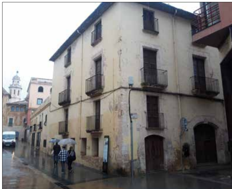
Al Vendrell hi ha 138 elements precatalogats. ✱ LA FURA

Al pressupost del 2025 s'inclou una partida de 135.000 euros per licitar aquests treballs, que es dividiran en quatre lots. Un d'ells serà per fer un catàleg de masies i cases rurals, unes construccions que, en estar la majoria en sòl no urbanitzable, necessiten un pla especial. Un segon lot servirà per fer una proposta de conservació de l'arquitectura moderna de la ciutat, mentre que el tercer lot definirà els elements a conservar de la colònia ferroviària de Sant Vicenç de Calders. Finalment, el quart lot consistirà en la redacció de l'inventari de béns i la mateixa elaboració del catàleg.